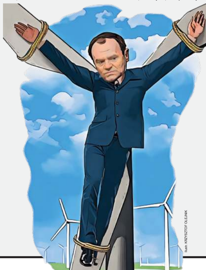
ilustr. KRYSZTOF OLEJNIK

Według profesjonalistów o wiele sensowniejsze wydaje się elastyczne