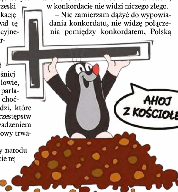
Ilustr. KRZYSZTOF OLEJNIK

– Nie zamierzam dążyć do wypowiedzenia konkordatu, nie widzę połączenia pomiędzy konkordatem, Polską