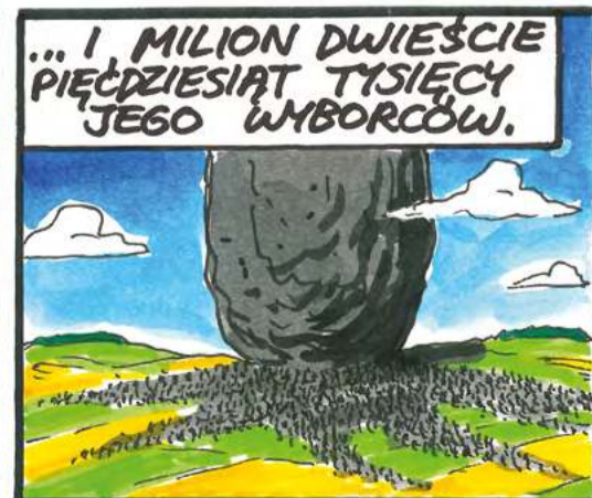
Rys. RYSZARD DĄBROWSKI