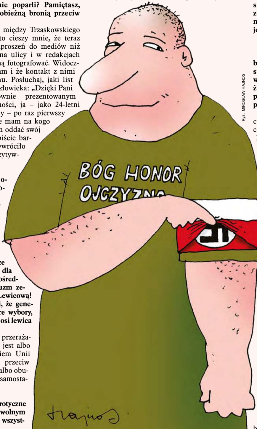
Rys. MIROSLAW HAJNOS

– Akurat w sprawie Brauna ja mam mieszane uczucia. Prawda, jest świrem, do tego dość nieestetycznym, ale jest też potrzebnym w-