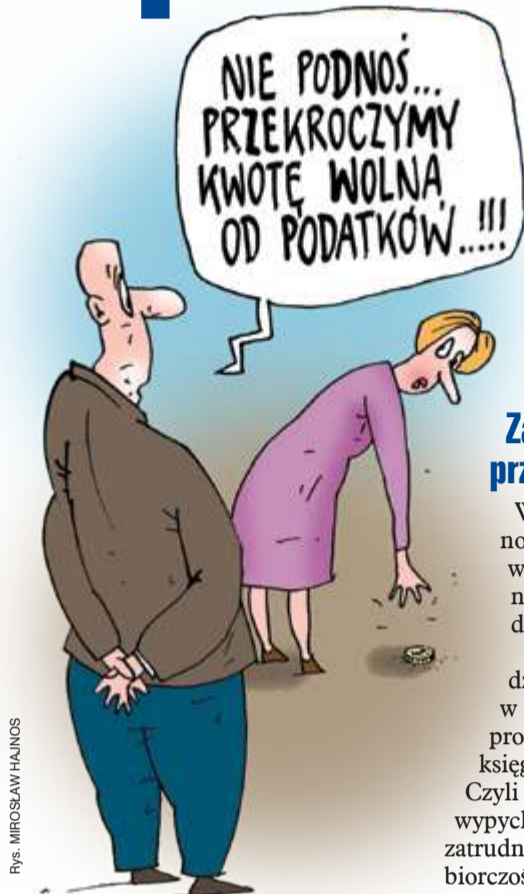
rys. MIROSŁAW HAJNOS

Na stronie ZUS czytamy dziś: „Od marca 2025 najniższa gwarantowana emerytura wynosi 1878,91 zł brutto”.