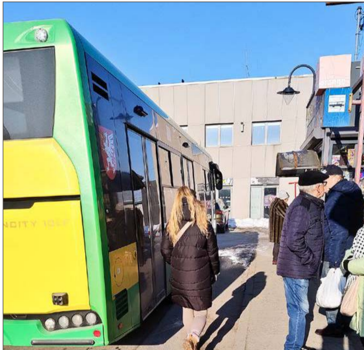
Chętnych do korzystania z komunikacji miejskiej mimo podwyżek nie brakuje.

– Do szkoły zazwyczaj ja go dowoziłam jadąc do pracy, ale do domu musiał wracać autobusem. Wykupywał bilet miesięczny i mu się to opłacało. A teraz, jak policzyli z kolegami ile ich to będzie kosztować, to zdecydowali, że wolą zatankować samochód i jeździć razem – przekonuje.