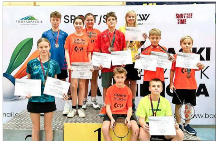
W Mistrzostwach Podkarpacia zawodnicy Orbitka zdobyli 13 medali.

Tych sukcesów nie byłoby, gdyby nie pomoc szkoleniowa, na jaką za-