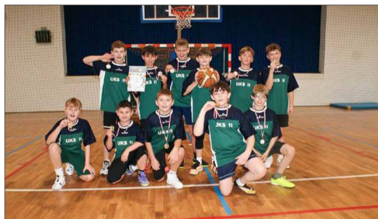
Złoto zdobyte przez koszykarzy SP 11 pozwoliło awansować tej szkole na drugie miejsce w klasyfikacji medalowej.