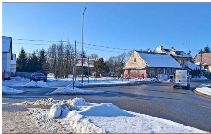
Według planów południowa obwodnica miasta byłaby przedłużeniem ul. Nosala, a jej wylot znajdowałby się za szpitalem.

– Ale u nas niestety od wielu już lat nie buduje się nowych drog.