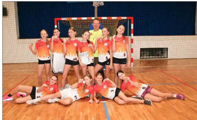
W gronie dziewcząt najlepsze jak przed rokiem były reprezentantki SP 5.