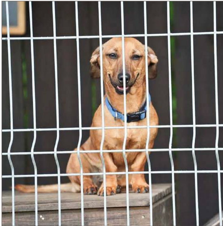
W schronisku w Dębicy przebywają psy, ale są też nowe woliery dla kotów.

On także przyznaje, że kwestia miejsca, gdzie mogłoby powstać schronisko jest kluczowa. Najlepszym wydaje się gmina Dębica, ale mało prawdopodobne, że uda się znaleźć odpowiedni teren. Wystarczy przypomnieć sobie, jak długo Fundacja Psi Azylek, która obecnie zarządza schroniskiem w Podgrodziu, szukała miejsca, gdzie psy nie przeszkadzałyby mieszkańcom. Nawet, wydawałoby się, idealne lokalizacje, budziły społeczny sprzeciw. Ludzie obawiali się niedogodności w postaci hałasu czy nieprzyjemnych zapachów.