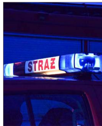
Strażacy regularnie interweniują w związku z czadem.

W sobotę 17 stycznia służby ratownicze wezwane zostały na ulicę Łysogórską. W łazience uruchomiła się domowa czujka. Pomiar wykazał obecność tlenku węgla po włączeniu piecyka gazowego. Strażacy odcięli dopływ gazu i nakazali usunąć awarię.