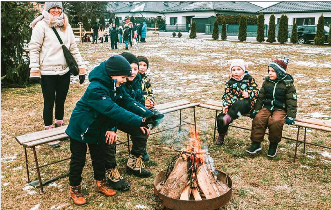
Dla najmłodszych atrakcją były zimowe ogniska i pieczenie kielbasek.