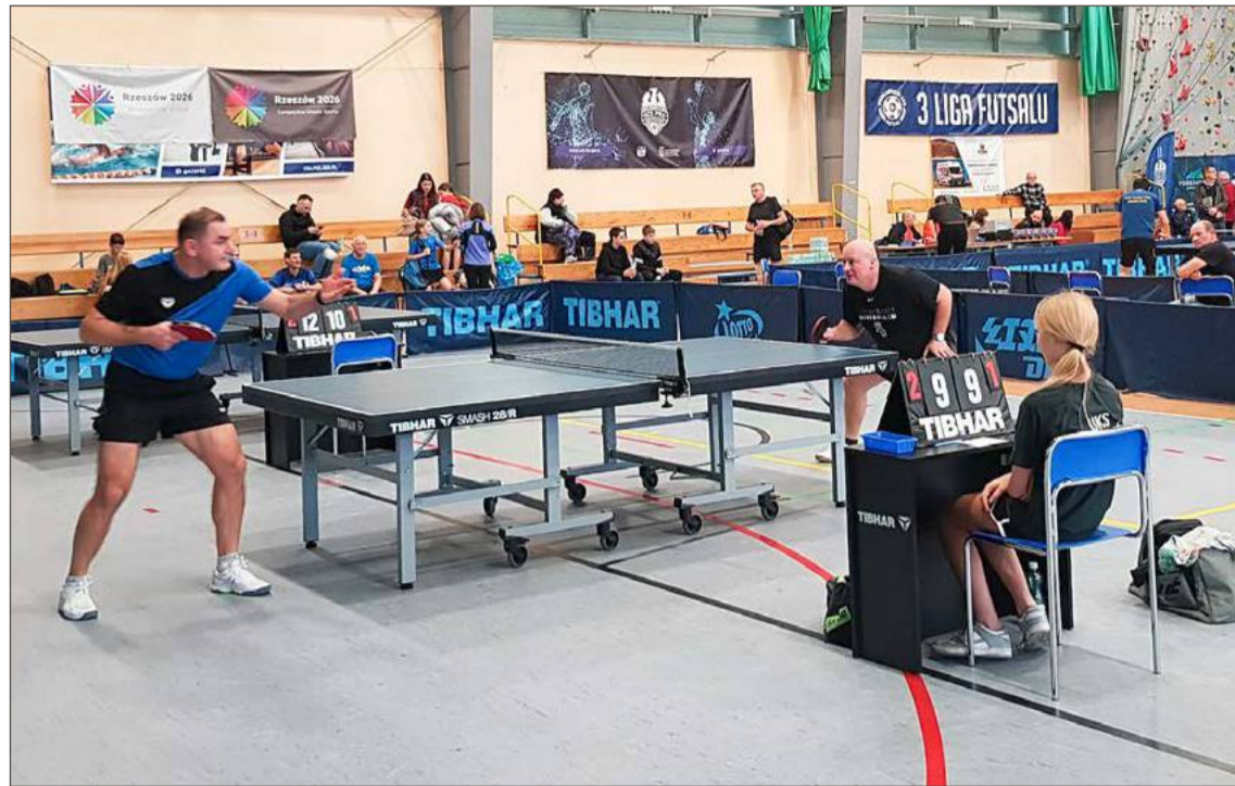
Występująca w IV lidze Brzostowianka po dziewięciu kolejkach zajmuje czwarte miejsce w tabeli.

Brzostowianka: Kolec (4), Prokuski (3,5), Michoń (2,5), Dziedzic