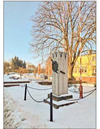
Na Placu Kazimierza Wielkiego ma być jeszcze więcej zieleni.

Nadal nie wiadomo, co z parkiem kieszonkowym u zbiegu ulic Rzeszowskiej i Kościuski. Jego po-