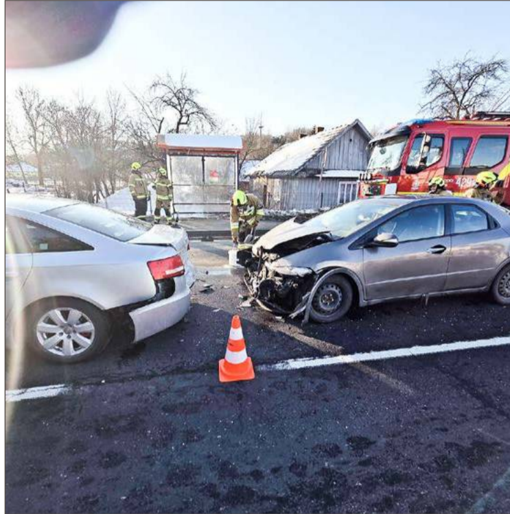
Honda z impetem wjechała w tył Audi.

Tuż po zdarzeniu droga była całkowicie zablokowana, chwilę później wprowadzony został ruch wahadłowy. Mundurowi bardzo szybko ustalili przebieg wypadku. Kierujący Audi 54-letni mieszkaniec Miejsca Piastowego jechał od Jasła w kierunku Pilzna. Na granicy Jaworza Górnego i Bielów chciał skręcić w lewo, w kierunku Jodłowej. Mężczyzna zatrzymał swój pojazd i czekał na możliwość wykonania manewru, gdyż z przeciwnego kierunku jechały samochody.