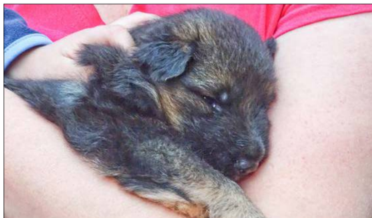
Zapomnij! Nie schodzę!