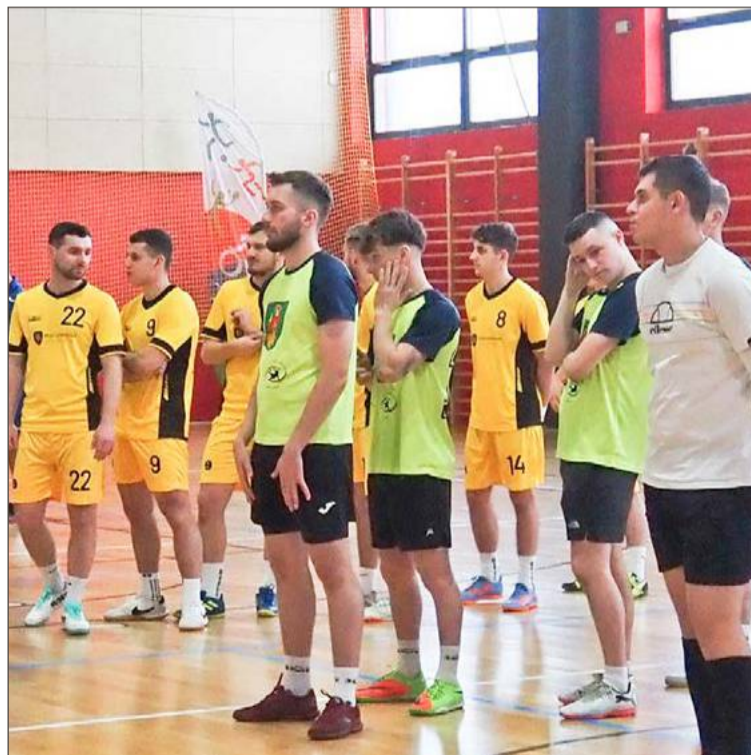
Kolejny turniej w futsalu w Brzostku w przyszłym roku.

W meczu o trzecie miejsce spotkały się zespoły Zalasowa Team i Hos-Pol. Druga z wymienionych drużyn co prawda prowadziła już 2:0, ale ostatecznie ulegli rywalom przegrywając spotkanie 2:3.