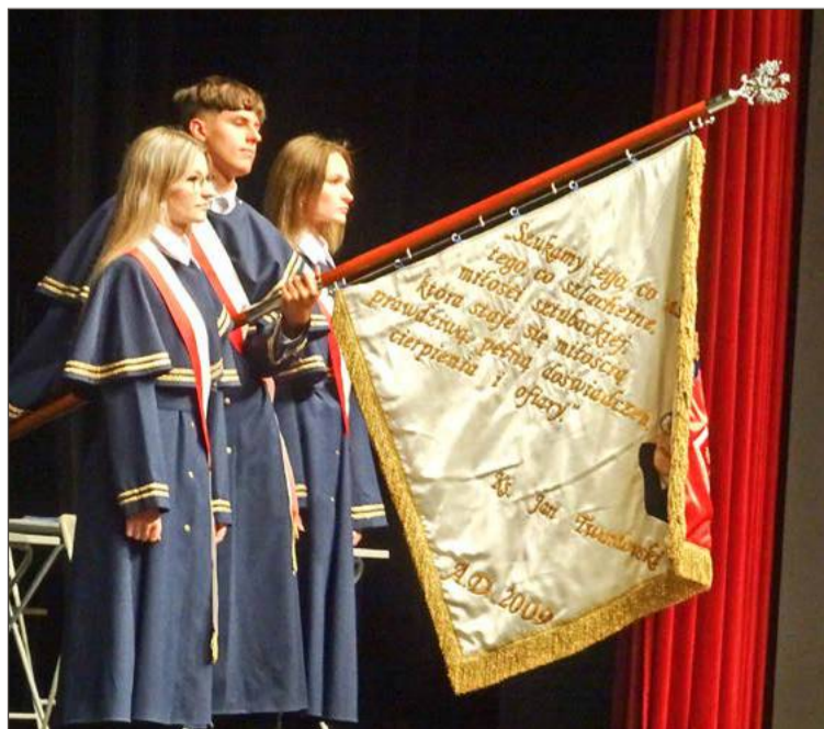
II LO w Dębicy znów może używać złotej tarczy.