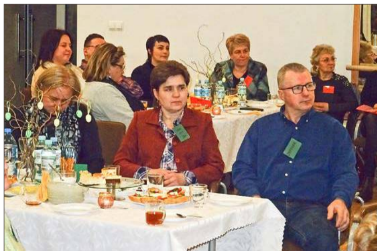
Dotychczasowi uczestnicy z udziału w kursie są bardzo zadowoleni.

Ważne jest to, że uczestnicy poprzednich edycji w ankietach podsumowujących kurs zgodnie stwierdzali, że to było bardzo dobre doświadczenie. Pogłębili dzięki niemu swoją wiarę, nawiązali żywą relację z Panem Bogiem, ale również przyjaźnie z innymi ludźmi.