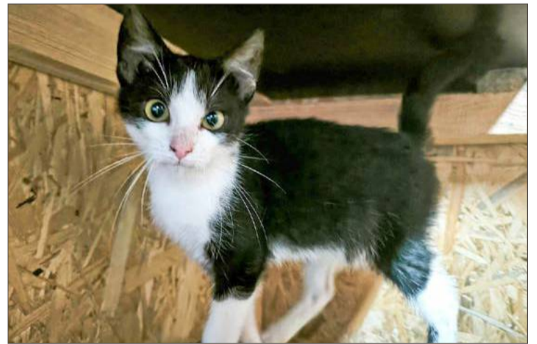
Koty po zabiegu dochodzą do siebie w schronisku.

Jak informuje Lidia Pater z Wydziału Ochrony Środowiska dę-