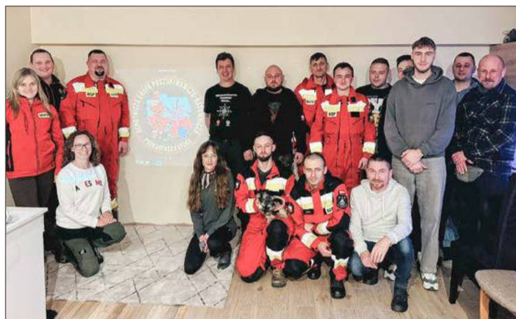
OGPR Podkarpacka Sfora otrzymała już zaproszenie do Związku Cywilnych Grup Poszukiwawczo-Ratowniczych RP.

W końcu przyszedł czas na poważne zmiany. W czwartek 15 stycznia w Zawadce Brzosteckiej odbyło się spotkanie, w trakcie