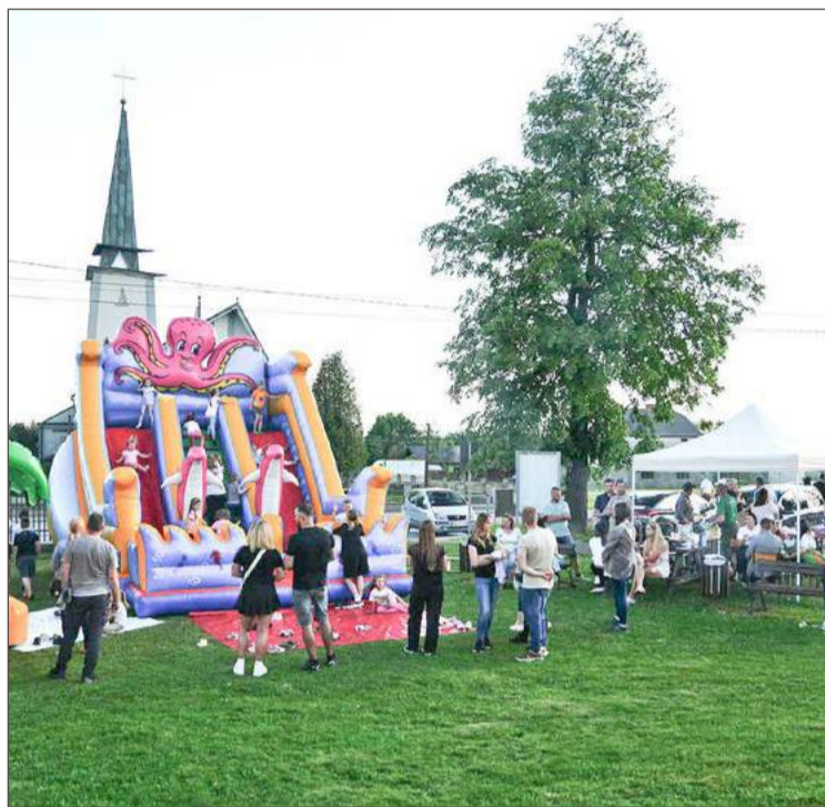
W tym roku Stowarzyszenie Głobikowa też planuje zorganizowanie pikniku na Dzień Dziecka.

Pieniądze, które podatnicy przekazują OSP w Brzostku, zostaną przeznaczone na działalność statutową. Kupią sprzęt ratowniczy,