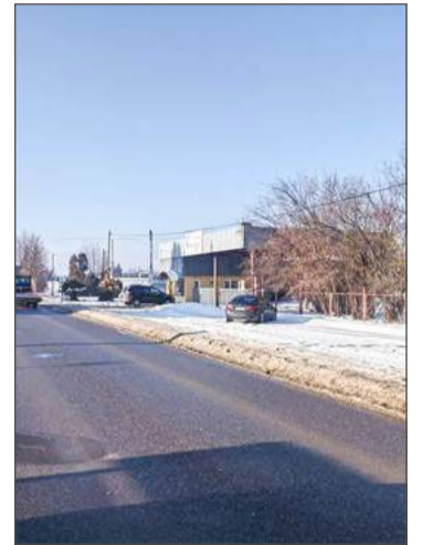
Droga Chotowa-Grabiny nie jest zniszczona, ale wymaga prac.

Na to zadanie powiat planuje przeznaczyć ok. 11 mln zł. Oczy-