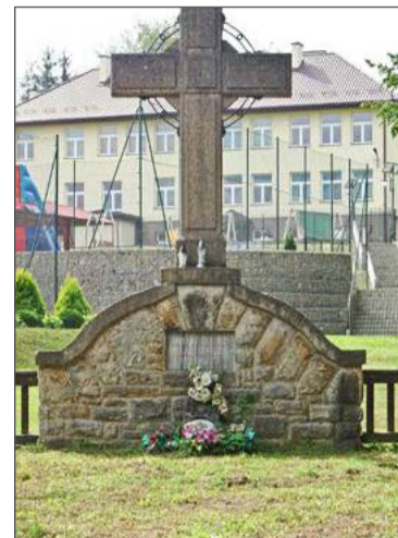
Cmentarz w Dęborzynie może doczekać się remontu.

- Ta sprawa leży mi bardzo na sercu. Chcemy w ten sposób ocalić te ważne miejsca dla przyszłych pokoleń, jak również przywrócić godność pochowanych tam żołnierzy - mówi wójt.