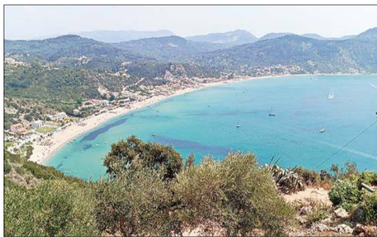
Warto było piąć się w górę.