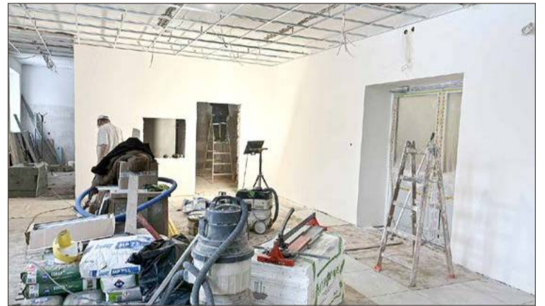
Jak zapewni wiceburmistrz jest zupełnie odwrotnie. Miasto inwestuje w stołówki, tak jak w SP nr 4 (na zdjęciu).

- A dwie kolejne, albo jedna została w SP nr 4, bo potrzebna jest