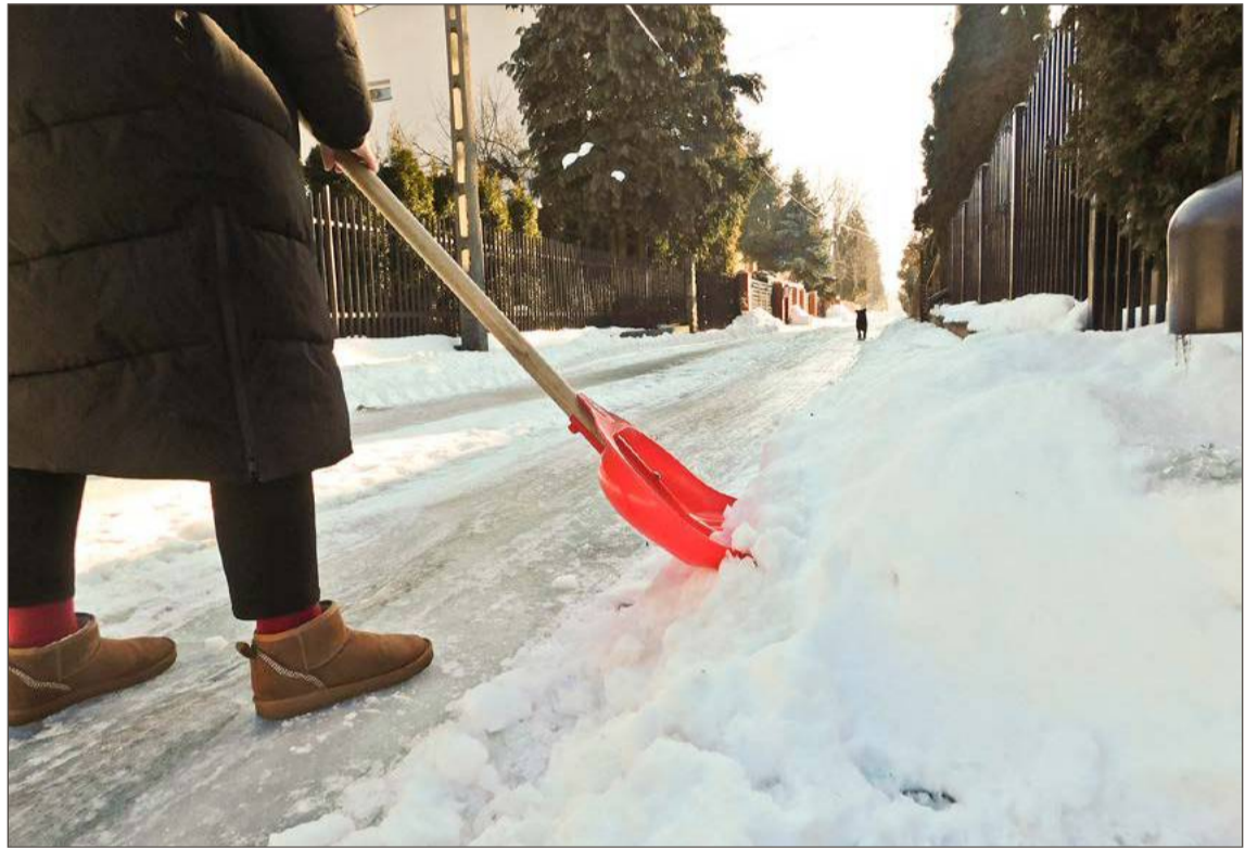
Odśnieżanie chodnika przy posesji to, według przepisów, obowiązek jej właściciela.

Na problemy z odśnieżaniem w internecie zwracają też uwagę mieszkańcy. Co ciekawe, w więk-