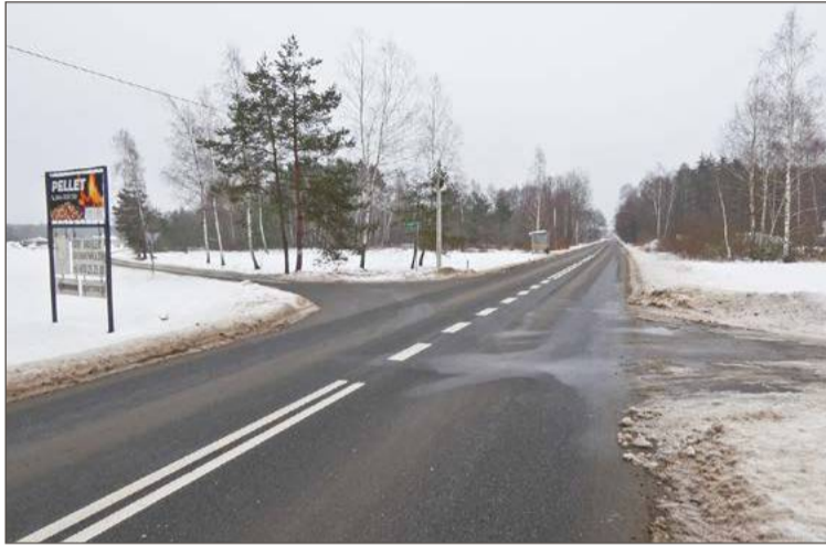
Do potrącenia dzika doszło na drodze powiatowej w Kochanówce.