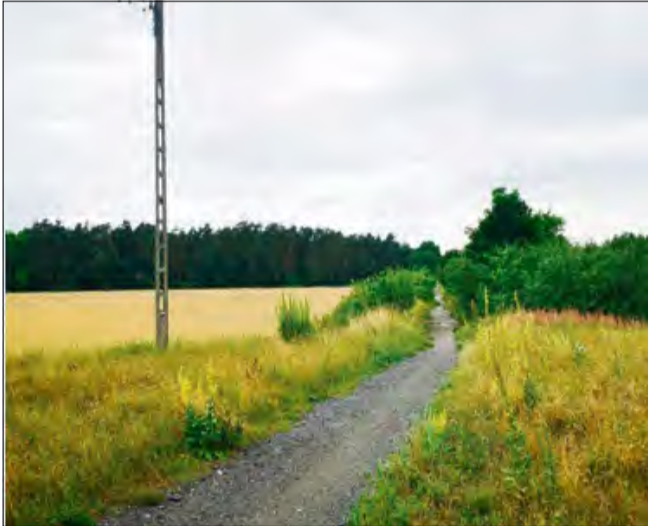
Widok od strony Gogolina. W tym miejscu miała być kontynuowana budowa ścieżki rowerowej łączącej miasto Karolinki i Karlika z Krapkowicami.

Ścieżka rowerowa, której dotyczy temat, została wykonana po stronie Krapkowic w 2020 roku. Trasa prowadzi po byłym nasypie kolejowym od ul. Kolejowej, przez ul. Obuwników i al. Jana Pawła II, aż do wiaduktu pod autostradą A4. Inwestycja była realizowana przez gminę Krapkowice i stanowiła część