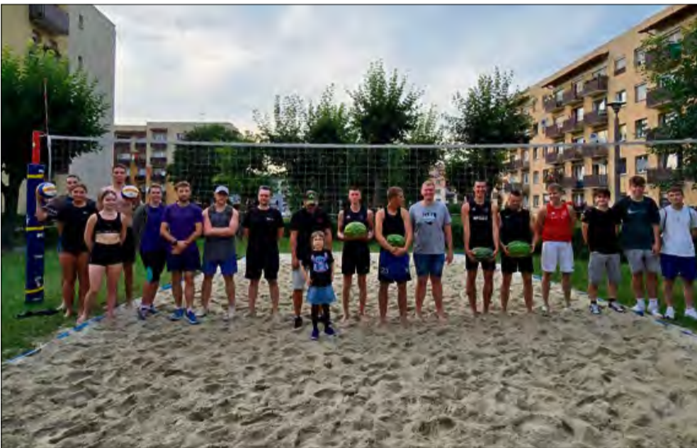
Arbuzowe trofea trafiły do rąk najlepszych zawodników turnieju siatkówki plażowej w Krapkowicach.

Letnie popołudnie, osiedlowe boisko i sportowa atmosfera pełna dobrej energii - tak wyglądał turniej siatkówki plażowej na Osiedlu XXX-lecia przy bloku nr 7. 25 lipca na piaszczystym boisku spotkały się cztery drużyny, by powalczyć nie tylko o zwycięstwo, ale i o niecodzienną nagrodę - arbuzy, ufundowane przez lokalny warzywniak z Otmętu.