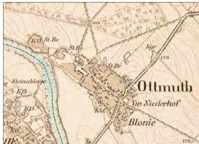
Otmęt na mapie sprzed 141 lat. To najmniejsza z miejscowości dzisiejszego powiatu krapkowickiego, która znalazła się w naszym zestawieniu.

kobiety. Wspólnota katolicka liczyła 639 dusz, ewangelicka – 103, a żydowska – 3. W Dąbrowie było 181 budowli, w tym 95 budynków mieszkalnych. Miejscowość zajmowała obszar liczący 1600 hektarów, w tym 574 hektary pól, 86 hektarów łąk i 843,3 hektara lasów.