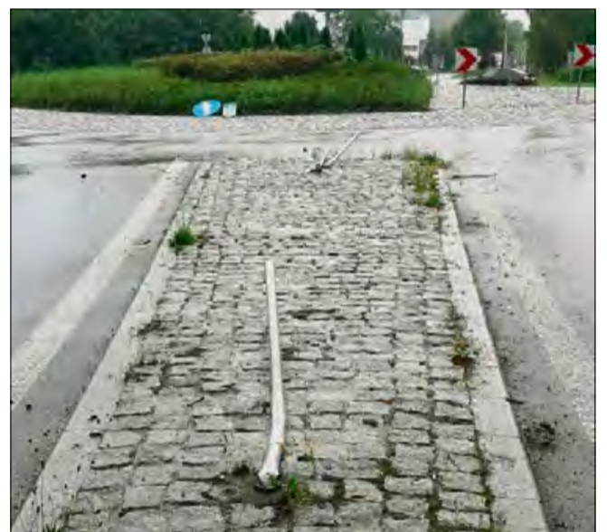
Uszkodzony został jeden znak oznajmiający oraz zielona tabliczka z nazwą miejscowości.