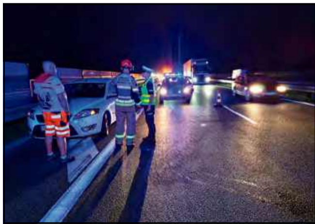
To była pracowita noc dla strażaków.

Zdarzenie miało miejsce na 254. kilometrze drogi na nitce w kierunku Katowic. Przyczyną zajścia był leżący na jezdni fragment opony, na który wpierw wjechał osobowy ford, a później samochód marki audi. Na