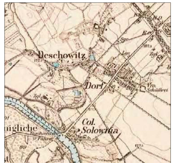
Zdieszowice wraz z Solownią otwierają drugą dziesiątkę naszego rankingu. Tutaj mapa z 1884 roku.

Otmęt to najniżej sklasyfikowana w naszym rankingu miejscowość z