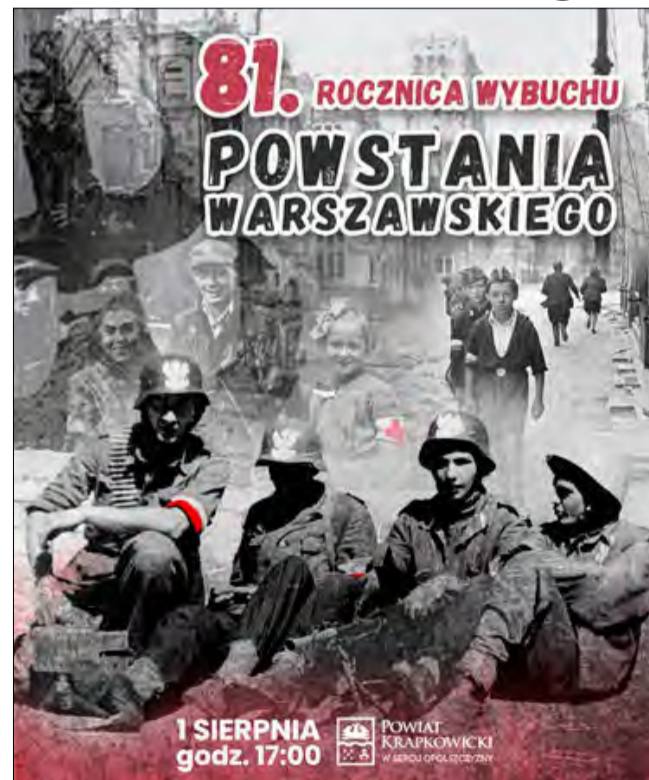
W powiecie krapkowickim syreny zawyją 1 sierpnia.

Symbolicznie nawiązując do godziny „W”, 1 sierpnia w powiecie krapkowickim o godzinie 17.00 nadany zostanie jednodominutowy,