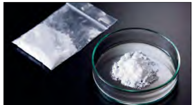
Lodówka pełna narkotyków. Zamiast żywności – amfetamina.

Kryminalni z Krapkowic i Ozimka wspólnymi siłami pracowali nad sprawą mieszkańca regionu, którego podejrzewali o związki z przestępczością narkotykową. Podczas pracy operacyjnej zbierali informacje i przeanalizowali zebrany materiał. Badania