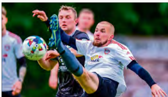
Piłkarze z Żywocia grają o ligowe punkty rozpoczynając domowymi derbami z ekipą Raclawiczek.

Po tygodniach oczekiwania kibice w końcu doczekali się podziału na grupy w klasie A. Wśród 84 drużyn, które przystąpią do rywalizacji w sezonie 2025/2026 cztery są z powiatu krapkowickiego.