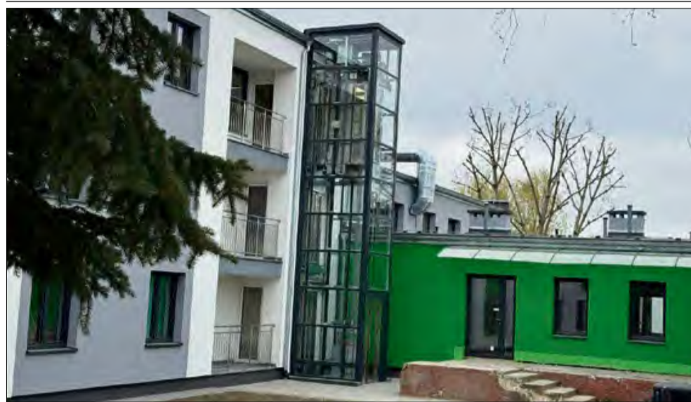
Otwarcie Środowiskowego Domu Samopomocy to kolejny krok w kierunku zwiększenia dostępności pomocy psychologicznej i społecznej w regionie.

W Zdieszowicach trwają przygotowania do utworzenia Środowiskowego Domu Samopomocy dla osób z zaburzeniami psychicznymi. Inwestycja jest możliwa dzięki dotacji celowej w wysokości 2 457 000 zł, przyznanej na rozwój infrastruktury wsparcia psychospołecznego.