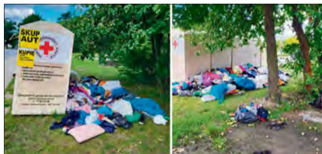
Wokół pojemników walają się porozrzucane ubrania.

Polski Czerwony Krzyż w specjalnym komunikacie zwrócił się z apelem do mieszkańców, by nie wrzucać do kontenerów śmieci ani innych odpadów, które nie są odzieżą lub tekstyliami nadającymi się do ponownego użytku. Organizacja przypomina, że pojemniki służą wyłącznie do zbiórki