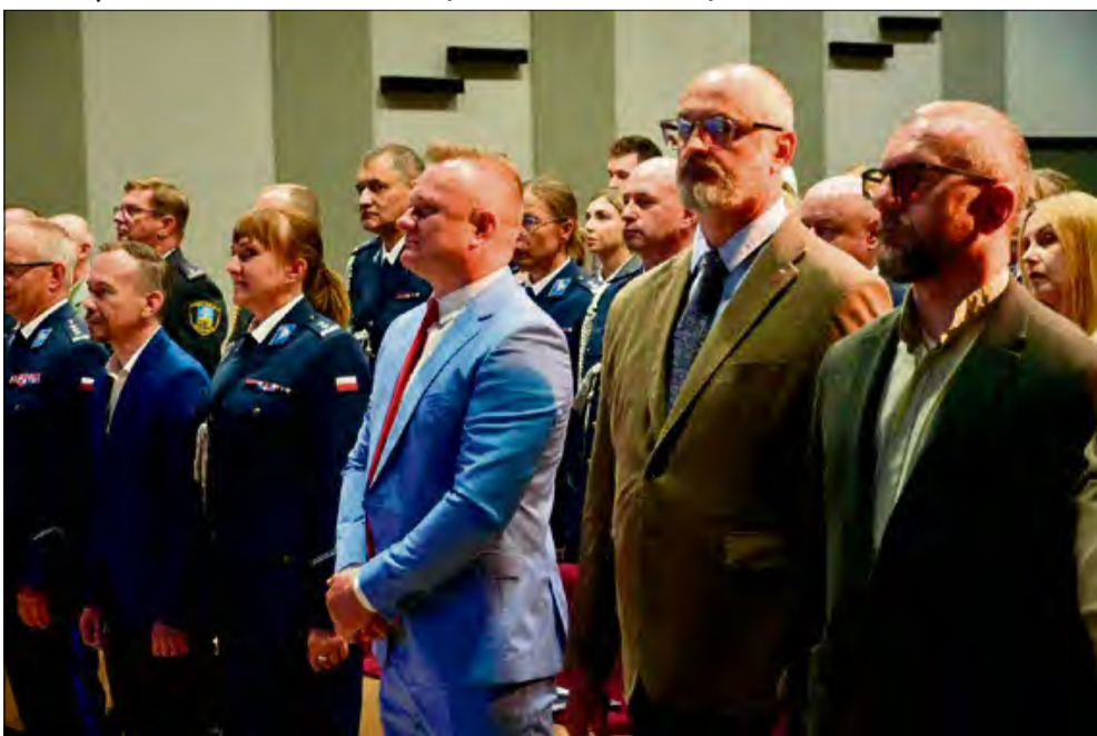
W obchodach uczestniczyło wielu samorządowców.