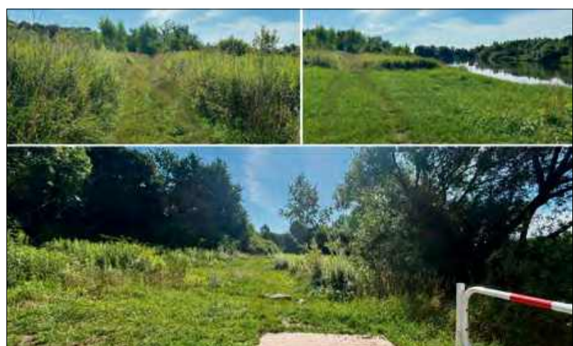
Obecnie przejście jest utrudnione przez bujną roślinność. Rowerzyści i spacerowicze skarżą się, że muszą wybierać dłuższą drogę, omijając zarośniętą trasę.

Słowa mieszkańca pokazują, że ten zaniedbany fragment wałów ma dla lokalnej społeczności także sentymentalne znaczenie. Obecnie przejście jest utrudnione przez bujną roślinność.