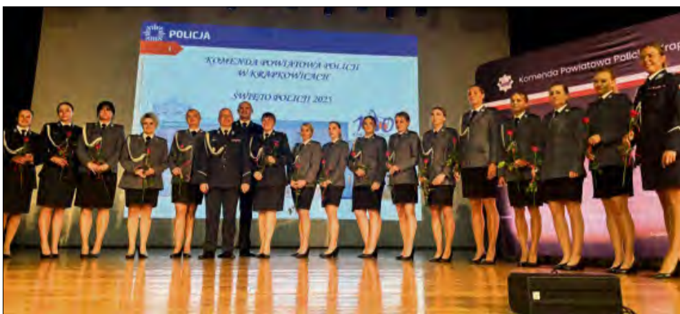
23 lipca w Krapkowickim Domu Kultury odbyły się uroczyste Powiatowe Obchody Święta Policji.

W środę 23 lipca w Krapkowickim Domu Kultury odbyły się uroczyste Powiatowe Obchody Święta Policji. To wyjątkowe wydarzenie było okazją do uhonorowania pracy funkcjonariuszy oraz podkreślenia ich codziennego zaangażowania w zapewnianie bezpieczeństwa mieszkańcom powiatu krapkowickiego.