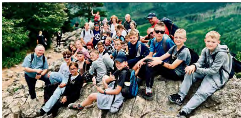
Razem – w modlitwie, w drodze, w radości.

Trzeciego dnia odwiedzono sanktuarium św. Antoniego z Padwy, prowadzone przez Ojców Bernardynów. Po adoracji i Eucharystii pielgrzymi przeszli pod Wielką Krokiew, a dalej Drogą pod Regłami