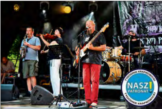
Dobra zabawa w rytmie rocka.

Są takie chwile w roku, kiedy muzyka staje się czymś więcej niż tylko dźwiękiem. Gdy gitary niosą emocje, bębny wyznaczają wspólny puls, a ludzie - mimo różnych historii, miejsc i języków - tworzą jedną społeczność. Właśnie taka atmosfera unosiła się nad Rozkochohem podczas Rock am Palast 2025. To nie tylko festiwal - to dowód na to, że dobre brzmienie ma siłę budowania mostów i zostaje w sercach na długo po wybrzmieniu ostatnich akordów.