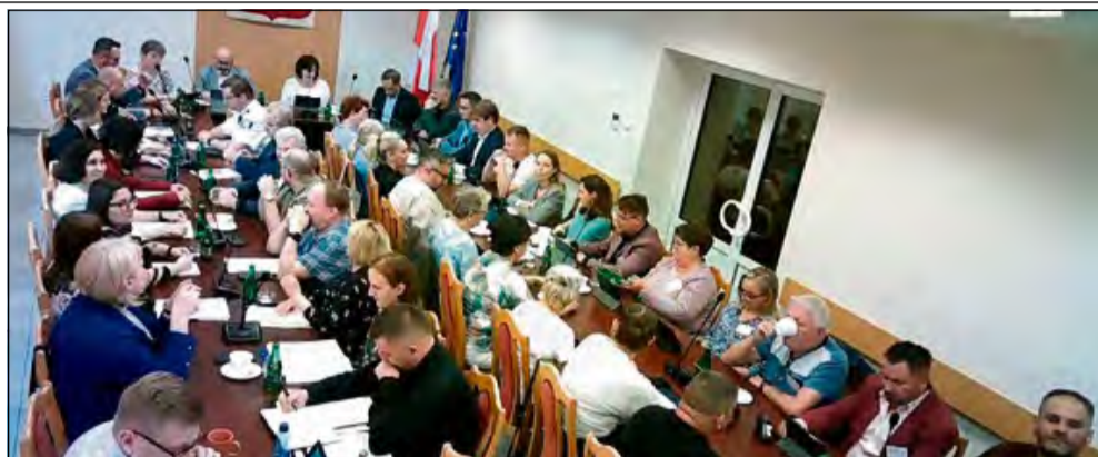
Zdzieszowicka Rada Miejska w trakcie omawiania ważnych spraw gminy.