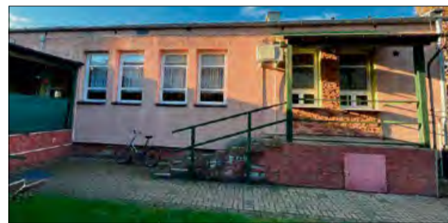
To miejsce będzie służyć różnym grupom społecznym.

Budynek, w którym ma powstać placówka, jest już częściowo przystosowywany pod Branżowe Centrum Umiejętności, którego otwarcie zaplanowano na 25 września. Nowa inwestycja zostanie zrealizowana w tym samym obiekcie, co pozwoli na efektywne wykorzystanie przestrzeni. To miejsce będzie służyć różnym grupom społecznym: młodzieży, seniorom, przedsiębiorcom, a teraz także osobom wymagającym wsparcia psychicznego. Lokalne władze chcą, aby każdy