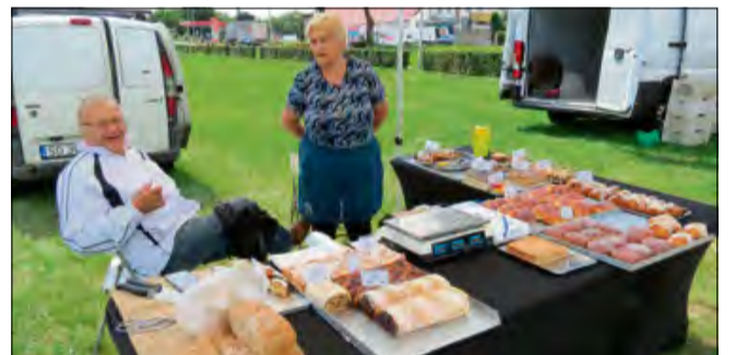
Warto wybrać się na Straganek po naturalne smaki prosto od regionalnych producentów.

Ale Straganek to znacznie więcej niż zwykły targ. To spotkanie z ludźmi - z pasją, z doświadczeniem, z historią. To forma wsparcia dla małych, rodzinnych gospodarstw, które codziennie, wbrew trendom masowej produkcji, wybierają jakość,