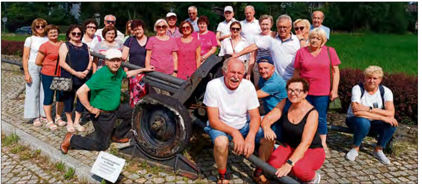
Pomimo różnych drobnych przygód, kolejny wyjazd „Cytrynówki” był bardzo udany i przebiegł w serdecznej atmosferze.