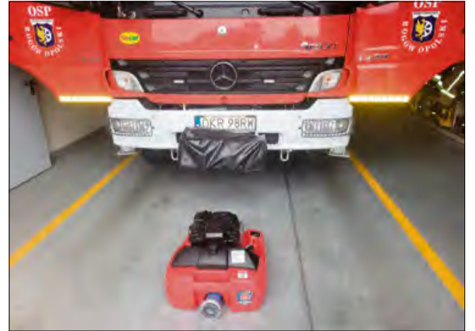
Nowoczesna motopompa znacząco zwiększy możliwości operacyjne rogowskich strażaków.