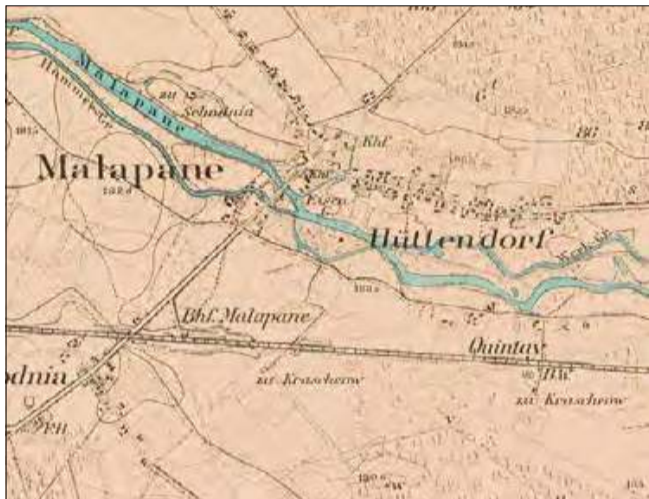
Okolice Ozimka na mapie z 1883 roku. Stanowił wówczas najmniejszą miejscowość z naszego zestawienia.

Drugą dziesiątkę naszego zestawienia otwierają Zdieszowice. Wraz z należącymi do nich już wówczas Solownią liczyły 1249 mieszkańców. Mamy więc do czynienia z bardzo dynamicznym wzrostem, gdyż w latach dwudziestych XIX stulecia były tu tylko 332 osoby. Najlepsze lata miały jednak wciąż być przed Zdieszowicami. W miejscowości mieszkało 640 kobiet i 609 mężczyzn. Miejscowa wspólnota katolicka liczyła równe 1200 dusz, ewangelicka – 44, a żydowska – 5. Na miejscu stało 260 budowli, z czego