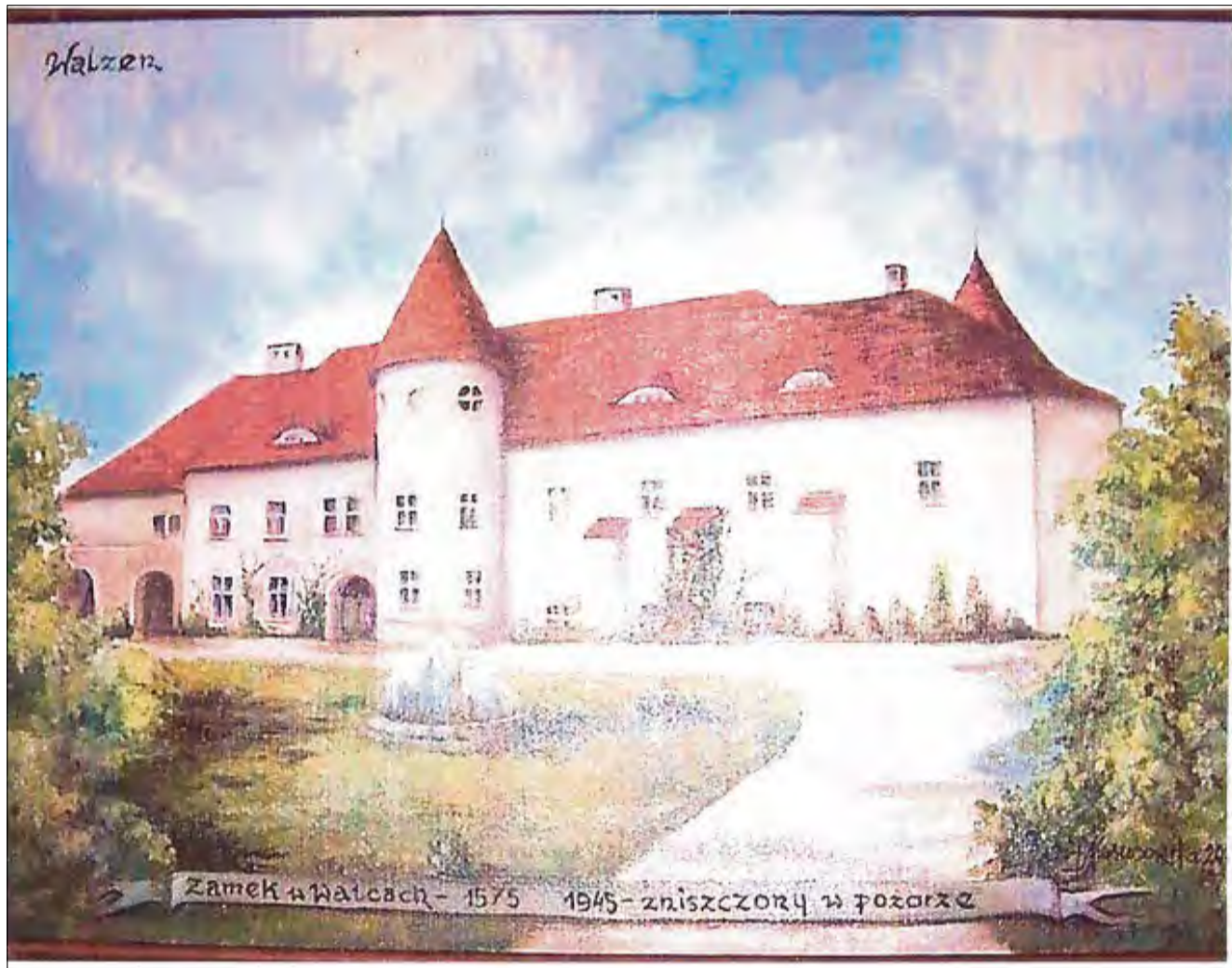
To, co zostało jedynie w pamięci – wizualizacja rezydencji, która przez wieki była sercem Walce.