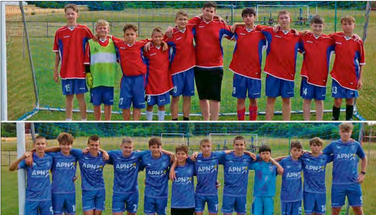
Dąbrówka Górna zamieniła się w prawdziwe centrum sportowej rywalizacji.

W dniach 12-13 lipca Dąbrówka Górna zamieniła się w prawdziwe centrum sportowej rywalizacji i rodzinnej rozrywki za sprawą dwudniowego festynu zorganizowanego przez zarząd LZS Dąbrówka Górna. Impreza zgromadziła liczną publiczność, oferując mnóstwo atrakcji dla uczestników w każdym wieku.