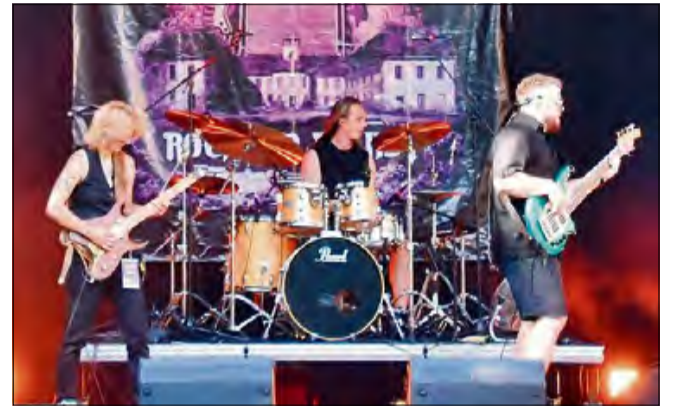
Letnia energia, świetna muzyka i niezapomniana atmosfera.

Łącznie podczas Rock am Palast 2025 wystąpiło 13 zespołów z Polski i Czech,