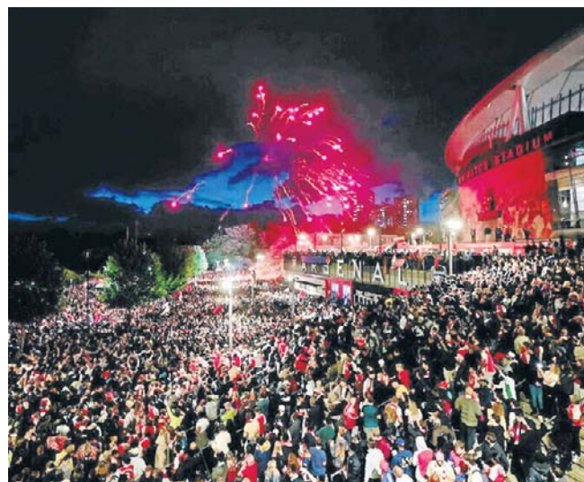
Kibice Arsenalu zbrali się przed Emirates Stadium, aby świętować zdobycie tytułu przez ich drużynę

Warto przypomnieć, że „Kanonierzy” mogą sięgnąć po podwójną koronę. 30 maja w Budapeszcie zmierzą się w finale Ligi Mistrzów z broniącym trofeum Paris Saint-Germain. ©