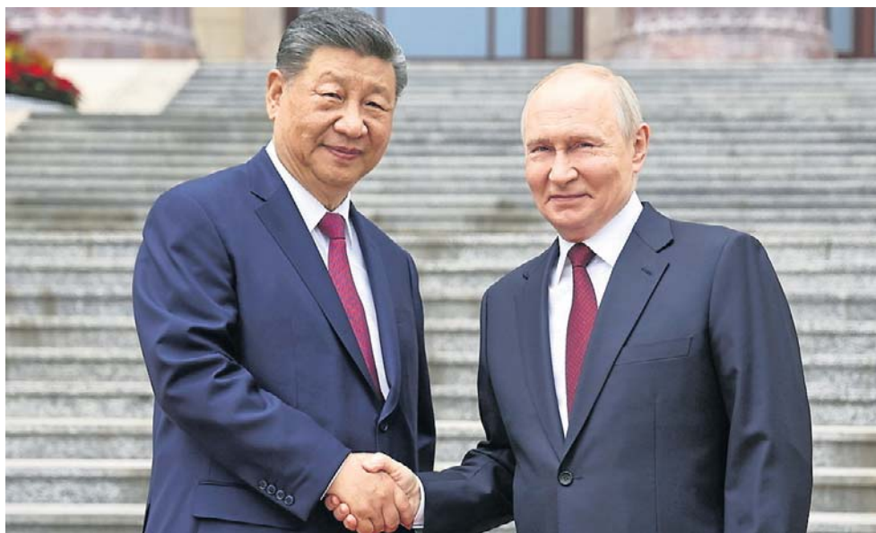
Xi Jinping oraz Władimir Putin spotkali się w Pekinie. Prezydent Rosji chwalił dwustronne relacje i zaprosił przewodniczącego ChRL do Rosji

Chiński przywódca zwrócił uwagę na sytuację na Bliskim Wschodzie, podkreślając, że wojna między USA i Izraelem