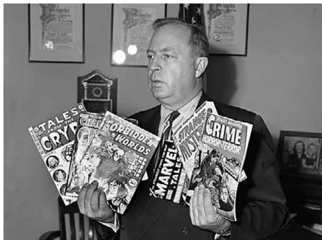
W 1954 roku za komiksy, które mają największy negatywny wpływ, uznano te o tematyce kryminalnej