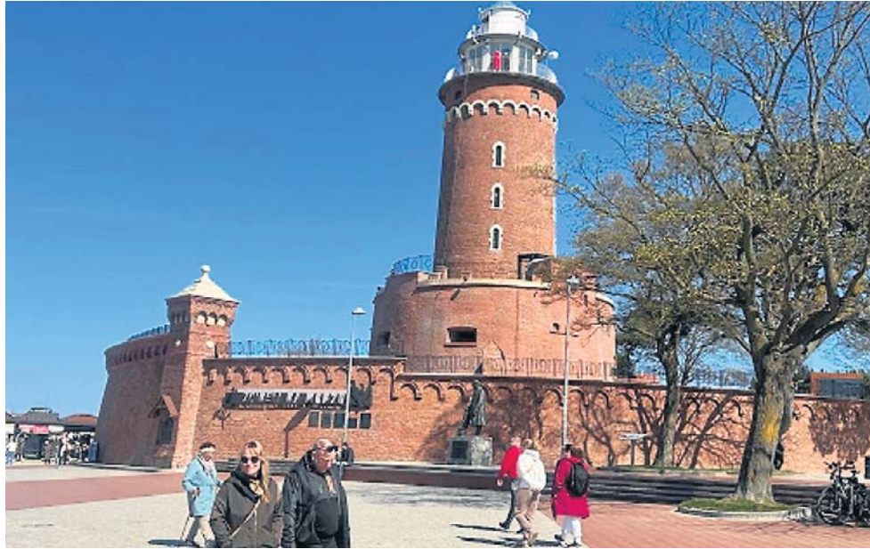
Kołobrzeg to raj dla kuracjuszy. Nazywany jest „perłą Bałtyku”. To najbardziej popularne uzdrowisko w kraju. Znajduje się tutaj kilkanaście sanatoriów i szpitali uzdrowiskowych

No tak, gdyby każdy pacjent opowiadał medykowi szczegółową historię swoich chorób, to