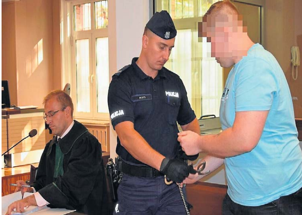
Znajomi oskarżonego nie mogli uwierzyć, że ten cichy i na pozór nieśmiały młody człowiek był zdolny do takiego bestialstwa.

Sledczy w telefonie Huberta Ś. znaleźli szokujące selfie z ciałem ofiary, które zrobił sobie około dwóch godzin przed wyjściem z mieszkania. Oskarżony przekonywał, że nie zamierzał się nim chwalić, a jedynie pokazać bliskim, bo sądził, że nie uwierzą mu na słowo, gdy opowie o tym, co zrobił. Mężczyzna ukradł też rzeczy osobiste prostytutki, m.in. dwa telefony komórkowe, pieniądze, które zapłacił jej za usługę, a także spodnie jeansowe i podkład do twarzy. Przed sądem tłumaczył, że kosmetyk miał mu służyć do zakrycia tatuażu, żeby zmylić w ten sposób organy ścigania.