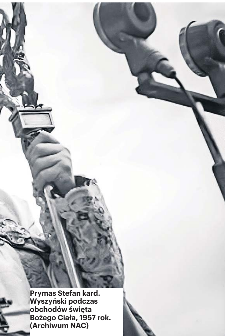
Prymas Stefan kard. Wyszyński podczas obchodów święta Bożego Ciała, 1957 rok.

miał on jednak złudzeń co do intencji komunistów, uznając porozumienie za „wybieg taktyczny”. Jak zanotował w swoich zapiskach: „Trzeba zyskać czas, by wzmocnić siły do obrony Bożych pozycji”.