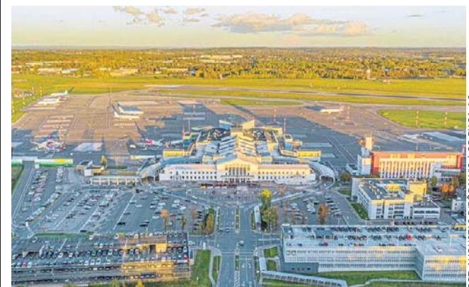
Największy port lotniczy Litwy został zamknięty po ogłoszeniu alarmu z powodu zagrożenia z powietrza

We wtorek, 19 maja, dron, prawdopodobnie ukraiński, został zestrzelony nad terytorium Estonii. Inny bezałogowiec wtargnął w przestrzeń powietrzną Łotwy. PAP