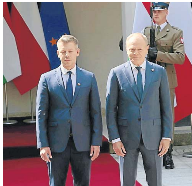
Wizyta w Polsce to pierwsza zagraniczna podróż Magyara po zaprzysiężeniu na premiera

Zaznaczył, że „rewitalizacja Grupy Wyszehradzkiej to szerszy projekt”. – Mamy tutaj identyczny pogląd z panem premie-