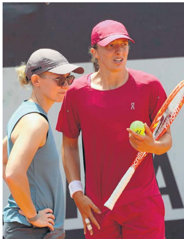
Iga Świątek niebawem, za kilka dni, rozpoczyna udział w wielkoszlemowym turnieju French Open

Iga może wygrać cały turniej. Jest tenisistką, która potrafi pokonać każdą rywalkę. Na pewno da z siebie wszystko i zostawi serce na korcie. Jeżeli będzie u niej takie zaangażowanie, wytrwałość, cierpliwość i radość z gry jak w Rzymie, to jestem spokojny o dobry wynik. Ale nawet jeśli nie zdoła nawiązać teraz do jej największych sukcesów na kortach w stolicy Francji, to ważne jest, że idzie w dobrą stronę.