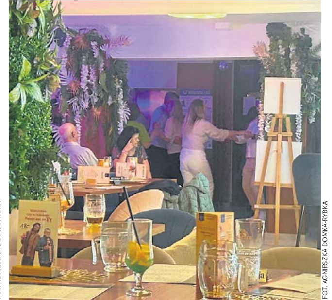
Tańce na dansingu lepsze niż rehabilitacja? Stawy i kręgosłup odpuszczają, a ciśnienie wariuje

- Niby stare ludzie, a bawią się tymi guzikami jak małe dzieci - komentuje pan z obsługi, tzw. złota rączka. - Raz na tydzień muszę wymieniać przyciski, którymi