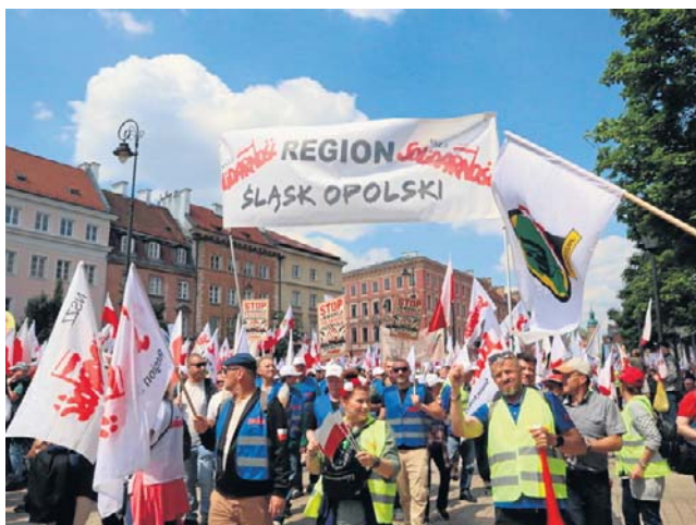
Uczestnicy pokazali poparcie dla wniosku Prezydenta RP o referendum w sprawie przepisów Zielonego Ładu.

Głos zabrał między innymi Przemysław Czarnek, kandydat PiS na premiera. Jeszcze przed rozpoczęciem marszu podkreślił, że „Polska musi wyjść z ETS-u natychmiast i musi zaprosić do wyjścia