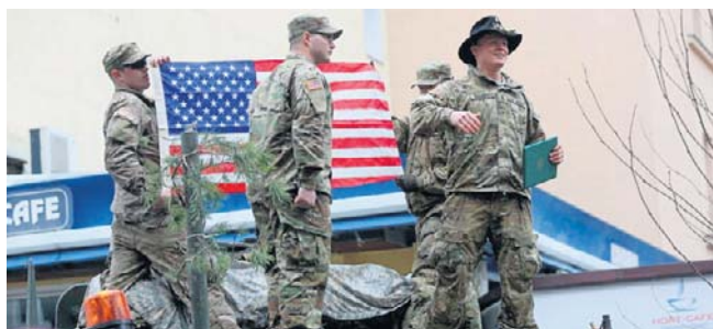
USA redukują obecność wojskową w Europie

„Departament zmniejszył łączną liczbę Brygadowych Zespołów Bojowych (BCT) przydzielonych do Europy z czterech do trzech. To przywróciło liczbę BCT w Europie do po-