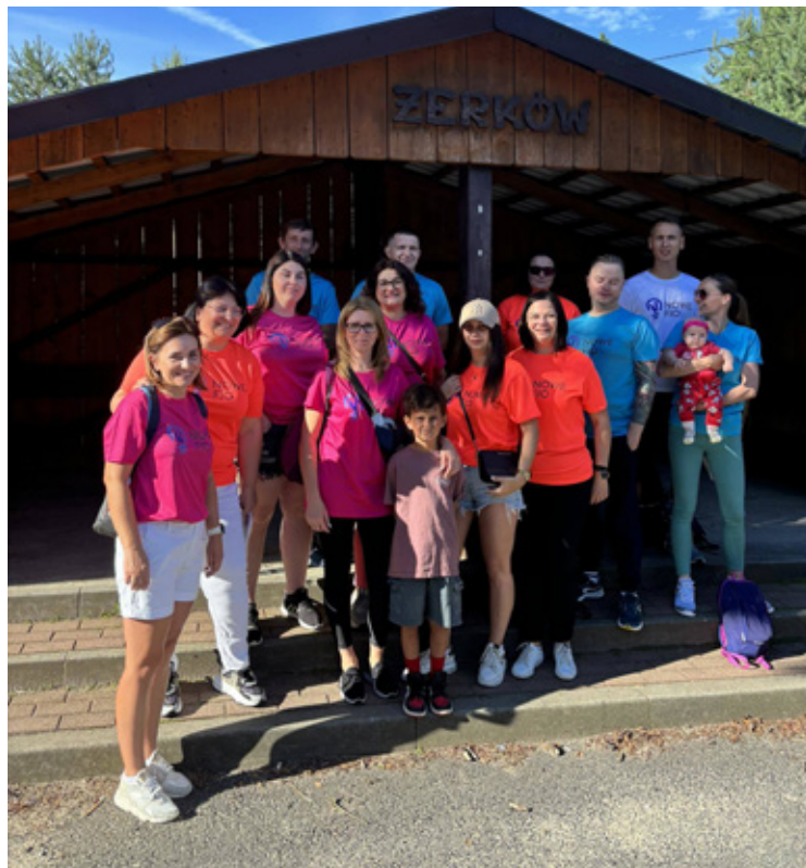
Stowarzyszenie Na Rzecz Rozwoju Wsi Żerków.

Ważnym elementem projektu będzie cykl warsztatów. Miłośnicy muzyki będą mogli uczestniczyć w zajęciach śpiewu, podczas których nie zabraknie ludowych