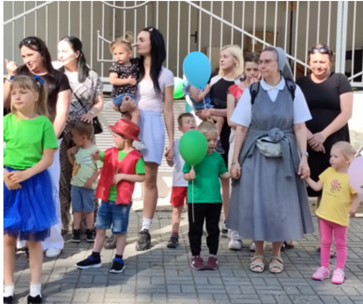
Występy i uśmiechy.

Inicjatywa została zrealizowana w oparciu o współpracę lokalnych partnerów. Obok PCPR w Wołowie, w gronie współorganizatorów znaleźli się: Powiat Wołowski, DS Team Sport, Zespół Szkół Zawodowych w Wołowie, Fundacja Szklane Domy oraz Fundacja Niepowtarzalni.