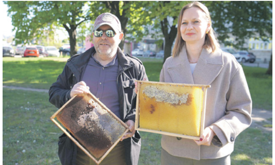
Na Dolnym Śląsku pszczoły mogą liczyć na wielu sojuszników, a działania wspierające pszczelarstwo są tu konsekwentnie rozwijane

Samorząd Województwa Dolnośląskiego kontynuuje program wsparcia pszczelarzy. Milion złotych trafi m.in. na dokarmianie rodzin pszczelich, rozwój pasiek edukacyjnych oraz działania wspierające bioróżnorodność.