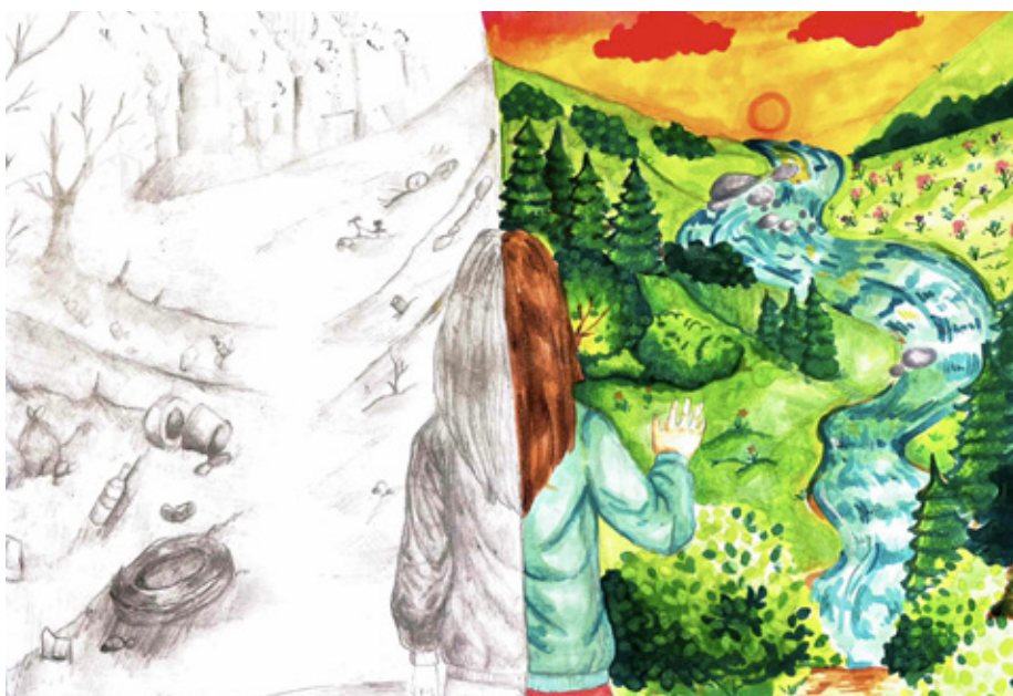
1 miejsce w kategorii 11 14 lat Katarzyna Pietuchowa ZSP nr 3 Brzeg Dolny