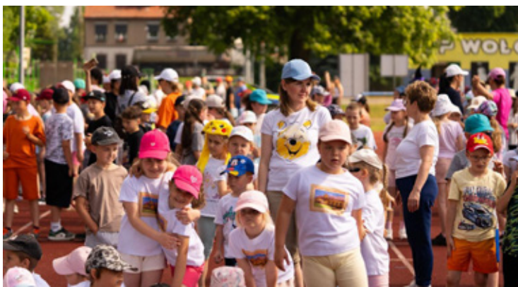
Dzieci na stadionie w Wołowie.

Bieganie w tytułowych czapkach dodało wydarzeniu mnóstwa kolorytu. Na trybunach i samej bieżni nie brakowało szczerych uśmiechów, dobrej energii i, co najważniejsze, ogromnych serc do pomagania. Każdy pokonany metr był symbolicznym krokiem wsparcia dla osób toczących najtrudniejszą walkę o swoje zdrowie.