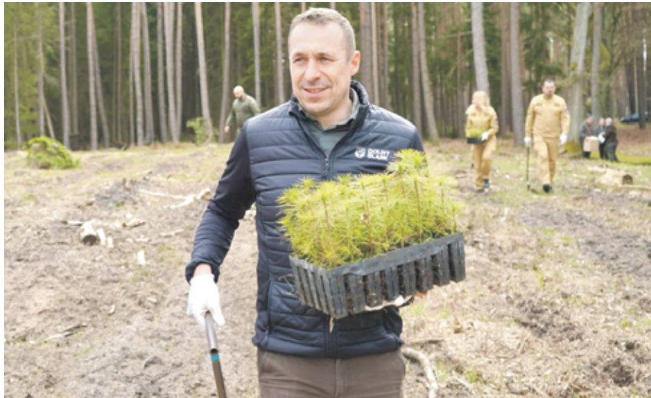
Troska o lasy to inwestycja w równowagę całego ekosystemu, którego ważną częścią są również pszczoły - marszałek Paweł Gancarz

PARTNER STRONY: URZĄD MARSZAŁKOWSKI WOJEWÓDZTWA DOLNOŚLĄSKIEGO