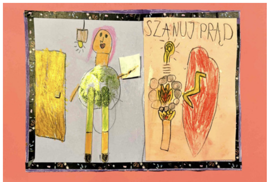
1 miejsce w kategorii do 10 lat Aurelia Polek ZSP nr 3 Brzeg Dolny