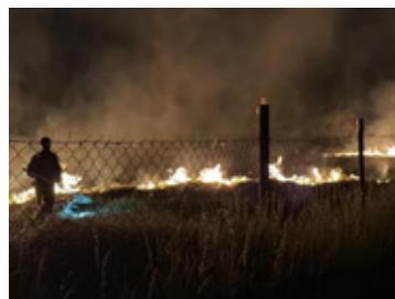
Pożar na działkach wyglądał groźnie, ale na szczęście obyło się bez strat i poszkodowanych.

Nocny pożar w Wołowie to niestety tylko jedno z wielu zdarzeń w ostatnich dniach, które układają się w niebezpieczną serię. Sucha trawa i nieużytki płoną