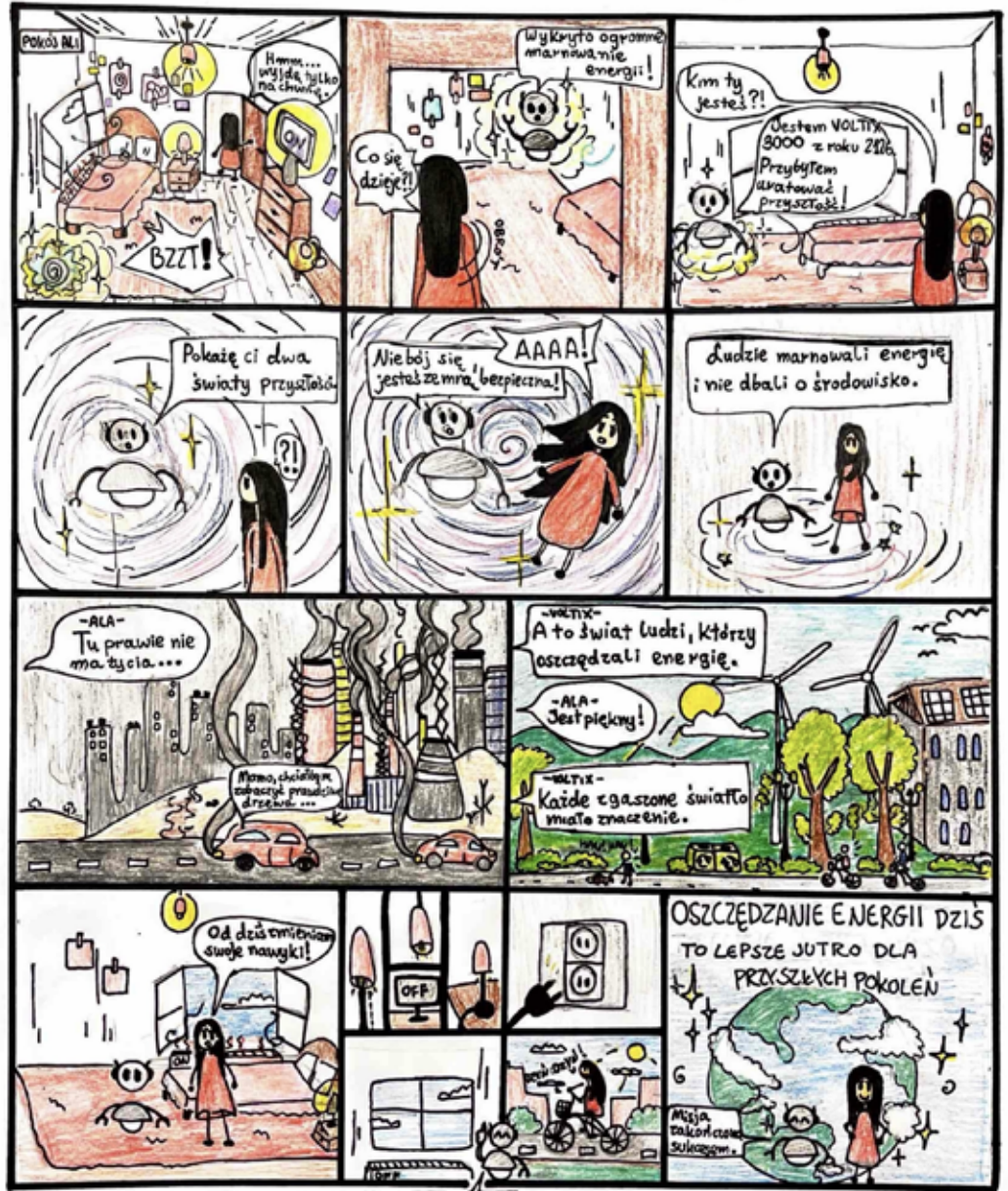
Przyszłość została zaaktualizowana! Hanna Płomińska 15 lat 8B ZSP. nr. 1 w Brzegu Dolnym