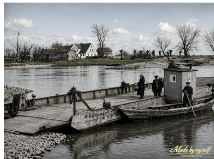
Dawna przeprawa promowa.

- Nie zajmuję się tym wyłącznie hobbystycznie. Każdy może odwiedzić moje studio fotograficzne z własną pamiętką i zlecić profesjonalne odnowienie, retusz lub digitalizację. Widzę, że wiele osób chce dziś odświeżyć takie ka-