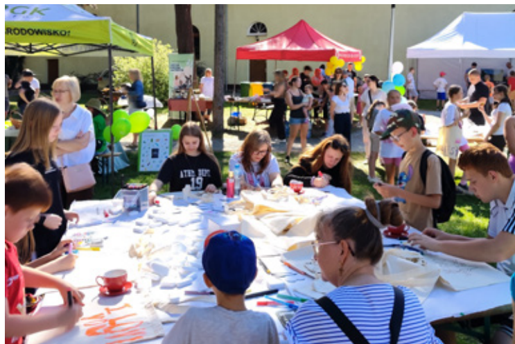
Wspólne zajęcia integrują i cieszą.