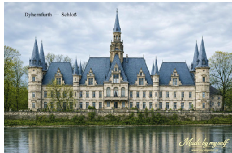
Przeszłość ma duszę.

- Robisz to z miłości do miasta i historii, czy mieszkańcy mogą przyjść do Ciebie z swoim starym albumem?