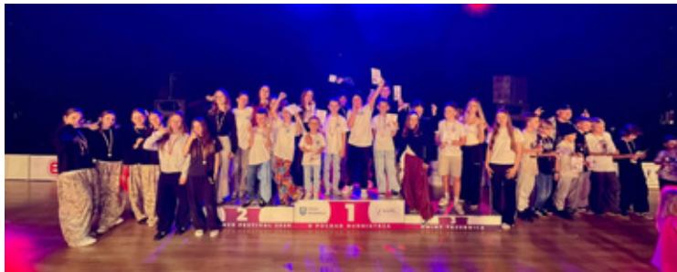
młodzi pasjonaci Hip Hopu, Street Dance i Breakdance z Akademii Tańca i Ruchu Street Flow udowodnili, że ciężkie treningi przynoszą spektakularne efekty.

Największe emocje zawsze towarzyszą zmaganiom debiutantów. W kategorii Solo Pierwszy Krok nasi zawodnicy nie mieli