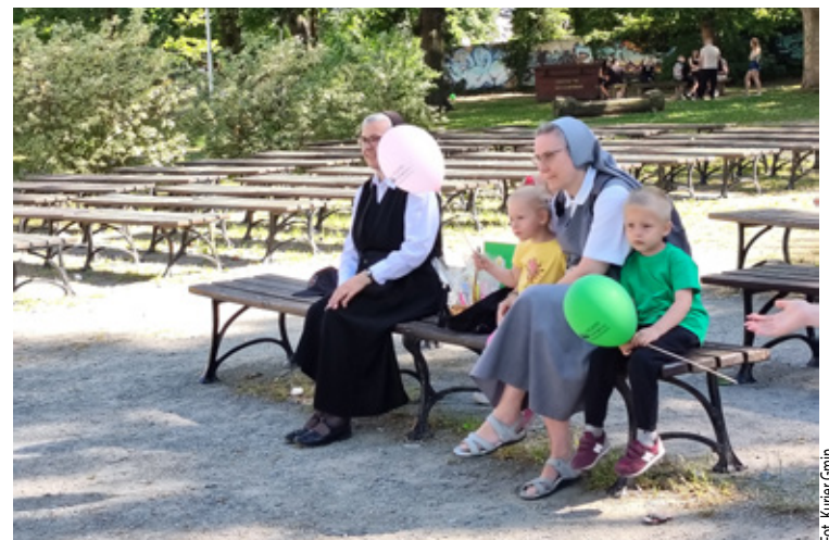
Wspaniałe Siostry z „Wiosny”.