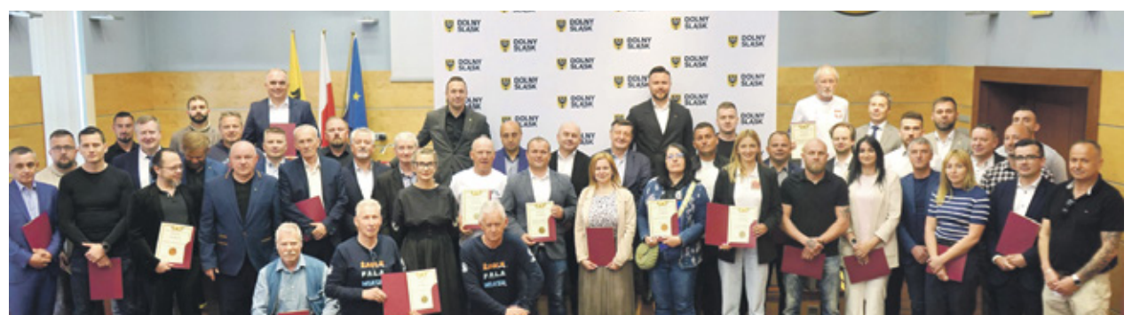
Dzięki dofinansowaniom z samorządu województwa inwestycje zostaną przeprowadzone w 45 klubach z regionu

Wsparcie obejmuje bardzo różnorodne projekty - od modernizacji boisk piłkarskich i budowy zaplecza sanitarno-szatniowego, po remonty trybun, wyposażenie obiektów treningowych i zakup nowoczesnego sprzętu sportowego. Dofinansowanie otrzymały także przedsięwzięcia związane