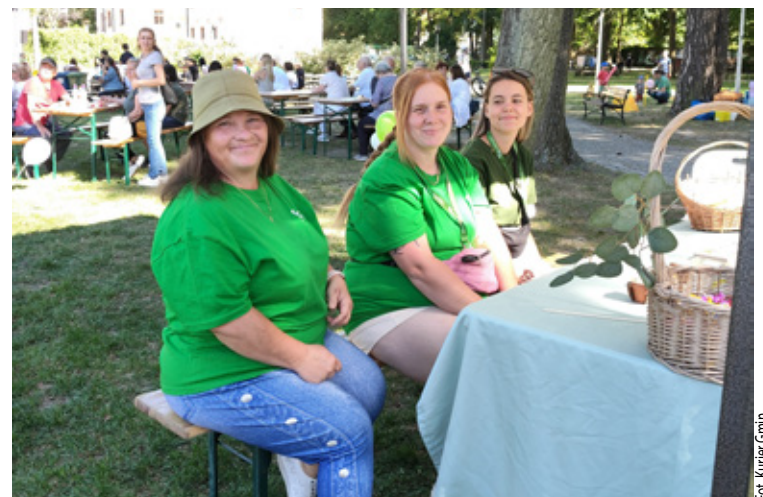
Stanowisko PGK w Wołowie.