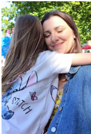
Rodzina jest najważniejsza.