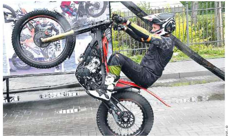
W programie znalazły się pokazy trialu motocyklowego.