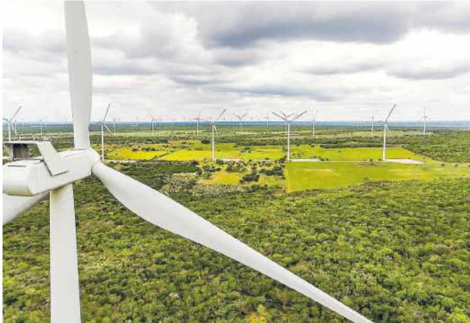
Energetyka wiatrowa nie stanowi czynnika obniżającego wartość nieruchomości.

Wartość nieruchomości gruntowych wokół wiatraków od lat