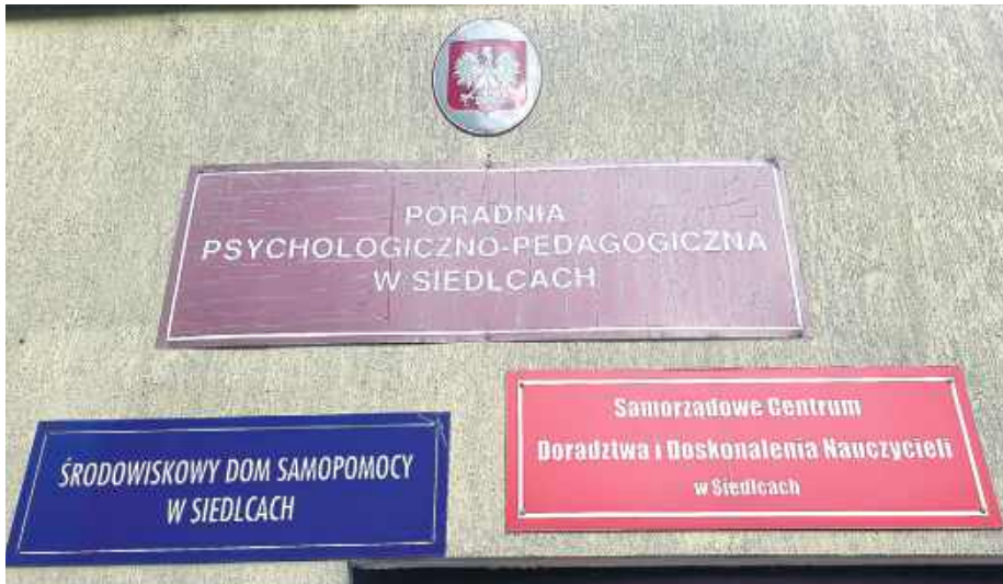
Czy wkrótce zginie któryś z tych szyldów?

Na dodatek za pomysłem prezydenta przemawia prawo. W uzasadnieniu uchwały pod-