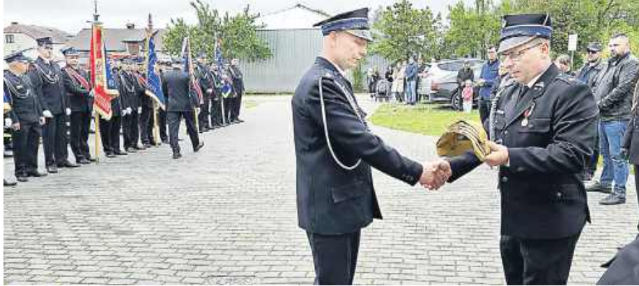
Z okazji święta wójt przekazał jednostkom nowe komplety mundurów koszarowych.

Ta położona na polanie, przy lesie kapliczka to miejsce szczególne. Według lokalnych przekazów, była tu mała studnia z wodą ze źródła, przy której wzniesiono 3 krzyże, symbolizujące Trójcę Świętą. W czasie zaborów tutejsi mieszkańcy gromadzili się przy nich na modlitwie. Z tego powodu władze carskie nakazały je wywieźć z miejsc. Jak głosi legenda, gdy wykopano pierwszy, przyfrunęły 3 białe gołębie i usiadły na nim. Włożono go na wóz, ale woły zarycza-