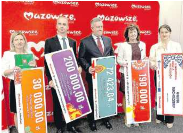
Pozyskane środki pozwolą na realizację szeregu inwestycji.

Pozyskane środki są częścią sze-rokiego wsparcia kierowanego przez Samorząd Województwa Mazowieckiego do jednostek samorządu terytorialnego i lokalnych społeczności. Programy te obejmują zarówno inwestycje infrastrukturalne, jak i działa-