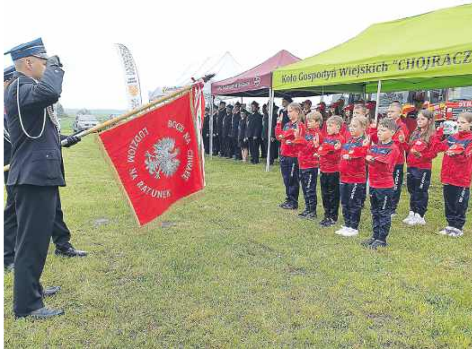
Duże emocje wzbudziło ślubowanie młodych druhen i druhow.

W kazaniu kapelan OSP w powiecie siedleckim ks. Łukasz