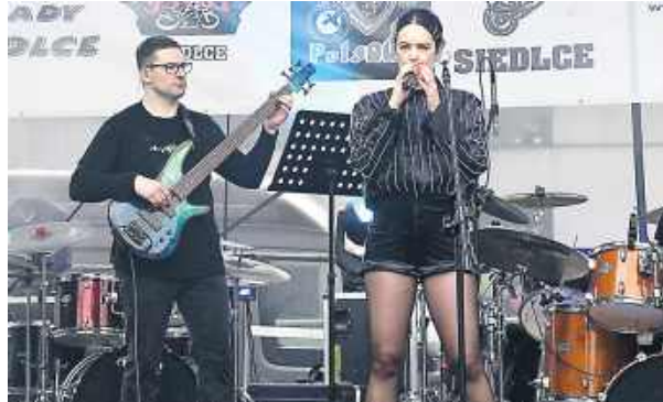
Na scenie zaprezentowały się zespoły reprezentujące różne style, m.in. Bezpiecznik, Two&Teraz, Loki, NSC, Mrock, Rock Menu.

W sobotę, 16 maja, na terenach zielonych przy ul. Wiszniewskiego w Siedlcach mimo niesprzyjającej pogody odbyła się MotoWiosna – wydarzenie łączące motoryzacyjne emocje, koncerty na żywo oraz atrakcje dla całych rodzin.