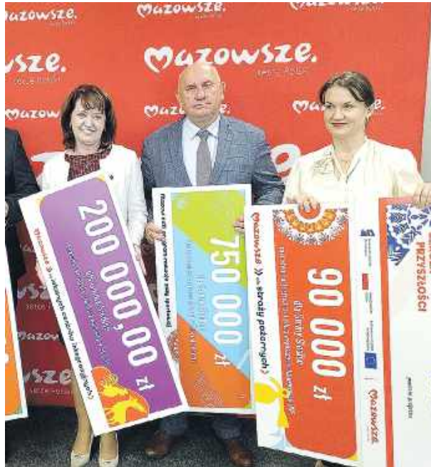
Gmina Siedlce pozyskała łącznie ponad 1 mln zł na inwestycje sportowe, społeczne i edukacyjne.

Jak podkreślała Janina Ewa Orzełowska z zarządu województwa mazowieckiego, środki