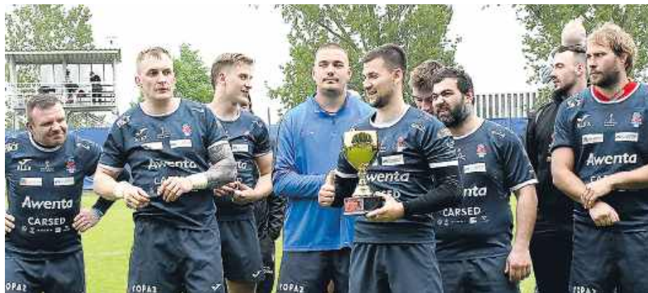
Kolejne spotkanie siedlczan to półfinał Ekstraligi 30 maja Pogoń zmierzy się w Gdyni z Arką.

Już pierwsze minuty pokazały, że gospodarze nie zamierzają zostawić rywalom żadnych złudzeń. Pogoń grała szybko, agresywnie i z dużą pewnością siebie, jak na prawdziwych mistrzów przystało. Po piętnastu minutach siedlczanie prowadzili już 26:0, a Budowlani mieli ogromne problemy, by zatrzy-