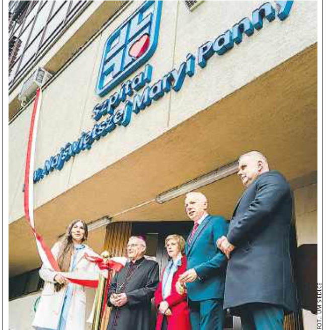
Przed przecięciem wstęgi

Szpital miejski oficjalnie ma starą nową nazwę. Zaczęło się w 2024 r., od pisma Zjednoczenia Katolicko-Narodowego Środkowo-Wschodniej Polski Siedlecki do prezydenta, przewodniczącego rady, biskupa i starosty. Przypomniano w nim, że Szpital Miejski pod wezwaniem Najświętszej Marii Panny przy ul. Starowiejskiej rozpoczął działalność w 1832 r., a zakończył do 1939 r. Po II wojnie światowej nie wrócono do tej nazwy. Siedleccy działacze