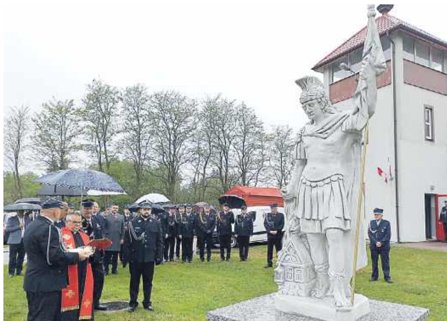
Poświęcono figurę św. Floriana ustawionej przed remizą na pamiątkę jubileuszu 110-lecia jednostki.

Kwasowicz zwrócił uwagę na szczególny wymiar strażackiej służby: wspólnotę i braterstwo. – Straż to nie tylko sprzęt, który możemy posiadać, ale straż to przede wszystkim ludzie, którzy stanowią jedność – podkreślał kapłan. Przypominał również, że strażacy nigdy nie działają sami, bo bezpieczeństwo i skuteczność opierają się na współpracy i wzajemnym zaufaniu.