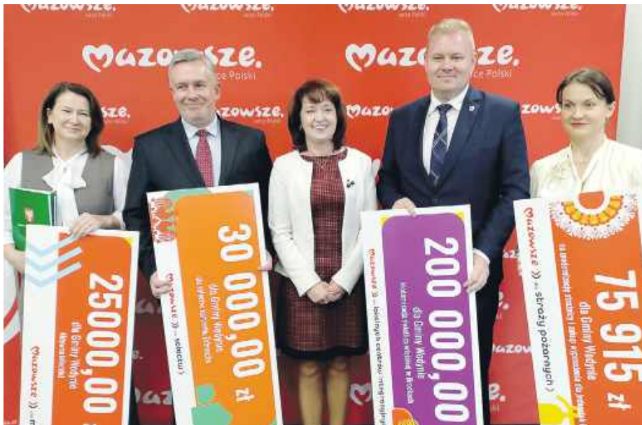
Największa część środków trafi na poprawę infrastruktury społecznej.

Największa część środków trafi na poprawę infrastruktury społecznej. W Brodkach zaplanowano modernizację świetlicy wiejskiej, która od lat pełni funkcję miejsca spotkań mieszkańców. Na realizację tego zadania w ra-