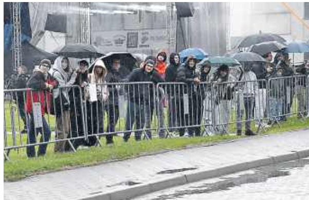
Pogoda nie odstraszyła uczestników imprezy.

Choć pogoda tego dnia była kapryśna i momentami nie sprzyjała plenerowym aktywnościom, wydarzenie odbyło się zgodnie z planem. Ci, którzy zdecydowali się przyjść, mogli skorzystać z przygotowanych atrakcji i spędzić czas