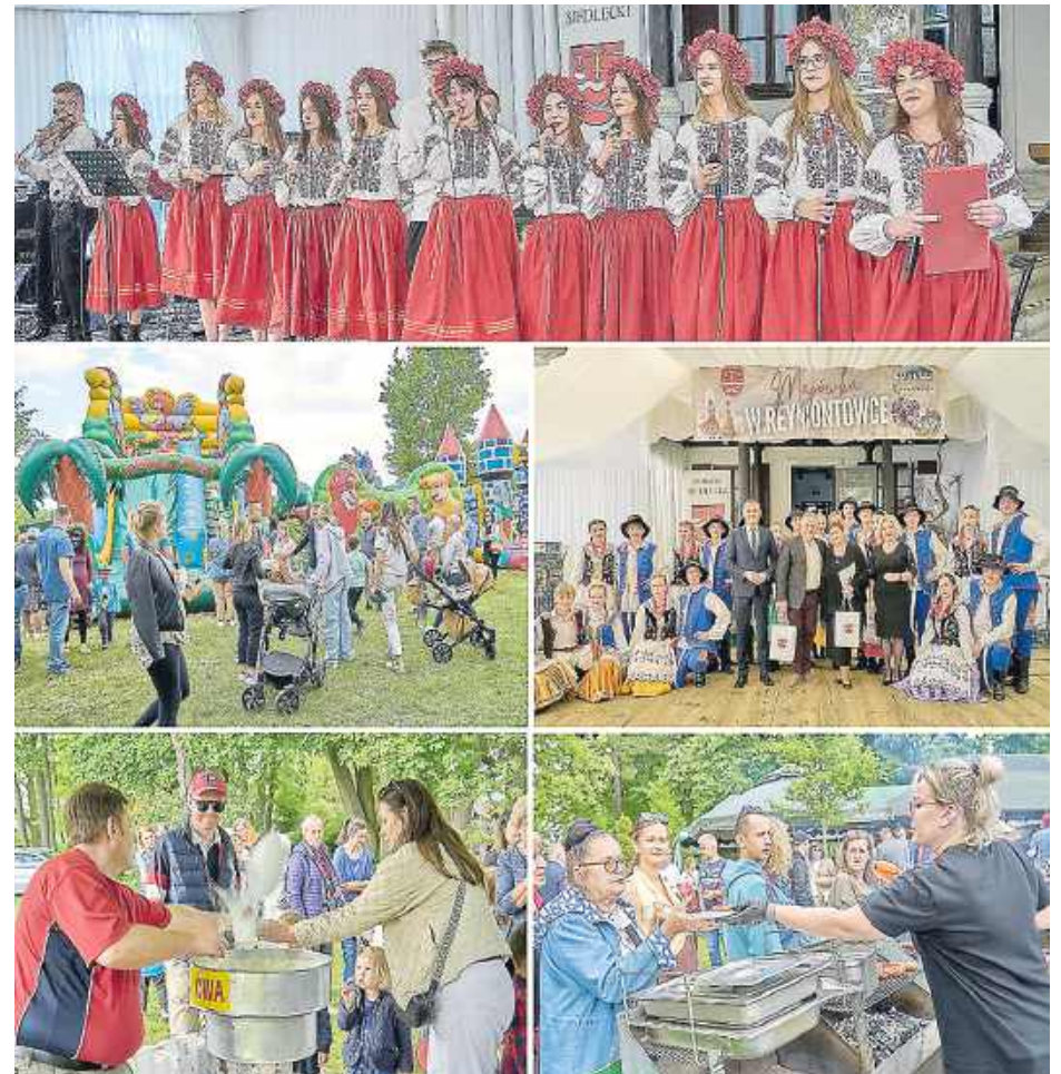
Na zdjęciach z ubiegłego roku wracamy do wspomnień — było gwarnie, radośnie i bardzo ludowo, a frekwencja pokazała, że impreza cieszy się dużym zainteresowaniem mieszkańców.

dlecki oraz Dom Pracy Twórczej „Reymontówka”, a współorganizatorem Samorząd Województwa Mazowieckiego. ID