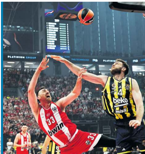
Olympiakos w pierwszym półfinale rozbił Fenerbahce.

Tuż po pierwszym gwizdaku kibice z Turcji otrzymali kolejny cios - ich zespół zaczął wręcz katastrofalnie i po 6 minutach przegrywał 0:12. Pierwszych 9 rzutów z gry w wykonaniu ekipy ze Stambułu nie wpadło do kosza! Trener Sarunas Jasikevicius