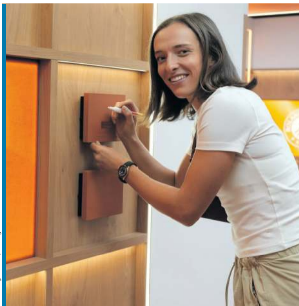
Iga Świątek swoją tabliczkę na ścianie mistrzów w Paryżu już ma, co nie znaczy, że chce poprzestać na czterech tytułach...

W tak ułożonym zestawieniu prowadzi Świątek, ale kluczowe pytanie nie dotyczy już jej dawnej dominacji na mączce, lecz tego, czy zdoła odnaleźć swoją najlepszą formę, by odzyskać tytuł stracony przed rokiem na rzecz Coco Gauff. Tegoroczny sezon na ziemi Polka rozpoczęła od pojedynczych zwycięstw w Stuttgarcie i w Madrycie, gdzie dolegliwości żołądkowo-jelitowe zmusiły ją do poddania meczu w 1/16 finału. Do Rzymu przyjechała nadal bez pierwszego tytułu w tym roku, ale awans do półfinału sugeruje, że wreszcie zaczyna wracać do formy i przyjechała do Paryża z nadzieją na przełamanie tej posuchy. Czwartkowy przegrany sparing z Jeleną Rybakina – z zastrzeżeniem, że to tylko trening – każe jednak ostrożnie patrzeć na aktualny potencjał Polki.