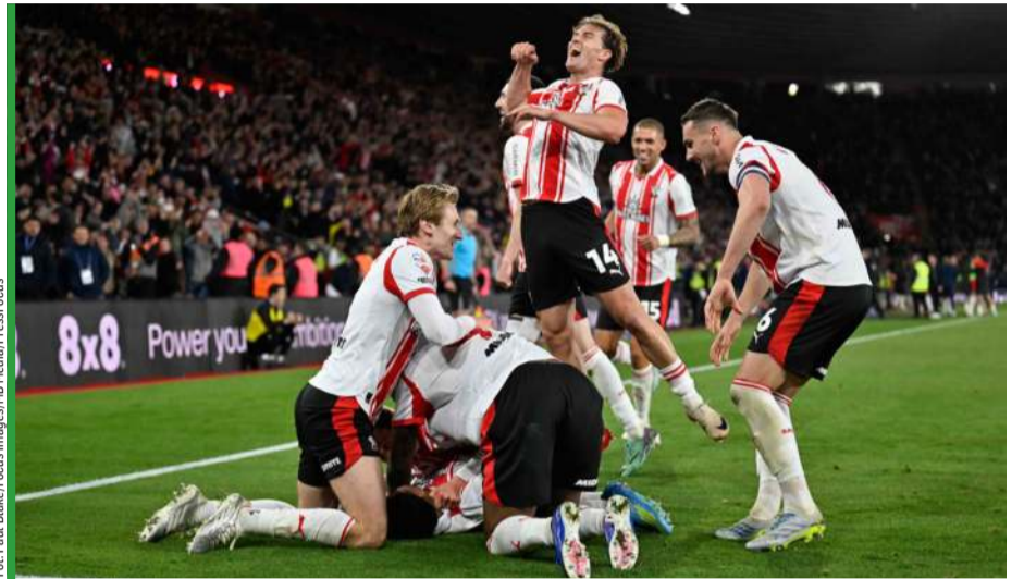
Tak piłkarze z południa Anglii świętowali pokonanie Middlesbrough. Teraz... chcą pozwać swój klub.

„Spygate” - tak określa się tę sytuację w angielskich mediach. W finale na Wembley o awans miały walczyć Hull i Southampton, lecz ta druga drużyna została zdyskwalifikowana, bo okazało się, że (jednak nie tacy) Święci podglądali i nagrywali treningi Ipswich, Oxfordu i Middlesbrough, które pokonali w barażowym półfinale. W zaistniałej sytuacji to jednak Lwy z Boro mają zagrać w finale, pokonując Southampton walkowe-