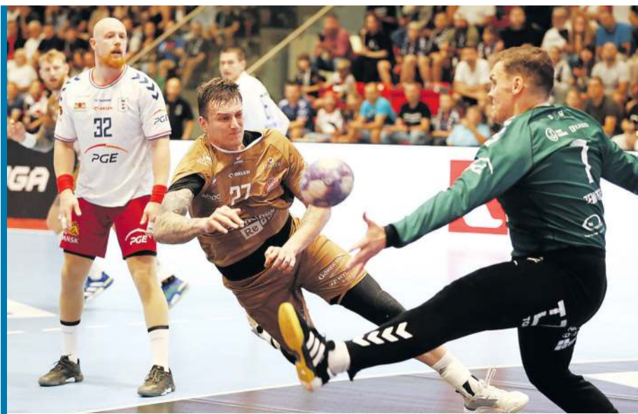
Walka Ostrowii z Wybrzeżem o brąz zapowiada się równie interesująco, jak bitwa o złoto.

szej czwórce po raz pierwszy od 25 lat, kiedy sięgnęło po tytuł. - Nasze ambicje