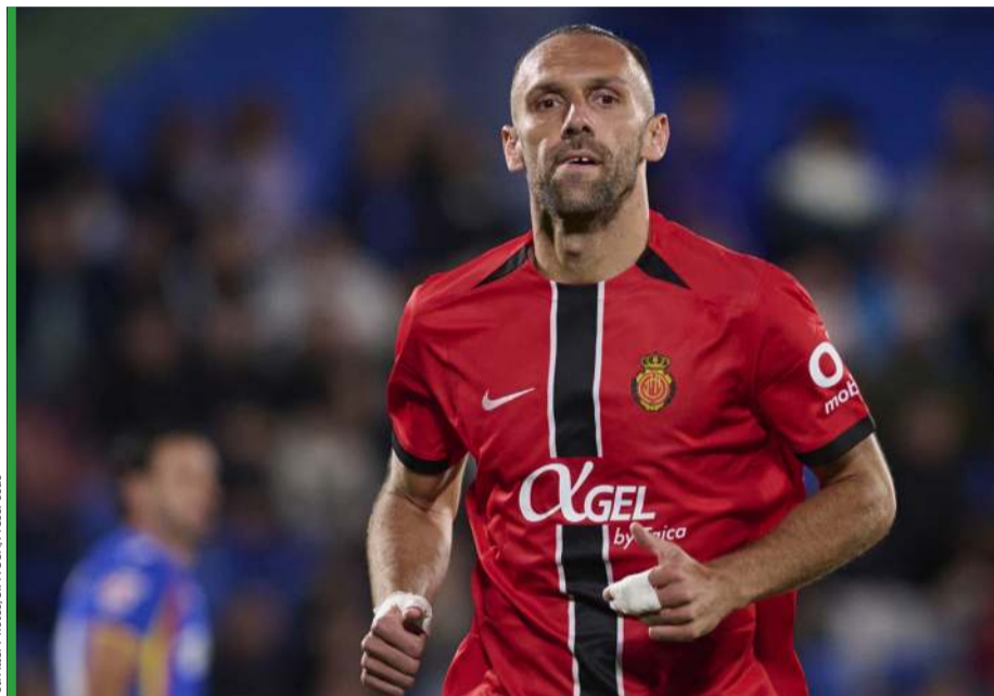
Czy Vedat Muriqi, drugi najlepszy strzelec rozgrywek, spadnie na drugi szczebel rozgrywkowy?

Dopiero 6. miejsce rozpocznie się prawdziwa batalia. W Hiszpanii ta lokata gwarantuje grę w Lidze Europy. Na razie znajduje się na niej Celta, która ma trzy punkty przewagi nad Getafe. Gdyby ekipa z Vigo przegrała z Sevillą, a podopieczni Jose Bordalasa wygrali z Osasuną, przy takiej samej liczbie punktów wyżej będzie Getafe, dzięki lepszemu bilansowi meczów bezpośrednich. Wówczas Celta spadłaby