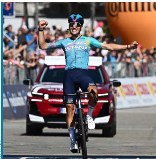
Nic tak nie cieszy włoskiego kolarza jak zwycięstwo w Giro.

W każdym z trzech Wielkich Tourów, szczególnie w ich drugiej połowie, zdarzają ucieczki złożone z kilkunastu zawodników, które odjeżdżają od pelotonu na kilkanaście minut i kończą się powodzeniem. Tak właśnie było wczoraj na odcinku z Alessandri do Verbanii (189 km) w północnych Włoszech. Kolarze długo przemierzali płaskie tereny Piemontu, żeby dopiero w końcówce nieco pomóc się na dwóch podjazdach. Szczególnie ten drugi – krótki, ale stromy – był na tyle wymagający, że świetni sprinterzy nie mieli szans, żeby utrzymać się w czołowej grupie i – co za tym idzie – wygrać etap. Z takiego założenia wyszły ich drużyny, które nie goniły harcówników. Zespoły lidera