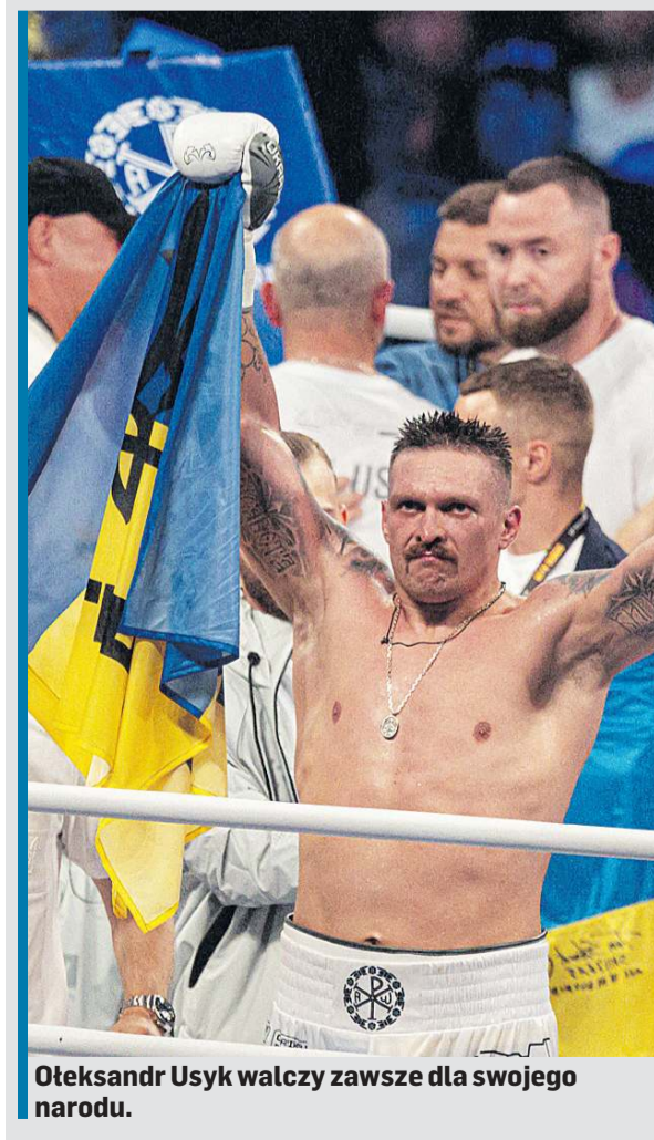
Ołeksandr Usyk walczy zawsze dla swojego narodu.

- To najdziwniejsze miejsce, a przynajmniej jedno z najdziwniejszych, w których można sobie wyobrazić walkę bokerską. To wydarzenie na pewno przejdzie do historii i znajdzie szeroki odzew wśród kibiców - zaznaczył Holender.