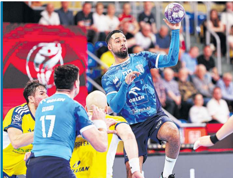
Nafciarze czy Szczyrzyki będą górą na starcie wyścigu do mistrzostwa? Oto jest pytanie...

Tytułu bronią Nafciarze po rywalizacji, która dostarczyła kibicom niezapomnianych emocji i trzymała w napięciu do ostatnich sekund drugiego meczu w Kielcach. To spotkanie było istnym rollercoasterem, a kończyło się serią rzutów karnych. Więcej zimnej krwi zachowali zawodnicy z Płocka wygrywając serię 3:2, a bohaterem Płocczan został bramkarz Mirko Alilović, który w festiwalu „siódemek” zaprezentował fantastyczną formę. Tym samym Orlen Wisła po raz drugi z rzędu i po raz dziewiąty w historii została mi-