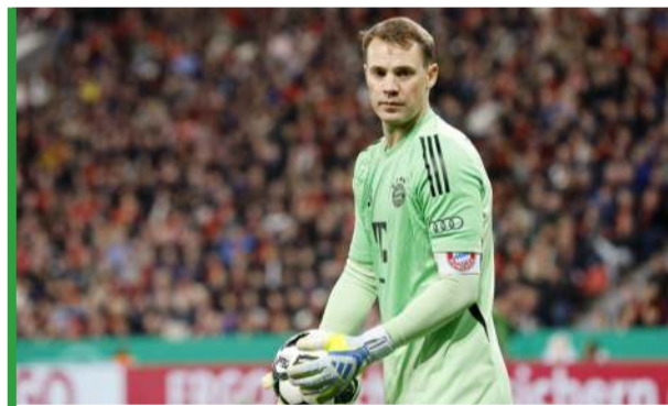
Manuel Neuer chce zdobyć dublet, a potem... mistrzostwo świata.