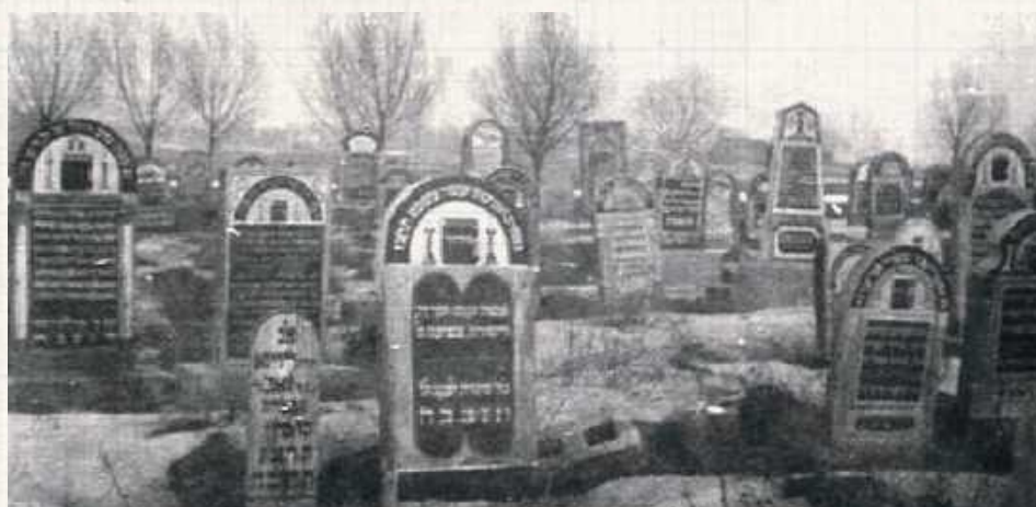
Żydzi nie obchodzą niczego, co przypominałoby chrześcijańskie święto Wszystkich Świętych czy Zaduszki. Istotnym dniem jest za to jorcait - czyli rocznica śmierci. Gestem pamięci i szacunku jest położenie na grobie kamyka

Kiedy dzisiaj odwiedzamy relikty obecnych niegdyś w każdej niemal nieco większej miejscowości regionu cmentarzy żydowskich (często były rozleglejsze niż chrześcijańskie...), spotykamy kamienne bądź wykonane z piaskowca szare macewy. Mało kto jednak wie, że oryginalnie nagrobki te były w znakomitej większości... kolorowe!