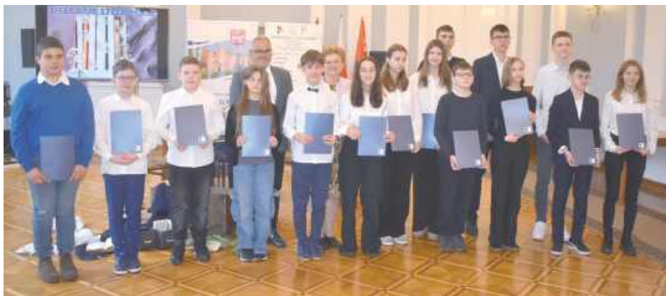
W powiatowym konkursie ortograficznym wzięło udział 136 uczniów szkół podstawowych i średnich. Najlepsi otrzymali nagrody

Podsumowanie obu konkursów odbyło się w miniony piątek (14 listopada) w ramach „Południa Literackiego”. Uczestnicy wydarzenia