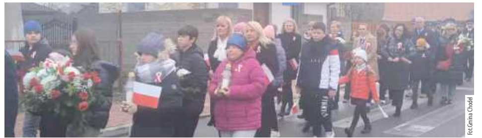
Chodel: Uczestnicy przemaszerowali spod Urzędu Gminy do kościoła, po drodze składając kwiaty przy pomnikach Józefa Piłsudskiego i Ofiar II Wojny Światowej