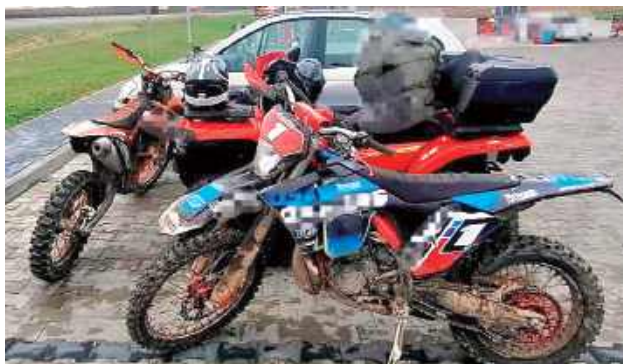
Jak się okazało, żaden z kierowców nie miał prawa jazdy, a ich pojazdy nie były dopuszczone do ruchu

Do zdarzenia doszło w niedzielę, 9 listopada po godzinie 14. Funkcjonariusze zatrzymali do kontroli dwóch kierujących motocyklami crossowymi oraz dwóch jadących quadami. Już