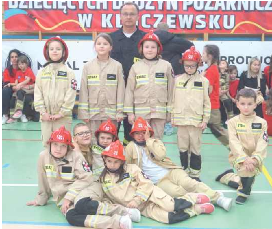
Młodzi druhowie z Janiszkowic od tygodni przygotowawali się do tego wydarzenia

Jak mówią opiekunowie, nie chodziło o rywalizację, lecz o wspólną zabawę i zaszczepienie w dzieciach pasji do strażackiego munduru. Atmosfera zawodów była pełna radości