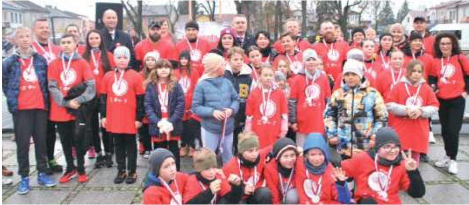
Opole Lubelskie: Świętowanie na sportowo spodobało się mieszkańcom gminy Opole Lubelskie, w biegu wystartowało ponad 250 osób!