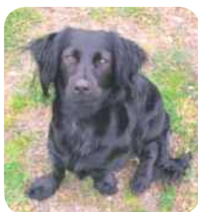
Bella, Daria Babska, Garbówka