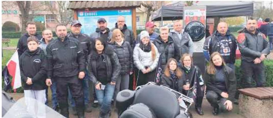
W niedzielę, 9 listopada Chodelska Grupa Motocyklowa „Motoraki” uroczystie przekazała mieszkańcom gminy pierwszy ogólnodostępny defibrylator AED