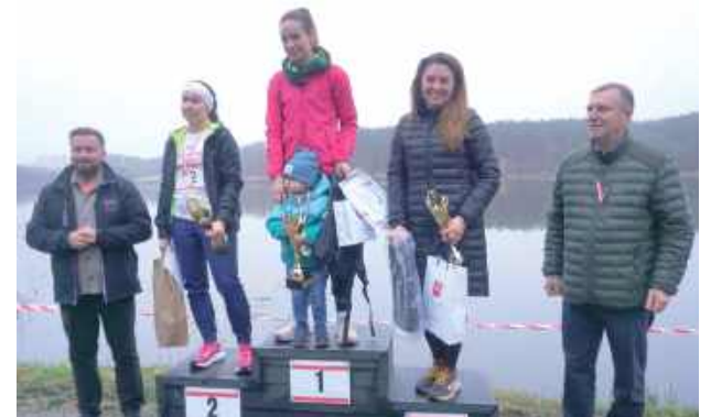
Po zmaganiach odbyła się uroczysta dekoracja zawodników

IV Janowiecki Bieg Niepodległości ponownie przyciągnął tłumy miłośników aktywnego świętowania 11 listopada. Nad Zalewem w Janowicach panowała atmosfera pełna emocji, biało-czerwonych barw i sportowej energii, a uczestnicy – od najmłodszych po najbardziej doświadczonych biegaczy – rywalizowali z uśmiechem i w duchu fair play.