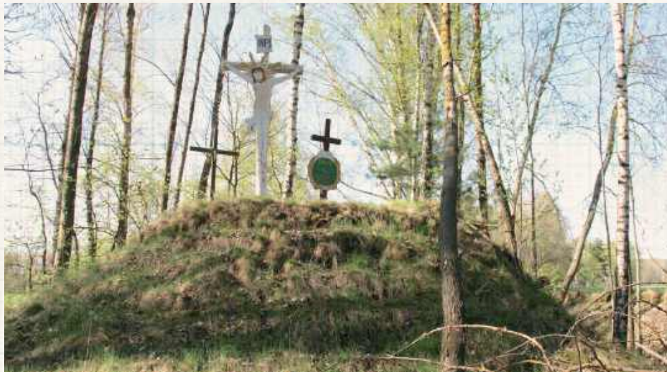
Kurhan kryjący ofiary epidemii cholery z czasu po powstaniu listopadowym

U nicy, rzymscy katolicy i prawosławni. Chłopi, mieszczenie i szlachta. Rolnicy, powstańcy i żołnierze. Polacy, Rusini, Rosjanie, Niemcy, a nawet Estończyk. Dwa cmentarze i krypta pod kościołem. Nekropolie Jabłonia są nie tylko miejscem spoczynku, ale i dokumentem historii pogranicza Podlasia i Polesia.