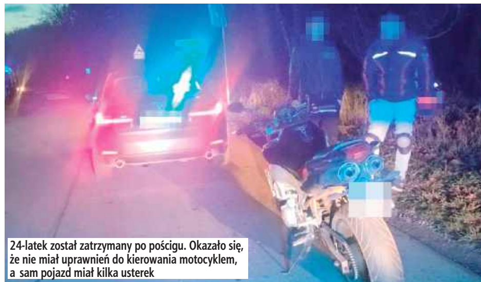
24-latek został zatrzymany po pościgu. Okazało się, że nie miał uprawnień do kierowania motocyklem, a sam pojazd miał kilka usterek

W Górze Puławskiej policjanci z Wydziału Ruchu Drogowego zauważyli motocykl Yamaha, który nie miał prawego lusterka, a kierujący nim mężczyzna przewoził pasażera bez kasku. Mundurowi zaczęli dawać mu znaki świetlne i dźwiękowe, aby zjechał na pobliską stację paliw i zatrzymał się. Ale ten wyjechał ze stacji i zaczął uciekać w kierunku Zwolenia. Mundurowi ruszyli w pościg. Do zatrzymania kierowcy Yamahy doszło w Tomaszowie. Tam okazało się, że uciekinier