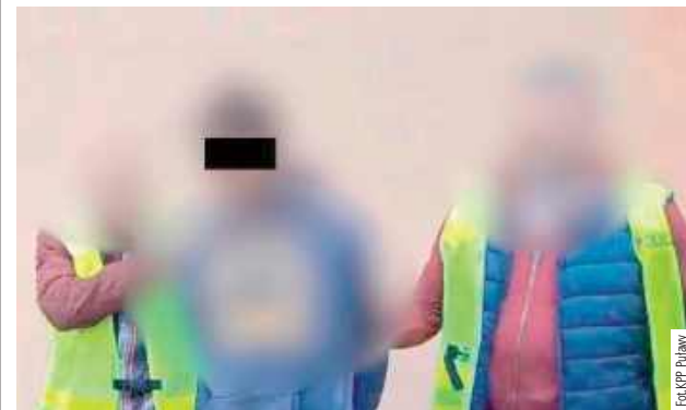
Mężczyzna usłyszał cztery zarzuty. Został objęty policyjnym dozorem. Grozi mu do 5 lat pozbawienia wolności

Cztery zarzuty usłyszał 25-latek podejrzany o uśmiercenie psa w tamtejszym kompleksie leśnym. Decyzją prokuratury został objęty dozorem policyjnym. Grozi mu do 5 lat więzienia.