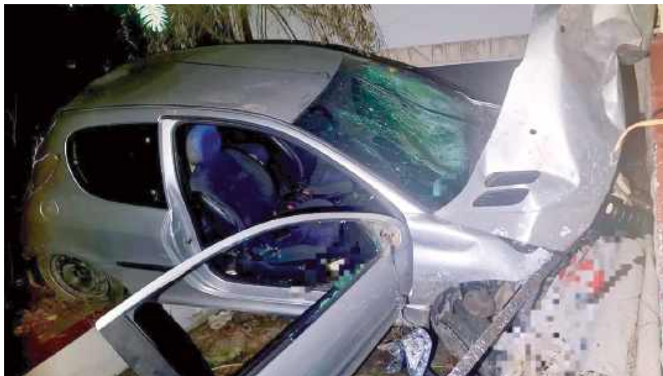
Auto z impetem wypadło z jezdni, taranując ogrodzenie jednej z posesji, po czym uderzyło w ścianę domu mieszkalnego

Obaj mężczyźni doznali obrażeń ciała i zostali przetransportowani do szpitala. Na szczęście w domu, w który uderzył samochód, nikt nie ucierpiał, choć uszkodzeniu uległa elewacja budynku i przydomowe ogrodzenie.