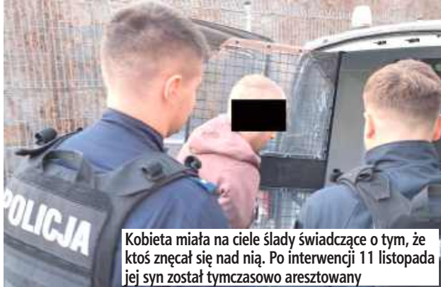
Kobieta miała na ciele ślady świadczące o tym, że ktoś znęcał się nad nią. Po interwencji 11 listopada jej syn został tymczasowo aresztowany

Wszystko działo się późnym wieczorem we wtorek 11 listopada. Policyjny patrol został skierowany na interwencję na jedno z puławskich osiedli, gdzie miało dojść do awantury domowej. Tam funkcjonariusze zastali 60-latkę kobietę i jej 30-letniego syna. Puławianka twierdziła, że syn wyrzucił ją z mieszkania. Mężczyzna nawet w obecności policjantów