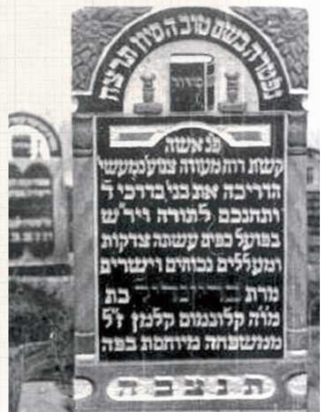
Niemal każdy nagrobek żydowski był opowieścią a nierzadko dziełem sztuki. Książka oznaczała osobę dobrze wyedukowaną, rabina albo osobę przepisywającą Torę. Złączone dłonie z kolei to znak przynależności do pokolenia Lewitów - kapłanów