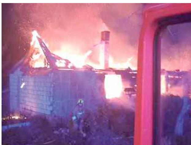
Pożar wybuchł 9 listopada

- Na miejsce zostały skierowane jednostki OSP i trzy zastępy PSP. W chwili przybycia straży na miejsce zdarzenia cały budynek był objęty ogniem. Mieszkająca w nim osoba zdołała opuścić bu-