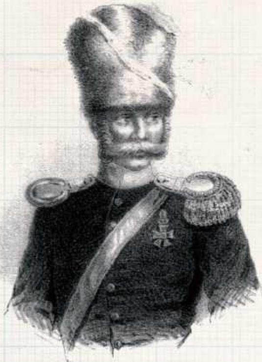
Późny, namalowany 100 lat po śmierci, portret Berka w mundurze kawalerskim

Pewnie była to szybka decyzja podjęta w przededniu konieczności obrony zrewoltowanej Warszawy przed kacapskimi hordami Suworowa. Może i podjęta niedługo potem, kiedy - jak najbardziej słusznie - jego pierwszego patrona