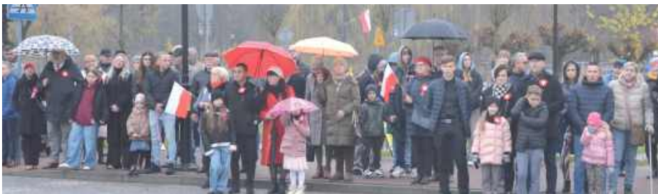
Poniatowa: Pogoda nie dopisała, ale mieszkańców to nie zniechęciło, wielu wzięło udział w obchodach 11 listopada