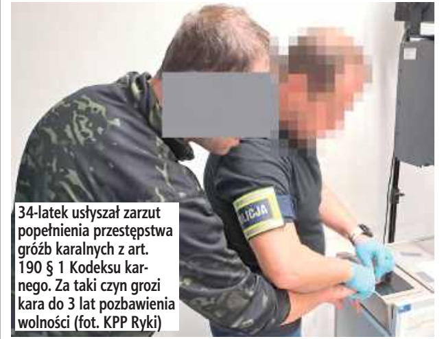
34-latek usłyszał zarzut popełnienia przestępstwa gróźb karalnych z art. 190 § 1 Kodeksu karnego. Za taki czyn grozi kara do 3 lat pozbawienia wolności

Policjanci z Komendy Powiatowej Policji w Rykach zatrzymali 34-letniego mężczyznę, który w trakcie awantury domowej groził swojej matce podpaleniem wspólnie zajmowanego domu.