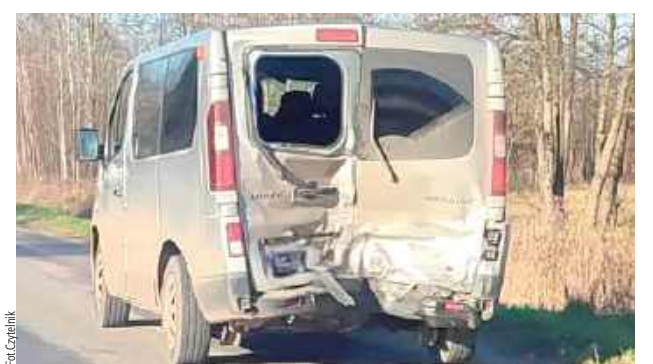
Na szczęście nikt nie odniósł obrażeń. Ucierpiały tylko pojazdy