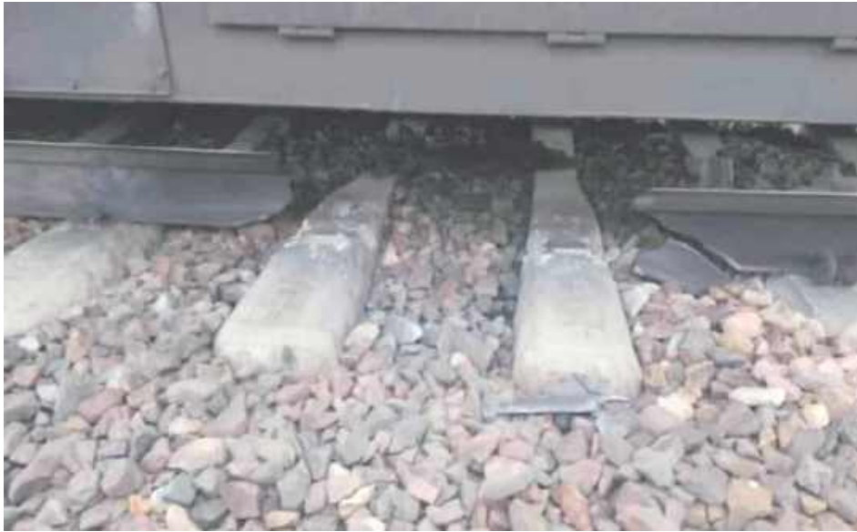
W niedzielę (16 listopada) rano w rejonie miejscowości Życzyn w powiecie garwolińskim maszynista zauważył, że uszkodzony został fragment torowiska

W rejonie miejscowości Życzyn w powiecie garwolińskim maszynista zauważył, że uszkodzony został fragment torowiska. - Na strategicznej trasie z Warszawy do Lublina, dalej na Ukrainie - już możemy to potwierdzić - eksplodował ładunek wybuchowy, wyrwał około metra toru kolejowego - poinformowała Telewizja Republika.