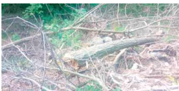
Zniknąć miały tylko samosiejki, a doszło do nielegalnej wycinki drzew o obwodach przekraczających 50 cm

W 2024 roku gmina Józefów nad Wisłą zmuszona była zapłacić 25 tysięcy złotych kary za nielegalną wycinkę drzew. Jak się okazało, zamiast samosiejek, pod