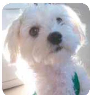
pupil Andrzeja Śliwy, Belgia