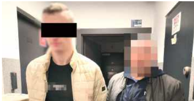
Sprawa trafi do sądu. Zatrzymanemu mężczyźnie grozi kara do 5 lat pozbawienia wolności

Zgłoszenie o przemocy domowej wpłynęło do dyżurnego opolskiej jednostki 8 listopada. Na miejsce natychmiast skierowano patrol. Policjanci, którzy przybyli pod wskazany adres, zastali roztrzęsioną kobietę i agresywnego mężczyznę będącego pod wpływem alkoholu.