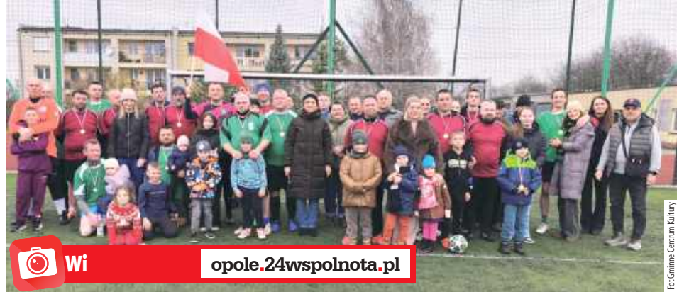
Józefów nad Wisłą: Mecz Ku Niepodległej - samorządowcy kontra rodzice Wiselki Józefów