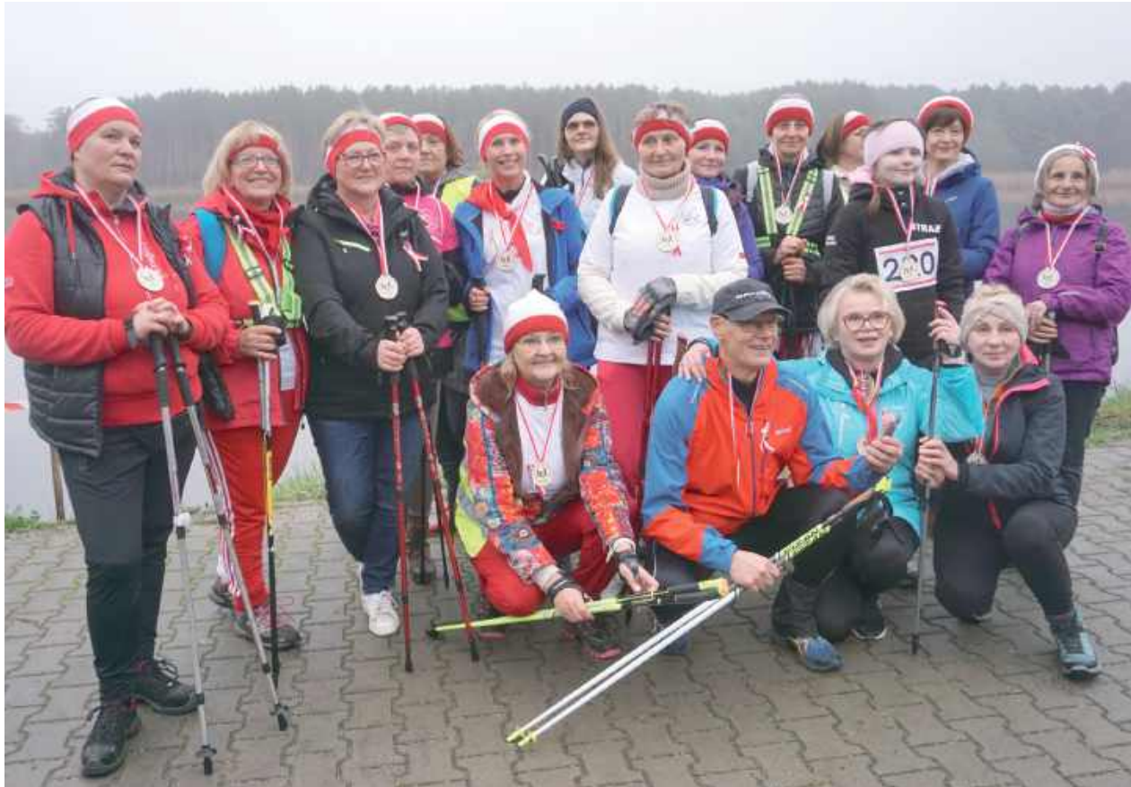
W tym roku chętnych do uczczenia Święta Niepodległości na sportowo znowu nie brakowało