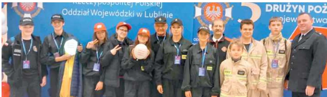
Powiat opolski reprezentowały trzy drużyny: MDP Janiszkowice, MDP Łaziska oraz MDP Poniatowa Miasto

W sobotę, 8 listopada w hali widowiskowo-sportowej Akademii Wychowania Fizycznego w Białej Podlaskiej odbyło się wyjątkowe spotkanie młodych strażaków – V Sejmik Młodzieżowych Drużyn Pożarniczych województwa lubelskiego. Wzięli w nim udział także przedstawiciele naszego powiatu.