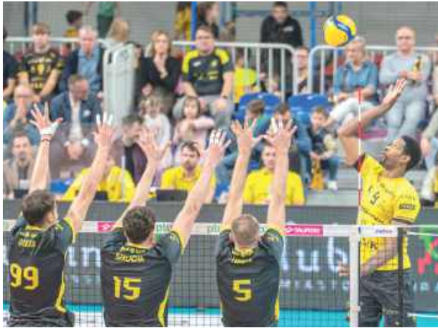
Siatkarze z Lublina zaliczyli dwie kolejne porażki

Początkowy set starcia był dość wyrównany i w jego trakcie żadna ze stron nie zdołała odskoczyć punktowo w znaczący sposób. W końcówce skuteczniejsi w ataku byli podopieczni trenera