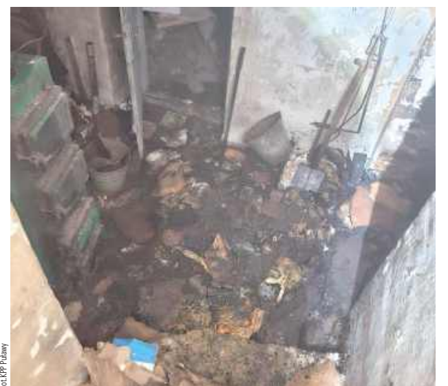
Ogień pojawił się w kotłowni. 71-latek próbował ugasić pożar samodzielnie, niestety uległ poważnym poparzeniom