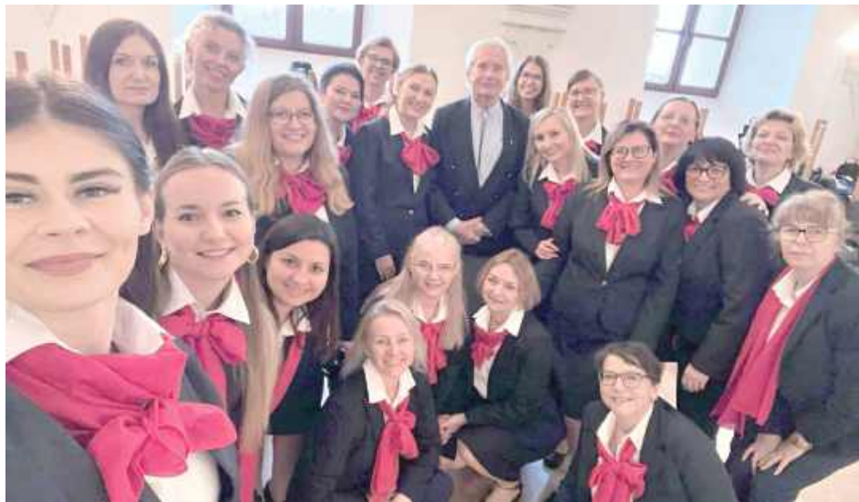
Chór Szczygiełki Fenix z Poniatowej, który występował w kategorii Cantantes Sacram odniósł imponujący sukces, zdobywając Złoty Dyplom oraz Nagrodę Specjalną za najlepsze wykonanie utworu maryjnego