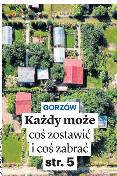
FOT. MAGDA MARZALEK