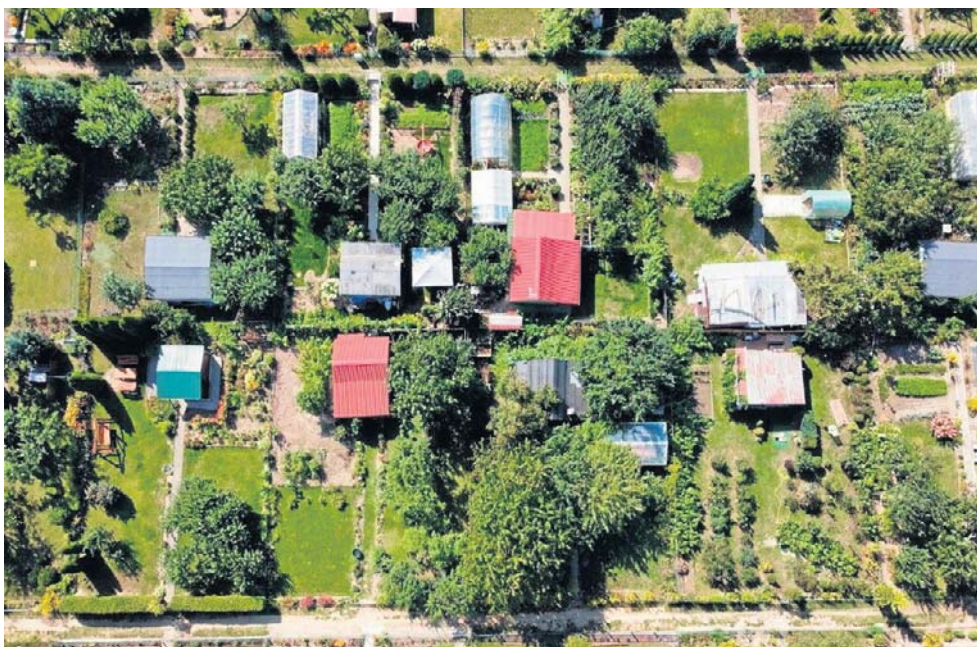
Zostaw sadzonkę, zabierz sekator. Tutaj nic się nie marnuje

- Na każdej działce zdarza się, że wysiejemy za dużo sałaty, pomidorów czy kwiatów. Zamiast wyrzucać nadmiar sadzonek, możemy podzielić się