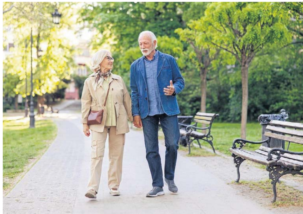
Mikroklimat Nałęczowa sprzyja obniżaniu ciśnienia i regeneracji serca

● Kołobrzeg i Swinoujście - nadmorskie uzdrowiska, gdzie leczenie wspiera także klimat morski.