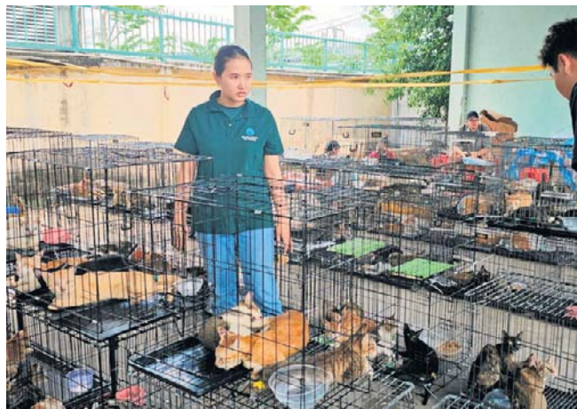
Ponad 40 porwanych kotów wróciło do właścicieli po tym, jak wietnamska policja rozbiła gang złodziei kotów

Jednak sprzedawcy muszą posiadać certyfikaty pochodzenia zwierząt, co ma na celu zapewnienie, że zwierzęta nie pochodzą z nielegalnych źródeł. PAP