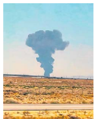
Na nagraniach widać dym nad miejscem katastrofy

Informacje te potwierdził oficjalny profil bazy Edwards w mediach społecznościowych. „Na miejscu niezwłocznie pojawiły się zespoły ratownicze” - podkreślono, dodając, że dalsze informacje zostaną