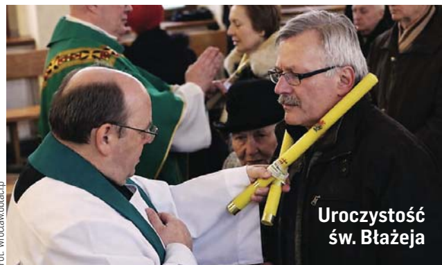
Uroczystość św. Błażeja

się o uchronienie od chorób gardła oraz o łaskę zdrowia. W niektórych regionach Polski, m.in. na Śląsku Cieszyńskim, święcono tego dnia także jabłka. Zjedzenie poświęconego owocu miało