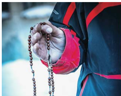
Zimowa mapa pomocy | 4