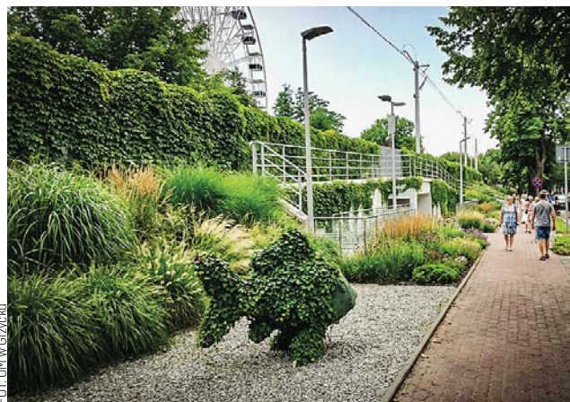
Projekt koncepcyjny autorstwa Diany Czechowskiej

„W tej strefie dominować mają krzewy, byliny, zioła oraz niskie drzewa i pnącza, m.in. bluszcz i chmiel, który naturalnie występował tu wcześniej. Dalej, w kierunku miasta i drogi, pojawi się kolejny pas zieleni z trawami ozdobnymi i mieszanką ga-