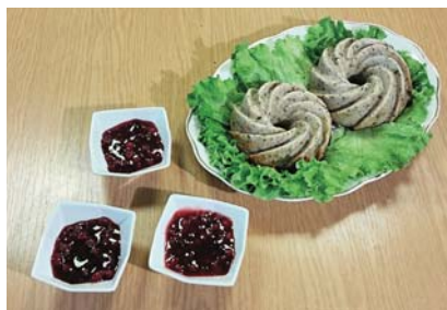
Medialny sukces warmińskiego śledzia | 2