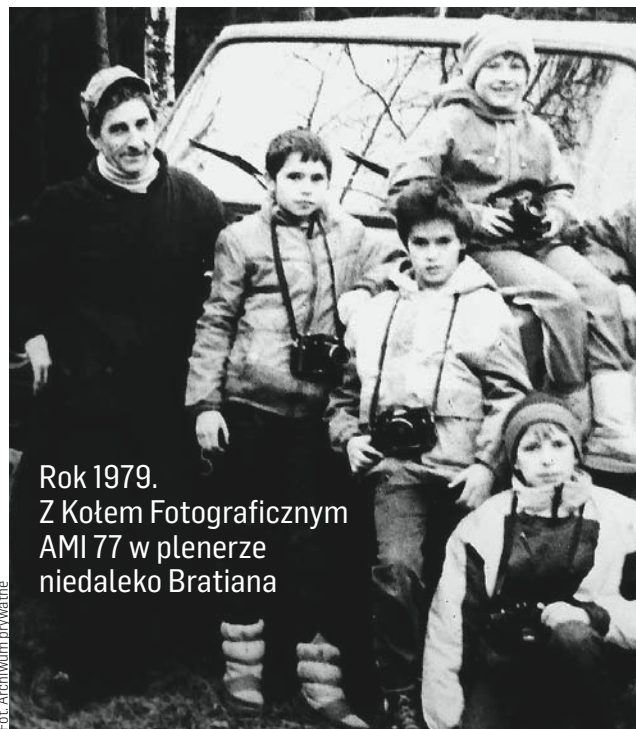
Rok 1979. Z Kołem Fotograficznym AMI 77 w plenerze nieдалeko Bratiana

Kroniki z wycinków prasowych stały się ważną częścią jego życia. Był zapalonym czytelnikiem lokalnej i regionalnej prasy. Wybierał interesujące artykuły, wycinał je, opatrywał własnymi komentarzami i wklejał do albumów. Gdy odbywały się pogrzeby ważnych postaci, czekał przed kościołem na wyjście konduktu, by zabrać nekrologi z tablicy ogłoszeń — one również trafiały do kronik. Do dziś zgromadził ponad czterdzieści tomów, które wypełniają domowe regały, a część z nich przechowywana jest nawet