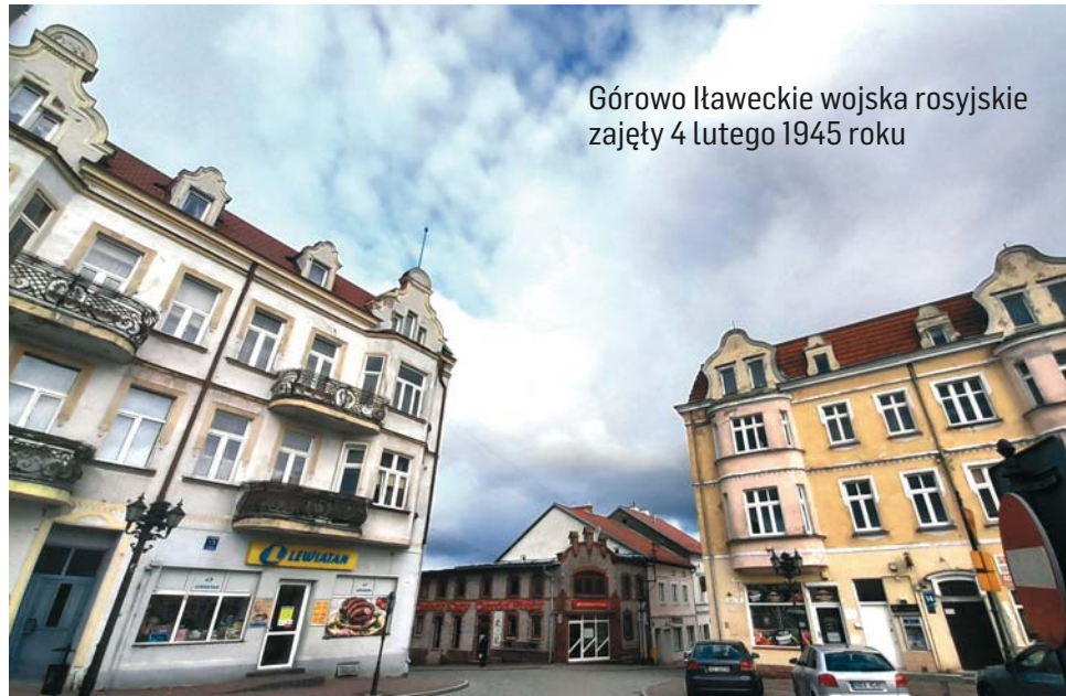
Górowo Iławeckie wojska rosyjskie zajęły 4 lutego 1945 roku

Pruska Iława nie była anonimowym miejscem na militarnej mapie świata. 7 i 8 lutego 1807 roku armia Napoleona stoczyła tam krwawą bitwę z rosyjskimi i pruskimi wojskami. Padło w niej lub zostało rannych prawie 50 tysięcy żołnierzy. Była to jedna z najkrwawszych bitew epoki napoleońskiej.