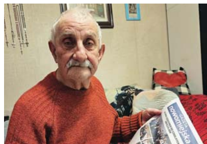
Tworzy unikatową kronikę swojego miasta | 5