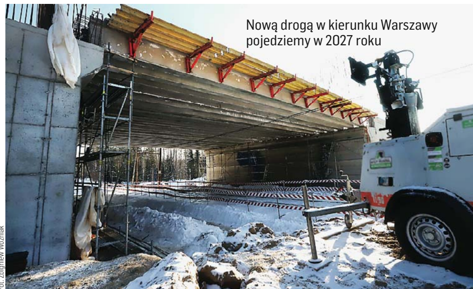
Nową drogą w kierunku Warszawy pojedziemy w 2027 roku

Powstający na wylocie Olsztyna w kierunku Warszawy nowy wiadukt nabiera kształtów. Trwają przygotowania do budowy Nowobałtyckiej a trzy podolsztyńskie gminy przygotowują się do budowy północnej obwodnicy miasta.