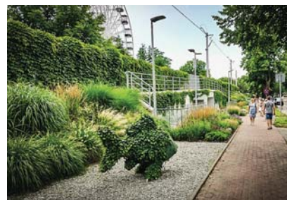
Zastąpią tory roślinami. Po co? | 6