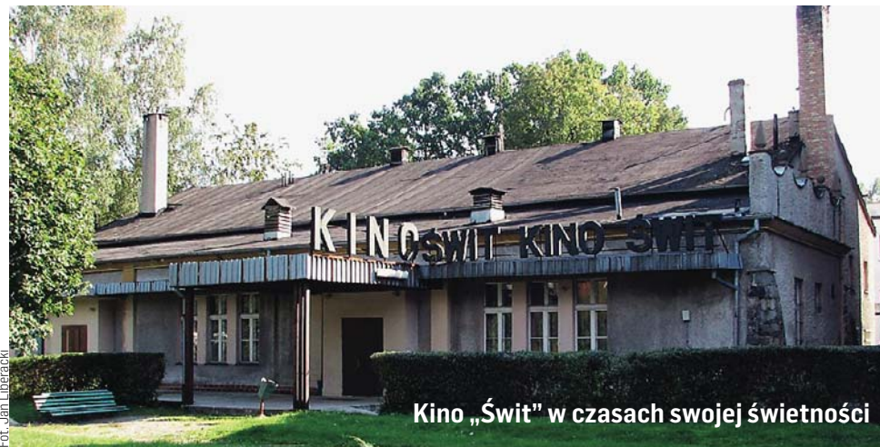
Kino „Świt” w czasach swojej świetności

— Od dłuższego czasu mówimy o tym, że chcemy, by swoje miejsce znalazła tam szkoła muzyczna, która dziś mieści się w niezbyt