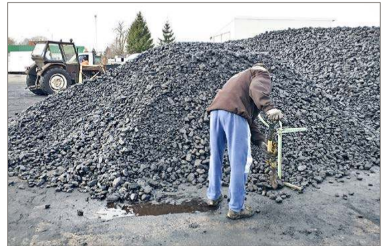
Palenie węglem znacznie przyczynia się do zanieczyszczenia powietrza.