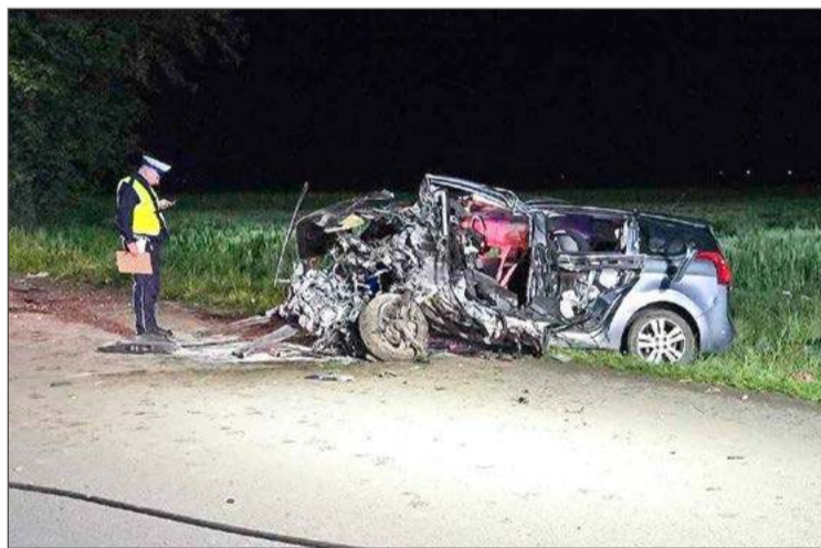
Peugeot był bardzo mocno rozbity.

- Natomiast nie nawiązywał kontaktu z ratownikami - podkreśla rzecznik.