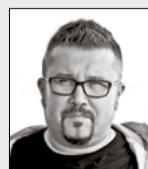
ratuszniak@ol.com.pl tel. 14 670 27 80