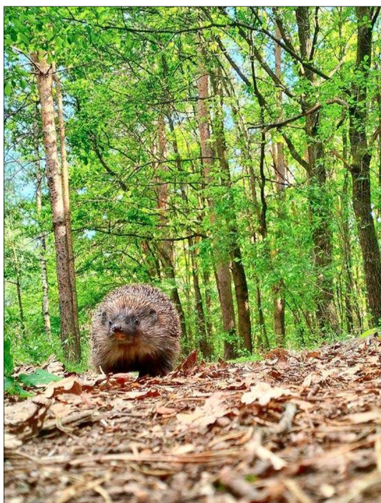
Wiosna w Grabinach.