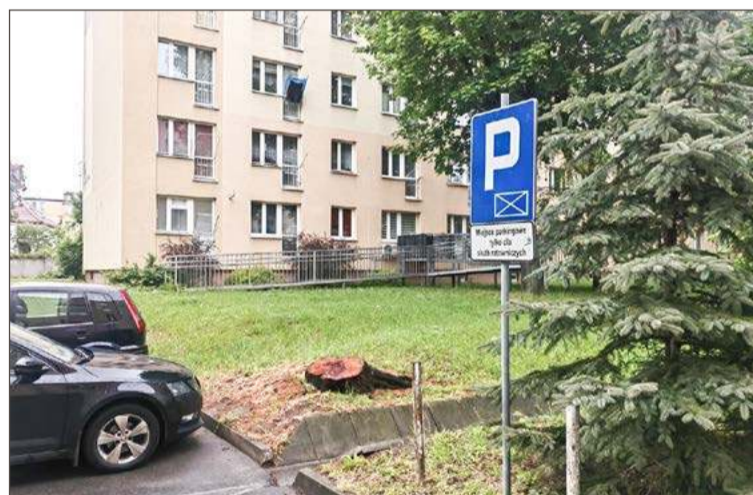
Jedno drzewo zostało wycięte, stało za blisko parkingu.

kreśla, że na wycinkę spółdzielnia musiała uzyskać zgodę z Urzędu Miasta oraz ponieść koszty prac.