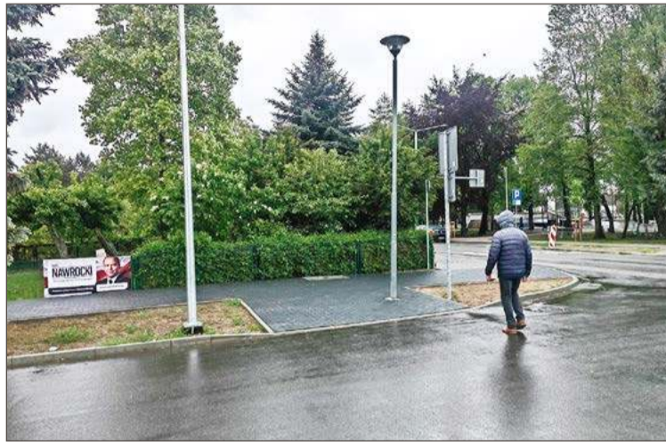
Już wiadomo, z jakiego powodu w obrębie przejścia znajduje się lampa.

Ale to niejedyny remontowy bubel, na jaki zwracają uwagę mieszkańcy miasta.