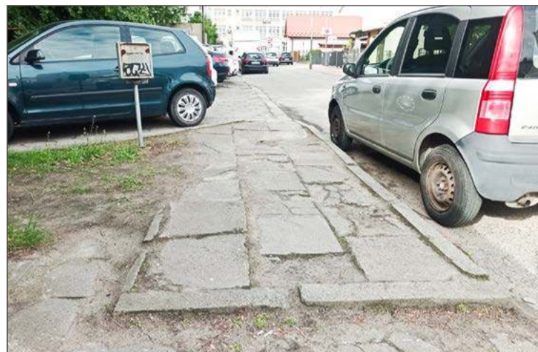
Chodniki przy ul. Targowej pamiętają zamierzchłe czasy.

Do jego realizacji, co zresztą wiadać, ostatecznie jednak nie doszło, z prozaicznego powodu - braku pieniędzy.