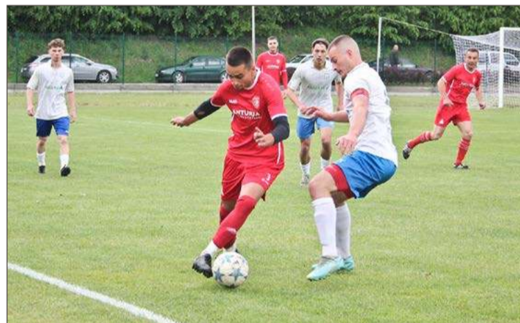
Głowaczowa (na czerwono) strzeliła cztery bramki Brzostowiance.

Igloopol II Dębica - Victoria Czermin 6:5 (4:1)