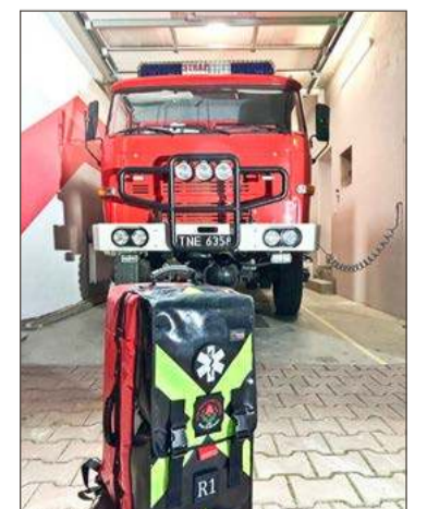
Strażacy z Woli Żyrakowskiej ciągle doskonalą swoje umiejętności.