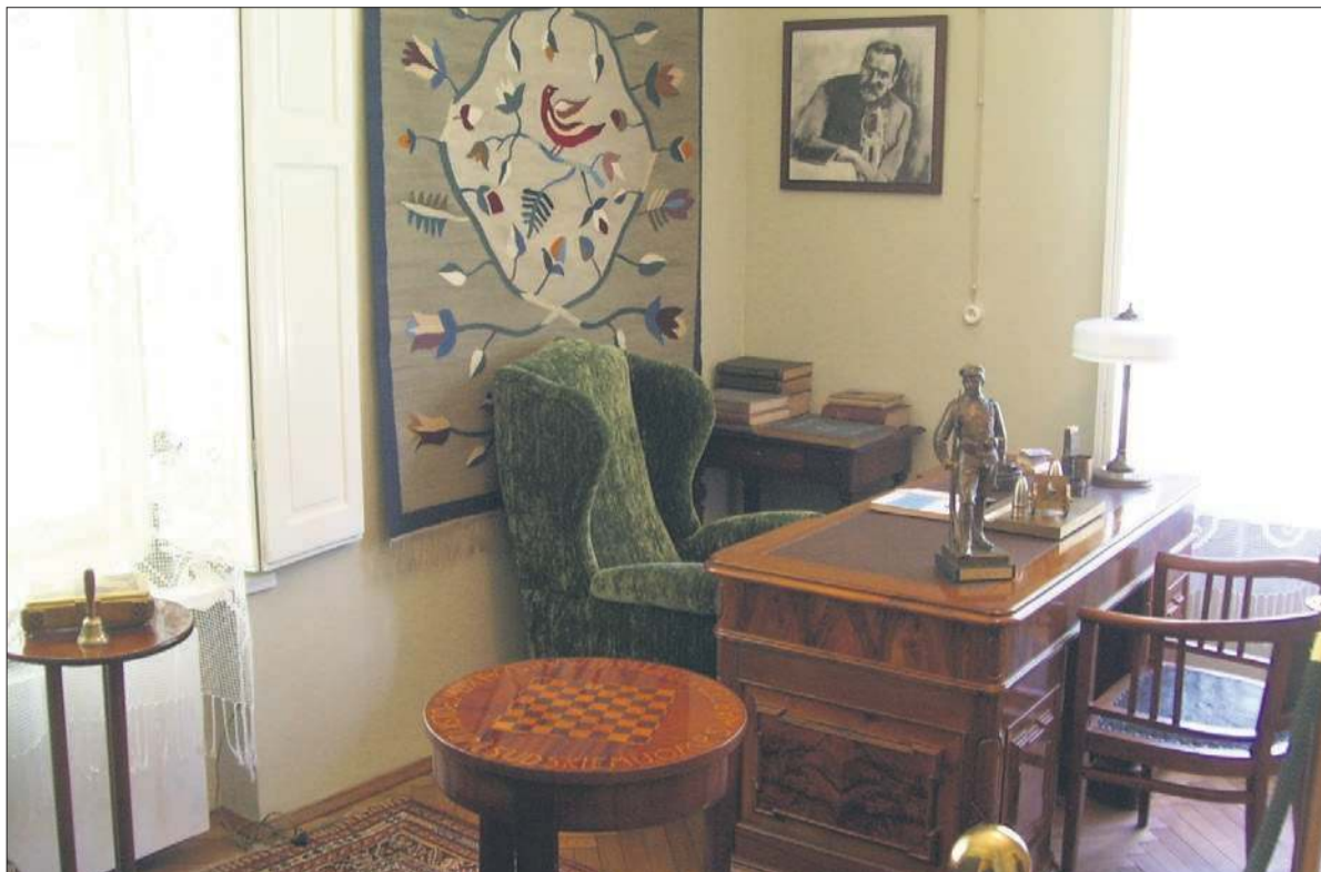
Gabinet marszałka Józefa Piłsudskiego w „Milusinie”