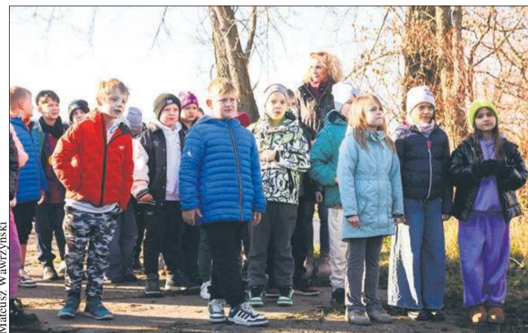
Dzieci wzięły również udział w warsztatach ekologicznych