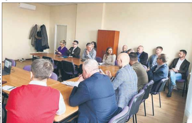
W Starostwie Powiatowym w Płocku odbyło się spotkanie poświęcone pogłębianiu Wisły