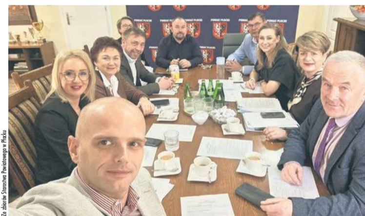
Zarząd Powiatu Płockiego przyjął uchwałę dotyczącą projektu budżetu na 2026 rok