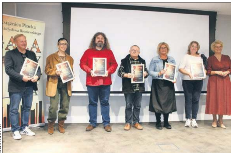
Książnica podziękowała osobom i instytucjom wspierającym jej działalność