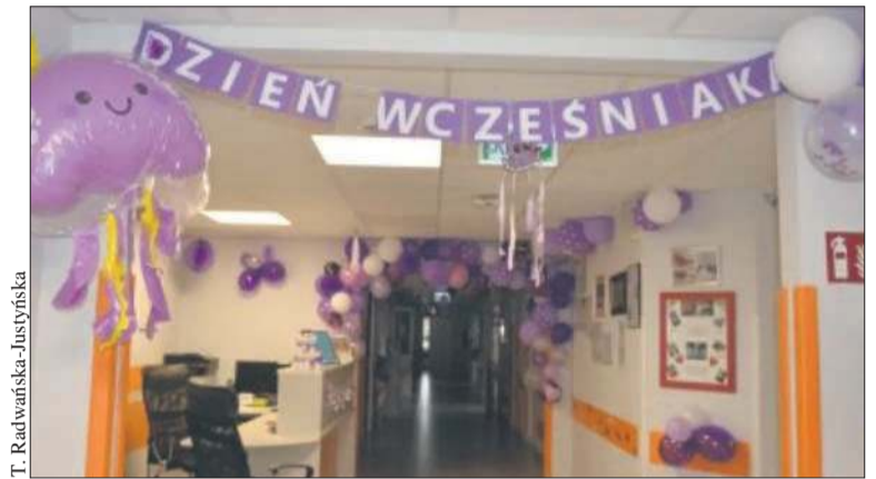
W tym roku w WSZ na Winiarach po raz 10. świętowano Dzień Wcześniaka