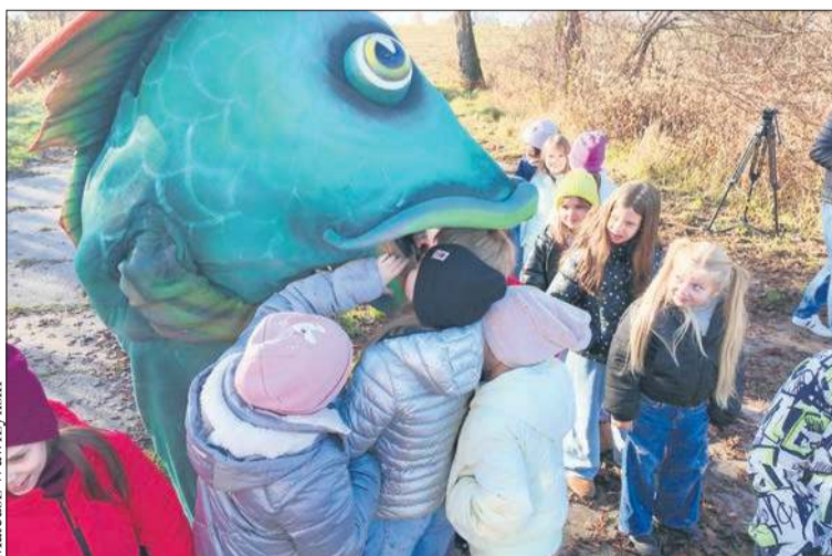
Na najmłodszych czekała maskotka przedstawiająca karpia