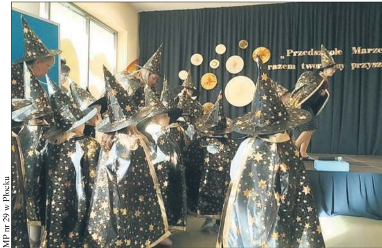
W MP nr 29 wszystkie przedszkolne grupy otrzymały swoje nazwy. Wyjątkowa ósemka to: Strażnicy Uśmiechu, Czarodzieje Marzeń, Podróżnicy w Czasie, Mistrzowie Pomysłów, Wędrowcy po Chmurach, Drużyna Marzeń, Gwiazdy Inspiracji, Odkrywczy Świata