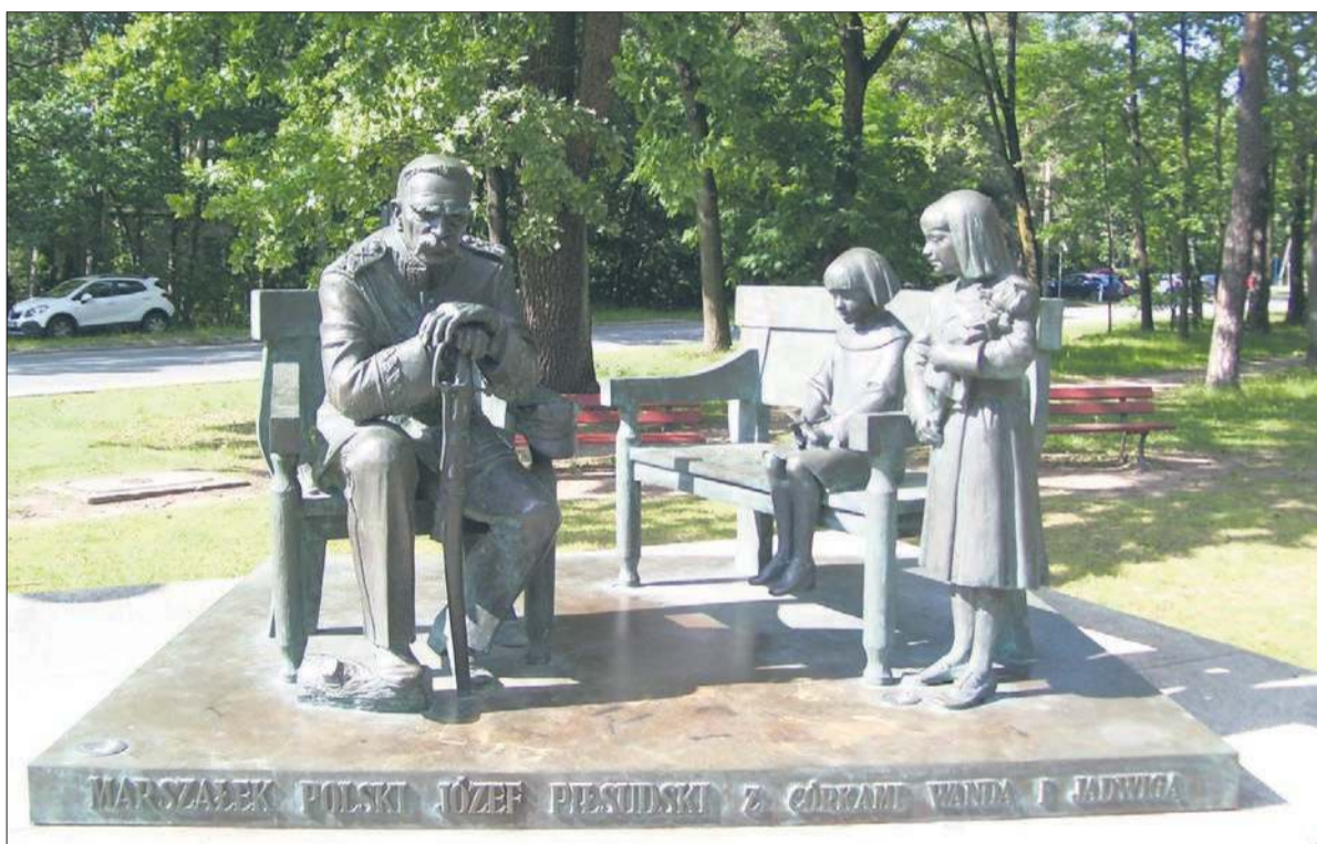
Pomnik Józefa Piłsudskiego z córkami na Skwerze Niepodległości w Sulejówku