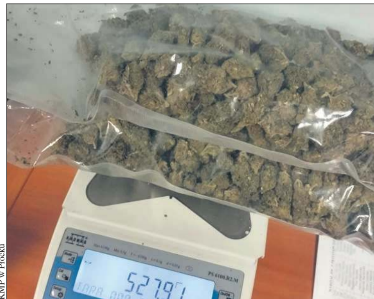
KMP w Płocku