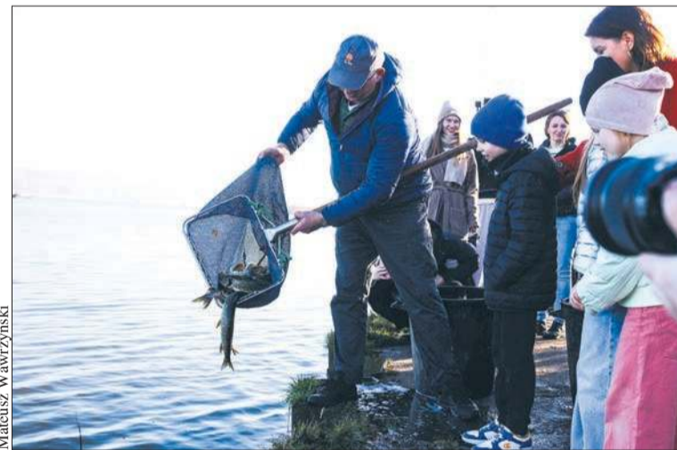
W akcji zarybiania pomogły dzieci