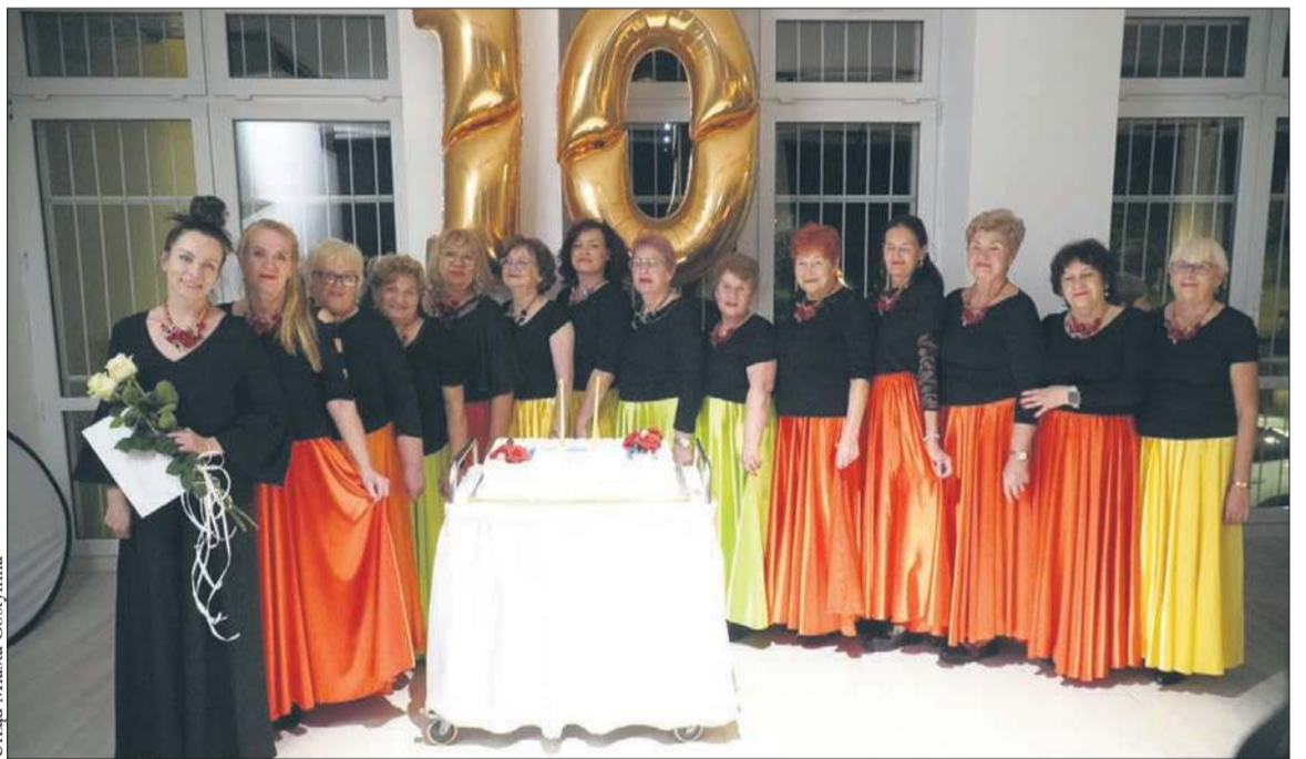
Sekcja „Taniec w Kręgu” GUTW z jubileuszowym tortem