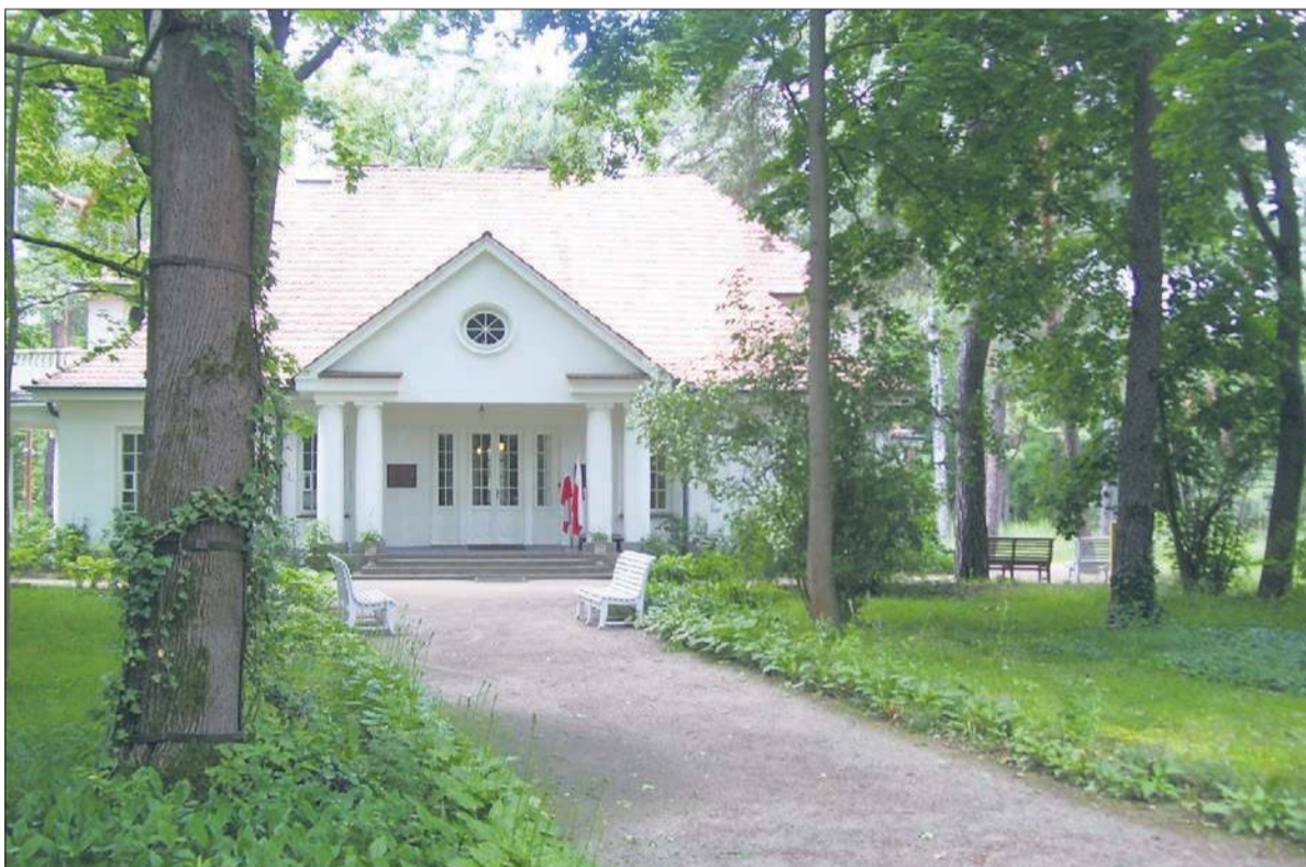
Dwór „Milusin” od frontu

Zwiedzanie wystawy ułatwia audio przewodnik wprowadzający tematycznie w przestrzeń poszczególnych galerii. Minimalny czas, jaki trzeba przeznaczyć na obejrzenie całej ekspozycji, to co najmniej dwie godziny. Obok muzeum – na Skwerze Niepodległości jest pomnik siedzącego w mundurze wojskowym, wspierającego się na szabli, z córkami, zatytułowany „Lekcja historii”. Młodsza córka, Jadwiga, siedzi na ławeczce, trzymając w ręku model samolotu, a starsza, Wanda, stoi, trzymając w ręku szma-