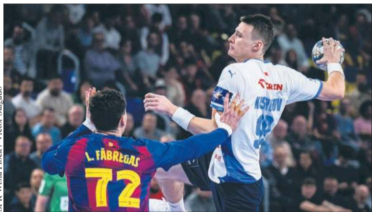
SPR Wisła Płock / Victor Salgado

Pozostałe wyniki: GOG – PSG 28:31, Magdeburg – Zagrzeb 27:22, Eurofarm Pelister – Pick Szeged 25:24. Jol.