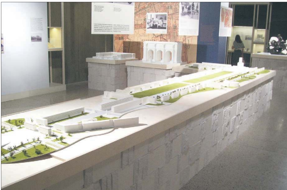
Wystawa stała w Muzeum Józefa Piłsudskiego