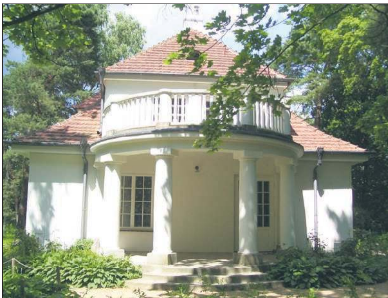
Willa „Milusina” od strony południowej