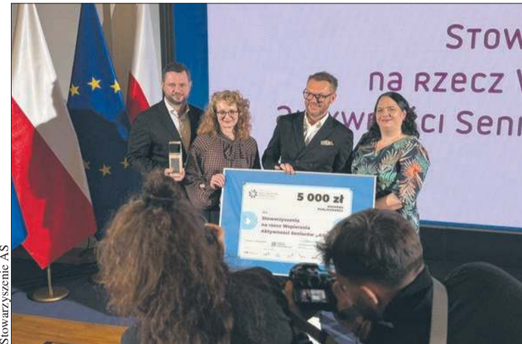
W tegorocznej edycji konkursu im. Jacka Kuronia Stowarzyszenie AS otrzymało nagrodę w kategorii „Pomysł na Rozwój” oraz Nagrodę Publiczności