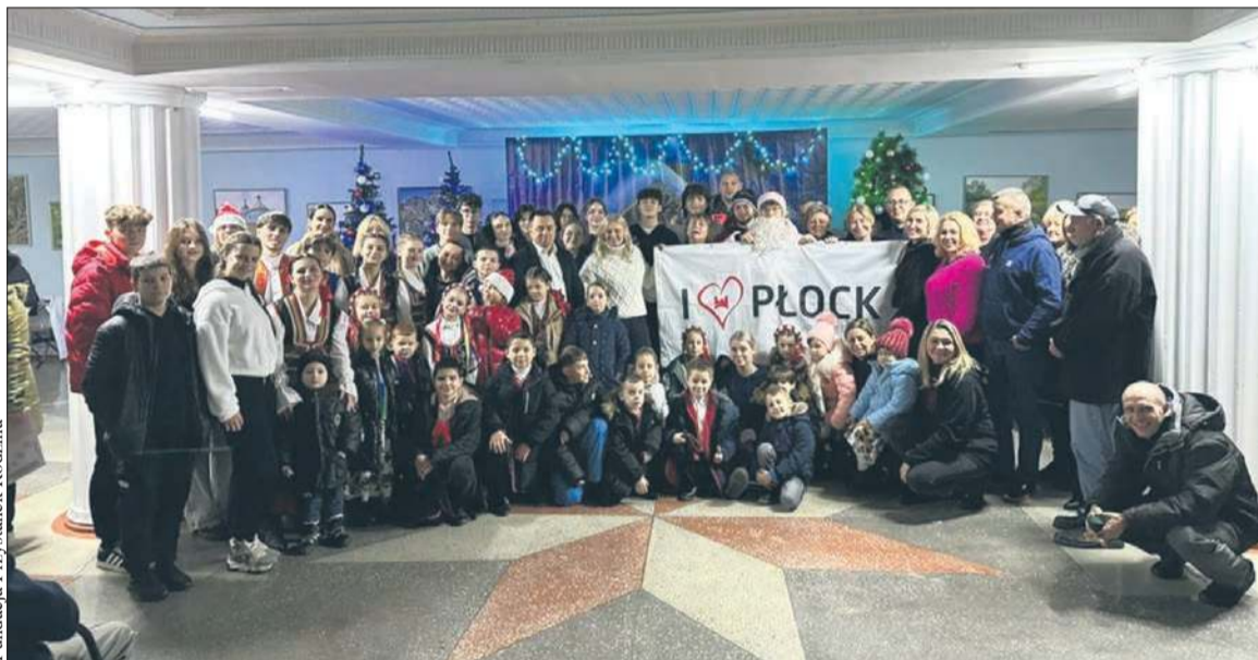
Akcja „Paka dla Rodaka” to okazja do wzruszających spotkań z Polakami żyjącymi poza granicami naszego kraju