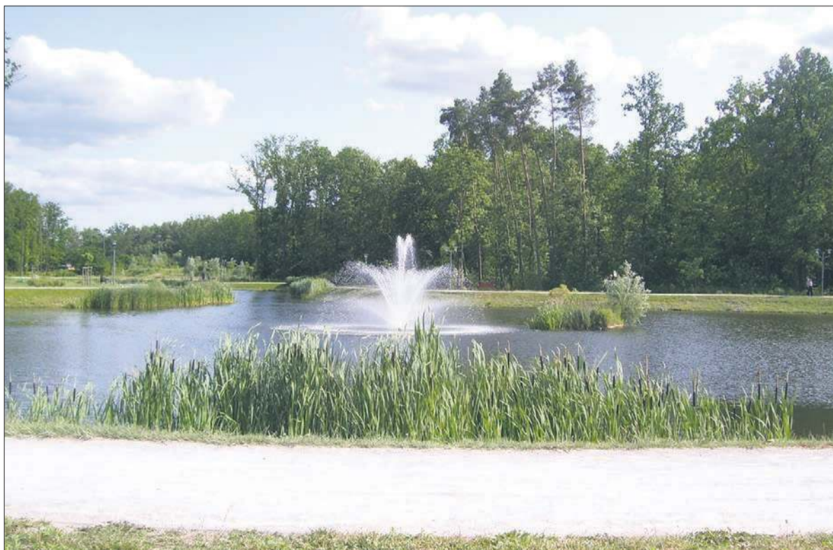
Park Glinianki w Sulejówku