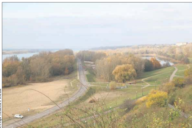
Urząd Miasta Płocka