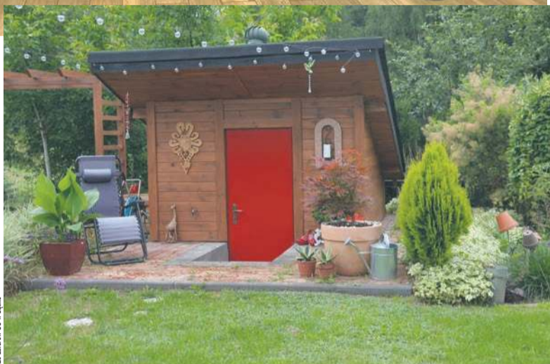
Tak prezentuje się jeden z nagrodzonych ogrodów