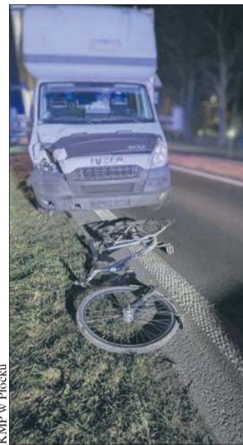
Zdjęcie z wypadku w na DK 10 w Drobinie

- Przechodź i przejeżdżaj przez jezdnię wyłącznie w miejscach do