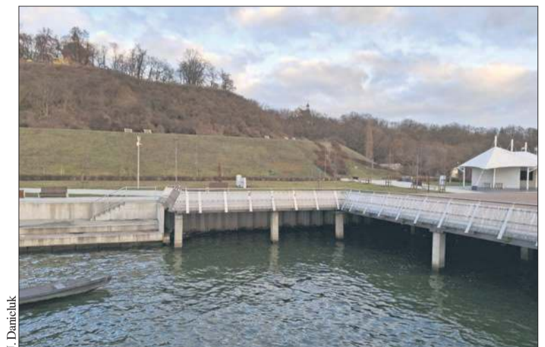
Nabrzeże w rejonie nasady mola wymaga remontu