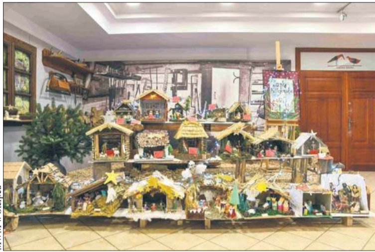
MWM w Sierpcu

Czas świątecznych przeżyć coraz bliżej, a to oznacza, że już można myśleć o projektach świątecznych szopek na doroczny konkurs organizowany w sierpeckim skansenie. Rokrocznie organizatorzy otrzymują po kilkadziesiąt prac. Jak podkreślają organizatorzy, cieszy tak duża ilość prac i duże zainteresowanie uczestników tym tematem. A nadsyłane, wyjątkowe i bardzo pomysłowe prace nadają skansenowi wyjątkowy, jeszcze bardziej świąteczny kolor. Młodemu artyście nie brakuje pomysłowości i talentu. Rokrocznie ich prace zaskakują jurorów i zachwycają niepowtarzalnym pięknem.