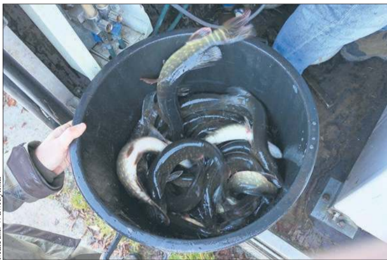
3500 młodych szczupaków trafiło do Wisły