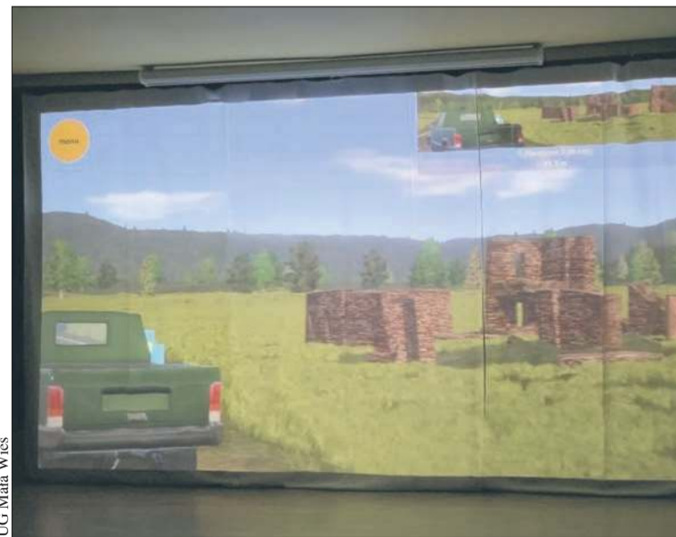
UG Mała Wieś