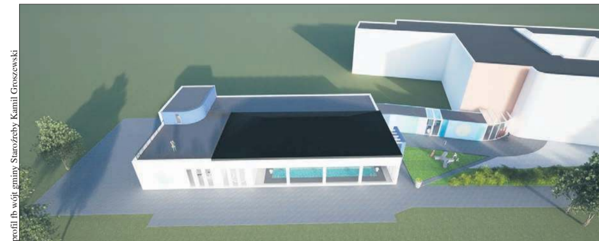
profil fb wójt gminy Staroźreby Kamil Groszewski

Włodarz gminy podpisał umowę dotyczącą budowy obiektu w sierpniu