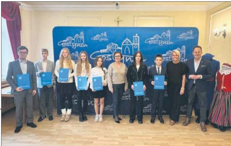
Najzdolniejsi gostynińscy uczniowie zostali wyróżnieni Stypendium Burmistrza

Stypendium Burmistrza Miasta Gostynina to wyróżnienie przyznawane wybitnym uczniom szkół podstawowych i ponadpodstawowych. Trafia ono do najzdolniejszych, którzy w minionym roku szkolnym osiągnęli szczególne sukcesy o zasięgu ponadlokalnym w kategoriach: osiągnięcia w nauce, osiągnięcia artystyczne oraz osiągnięcia sportowe.