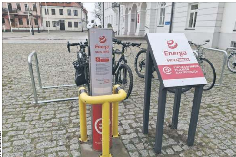
Stacja ładowania dla samochodów elektrycznych na Starym Rynku