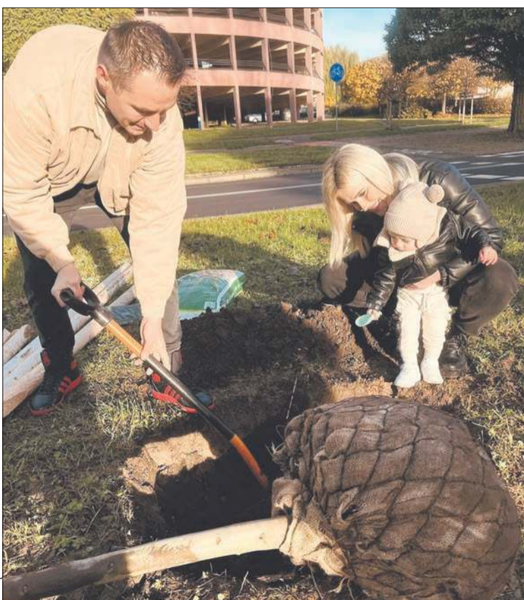
„Drzewa Młodych Płocczan” zostały posadzone między innymi na ulicy Tysiąclecia

To już kolejna odsłona corocznej akcji „Drzewa Młodych Płocczan”. W ubiegłym tygodniu rośliny zostały posadzone między innymi na ulicy Tysiąclecia.