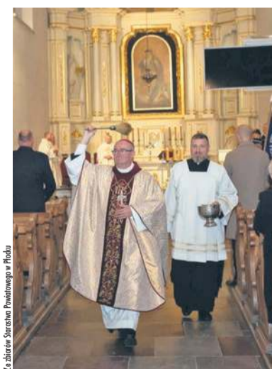
Mszę św. w intencji zmarłych strażaków koncelebrował Biskup Płocki Szymon Stułkowski

Wspólnie z Druhnam i Druhami z całego powiatu płockiego modliłem się za tych, którzy odeszli już na wieczną wartę – powiedział Starosta Płocki Sylwester Ziemkiewicz.