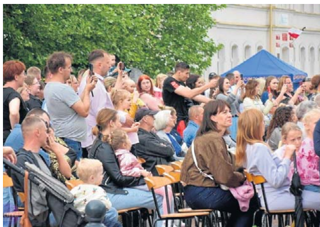
Jarmark Kazimierzowski ponownie przyciągnął do Kowala tłumy - nie tylko mieszkańców miasta

Tegoroczna edycja wydarzenia po raz kolejny pokazała, że Jarmark Kazimierzowski cieszy się ogromnym zainteresowaniem mieszkańców miasta i okolic. Dobra pogoda oraz bogaty program sprawiły, że teren imprezy przez cały dzień tętnił życiem. Na uczestników czekały występy artystyczne, koncerty gwiazd, atrakcje dla naj-