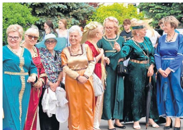
Podczas wydarzenia nie zabrakło osób ubranych w tradycyjne, historyczne stroje

Po oficjalnym otwarciu przyszedł czas na występ dzieci i młodzieży. Na scenie zaprezentowali się uczniowie i wychowankowie lokalnych