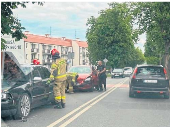
Trzy auta zderzyły się na Wyszyńskiego we Włocławku. Winny 57-latek w Peugeotzie

Dodajmy, że w piątek (29 maja) na ulicach Włocławka i powiatu policjanci - w ramach wojewódzkiej akcji - kontrolowali kierowców pod kątem stosowania się do obowiązujących ograniczeń prędkości. Na drogach można było spotkać większą liczbę mundurowych wykorzystujących mierniki prędkości oraz wideorejestratory. Funkcjonariusze w czasie działań skontrolowali ogółem 236 kierowców, 204 przekroczyło dozwoloną prędkość. ©©