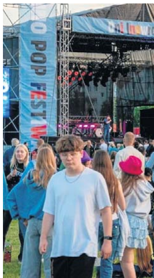
Impreza odbędzie się przy ul. Błażka na Rąbinie

Kulminacyjnym punktem święta miasta będzie jednak Ino Pop Fesiwal. To właśnie wtedy scena w zbiegu ul. dra Ludwika Błażka i Jana Molla zamieni się w centrum największych muzycznych emocji. Pierwszego dnia festiwalu publiczność rozgrzeją: Szulerzy (18.00), Varius Manx & Kasia Stankiewicz (20.00) i Smolasty