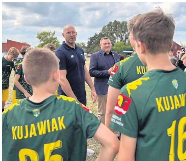
Wyniki programu dla woj. kujawsko-pomorskiego podano w Dzień Dziecka na lotnisku w Kruszynie

Dodajmy, że dziś podpisana zostanie umowa na realizację inwestycji pn. „Budowa Powiatowego Centrum Sportu i Rekreacji w Kruszynie”. Wartość przedsięwzięcia wynosi 159 976 326,42 zł. Jest to największy projekt inwestycyjnym w historii samorządu powiatu włocławskiego. Zadanie zrealizuje firma Dekpol z miejscowości Pinczyn. ©