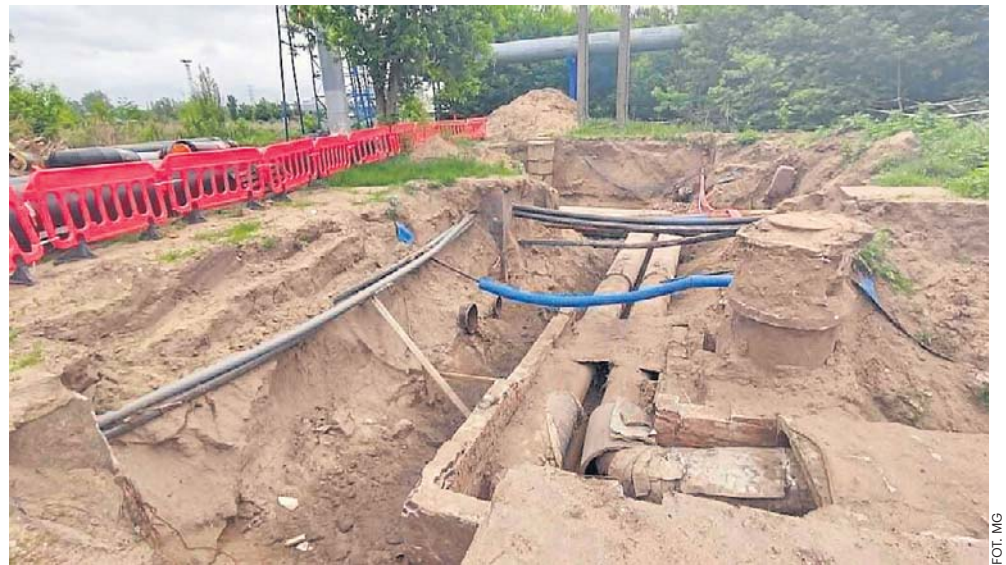
Jednym z kluczowych zadań inwestycyjnych zaplanowanych przez MPEC są roboty w rejonie ul. Barskiej, gdzie w lutym doszło do awarii

Zgodnie z harmonogramem przekazanym przez włocławski MPEC, wstrzymanie dostaw za-