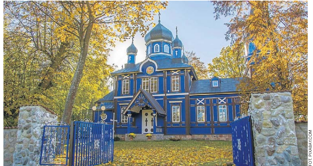
Warto odwiedzić np. piękne i klimatyczne Podlasie, gdzie znajduje się aż 150 prawosławnych cerkwi, to największe zagęszczenie świątyń prawosławnych w Polsce

Czeki nie będzie można wymienić na gotówkę ani wykorzystać w częściach.