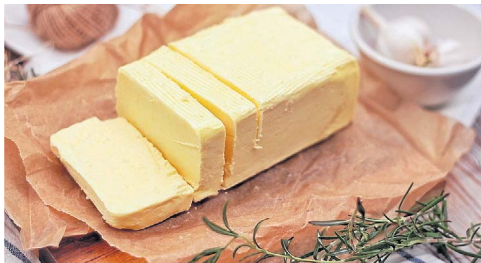
Jednym z powodów radykalnego spadku cen masła jest wzrost produkcji mleka na świecie w 2025 r. Nadwyżki surowca zostały przeznaczone na produkcję masła

W masle obecne są rozpuszczalne w tłuszczach witaminy