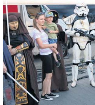
Organizatorzy przygotowali program rozpisany na dziesięć dni

Tegoroczne widowiska nawiązują do obchodzonego w regionie Roku Ludzi Kina z Kujaw i Pomorza. Motywem przewodnim mają być twórcy związani z filmem i muzyką filmową.