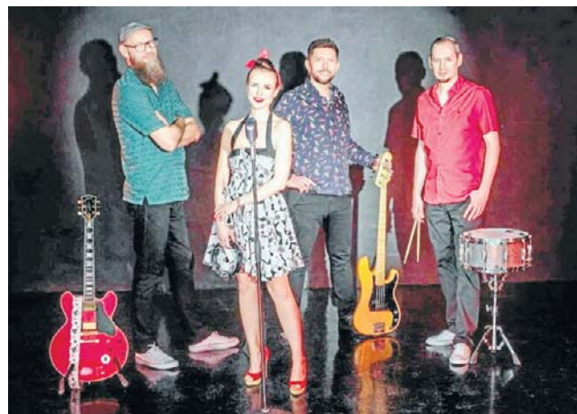
Szulerzy, grający blues'n'roll'a, obchodzą 25-lecie