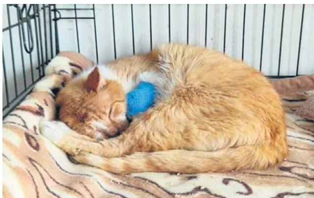
Fundacja KOT z Torunia od ponad 20 lat ratuje i leczy bezdomne koty, chore i po wypadkach

- Teraz mamy ogromny problem: mamy już tylko jeden sprawny samochód. To zdecydowanie za mało. Zwiększa to teraz - w sezonie, gdy liczba zgłoszeń i potrzeb rośnie lawinowo. Nasz „Kotowóz” zepsuł się ostatecznie. Ma 19 lat, ponad 300 tys. przebiegu i ostatnio więcej czasu spędzał w warsztacie niż w pracy - opisuje sytuację Fundacja KOT.