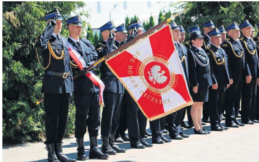
Powiatowy Dzień Strażaka 2026 w Aleksandrowie Kujawskim

Głos zabrał także st. bryg. Andrzej Mucha, Komendant Powiatowy PSP w Aleksandrowie Kujawskim, który przywitał gości, wygłosił okolicznościowe przemówienie oraz podziękował służbom i instytucjom za wzorową współpracę na rzecz bezpieczeństwa mieszkańców powiatu.