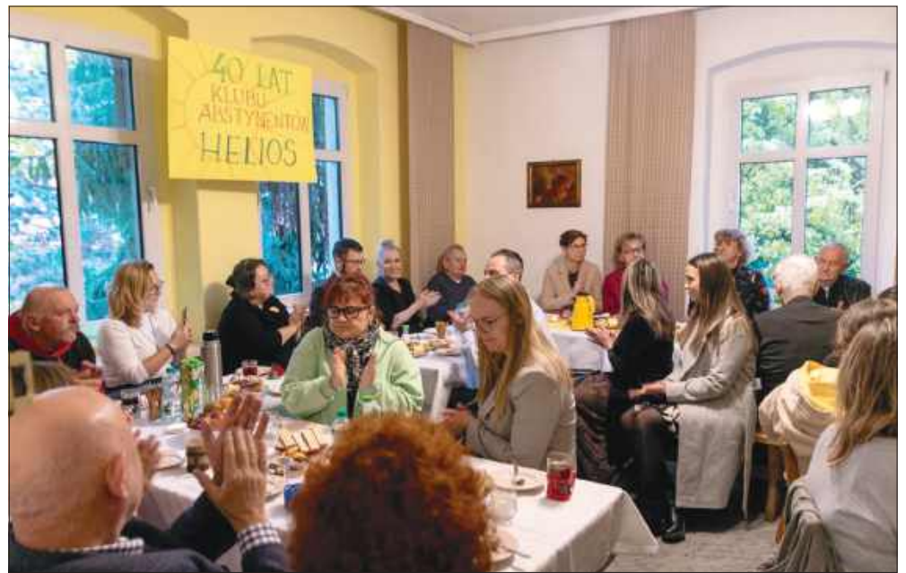
■ Jubileuszowe spotkanie w klubie Helios