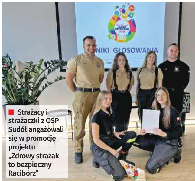
■ Strażacy i strażaczki z OSP Sudół zaangażowali się w promocję projektu „Zdrowy strażak to bezpieczny Racibórz”