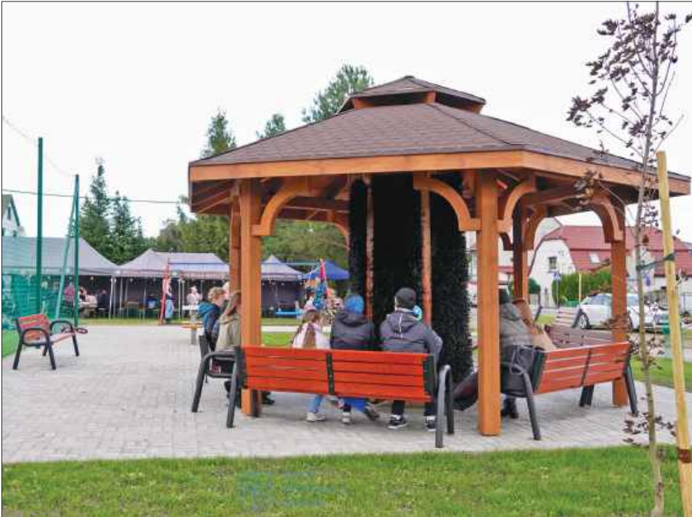
■ Nowy obiekt w Pietrowicach Wielkich gotowy do użytku.