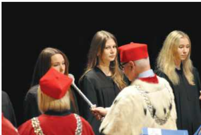
■ Nowi studenci wzięli udział w immatrykulacji