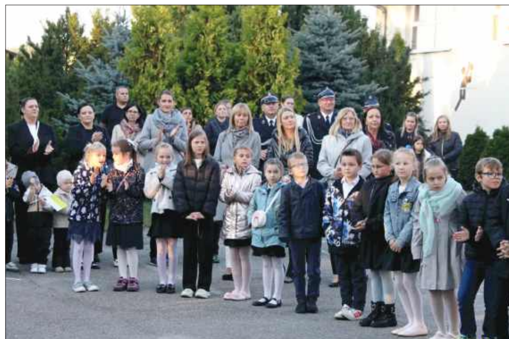
■ Historia szkoły w Górkach Śląskich sięga 1905 roku, kiedy to na gruncie ofiarowanym przez Joannę Gorgoń wybudowano murowany budynek szkolny.