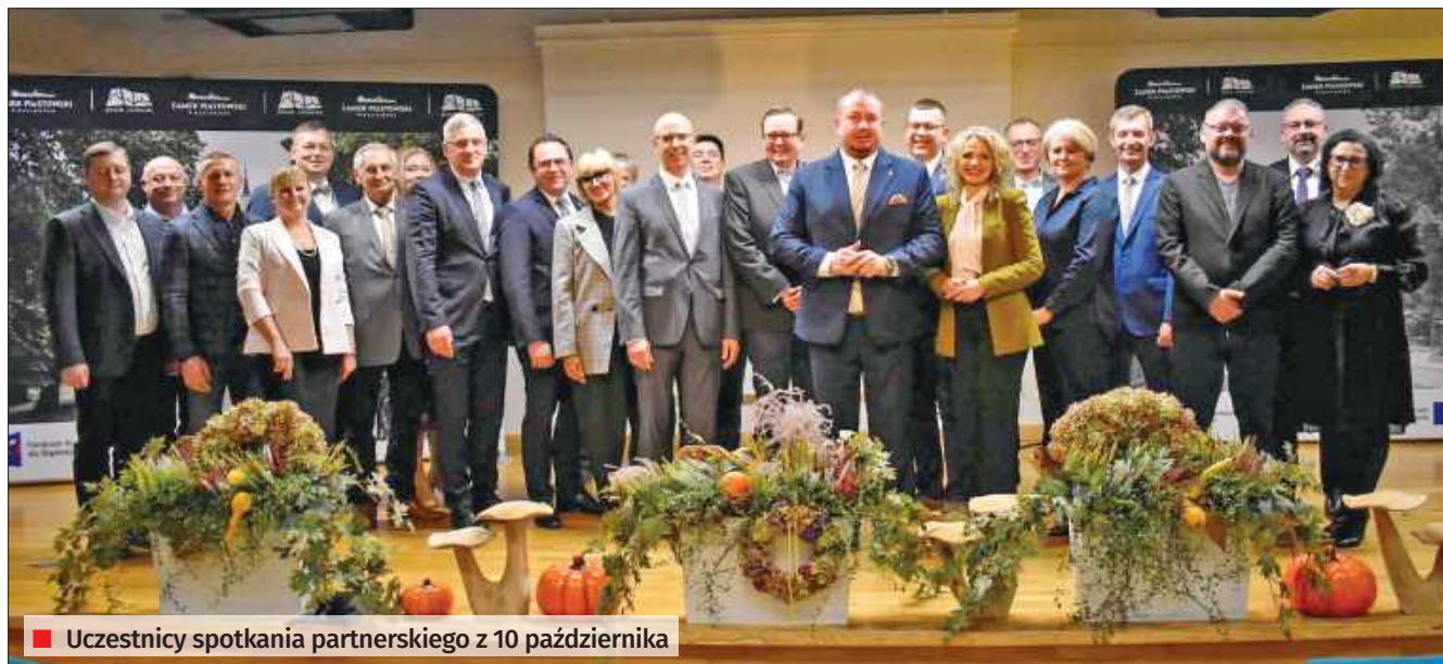
■ Uczestnicy spotkania partnerskiego z 10 października