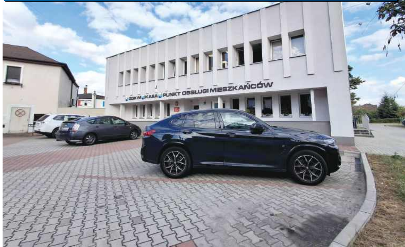
■ Na zdjęciu Zakład Gospodarki Komunalnej i Mieszkaniowej w Kuźni Raciborskiej

Kuźnia Raciborska szuka nowego dyrektora ZGKiM po odwołaniu dotychczasowego szefa. Burmistrz wymaga doświadczenia, wykształcenia i nienagannej opinii. Nowy dyrektor będzie nadzorował majątek zakładu, inwestycje i PSZOK, a także odpowiadał za rozwój zakładu.