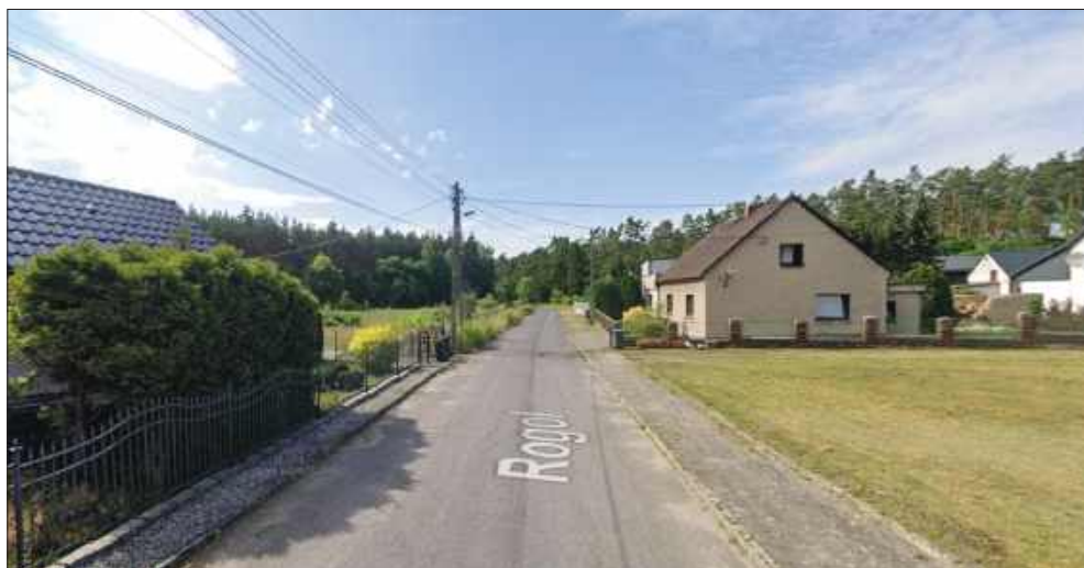
■ Droga prowadzi do lasu, gdzie na końcu znajduje się parking i miejsce do wypoczynku.