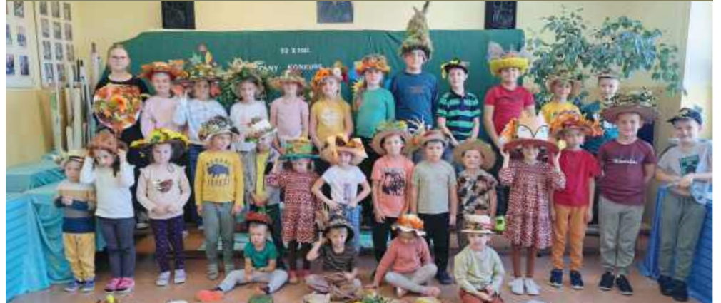
■ Konkurs „Kapelusz Pani Jesieni” w ZSP w Samborowicach.

Jesień zainspirowała uczniów ZSP w Samborowicach do tworzenia nakryć głowy. 3 października odbyła się druga edycja konkursu „Kapelusz Pani Jesieni”.