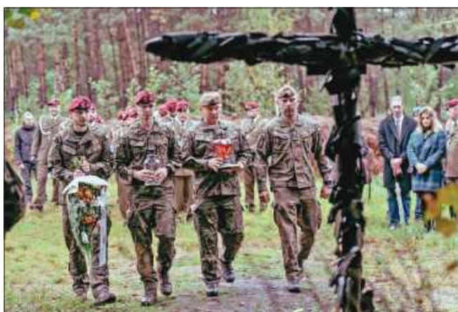
W miejscu wybuchu stoi krzyż upamiętniający dramatyczne wydarzenia, przy którym złożono kwiaty i zapalono znicze.

8 października 2025 roku minęła kolejna rocznica tragicznej śmierci trzech saperów z 6. Batalionu Powietrznodesantowego. W 2019 roku podczas działań