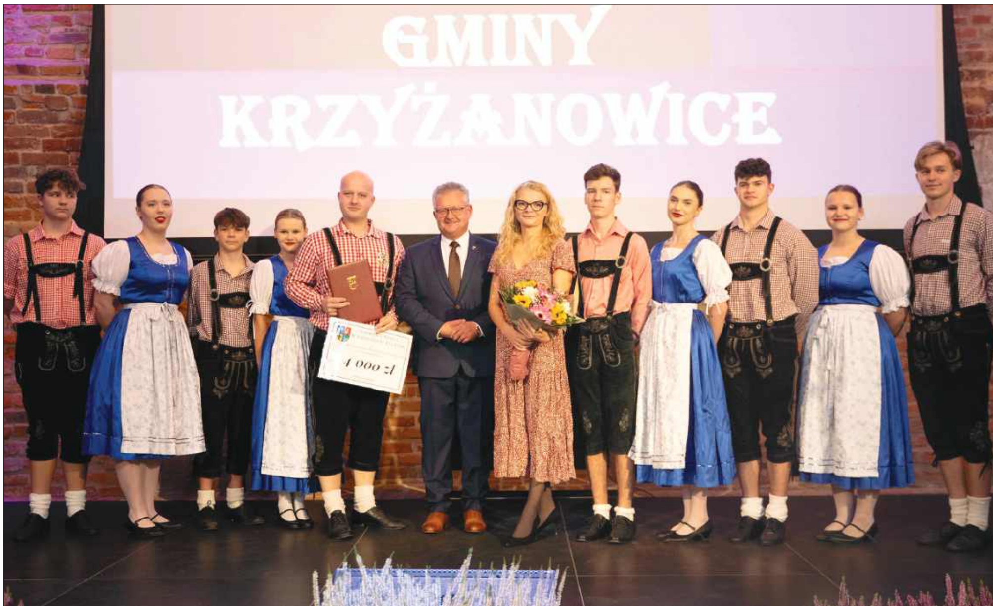
■ Podczas uroczystości wręczono Nagrodę Wójta w Dziedzinie Kultury, która w tym roku trafiła do zespołu „Tworkauer Eiche”.