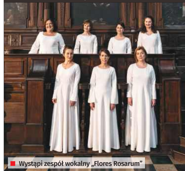
Wystąpi zespół wokalny „Flores Rosarum”

W niedzielę, 19 października, o godzinie 17.00, w bazylice w Rudach zabrzmiały śpiewy inspirowane duchowością dawnych klasztorów żeńskich. Wystąpi zespół wokalny „Flores Rosarum”, który zamknie XXX edycję Festiwalu „Muzyka w starym opactwie”.