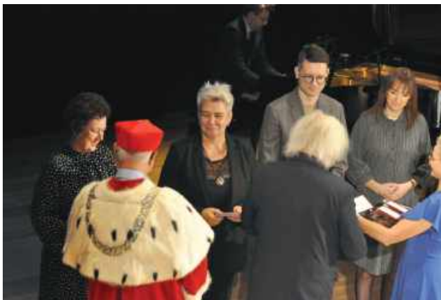
■ Pracownicy ANS otrzymali odznaczenia państwowe