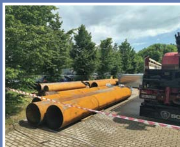
Zaczynają wiercić nad jeziorem Ukiel \2