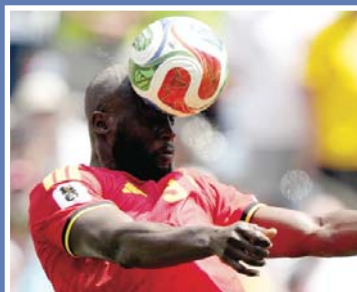
Trzej faworyci mocno rozczarowali \15