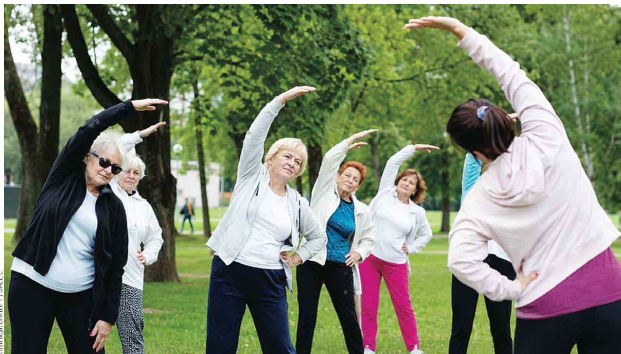
Ilustracja: ChatGPT / DALLE

Zatorze to tylko jeden z przykładów. W czerwcu w Olsztynie odbywają się też bezpłatne zajęcia qigongu na Pieczewie. To spokojne ćwiczenia zdrowotne, oparte na powolnym ruchu, oddechu i koncentracji. Organizatorzy zaplanowali je przy siłowni plenero-