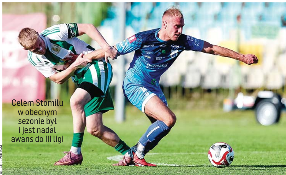
Celem Stomilu w obecnym sezonie był i jest nadal awans do III ligi

W Olsztynie do ostatniej chwili liczono na potknięcie rywali w starciach z Sokolem Ostróda lub Granicą Kętrzyn, jednak lider z Lidzbarska nie popełnił