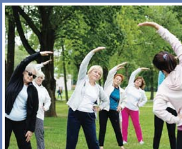
Seniorzy ruszyli w miasto \9