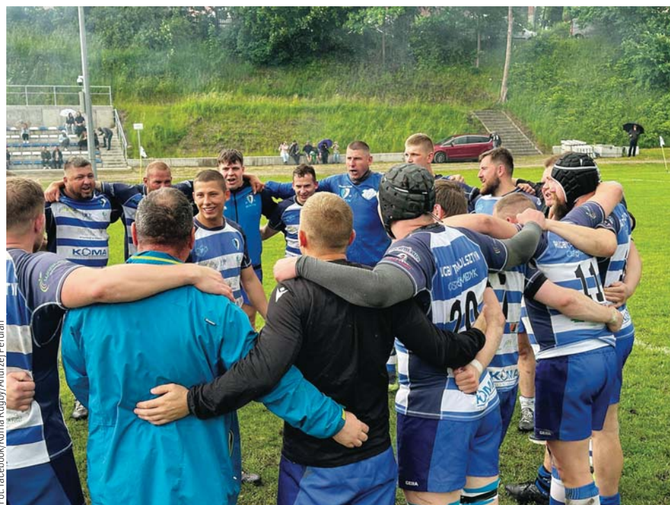
Olsztynianie cieszą się z zasłużonego awansu do I ligi