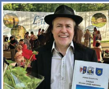
Historyk z marzeniami \7