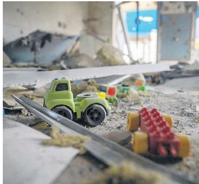
Irańskie pociski spadły na izraelskie przedszkole

Co najmniej 65 osób zostało rannych, w tym siedem ciężko, w wyniku uderzenia irańskiego pocisku balistycznego w miasto Arad na południu