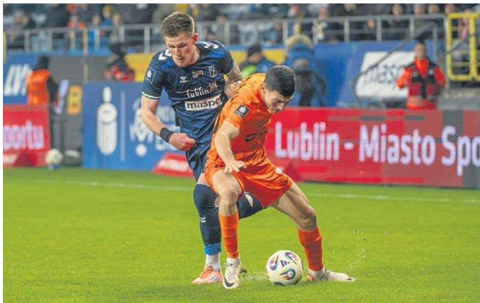
Kibice oklaskiwali zespół Motoru po wygranej nad liderującym dotąd Zagłębiem Lubin