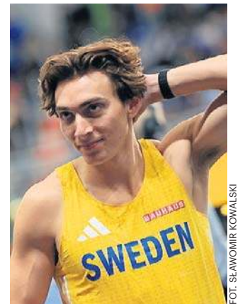
Armand Duplantis - jego rekord świata to dziś 6.31

HMSwlekkooatletyce-4x400sztafeta mieszana: 1. Belgia 3:15.60; 2. Hiszpania 3:16.96; 3. Polska (Duszyński, Gryc, Karolewski, Święty-Ersetic) 3:17.44; 4. Holandia 3:20.14; 5. USA 3:21.35. ©️