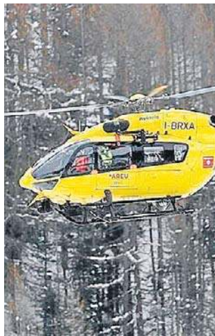
Mimo szybkiej akcji, nie uratowano wszystkich

Austriacki śmigłowiec ratunkowy przewiózł jednego z rannych do szpitala w Innsbrucku. Do pomocy wezwano również 80 ratowników.