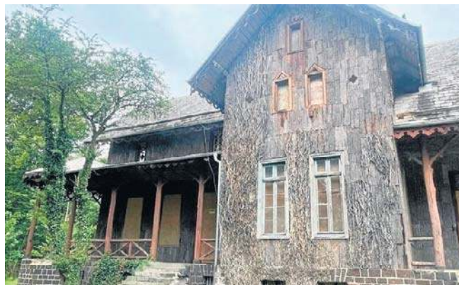
Pałac w Mojej Woli to unikat na skalę europejską

W 2001 roku, obiekt został przekazany Gminie Sośnie celu zagospodarowania turystycznego, a następnie sprzedany osobie prywatnej. Od tego czasu pałac jest zamknięty i zabezpieczony. Teraz został wystawiony na sprzedaż za 2,5 mln zł.