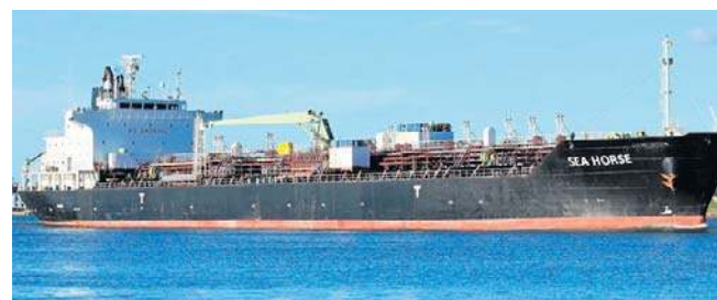
Tankowiec „Sea Horse” uważany za część „floty cieni”, które transportują rosyjską ropę i gaz

Wiceminister spraw zagranicznych Kuby Carlos Fernandez de Cossio powiedział, że „system polityczny Kuby nie podlega negocjacji ze Stanami Zjednoczonymi”.