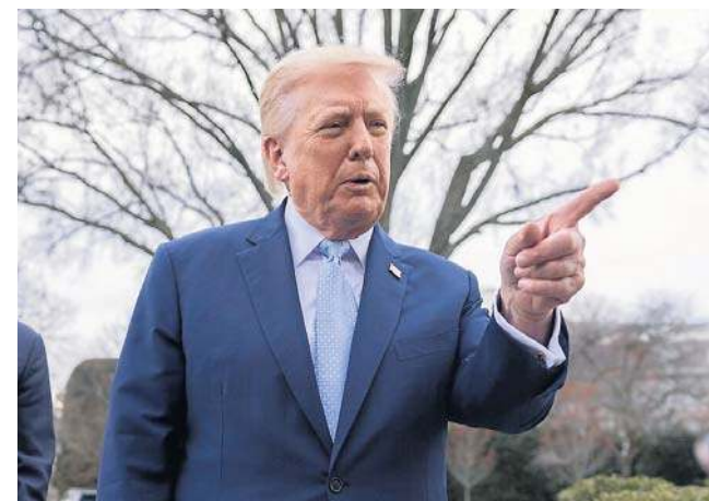
Oświadczenie Trumpa pojawiło się w sobotę wieczorem na platformie Truth Social. Ultimatum upływa tuż przed 1 w nocy czasu polskiego z poniedziałku na wtorek

Jest to kolejny zwrot prezydenta w sprawie Cieśniny Ormuz. Jeszcze w piątek sugerował, że jest bardzo bliski osiągnięcia wszystkich swoich celów w Iranie, zapowiadając, że USA nie potrzebują cieśniny i odpowiedzialność za nią odda w ręce państw, które korzystają z ropy naftowej eksportowanej przez nią. Wcześniej podkreślał, że państwa NATO mogłyby z łatwością odblokować ruch przez cieśninę i że byłby to „bardzo