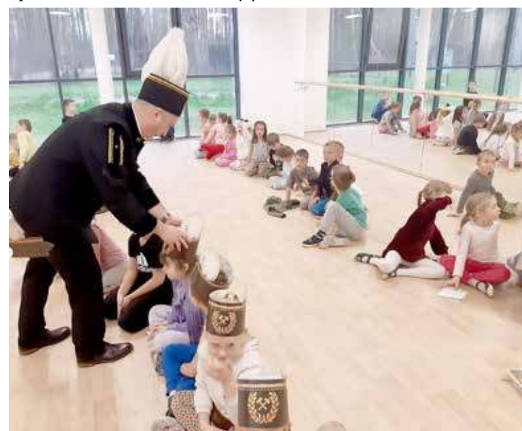
Każde z dzieci otrzymało górniczą czapkę