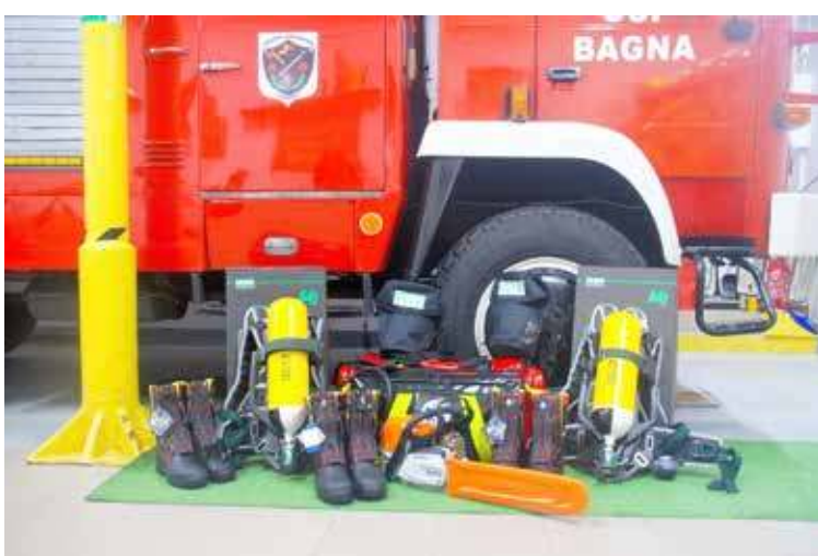
Nowy sprzęt jednostki

Zakupiony sprzęt pozwoli na zachowanie gotowości bojowej.