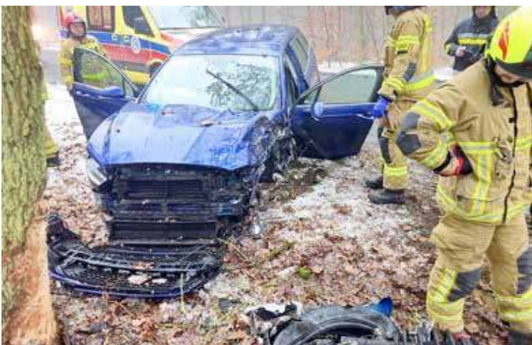
Dwie osoby trafiły do szpitala, zaś samochód został mocno zniszczony