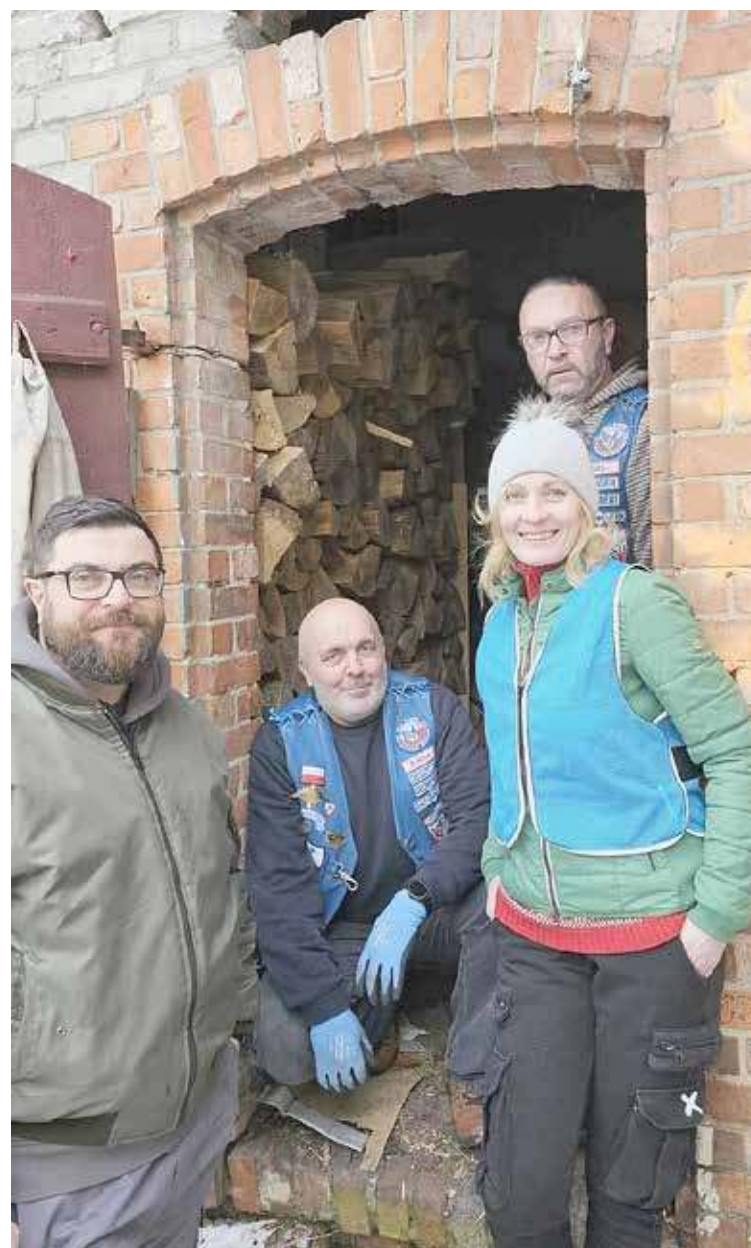
To nie pierwsza akcja pomocy prowadzona przez Rycerzy

pokazują dobroć i wielkie serca. Tak więc Rycerzom, za ich dobroduszość należą się wielkie brawa! DD