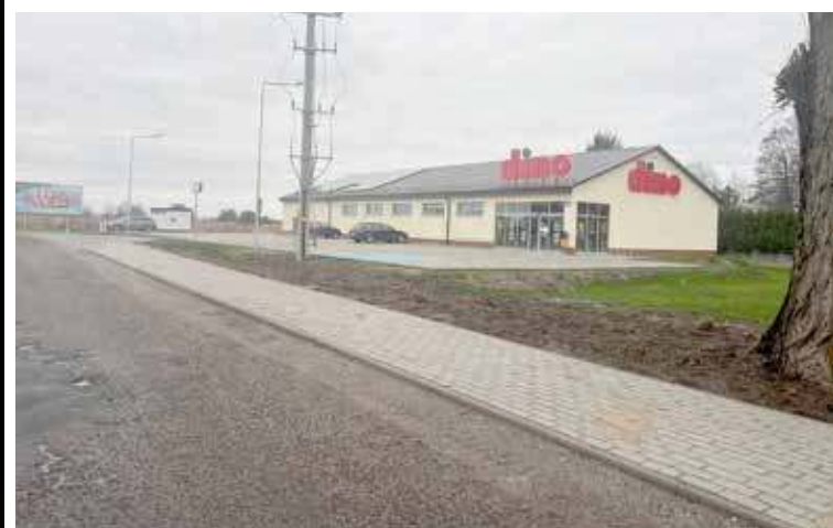
Powstał chodnik przy Dino

Wybudowany został chodnik wzdłuż ulicy Dąbskiej biegnący do supermarketu Dino. Pozwoli on pieszym na bezpieczniejsze dostanie się do sklepu.