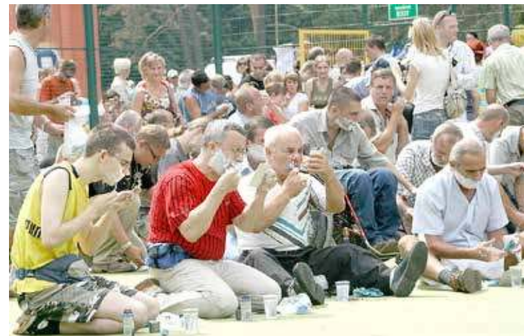
Bicie rekordu Guinnessa w kategorii „Największa liczba gołających się w jednym miejscu” w roku 2007

Festiwal Hanzeatycki w Goleniowie odbył się tylko dwa razy, lecz był bardzo ciekawym wydarzeniem. Szczególnie jego pierwsza edycja. Odbyła się ona pod koniec lipca 2005 roku. Jego najważniejszym elementem był happening o nazwie „A mury runą...”. Polegał on na podzieleniu miasta na część zamieszkaną przez Golów i Eniów, koncerty Perfectu i Manaamu oraz lokalnych artystów. Odbyły się również X Międzynarodowe Spotkania Folklorystyczne „Nad Iną” z udziałem zespołów ludowych z Polski i zagranicy. Miały wówczas również miejsce Wojewódzkie Dni Pszczelarza, plener rzeźbiarski, prezentacje gospodarcze i turystyczne. Dużą atrakcją było realne podzielenie miasta na dwie części. „Granica” znajdowała się na moście na ulicy Szczecińskiej i aby ją przekroczyć należało pokazać „paszport” wydawany wcześniej m.in. w Centrum Informacji