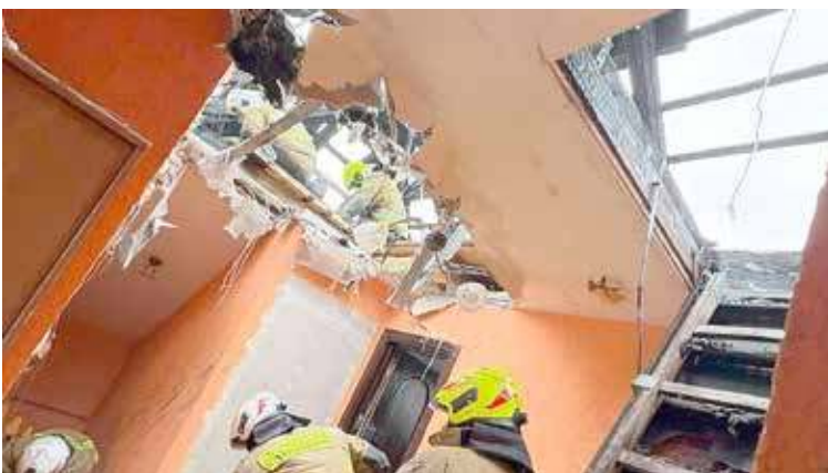
Zniszczenia poddasza są duże

- W wyniku pożaru, który zniszczył nasz dom, nasze poddasze wymaga generalnego remontu. Aby mogło znów pełnić swoją funkcję, konieczna jest naprawa dachu, wymiana instalacji elektrycznej oraz odnowienie pomieszczeń, które