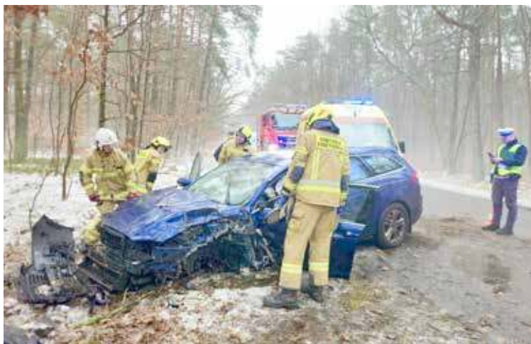
Do wypadku doszło na w okolicach Stepnicy

W akcji ratunkowej uczestniczyły służby z Goleniowa, Stepnicy oraz Krępska.