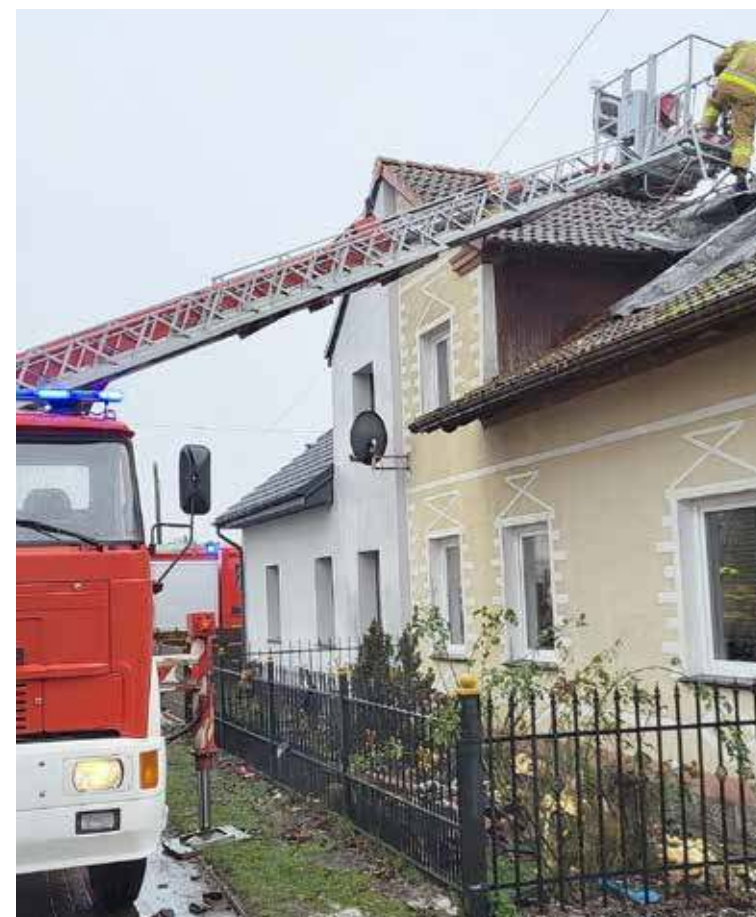
Do pożaru doszło w poniedziałek