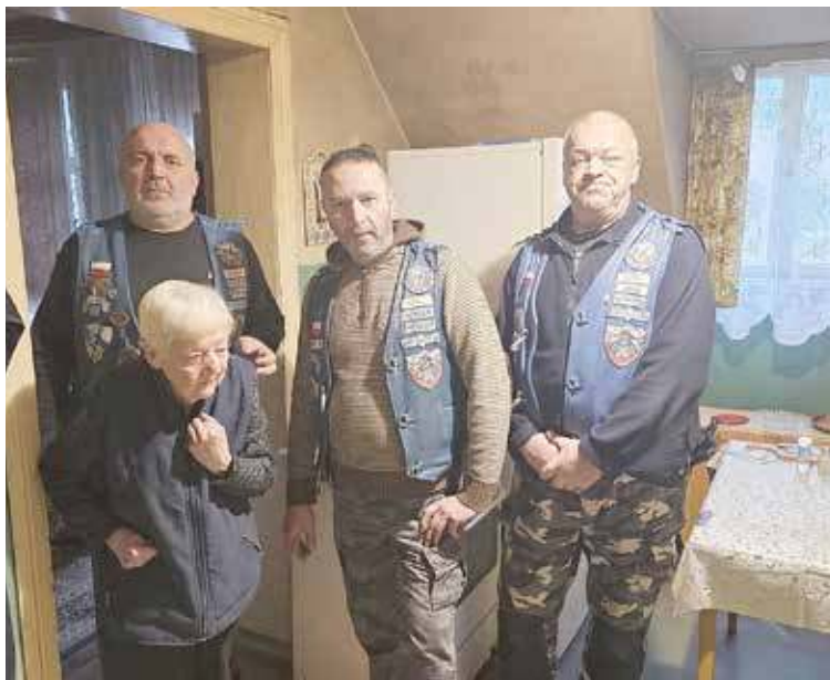
Blue Knights pomogli starszej kobiecie

W minioną sobotę pomogli oni starszej mieszkance Goleniowa, która znalazła się w trudnej sytuacji. Jedna z członkiń Klubu przekazała jej drewno na opał, tak konieczne w zimowych chłódach. Pozostali zaś Rycerze szybko i sprawnie zorganizowali transport drewna. Porąbali je w wygodne kawałki, gotowe do posłużenia jako opał oraz wnieśli to wszystko do mieszkania kobiety. Udało się więc zadbać o ciepło w domu potrzebującej osoby.