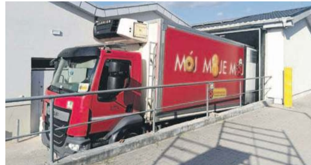
Na drugi dzień z towarem przyjechała krótka ciężarówka i bez problemu dostarczyła go do sklepu