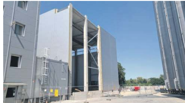
Po lewej będzie nowy magazyn

GRUPA ERGIS - przetwórstwo tworzyw sztucznych - to pięć zakładów produkcyjnych, z których cztery zlokalizowane są w Polsce (w tym w Oławie), jeden w Niemczech. Grupa specjalizuje się w produkcji opakowań do żywności (folie i laminaty barierowe na bazie PVC i PET, drukowane laminaty wielowarstwowe) oraz opakowań przemysłowych (folie stretch z LLDPE