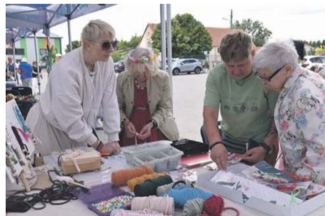
Warsztaty przygotowane przez Tęczę cieszyły się sporym zainteresowaniem