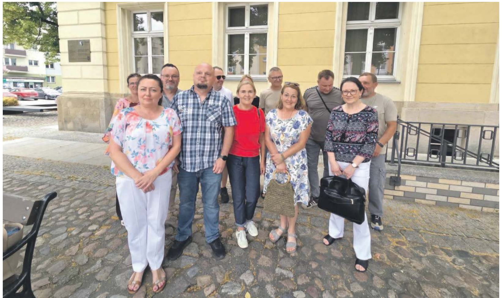
Mieszkańcy ul. Słonecznej wraz z nową radną wciąż walczą o zielony skwer