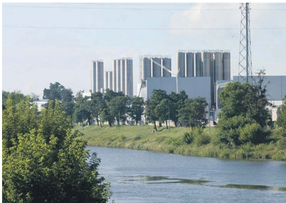
Mimo bariery z walu i ściany drzew, uciążliwy szum z firmy przeszkadza mieszkańcom