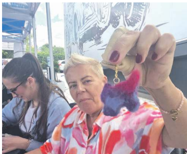
Podczas pikniku można było sobie zrobić wyjątkowy breloczek