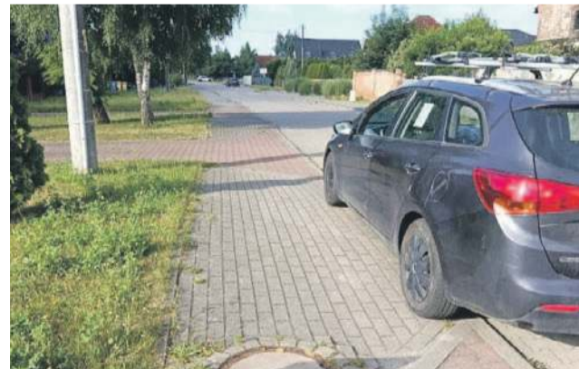
Auto stojące w ten sposób, praktycznie blokuje możliwość dostarczenia towarów wielkimi tirami