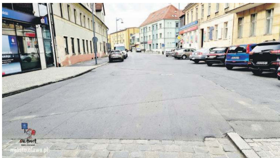
Ten odcinek będzie remontowany i on będzie zamknięty, pozostała organizacja ruchu bez zmian

końca roku. Prosimy kierowców, aby zwracali uwagę na znaki drogowe.