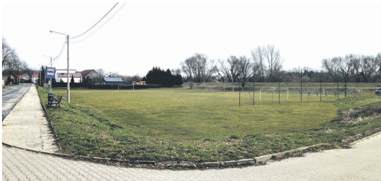
Z końcem czerwca miasto po raz trzeci ogłosiło przetarg, który ma wyłonić wykonawcę długo planowanej modernizacji boiska przy ul. Bażantowej

Przypomnijmy, że początkowo miasto zamierzało przeznaczyć na modernizację boiska przy ul. Bażantowej 1,2 mln zł. Ogłaszając kolejny przetarg kwotę zwiększono do 2,1 mln zł. Teraz okazuje się, że koszt może być znacznie wyższy, więc wśród radnych pojawiły się wątpliwości, czy w ogóle warto wydawać tyle pieniędzy na to zadanie. Pierwszym, który zgłosił uwagi na sesji, był radny Albert Zieliński z „Wszystko dla Oławy”.