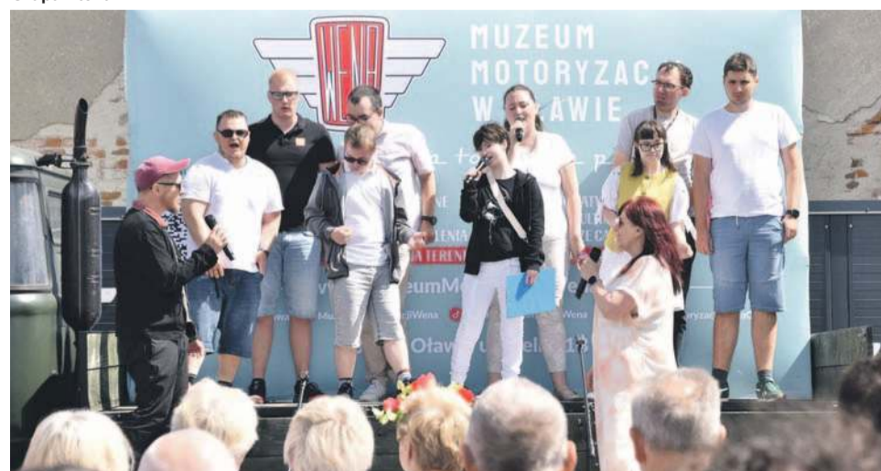
Koncert dali też podopieczni oławskiej Tęczy