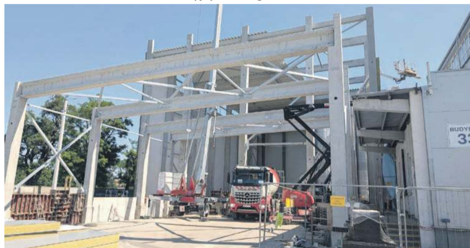
Prace potrwają do jesieni