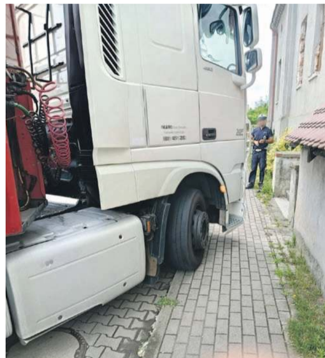
Wielkim tirem trzeba się nieźle nakręcić, żeby dojechać do magazynu tej Biedronki, a i tak bez wjeżdżania na chodnik się nie da