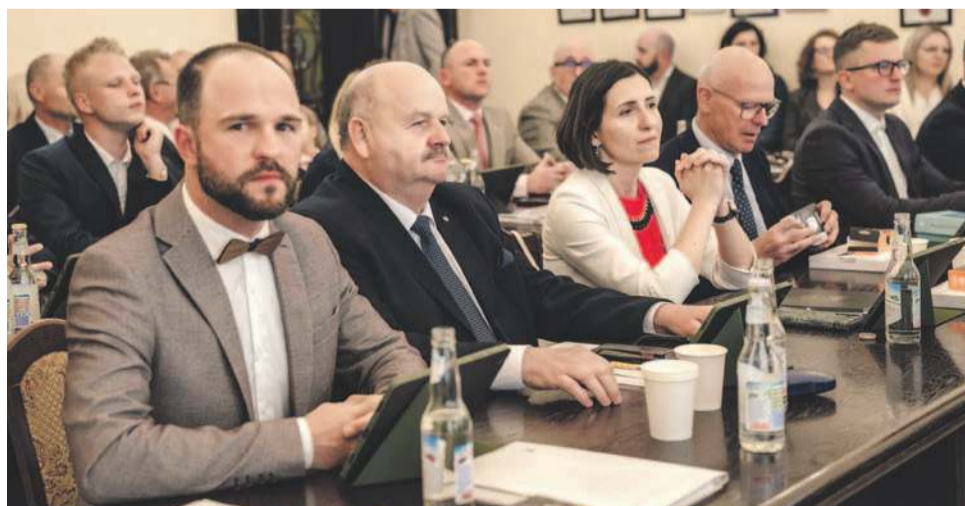
Radni chcą zmienić statut gminy Jelcz-Laskowice. Zapowiadają, że w całej sprawie chcą włączyć mieszkańców