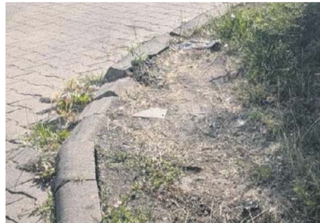
Efekt? Uszkodzone krawężniki, niszczone zieleni