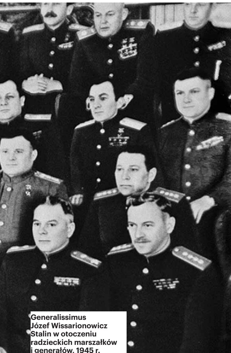
Generalissimus Józef Wissarionowicz Stalin w otoczeniu radzieckich marszałków i generałów, 1945 r.

cisną spust, marszałek zdąży krzyknąć: „Strzelacie do nas! Do Armii Czerwonej!”. Miejsca na sentymenty jednak nie ma. Zanim Tuchaczewski zostanie rozstrzelany, wykrzyczy jeszcze: „Niech żyje partia, niech żyje Stalin!”. Ten ostatni skwitował to wzruszeniem ramion: „Jakież podlec. Podważa wyrok sądu”.