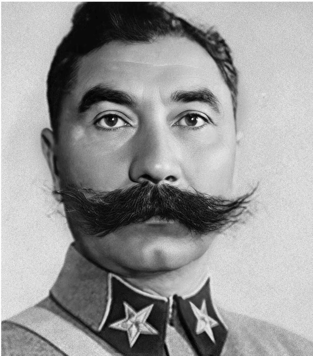
Siemion Michajłowicz Budionny (1883-1973), dowódca Konarmii i marszałek Związku Radzieckiego, który przeżył czystki. Zmarł w wieku 91 lat i został pochowany przy murze Kremla na Placu Czerwonym w Moskwie

Rok 1918 - w życie właśnie wchodzi dekret, który powołuje do życia Armię Czerwoną. Dokument wprowadza istotne zmiany: od tamtej chwili sowieccy oficerowie tytułowani są według pełnionych funkcji, znoszone zostają rangi, które obowiązywały dotąd w carskiej armii.