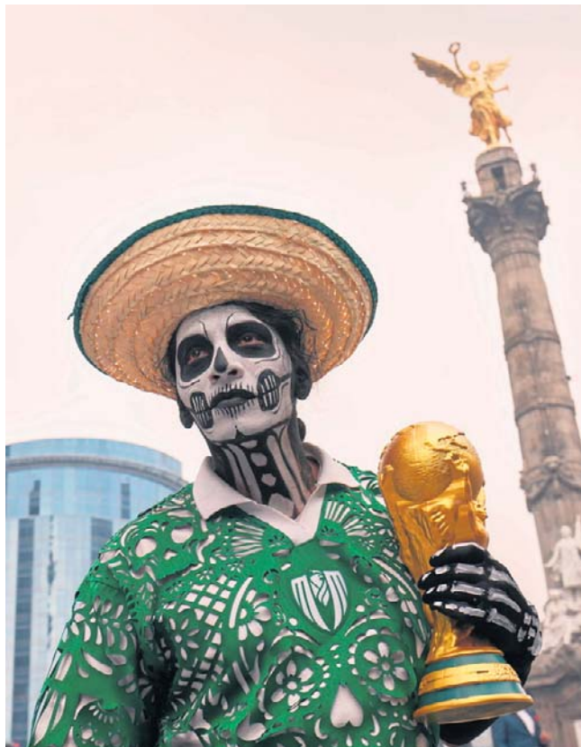
Otwarcie mistrzostw świata nastąpi dziś wieczorem na Estadio Azteca w Meksyku

„Udział Iranu w mundialu pozostanie wątpliwy, dopóki 11 mężczyzn nie wybiegnie na boisko” - tak „The Athletic” podsumował sytuację drużyny z Bliskiego Wschodu kilka dni przed początkiem mistrzostw.