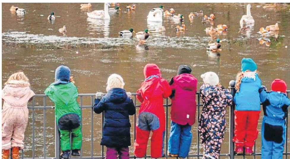
Gdy inne dzieci były na wycieczce, 5-latka siedziała sama w przedszkolu... (zdjęcie ilustracyjne)

„Pani córka przebywa z grupą i dobrze się bawi”. Takie informacje przekazała 46-letnia opiekunka jednej z mam, której 5-letnie dziecko miało pojechać w sierpniu 2024 roku na wycieczkę. Niestety, było zupełnie inaczej. Dziewczynka zapamiętała z wyjazdu jedynie swoje przedszkole, bo to właśnie na jego terenie spędziła w całkowitej samotności sześć godzin, pozbawiona jakiegokolwiek opieki.