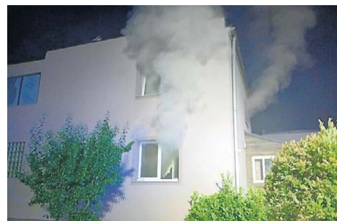
Jak się okazało, nocny pożar wybuchł w salonie, na pierwszym piętrze budynku.

Pożar spowodował poważne zniszczenia. Wstępne ustalenia wskazują, że przyczyną zdarzenia mogło być zwarcie instalacji elektrycznej.