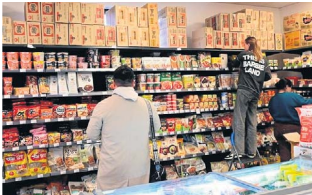
W koreańskich sklepach w Bielanych Wrocławskich można kupić wiele tamtejszych produktów spożywczych

Obecność koreańskiej społeczności widoczna jest również w edukacji. Dzieci koreańskich specjalistów uczęszczają do międzynarodowych szkół we Wrocławiu. Na Uniwersytecie Wrocławskim prężnie działa koreanistyka, która należy do najbardziej rozpoznawalnych kierunków związanych