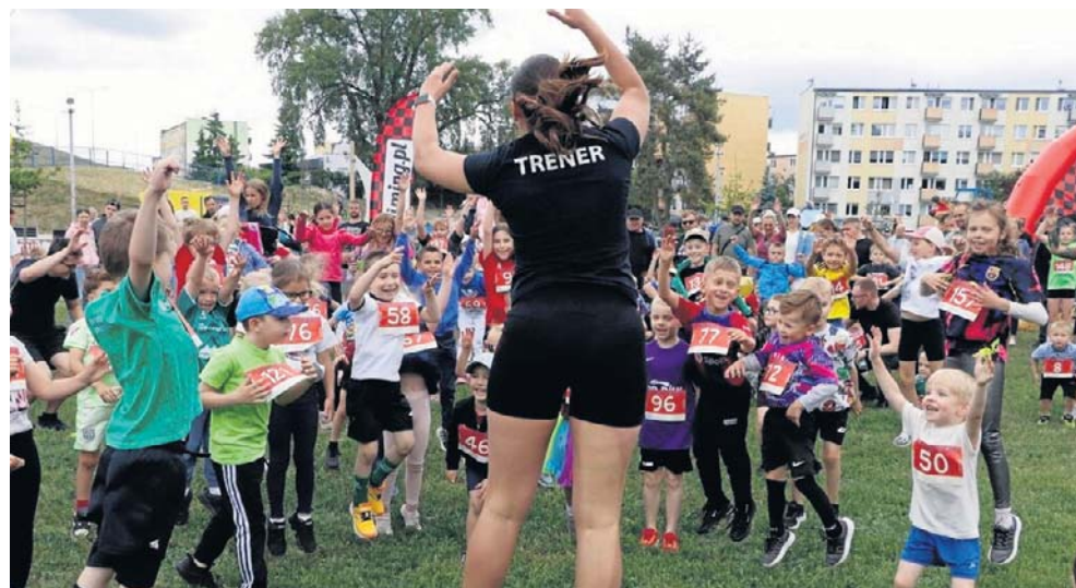
W 2026 r. wartość inwestycji w wychowanie dziecka do 18 lat wynosi ok. 371 000 zł. Przy dodatkowych inwestycjach w edukację kwota ta przekracza 400-500 tys. zł

Ile kosztuje nastolatek? 1850 - 2200 zł miesięcznie za np. żywnienie, odzież, markowe buty, elektronikę, korepetycje przygotowujące do matury (język polski w cenie 72,48 zł za 60 minut; matematyka - 70,76 zł, angielski - 76 zł). Standardowe czesne miesięcznie w prywatnych szkołach podstawowych i średnich sięga 1 200 - 2 500 zł, a w szkołach z maturą międzynarodową (IB): 4 000 - 10 000 zł; jednorazowe wpisowe: 1 000 - 3 000 zł.