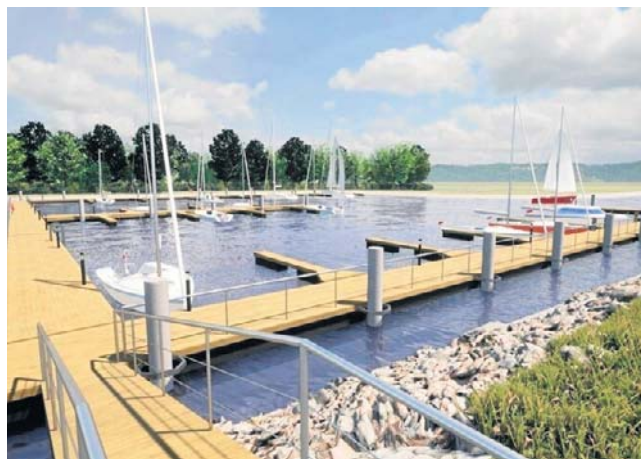
WIZUALIZACJA GMINY KOŁBASKOWO