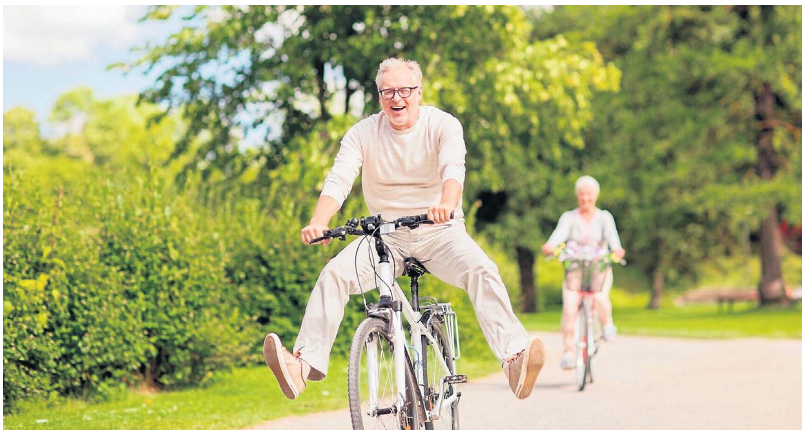
Jazda na rowerze to przyjemna forma spędzania wolnego czasu, środek transportu, ale też dobre ćwiczenie angażujące wiele mięśni i narządów

● Nie obciąża stawów - jazda na rowerze to umiarkowana dawka ruchu, która nie obciąża stawów w tak dużym stopniu jak chociażby bieganie czy fitness. Przejazdzka rowe-