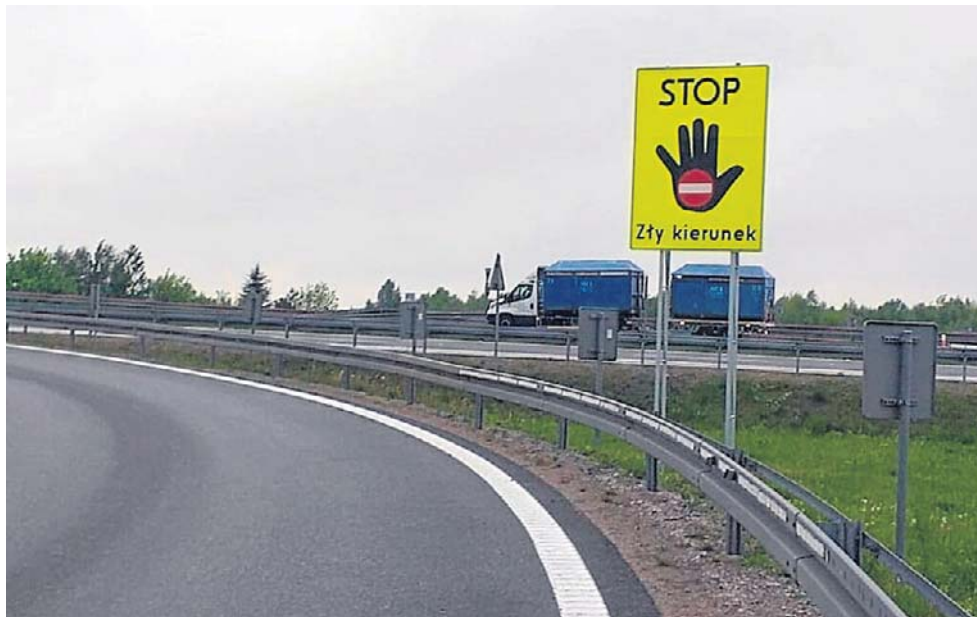
Nie wszyscy kierowcy reagują na takie znaki

Do śmiertelnego wypadku doszło też na granicy województwa łódzkiego i mazowieckiego na autostradzie A2 w kierunku Poznania. Doszło do tego około godziny 19 w lutym 2025 roku między Skiermicami a Wiskitkami. Do tragedii doprowadził 65-letni mężczyzna kierujący Toyotą, który wjechał pod prąd na autostradę i zderzył się z Fordem. Zginął na miejscu, a dwie osoby zostały ranne. Jedną z nich zmarła w szpitalu.