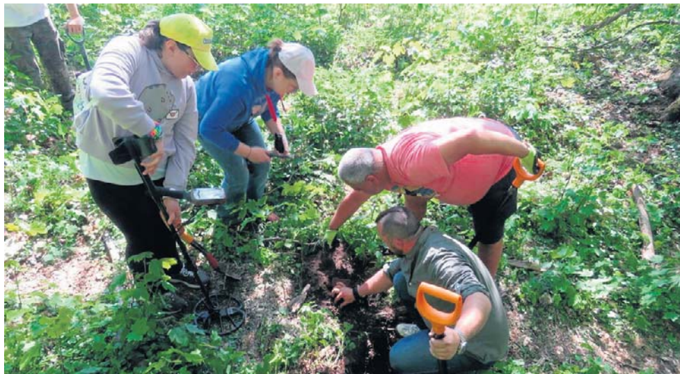
Kościół przetrwał wojnę, nie przetrwał pokoju. Niezwykła historia z Goślawia. Na zdjęciu akcja poszukiwawcza z 2 maja