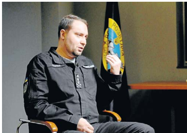
Kyrył Budanow powiedział, że Ukraina spodziewa się niebawem wizyty amerykańskiej delegacji w Kijowie