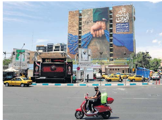
Billboard w Teheranie z napisem „Cieśnina Ormuz na zawsze w rękach Iranu”

Irańscy urzędnicy przedstawiają to żądanie jako test wiarygodności, a nie ustępstwo. W tym samym raporcie podkreślono, że wcześniejsze doświadczenia - zwłaszcza porozumienia dotyczące zamrożonych irańskich aktywów w Korei Południowej i Katarze - sprawiły, że Teheran obawia się opóźnień lub niepełnych transferów. „Biorąc pod uwagę dotychczasową niewiarygodność