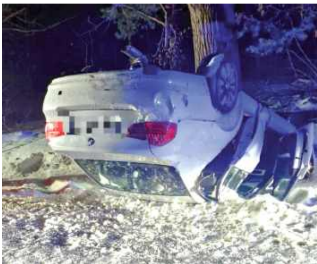
Kierowca podróżował sam i wyszedł z wypadku bez obrażeń