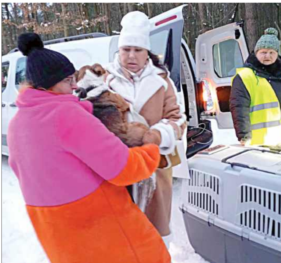
Jedną z organizacji z naszego terenu, która brała czynny udział w ewakuacji schroniska w Sobolewie, było Stowarzyszenie „Ekipa Uszy do Góry”. Przedstawiciele organizacji brali udział także we wcześniejszych protestach

W podobnym tonie wypowiada się Fundacja Przyjazna Łapa „Po Ludzku do Zwierząt”. - Dla osób działających na rzecz zwierząt nazwa „Sobolew” od lat była synonimem piekła. To była wiedza powszechna w środowisku. Mimo że nasza Fundacja