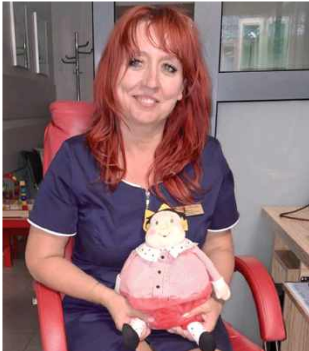
Jeszcze kilka miesięcy temu pracowała z pacjentami z jednej z puławskich przychodni. Dziś sama potrzebuje pomocy