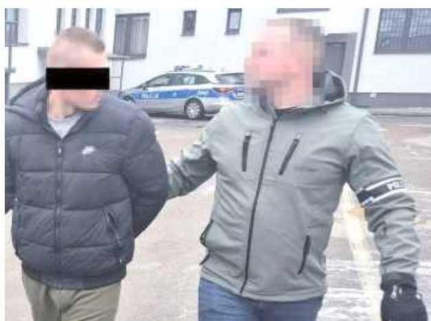
Mężczyzna trafił do aresztu

Policjanci nie uwierzyli w zapewnienia mężczyzny i przeszukali jego mieszkanie oraz samochód. Okazało się, że 38-latek w kilku miejscach schował foliowe woreczki, w których był mefedron i marihuana.