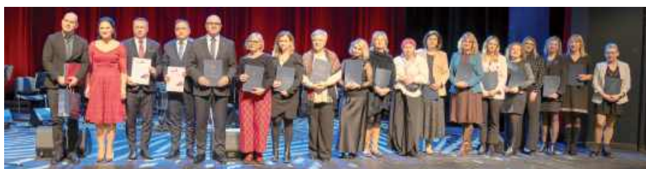
Pięć lat akcji Onko Mikołaj