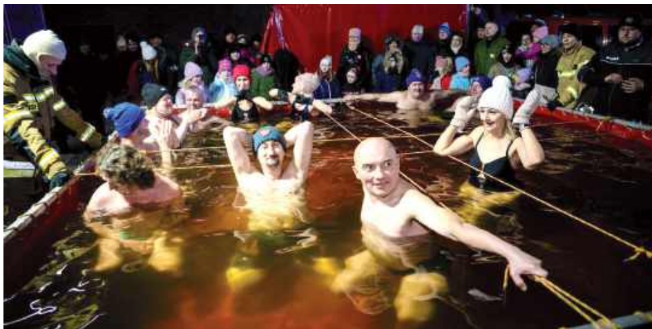
Komfort ciepły mieli tylko widzowie. Hartowanie morsów w basenie przy scenie

- To było niesamowite doświadczenie! Choć dłonie do-