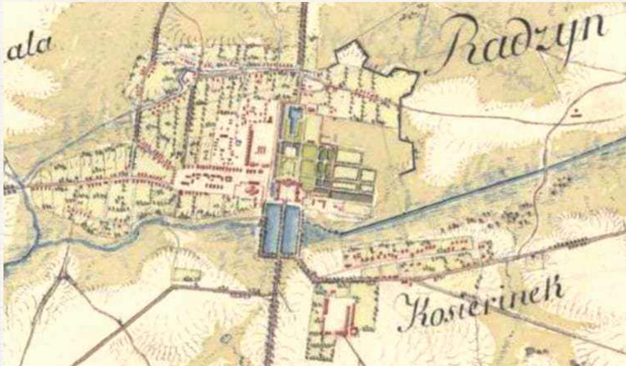
Rękopiśmienna mapa topograficzna Galicji Zachodniej z lat 1801-1804 (tzw. mapa Heldensfelda) ze zbiorów Archiwum Wojennego w Wiedniu

Do konkursu stawali powracający żołnierze, zubożała szlachta i mieszczaństwo. Potem kandydat składał egzamin przed komisją w na poziomie departamentu sie-