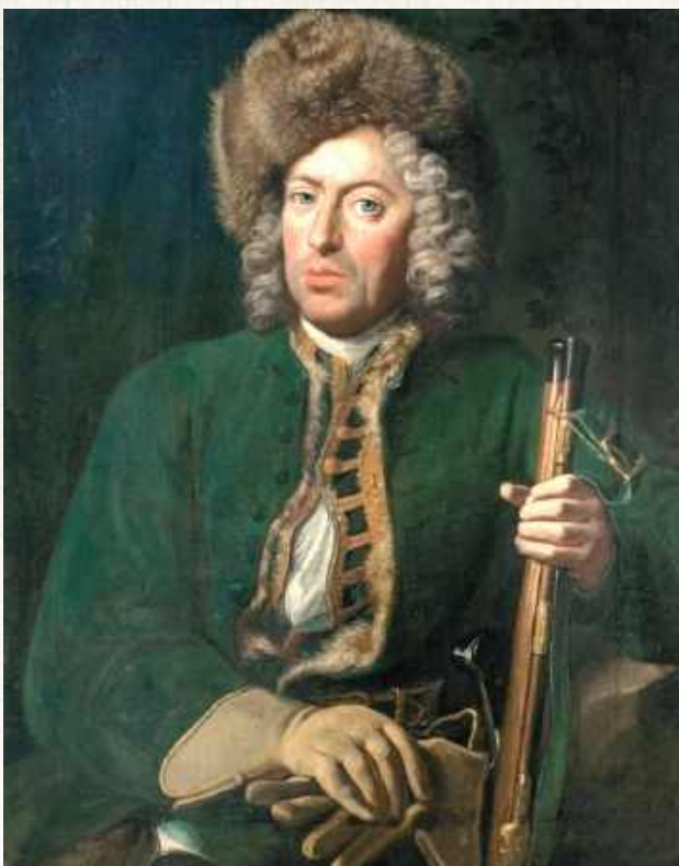
Król słynął z temperamentu, energii i siły. Portret w stroju myśliwskim z roku 1710