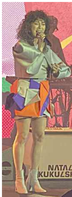
Występ Natalii Kukulskiej, która oświadczyła, że niedługo obchodzi pięćdziesiątkę, przyjęto gromkimi brawami