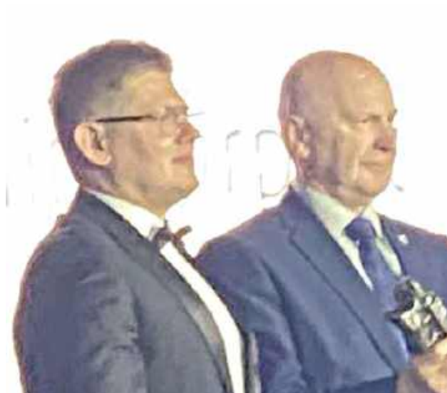
Port Lotniczy Lublin uzyskał tytuł Ambasadora Województwa Lubelskiego w kategorii firma. W ostatnich miesiącach lotnisko notowało znaczący wzrost aktywności - jednak prezes Portu oświadczył, że dziś pracuje w firmie ostatni dzień