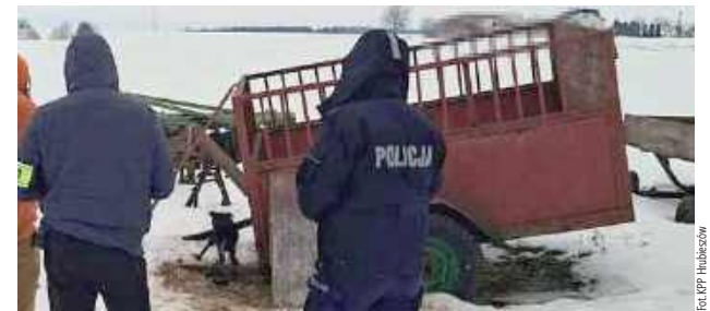
Zwierzęta trafiły pod opiekę fundacji działającej na rzecz ochrony zwierząt