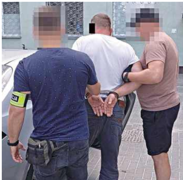
Sąd uznał Leszka L. za winnego wszystkich zarzucanych mu czynów, w tym usiłowania zabójstwa byłej żony. Najbliższe lata 50-latek z gminy Biała Podlaska ma spędzić za kratami