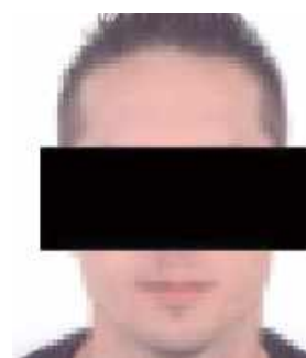
Trafił do aresztu śledczego na okres 3 miesięcy, gdzie będzie oczekiwał na dalszy proces

Funkcjonariusze Wydziału Poszukiwań i Identyfikacji Osób parczewskiej jednostki ustalili, że 41-letni mieszkaniec Parczewa poszukiwany Europejskim Nakazem Aresztowania ukrywa się w Niemczech.