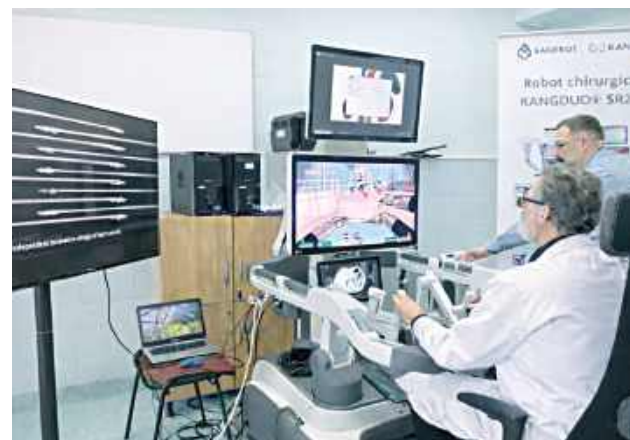
Wyposażony jest w cztery zrobotyzowane ramiona narzędziowe w systemie kolumnowym. Został zaprojektowany, by wspierać chirurgów w wykonywaniu precyzyjnych i małoinwazyjnych operacji

LUBLIN: Specjaliści Uniwersyteckiego Szpitala Klinicznego nr 4 w Lublinie testują możliwości nowego robota chirurgicznego. System posiada certyfikat CE dla czterech specjalizacji: urologii, ginekologii, chirurgii ogólnej i torakochirurgii.