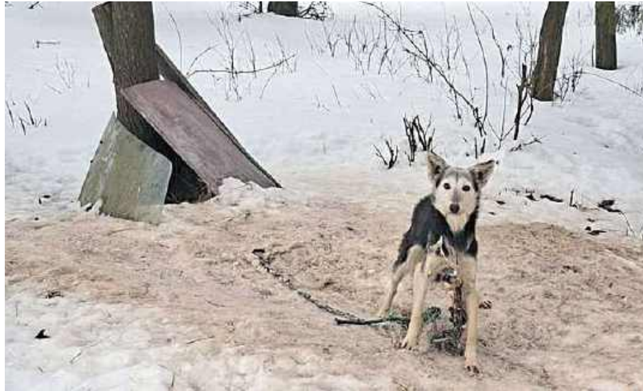
Zwierzęta trafiły pod opiekę fundacji działającej na rzecz ochrony zwierząt

Policjanci powiadomili Urząd Gminy w Mirczu oraz lekarza weterynarii. Lekarz weterynarii stwierdził, że zwierzęta są skrajnie zaniedbane, a ich warunki bytowania są bardzo złe. Na miejsce przyjechali wolontariusze fundacji działającej na rzecz ochrony zwierząt. Wolontariusze zabrali wszyst-