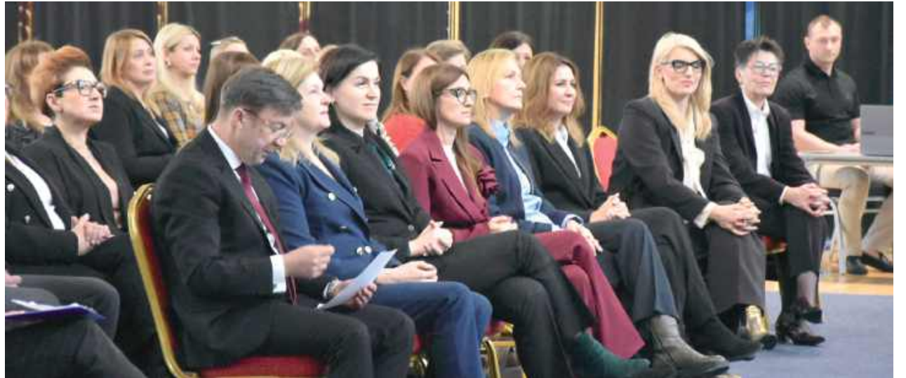
W spotkaniu brało udział aż 200 nauczycieli i dyrektorów