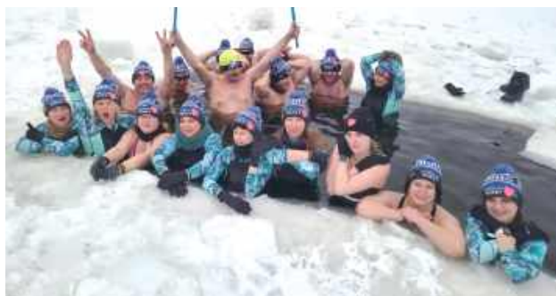
Silny mróz i wiatr nie przeszkodziły w pokazie Terespolskiego Klubu Morsów

Zgodnie z obietnicą złożoną w Warszawie przez Terespolan Jurkowi Owsiakowi, w dniu finału na terenie rekreacyjnym Konowica niedaleko Bugu Terespolski Klub Morsów zorga-