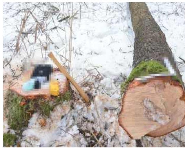
66-latek, wykonując prace związane z wycinką na posesji sąsiada, prawdopodobnie został uderzony przez spadający konar

We wtorek (27 stycznia) po południu dyżurny bialskiej komendy otrzymał zgłoszenie o wypadku przy pracy, do którego doszło na terenie prywatnego kompleksu leśnego.