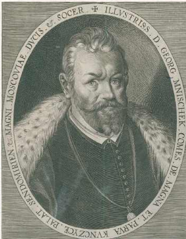
Jerzy Mniszech miał ogromne ambicje i jeszcze większą wyobraźnię polityczną. Pieniądze na ich realizację planował znaleźć przy moskiewskim tronie. Na jedną kartę postawił wszystko: majątek, córkę, życie swoje i rodziny

Maryna, córka jego głównego protektora, Jerzego Mniszcha, po zawarciu w Krakowie ślubu „per procura” miała niezwłocznie wyruszyć do Rosji, żeby tam dołączyć do małżonka i być gwarancją spełnienia przez niego wszystkich złożonych obietnic: królowi sojuszu z Polską, Kościołowi nawrócenia kraju na