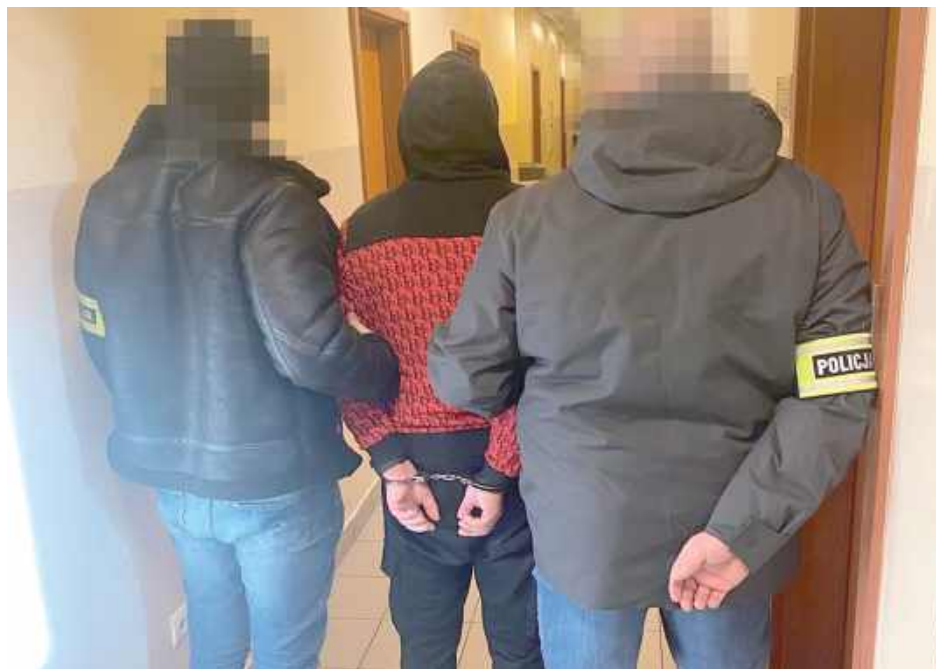
Dzięki skrupulatnej pracy policjantów ustalono miejsca pobytu obydwu poszukiwanych. W ciągu jednego dnia białscy funkcjonariusze zatrzymali łącznie siedem osób ukrywających się przed organami ścigania

34-latek, ukrywający się od września 2022 roku, został odnaleziony w domu należącym do członka rodziny. Mężczyzna był poszukiwany za kradzież z włamaniem, niealimentację oraz kierowanie pojazdem w stanie nietrzeźwości. Początkowo nie otwierał drzwi, licząc, że uniknie odpowiedzialności, jednak po informacji o planowanym siłowym wejściu do budynku, właściciel domu przybył na miejsce, co umożliwiło policji zatrzymanie poszukiwanego ukrywającego się na strychu. Próby wprowadzenia funkcjonariuszy w błąd przez partnerkę mężczyzny nie powiodły się.