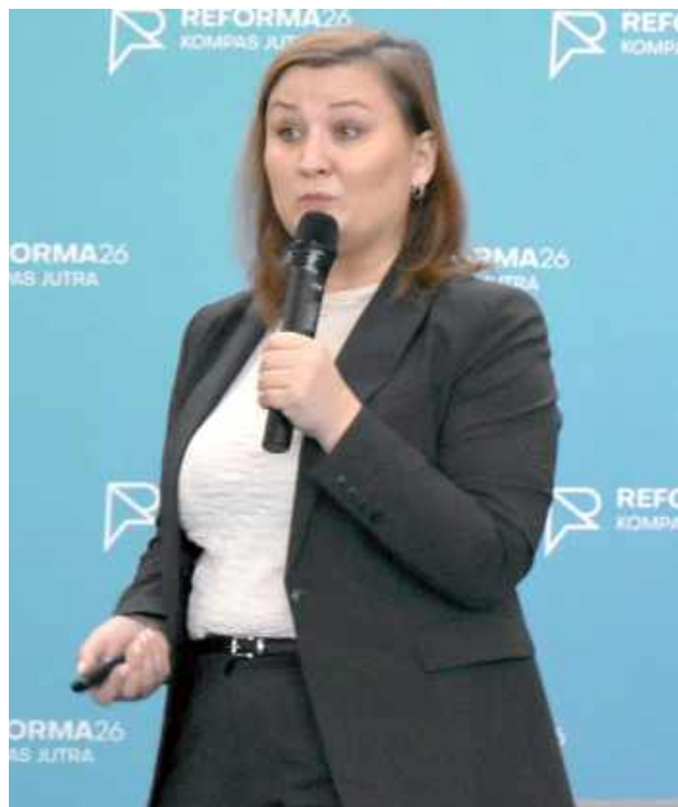
Gościem specjalnym wydarzenia była wiceminister edukacji Paulina Piechna-Więckiewicz

Rogoźnica stała się 23 stycznia stolicą edukacyjnej dyskusji na Lubelszczyźnie. W Szkole Podstawowej im. Janusza Kusocińskiego ponad 200 nauczycieli i dyrektorów rozmawiało o nadchodzącej rewolucji w oświacie – reformie „Kompas Jutra”. Gościem specjalnym wydarzenia była Paulina Piechna-Więckiewicz, wiceministra edukacji narodowej.