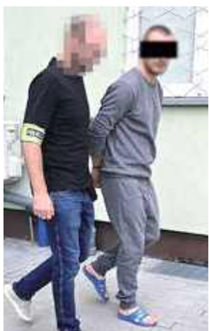
Michał K. w czasie śledztwa nie przyznał się do popełnienia zarzucanego mu czynu. Oznajmił, że nic nie pamięta z dnia zdarzenia, gdyż był pijany

W lubelskim Sądzie Okręgowym rozpoczął się proces 31-latka, który w czerwcu 2025 roku w Białej Podlaskiej zadał uderzenie nożem w brzuch swego starszego o sześć lat brata.