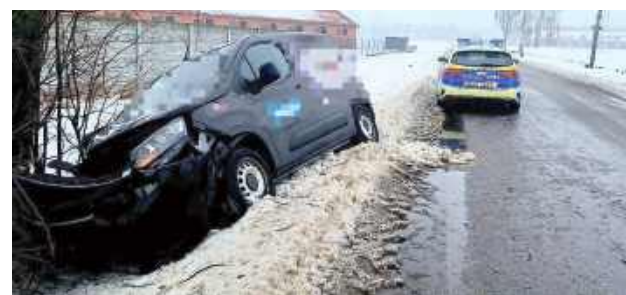
We wtorek (27 stycznia) rano w miejscowości Radcze pojazd automatycznie powiadomił służby o kolizji drogowej

We wtorek (27 stycznia) rano w miejscowości Radcze pojazd automatycznie powia-