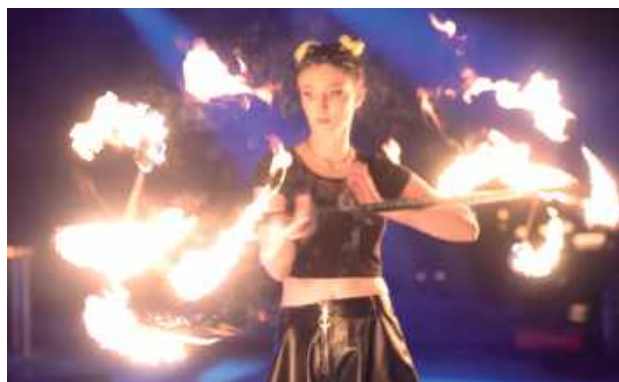
Zamiast fajerwerków wystarczył taniec ognia

Właśnie pokaz tańca z ogniem zastępuje w Białej Podlaskiej kanonadę fajerwerków, które stresują i przerażają zwierzęta. Niektórzy uczestnicy koncertu zapalali zimne ognie. Nie było huków.