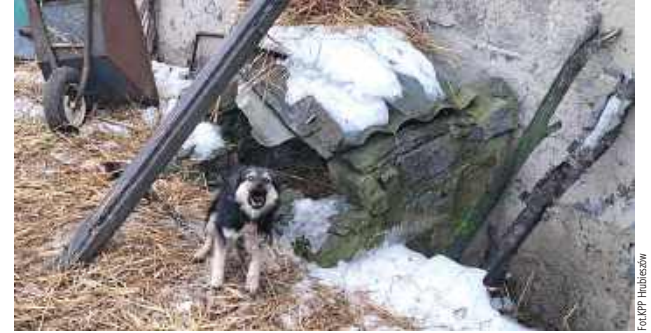
Schronienia dla psów były wykonane z różnych starych arkuszy, blach, płyt eternitowych, szyby samochodowej, desek, pustaków, które były oparte o ściany budynków, drzewa lub maszyny rolnicze