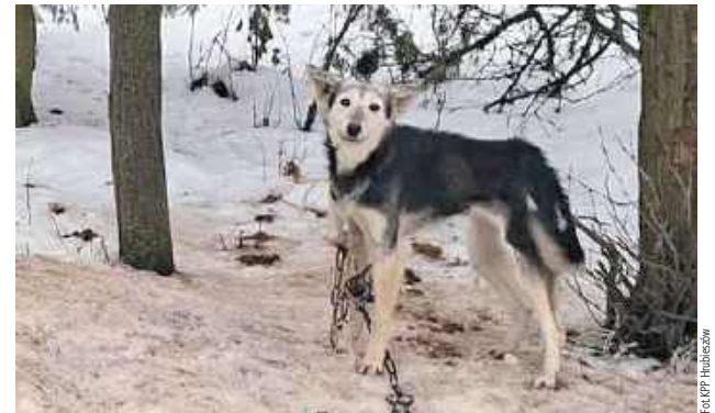
Łańcuchy były zbyt krótkie, poskręcane lub oplątane o elementy maszyn rolniczych

O sprawie, którą opisaliśmy, napisał później portal Jawny Lublin