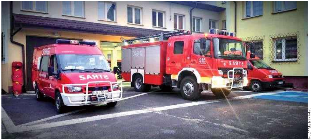
Czy wraz z wyrzuceniem OSP z remizy władza zechce odebrać strażakom pojazdy i sprzęt oraz ubrania?

Wyjaśnił, iż nie z jego winy pojawiły się poślizgi z dostarczeniem podwozia z Czech do zamówionego pojazdu.