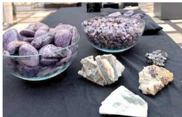
Zatrzymane kamienie półszlachetne - po lewej ładniejsze okazy czaroitów

Do zbiorów muzeum trafiło m.in. 7 trylobitów - to wymarłe