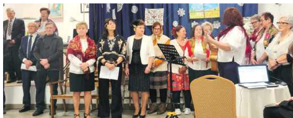
„Spełnione marzenia” to wzruszające przedstawienie Klubu Seniora „Kreatywni”

Przedstawienie ukazywało losy dwóch rodzin żyjących w odmiennych środowiskach. Pierwsza z nich to rodzina miejska, w której zapracowani rodzi-