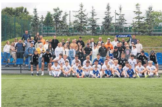
Drużyna juniorów młodszyc FASE po ostatnim meczu rundy zasadniczej. Teraz powalczą o brąz w rozgrywkach

Za tydzień okaże się, czy do CLJ U19 po rocznej przerwie wrócą juniorzy Pogoni. Grają decydujący mecz w Lidze Makroregionalnej (zaplecze CLJ) z Arką w Gdyni.