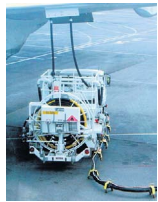
Moskwa zakazała eksportu paliwa lotniczego

W ubiegłym tygodniu Kreml rozważał ograniczenie eksportu oleju napędowego i paliwa lotniczego, o czym pisała we wtorek rosyjska agencja Interfax, powołując się na własne źródła. Z kolei agencja Reutersa poinformowała w piątek, że produkcja oleju napędowego w kraju spadła już o około 20 proc. w kwietniu i maju.