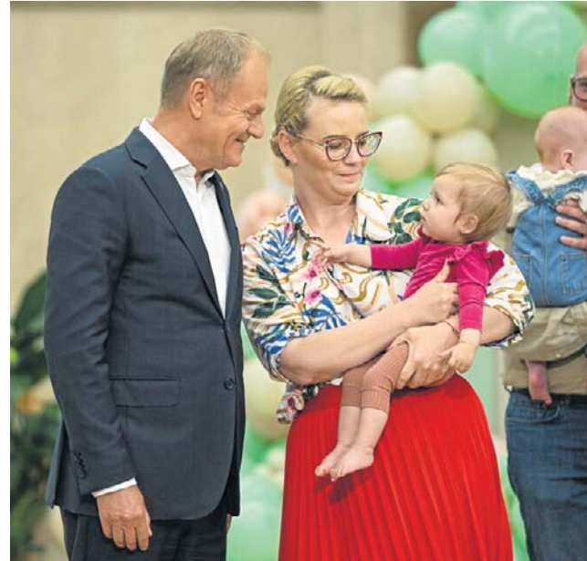
Donald Tusk na spotkaniu z okazji drugiej rocznicy przywrócenia rządowego programu in vitro

- Żeby były bezpieczne, żeby rodzice mieli poczucie