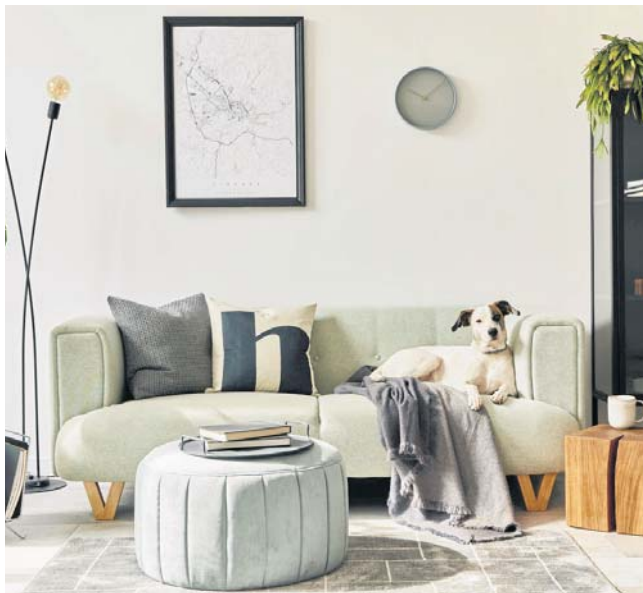
Wcale nie trzeba remontu, żeby salon wyglądał jak nowy

Czasem największą zmianę daje... brak zakupów. W wielu mieszkaniach układ mebli pozostaje taki sam przez lata, choć nie zawsze jest funkcjonalny. Może też się po prostu znudzić. Warto spróbować przestawić sofę, odsunąć meble od ścian albo stworzyć bardziej otwartą przestrzeń do rozmów i odpoczynku. Coraz popularniejsze są wnętrza podzielone na strefy, np. miejsce relaksu, czytania czy pracy. Nawet niewielki salon może zyskać nową energię