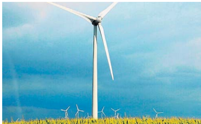
Energetyka stała się jednym z frontów wojny informacyjnej prowadzonej przeciw Europie.

Nie każdy protest wobec inwestycji to dezinformacja. Często źródłem obaw są zwyczajnie brak informacji, zbyt późna komunikacja albo poczucie wyłączenia mieszkańców z procesu decyzyjnego. To mechanizm znany również na Pomo-