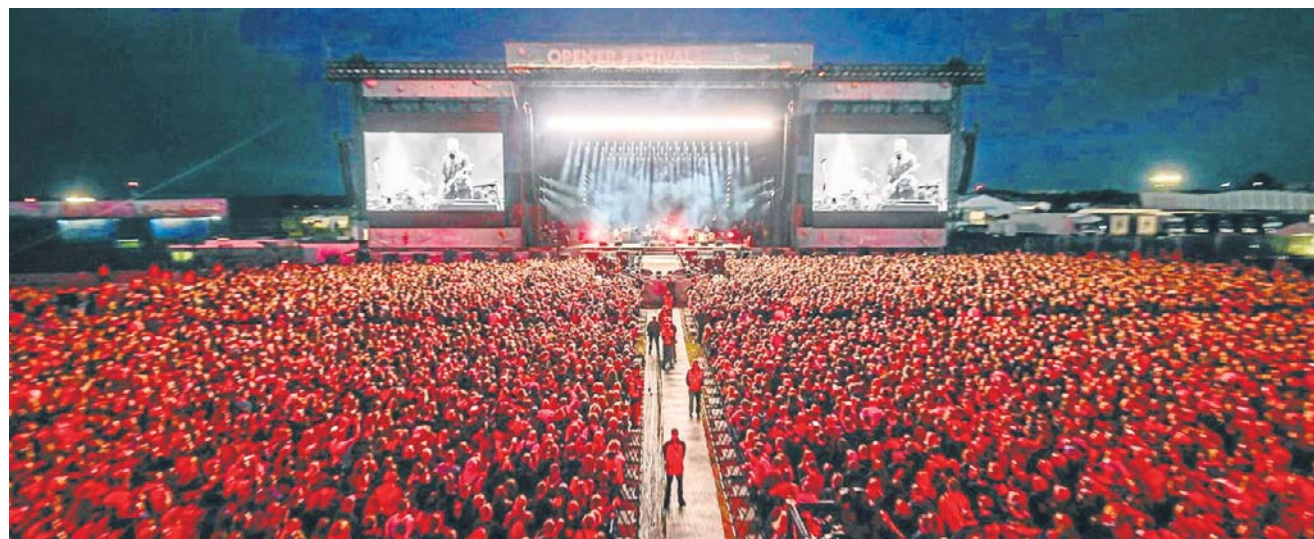
Open'er jest gigantem na europejską skalę i z globalnymi ambicjami. Biznes jest już mniej spektakularny

Polski biznes festiwalowy jest mało – na pierwszy rzut oka – opłacalny. Marża netto rzędu 3-10 proc. przy dużej skali to często bardzo dobry wynik, zaś po lekturze sprawozdań finansowych największych graczy