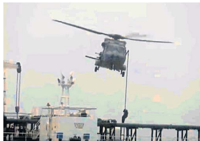
Francuska marynarka wojenna dokonała przejęcia tankowca Tagor na wodach Oceanu Atlantyckiego

W styczniu Francja zatrzymała na Morzu Śródziemnym tankowiec Grinch. W marcu doszło do zatrzymania tankowca Deyna. Oba są zaliczane do rosyjskiej „floty cieni”. PAP