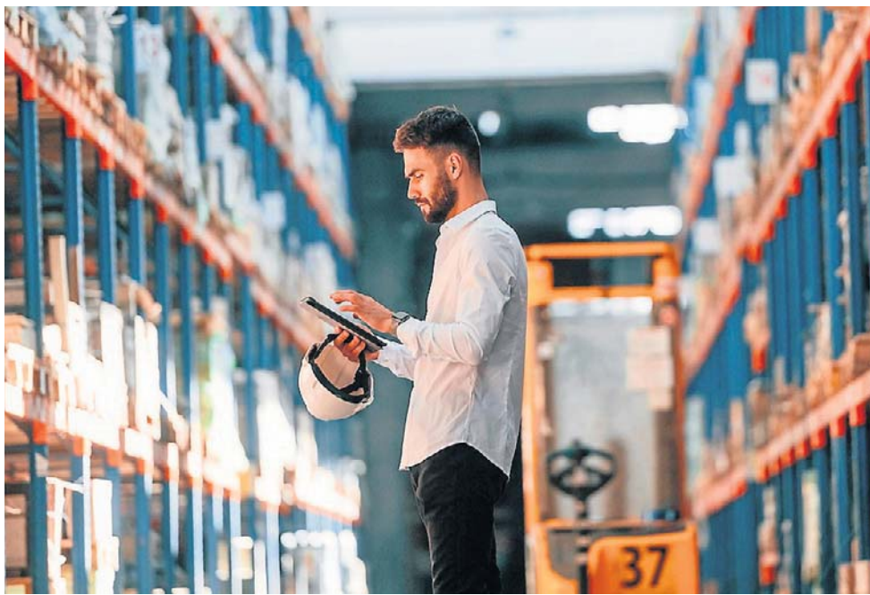
Popyt na pracowników w segmencie logistyki wzrósł

Sprawdźmy wynagrodzenia. Poziom płac jest silnie zróżnicowany regionalnie; w wielu przypadkach najwyższe wynagrodzenia notuje się w największych ośrodkach miejskich. Grafton Recruitment podaje, że magazynierzy z Poznania, Wrocławia oraz Trójmiasta zarabiają w granicach 5000-6000 zł brutto, w Krakowie 5000-6500 zł, w Łodzi 5800-7000 zł,