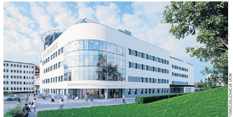
FOT. WIZUALIZACJA UCM

Budowa UCZD właściwie już trwa - został wykopany wielki dół, który można oglądać od strony ul. Kłonowica (w pobliżu lądowiska dla śmigłowców). Aby zrobić mu miejsce, zostały wyburzone dwa szpitalne bu-