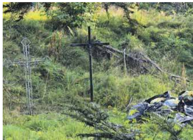
Na posesji, na której ma powstać hotel, obok worków na śmieci stanęły cmentarne krzyże.

łącznie w garażu podziemnym, czego nie dopuszcza miejscowy plan zagospodarowania przestrzennego, co jednocześnie prowadzi do braku realizacji wymaganej przepisami liczby miejsc postojowych” - czytamy również w odwołaniu. Sąsiedzi