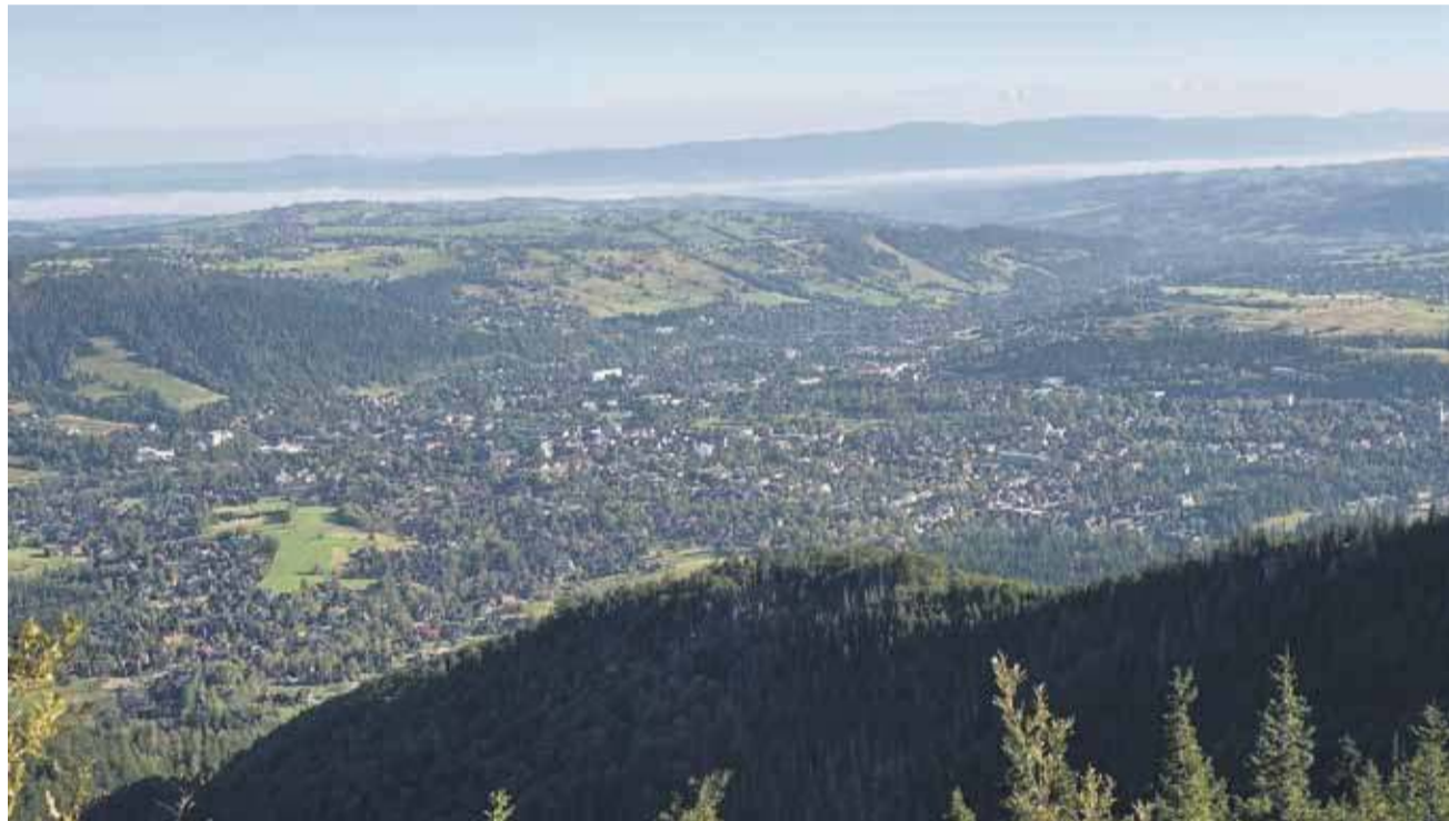
Krajobraz na Podhalu jest wartością nadrzędną, na wiatraki nie ma tu miejsca, ale co z innymi odnawialnymi źródłami energii?

dy wiatrak, który swego czasu powstał w miejscowości Podczerwone, nie produkował wystarczającej ilości energii - a także krajobrazowe.