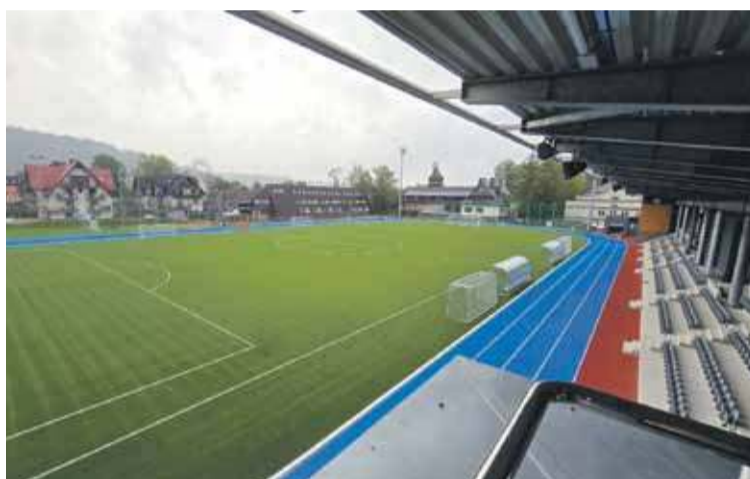
Stadion kosztował prawie 30 mln zł.