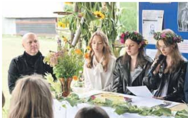
Fragmenty utworów Kochanowskiego czytali nie tylko zaproszeni goście, ale także uczniowie starszych klas z Cichego i Czerwienego.

W śród 17 września w ogrodach plebańskich w Miętustwie odbyło się Narodowe Czytanie wybranych dzieł Jana Kochanowskiego, w którym wzięli udział uczniowie z okolicznych szkół. Wśród zaproszonych gości był znany muzyk Piotr Szewczyk. Narodowe Czytanie z udziałem uczniów Szkoły Podstawowej nr 1 im. Andrzeja Knapczyka-Ducha z Czerwienego Dolnego oraz uczniów Szkoły Podstawowej nr 1 im. Bohaterów Westerplatte z Cichego Dolnego miało miejsce w ogrodach plebańskich parafii NMP Królowej Polski w Miętustwie. Obie placówki leżą w granicach tejże wspólnoty. Zarówno uczniowie jak i zaproszeni goście spotkali się na drewnianej, plenerowej scenie, skąd rozchodziły się słowa Jana Kochanow-