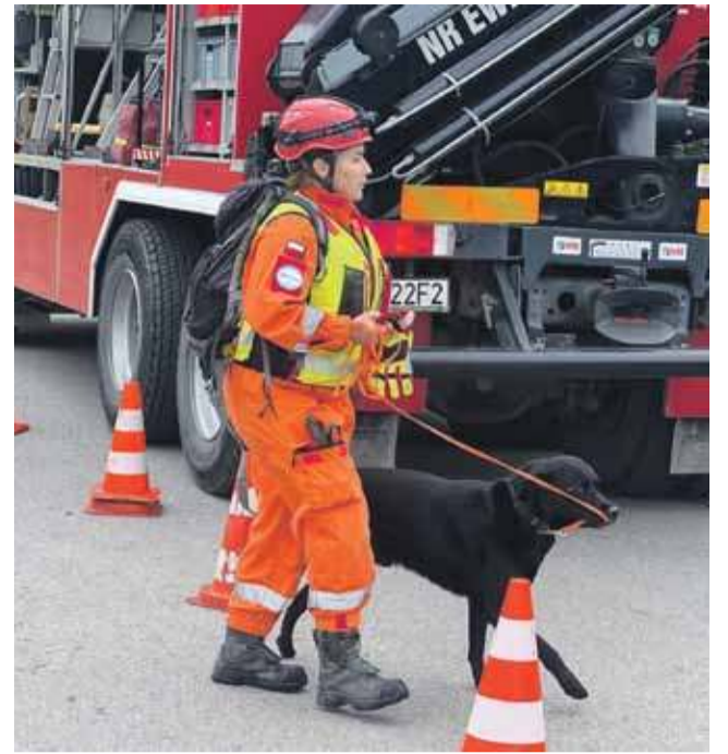
W ćwiczeniach brali udział również czworonożni ratownicy.