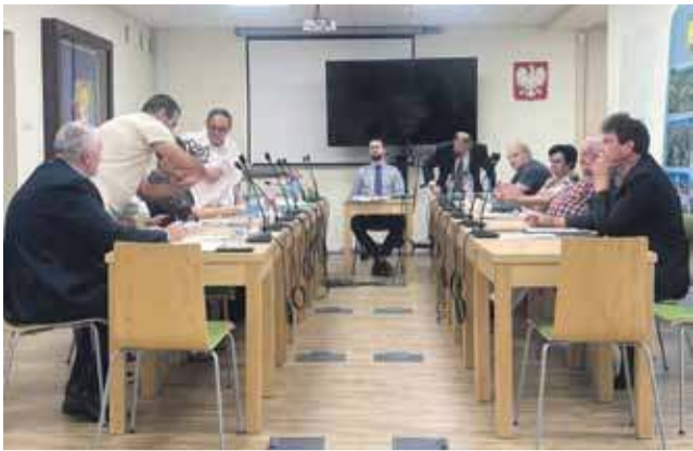
Radni zapewniali, że propozycję wymiany słyszą pierwszy raz.