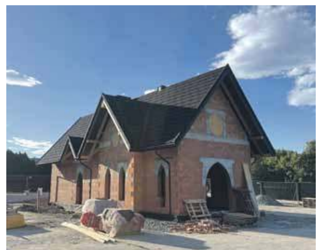
Prace przy budowie nowej kaplicy na Zaborni przebiegają bardzo szybko.