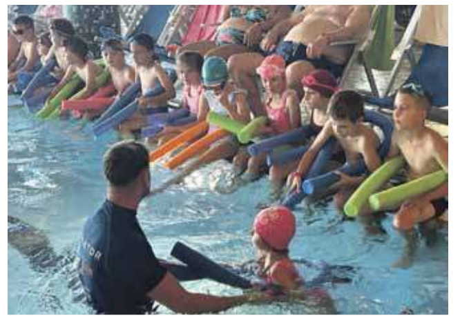
Lekcje potrwają do grudnia.