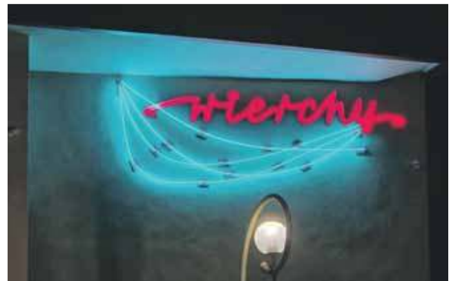
Tak prezentuje się neon na Wierchach.