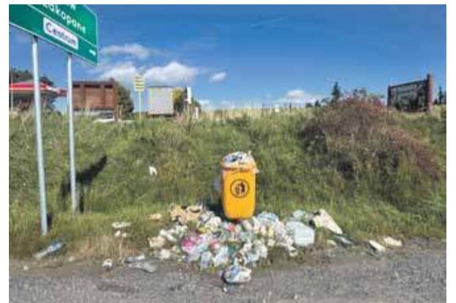
Taki opłakany widok w miejscu, z którego turyści wyruszają na wycieczki w Gorce.