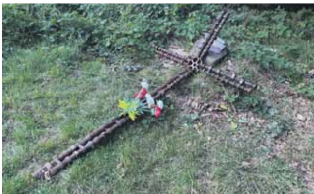
Krzyż upamiętnia miejsce katastrofy lotniczej z 1985 roku.