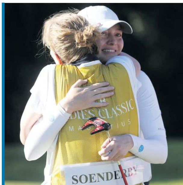
W ramionach mamy!