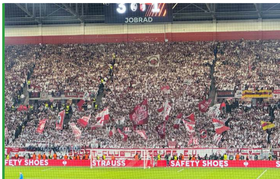
Trybuna najbardziej zaangażowanych fanów Freiburga. Wymachiwali flagami przez cały mecz!

Wrażenie zrobiła na mnie... sprawność gastronomiczna gospodarzy. Wydawali wursty i piwa w kosmicznym wręcz tempie, dziesięć kolejek jedna przy drugiej przesuwano się sprawnie, nawet nie zdążyłem zamrudzić (kielbasa w bułce za 3,90