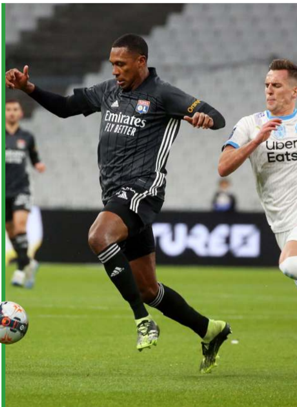
Marcelo przed Arkadiuszem Milikiem w meczu Lyonu z Marsylią.

- To zdecydowanie była jedna z ważniejszych decyzji w moim życiu. Gdy otrzymałem ofertę Wisły,