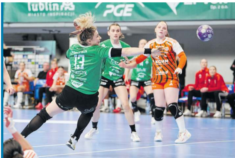
Wielkie emocje gwarantowane są już w przedczesnym finale Lubina z Lublinem.