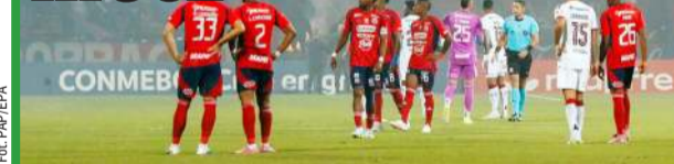
Chwila przed decyzją o zejściu z murawy.