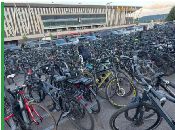
Jedną z wypożyczalni rowerowych jest sponsorem klubu. Na mecze przyjeżdżają tłumy cyklistów.

uśmiechnięty – ten sławny szkoleniowiec ma kilka ulubionych lokali, w których często przesiaduje, pijąc kawę. Liczyłem więc, że może go przypadkowo spotkam, ale nie tym razem. Loew czuje się związany z miastem. Z balkonu pięknego zabytkowego ratusza przy Rathausplatz prezentował zachwyconym mieszkańcom Puchar Świata w 2014 roku. Ciekawe, że portal ghanasoccernet oraz austriackie media sugerowały w zeszłym miesiącu, że Loew może poprowadzić reprezentację Ghany na najbliższym mundialu. Niemiecki szkoleniowiec w rozmowie ze Sky zaprzeczył tym doniesieniom. – Nikt oficjalnie ze mną nie rozmawiał – stwierdził. Teraz to nieważne. Był na meczu, jest szczęśliwy, przeżywa te chwile, jak wszyscy mieszkańcy tego położonego przy granicy z Francją i Szwajcarią niemieckiego miasta.