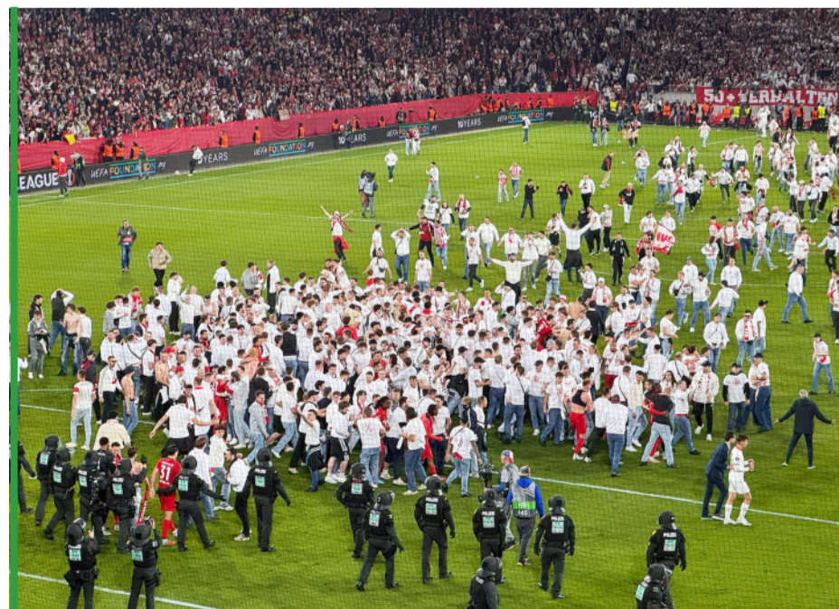
Po meczu na murawę wtargnęli szczęśliwi kibice. Policja ustawiła się w szyku, ale... zrezygnowała z interwencji.