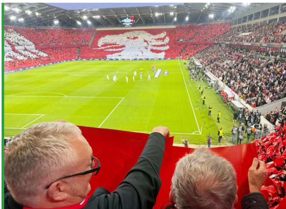
Przed meczem na siedziskach leżały białe i czerwone kartony. Fanom z Polski mogło zrobić się swojsko: chodziło o utworzenie białego orła na czerwonym tle, to element herbu klubu.