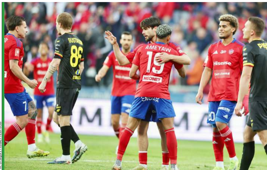
Częstochowianie przynajmniej częściowo zrehabilitowali się za porażkę w finale Pucharu Polski.