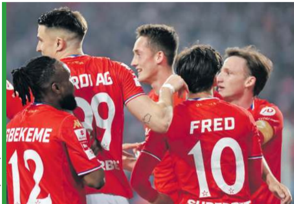
Na 120-lecie trzynastokrotni mistrzowie Polski wracają do ekstraklasy!