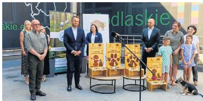
Zaprezentowane wczoraj poidła staną w 4 lokalizacjach

Samorząd województwa i leśnicy zachęcają także inne instytucje, firmy oraz mieszkańców do tworzenia podobnych punktów z wodą, by pomóc zwierzętom przetrwać upalne dni.