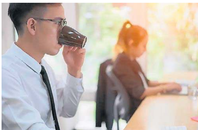
Jednym z obowiązków pracodawcy jest dbanie o sprawne oraz bezpieczne funkcjonowanie systemu klimatyzacji i wentylacji

fizycznym na otwartej przestrzeni (np. prace budowlane).