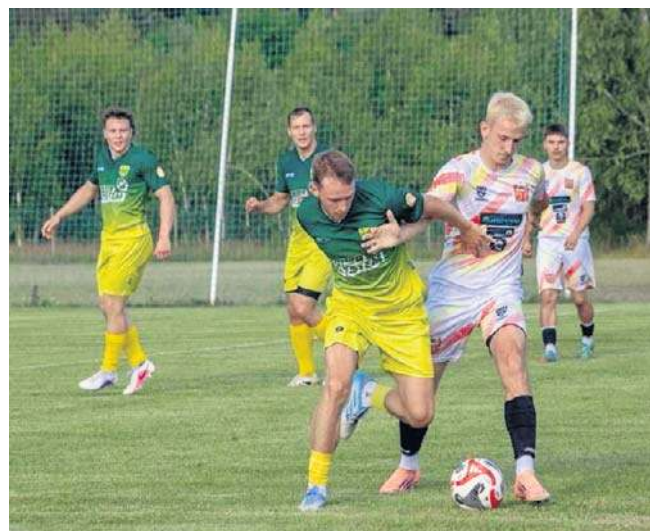
LZS Krynki (zielono-żółte stroje) po zaciętym dwumeczu okazał się lepszy od GKS-u Gródek i pozostaje w IV lidze

LZS Krynki - GKS Gródek 5:2 (0:1, 0:2) po dogrywce. Bramki: 0:1 - Damian Owerczuk (19), 0:2 - T. Owerczuk (84), 1:2 - Pawnuł (102), 2:2 - Murzyn (110), 3:2 - Leszczyński (112), 4:2 - Bolesta (116), 5:2 - Pawnuł (119). Pierwszy mecz: 2:0. LZS Krynki zostaje w IV lidze.