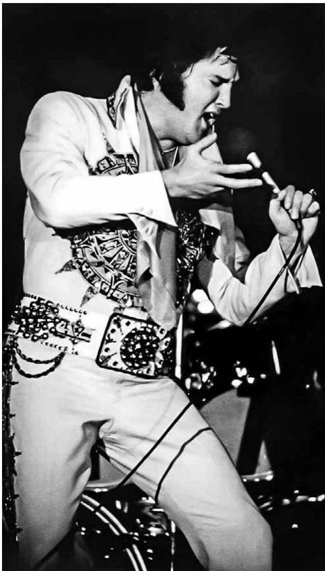
W Indianapolis Elvis Presley dał jeden ze swoich najlepszych występów w ostatnich miesiącach życia