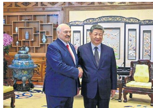
Xi Jinping i Aleksander Łukaszenko potwierdzili w Pekinie najwyższą rangę wzajemnych relacji

Rozmowy w Pekinie odbyły się zaledwie tydzień po bezpośrednim spotkaniu Łukaszenki z przywódcą Rosji Władimirem Putinem. Poprzednia wizyta białoruskiego lidera w Chinach miała miejsce we wrześniu 2025 roku. PAP