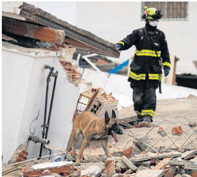
Kolumbijski ratownik i jego pies tropiący poszukują zaginionych osób na obszarze dotkniętym trzęsieniem ziemi w Catia La Mar w Wenezueli

Według agencji Reutersa mężczyznę i chłopca uratowano po 12 godzinach żmudnych wysiłków, przeszukiwania ruin przy użyciu specjalistycznych kamer i mozołnego