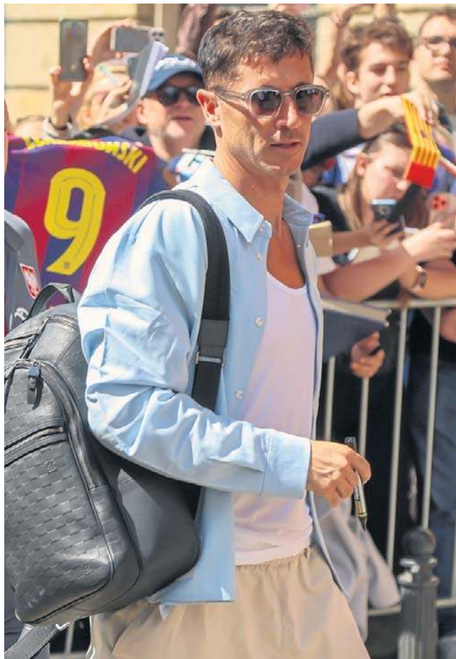
Lewandowski po raz pierwszy w swojej karierze zagra poza Europą. Dołącza do Major Soccer League

Lewandowski zagwarantował sobie gwiazdorski kontrakt. Według różnych źródeł ma zarabiać około 18-20 mln dolarów rocznie, czyli mniej więcej tyle, ile wcześniej w Bayernie Monachium czy FC Barcelonie. Więcej za oceanem zarabia jedynie Lionel Messi z Interu Miami - około 28 mln USD.