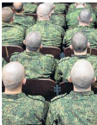
Rosyjskiej armii zaczyna brakować ludzi

- Począwszy od października wojsko będzie gotowe przyjąć na przyspieszone szkolenie dziesiątki tysięcy osób na poligonach, a następnie w takich grupach rozdzielając je do działających oddziałów - opowiadał