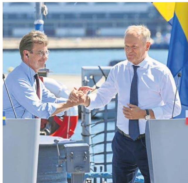
Premierzy Donald Tusk i Ulf Kristersson wzięli udział w polsko-szwedzkich konsultacjach międzyrządowych

- Szwecja jest jednym z najlepiej kooperujących państw w dziedzinie przemysłu obronnego i obrony. Mimo dość świeżego członkostwa w NATO, nasza współpraca na Bałtyku jakościowo zmieniła sytuację bezpieczeństwa. Podzielamy poglądy na temat sytuacji w całym regionie. Jesteśmy zdeterminowani we wsparciu Ukrainy wo-