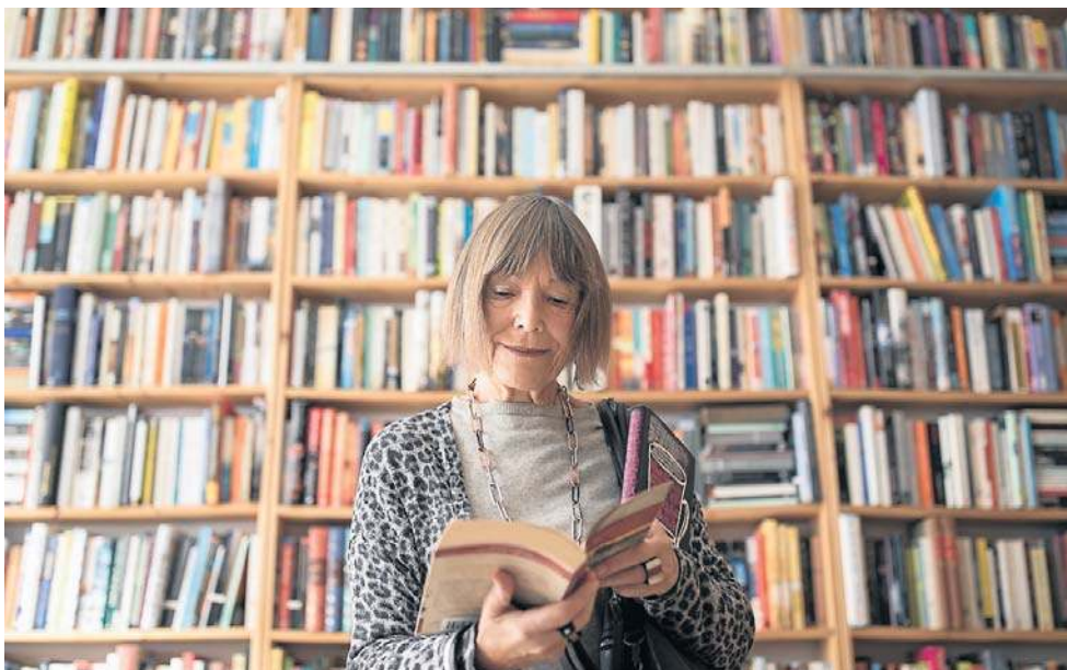
Osoby, które czytają, dłużej cieszą się sprawnością umysłową

Jedno z ciekawszych badań dotyczących czytania na przepro-