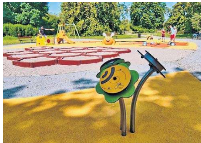
Bydgoski ratusz odpowiada za utrzymanie 53 placów zabaw zlokalizowanych na gminnych terenach otwartych

W zależności od wyników wcześniej przeprowadzonych kontroli bieżących (raz na tydzień) oraz funkcjonalnych (raz na 2 miesiące) na placach zabaw dokonywane są mniejsze i większe naprawy zainstalowanych urządzeń. Ratusz zastrzega jednak, że takie prace prowadzone są również na bieżąco - także na podstawie zgłoszeń od mieszkańców. Stale monitorowany jest ponadto stan czystości miejsc zabaw dla najmłodszych oraz terenów rekreacyjno-sportowych i wybiegów dla psów.