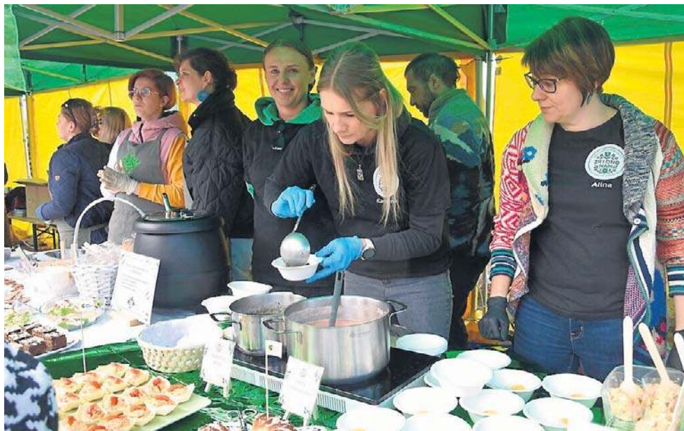
Świąteczne potrawy przygotowało aż 10 kół gospodyń wiejskich z gminy Białe Błota, w tym KGW Zielono Nam z Zielonki (na zdjęciu)

- Stół jednoczy, dlatego tak ważne są spotkania świąteczne