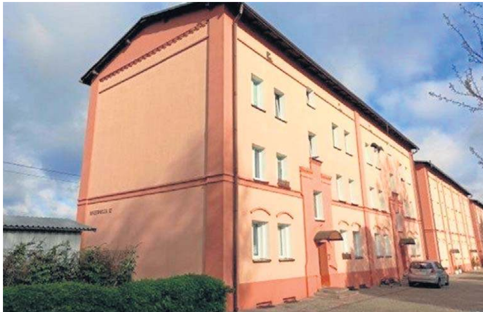
W Toruniu jest na sprzedaż dwupokojowe mieszkanie przy ulicy Urzędniczej

Z wyższymi cenami, choć nadal niespotykany na komercyjnym rynku wtórnym, wystawione są na sprzedaż lokale w większych miastach