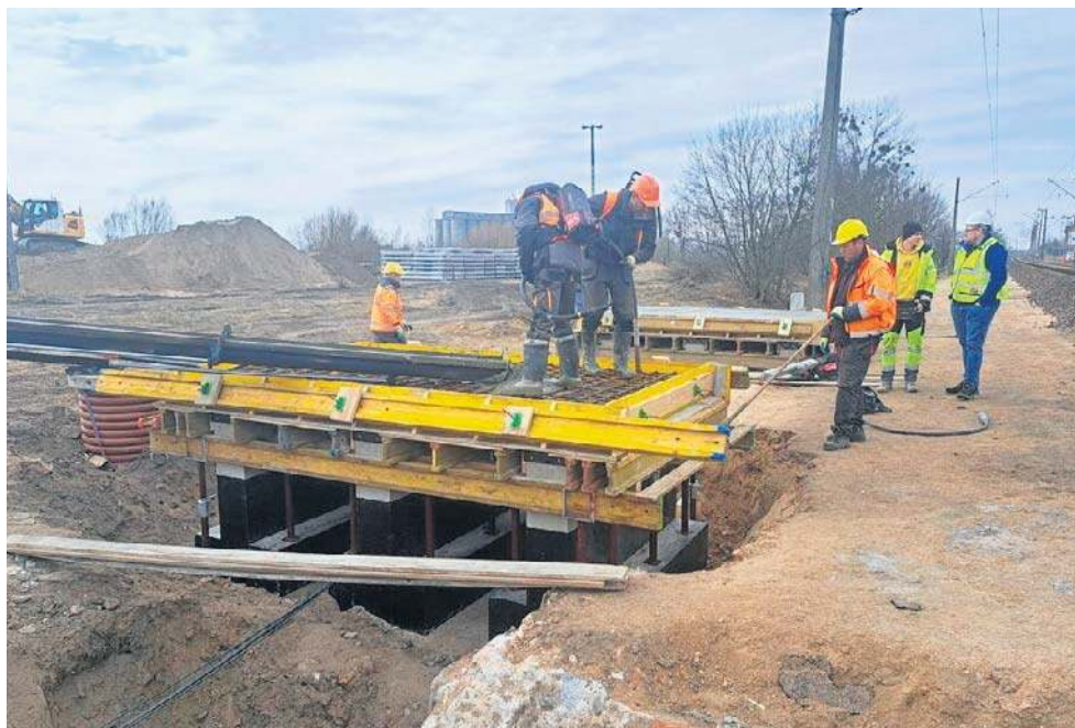
Budowa przystanku w Nakle. Gdy będzie gotowy, podróżni skorzystają m.in. z dwóch, komfortowych peronów, skąd wsiądą do pociągów w kierunku Piły lub Bydgoszczy

- Na peronach zapewnimy oczekiwany komfort obsługi - będą wiaty, ławki, gabloty informacyjne, czystelne oznakowanie oraz oświetlenie w po-