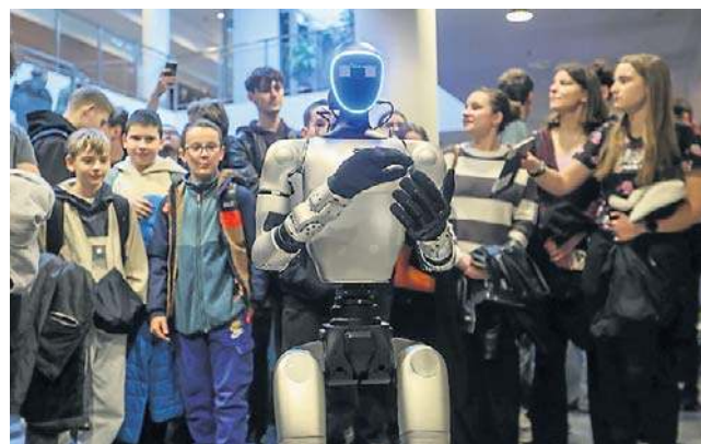
Roboty humanoidalne budzą zainteresowanie, głównie młodych ludzi, ale mogą okazać się przydatne

Drugim elementem były mobilne pracownie, które mają tra-