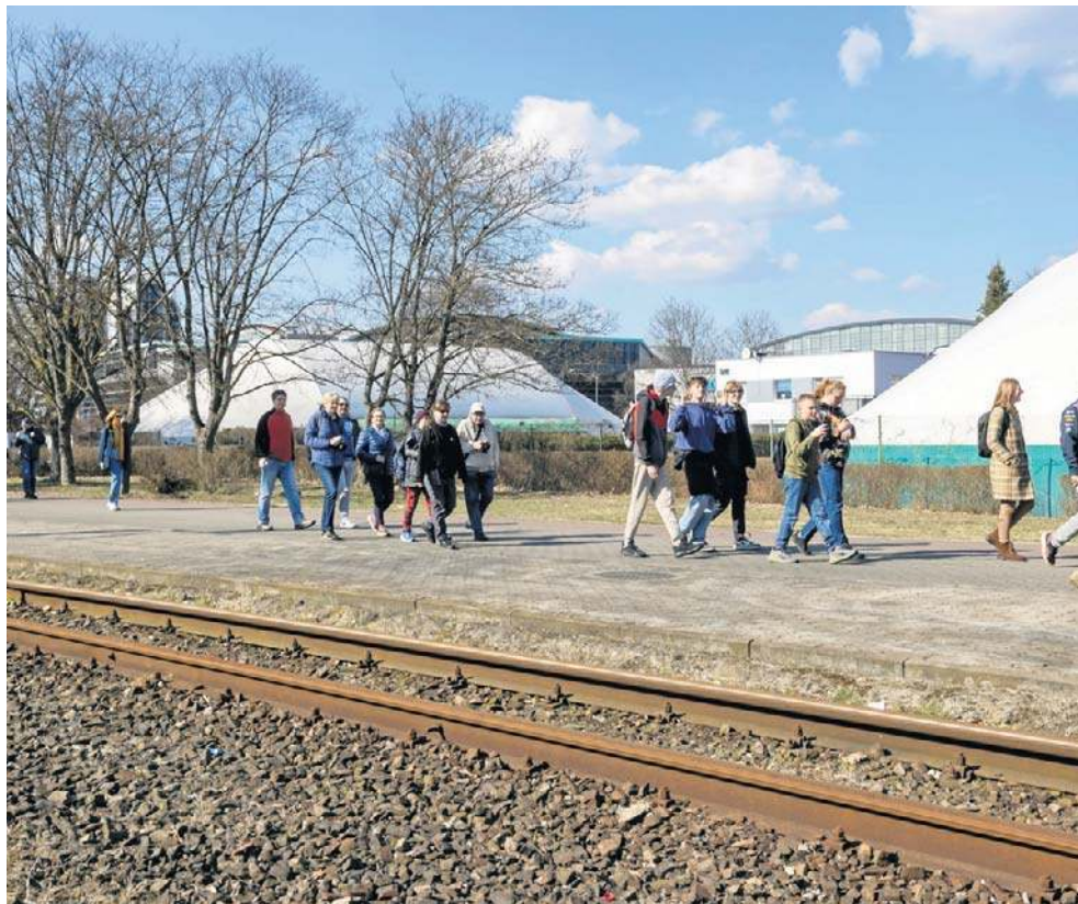
W 8. rocznicę zamknięcia torowiska na Babiej Wsi społecznicy zorganizowali spacer

- PINB prowadzi postępowanie w zakresie Babiej Wsi.