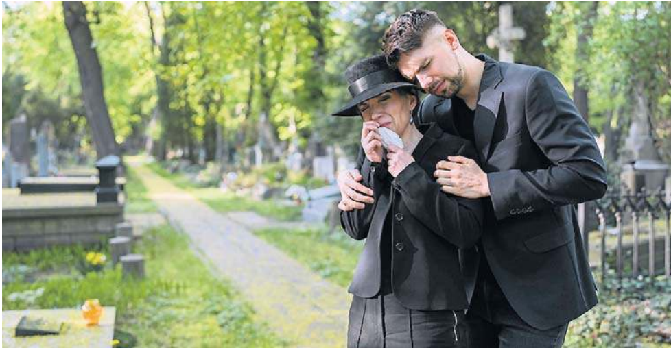
Osoba składająca wniosek o rentę wdowia może samodzielnie wybrać najkorzystniejszy wariant wypłaty

W przypadku przekroczenia tej wysokości świadczenia zostaną pomniejszane o wartość nadwyżki. Jeżeli natomiast już jedno świadczenie (emerytura lub renta rodzinna) będzie równe limitowi lub go przekroczy, renta wdowia nie będzie przysługiwać i wypłacane będzie wyłącznie jedno świadczenie. To istotna informacja zarówno dla osób, które już po-