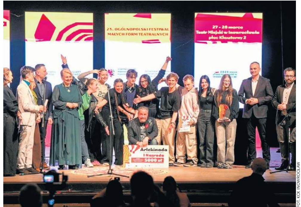
Podczas tegorocznej, 23. Arlekinady w Inowrocławiu obejrzeć można było osiem przedstawień. To najlepsze wystawił Teatr Próg z Wadowickiego Centrum Kultury

Zwieńczeniem emocjonującego festiwalu była uroczysta gala, podczas której wręczono nagrody. Grand Prix - Nagrodę Marszałka Województwa Ku-