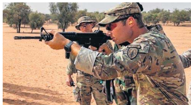
Amerykańscy żołnierze regularnie prowadzą ćwiczenia i operacje wojskowe w Afryce

Jak realne jest zagrożenie na kontynencie afrykańskim? Zapy-