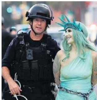
Policja aresztowała protestującą kobietę przebraną za Statuę Wolności po sobotnim wiecu „No Kings”

Policja użyła gazu łzawiącego i gumowych kul. Ponadto, funkcjonariusze na koniach zaatakowali pałkami małe grupy protestujących. Służby twierdzą, że użycie siły było odpowiedzią na ataki na policjantów. Bill Essayli, pierwszy asystent prokuratora krajowego USA, napisał na X, że wszyscy napastnicy zostaną znalezieni i aresztowani.