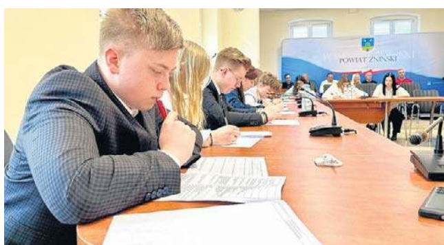
Również młodzież ze szkół ponadpodstawowych powiatu miała okazję wykazać się samorządową wiedzą

zem wiedzę sprawdzali uczniowie szkół ponadpodstawowych.