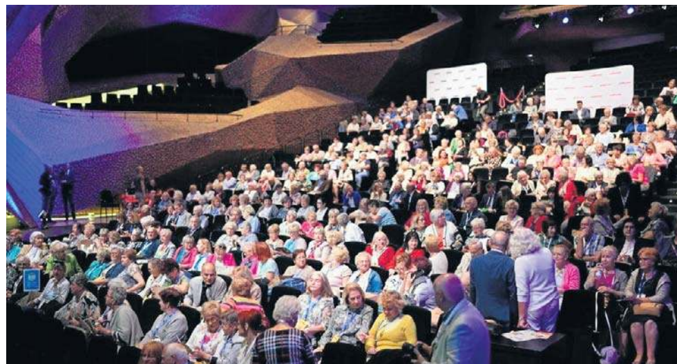
Podczas każdej edycji naszego Forum gościimy po 500 seniorów z naszego regionu

To już XII edycja naszej imprezy. Przez kilka ostatnich edycji gościliśmy w Toruniu. We wrześniu ubiegłego roku spotkaliśmy się w CKK Jordanki. Było m.in. o tym jak dbać o serce, jak się ustrzec przed pożarami, jak rozpoznać objawy podtrucia. Seniorzy usłyszeli także o różnych formach wsparcia dla osób starszych i pracodawców planujących zatrudnić seniorów, które