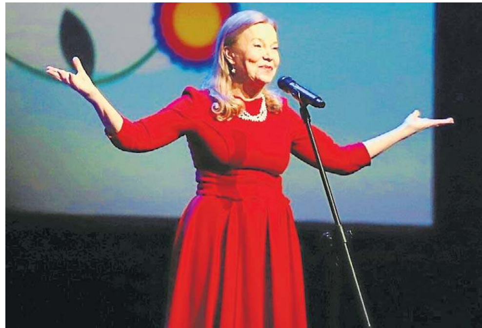
Gościem specjalnym jubileuszowego, X Forum Seniora, była aktorka Laura Łącz