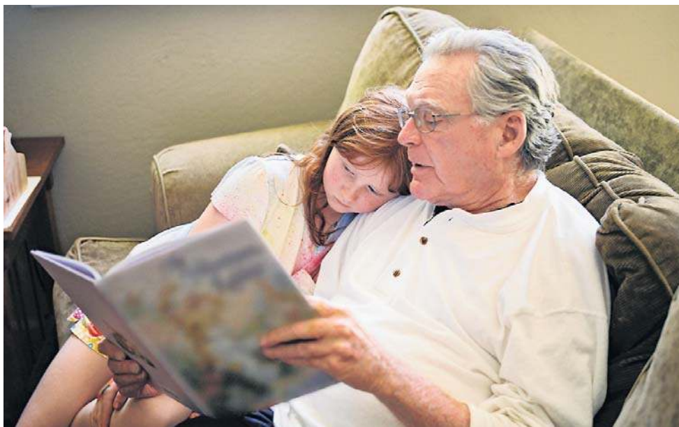
Zaawansowane dziadkowanie służy mózgowi

Wyniki okazały się jednoznaczne - i pod pewnymi względami zaskakujące. Dziadkowie, którzy angażowali się w opiekę nad wnukami, niezależnie od jej formy czy częstotliwości, uzyskali lepsze wyniki w testach pamięci i płynności słownej niż osoby, które nie pełniły takiej roli. Jeszcze ciekawszy obraz wyłania się z analizy długoterminowej. Babcie aktywnie uczestniczące w opiece nad wnukami doświadczały wolniejszego