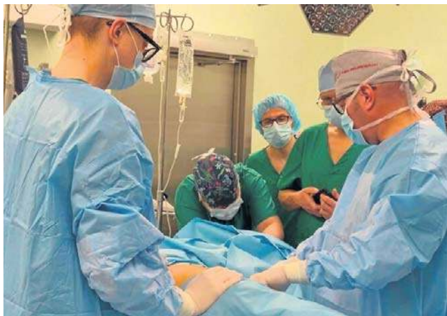
Szpital we Włocławku wzbogacił się niedawno w robota chirurgicznego. Lekarze i pielęgniarki już się szkolą

opr. Joanna Maciejewska joanna.maciejewska@polskapress.pl