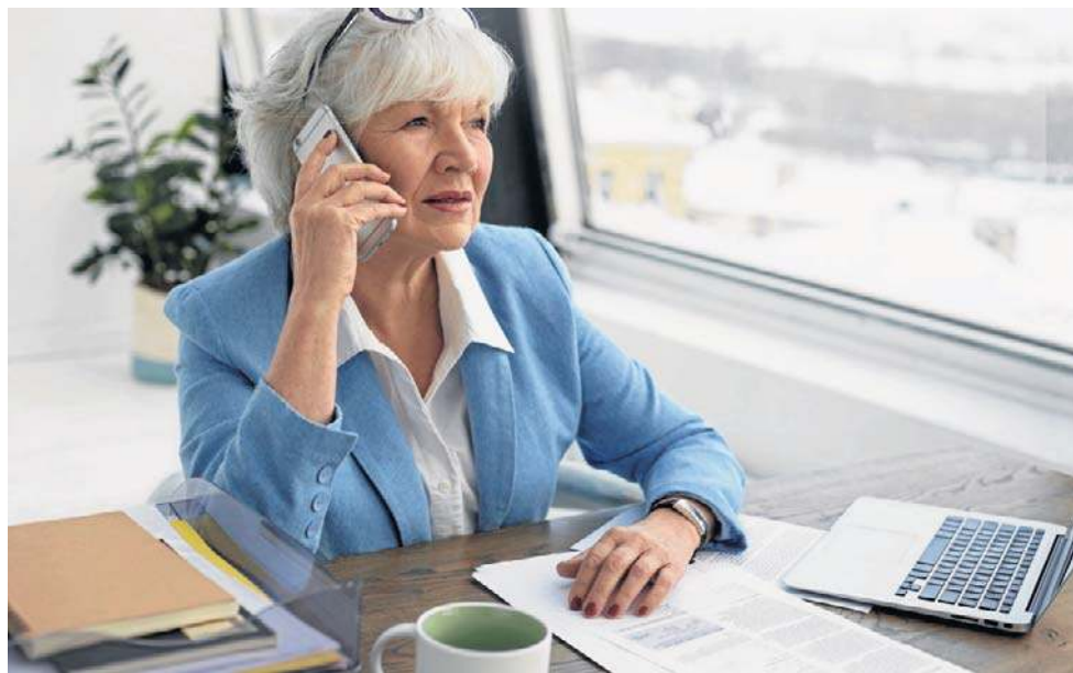
Prym wśród pracujących seniorów wiodą kobiety

Zarobki przekraczające 70 proc., lecz nie wyższe niż 130 proc. przeciętnego wynagrodzenia (od 6438,50 zł do 11 957,20 zł brutto), skutkują odpowiednim zmniejszeniem wypłaty o kwotę przekroczenia, jednak nie więcej niż