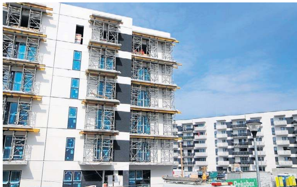
Po lewej - siódmy blok wyrósł na osiedlu przy ulicy Celulozowej

Jak podaje Urząd Miasta, prace polegają też na montażu attyk i nadszypia wind. Zakończono montaż konstrukcji budynku oraz montaż stolarki okiennej, murowanie ścian działowych. Kontynuowane są prace związane z instalacjami elektrycznymi i sanitarnymi wewnątrz budynku. Zakończono montaż wiaty śmietnikowej. Układany jest styropian posadzkowy. Rozpoczęto betonowanie posadzek.