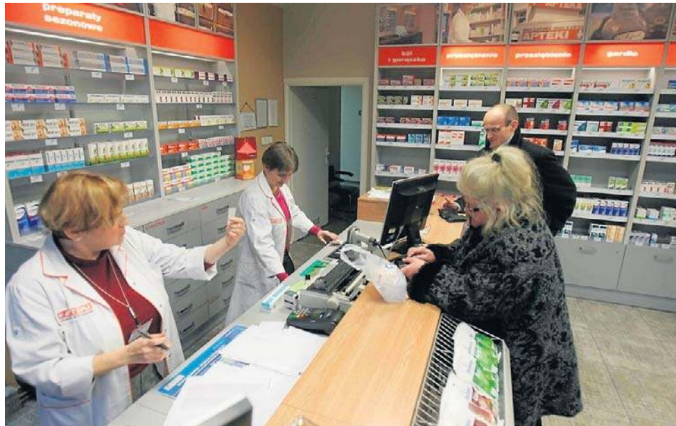
Ceny poszły w górę, a najbardziej leków bez recepty, suplementów, którymi Polacy leczą sami m.in. przeziębienia. Jest duże zainteresowanie, więc producenci chcą zarobić więcej

„Różnice cen między aptekami są rzeczą naturalną w go-