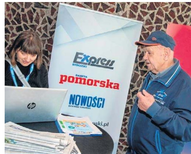
Forum organizują trzy tytuły: Pomorska, Express i Nowości

edycji - X Forum Seniora - gościem specjalnym była znakomita aktorka Laura Łącz. X Forum Seniora upłynęło pod znakiem arcyciekawych prelekcji. Było m.in. o rencie wdowiej, sanatorium z ZUS, kosmetyce onkologicznej oraz programach profilaktycznych realizowanych przez Kujawsko-Pomorski Oddział Wojewódzki NFZ. Seniorzy wysłuchali też prelekcji zatytułowanych: „Prostata pod kontrolą - badaj się zanim będzie za późno”, „Mocne kości do starości” czy „Wiosna w ogrodzie i na działce”. Nie zabrakło również części artystycznej. Wystąpił Żeński Chór Kameralny „Belcanto” działający przy Kujawsko-Pomorskim Centrum Kultury w Bydgoszczy oraz panie z zespołu „Taniec w kręgu” z Toruńskiego Uniwersytetu Trzeciego Wieku. ©©