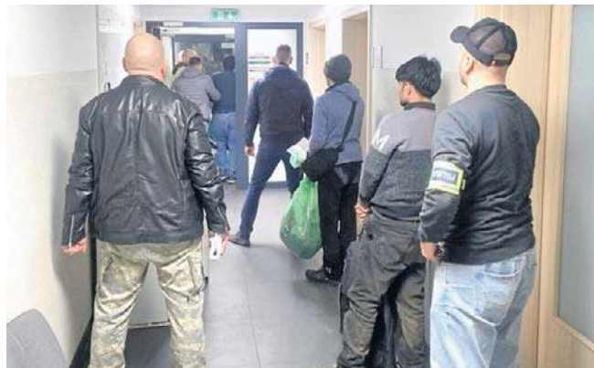
Afgańczyk i Pakistańczycy zostaną wydaleny z Polski. Ukraińcowi grozi zaś do 8 lat pozbawienia wolności

Potwierdzono, że Afgańczyk i Pakistańczycy nie posiadali odpowiednich dokumentów i legalnego pobytu w Polsce. W obecności biegłych tłumaczy mężczyźni zostali przesłuchani. Wobec nich zostały wszczęte procedury Straży Granicznej, celem wydalenia z terytorium RP. Obywatel Ukrainy odpowie za pomocnictwo przy nielegalnym procederze, za co usłyszał zarzut. Trafił na 3 miesiące do aresztu. Grozi mu 8 lat pozbawienia wolności.