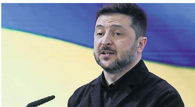
Zelenski popiera rozejm na czas Wielkanocy

- Chcę wszystkim przypomnieć, że my odpowiadamy (na rosyjskie ataki - PAP). Dlaczego o tym przypominam? W ostatnim czasie, po tak silnym świa-