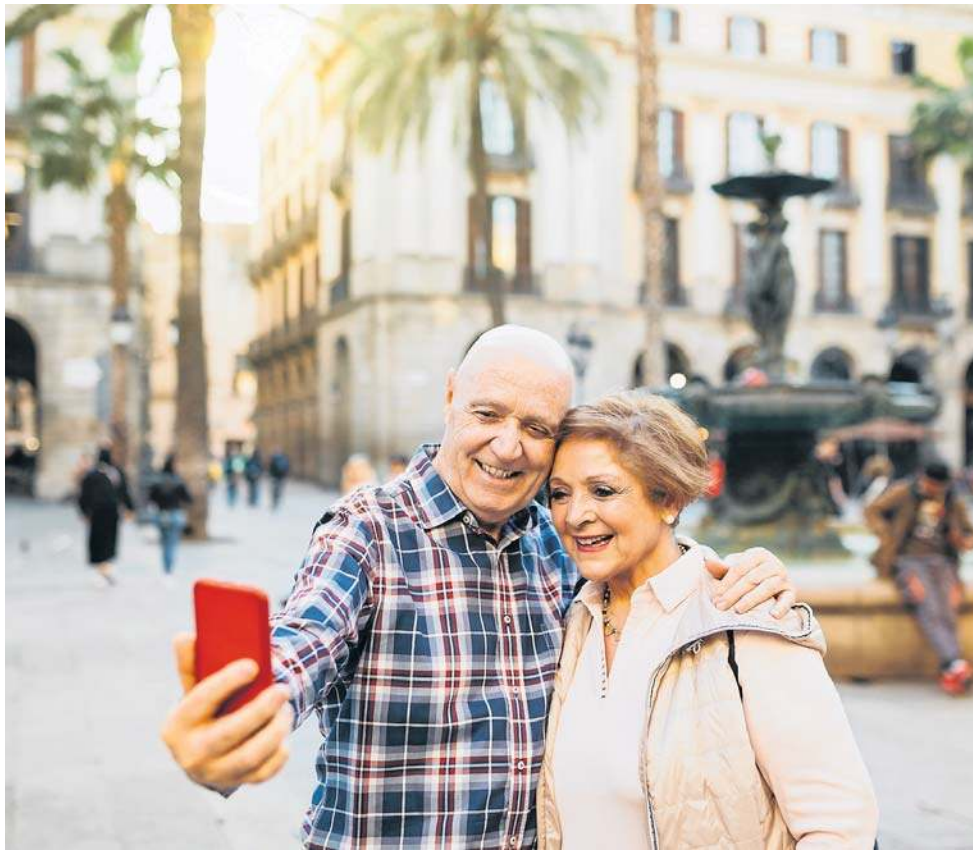
Jakie są naprawdę turystyczne zwyczaje osób powyżej 60. roku życia?

Okazuje się, że silwersi w większości bardzo mądrze wybierają terminy swoich wyjazdów. Dominują wycieczki