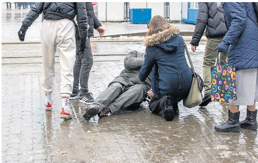
Zagrozenie upadkami rośnie z wiekiem. Przyczyniają się do niego zmiany fizjologiczne, jak utrata masy mięśniowej, osteoporoza i problemy z narządami zmysłów

- W ciągu ostatnich kilkunastu lat nastąpiły poważne zmiany w rodzaju wypadków, które najbardziej zagrażają ży-