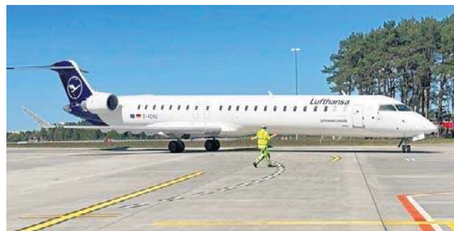
W sezonie letnim dojdzie szóste połączenie do Frankfurtu

Istotne zmiany wprowadziły również Polskie Linie Lotnicze LOT. Od 29 marca wszystkie rejsy na trasie Bydgoszcz - Warszawa są realizowane w najbardziej pożądanym przez biznes i turystów systemie: wylot 6 dni w tygodniu (z wyjątkiem niedziel) z Bydgoszczy rano (5.35, na miejscu 6.30) i powrót wieczorem (wylot ze stolicy 22.55, przylot 23.45). Taka formuła po-