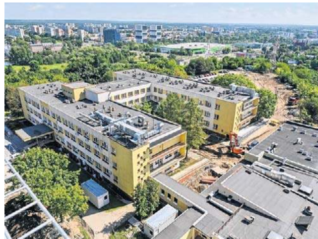
Szpital „Biziel” rozbuduje budynek 1D oraz zakupi nowoczesny sprzęt

W ramach inwestycji budynek 1D zostanie rozbudowany o piętro, dzięki czemu powstanie 1 350,22 metrów kwadratowych dodatkowej powierzchni dla poradni i pracowni Ambulatoryjnej Opieki Specjalistycznej. Znajdą się tam m.in. gabi-