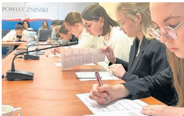
Jako pierwsi do powiatowego konkursu z wiedzy o samorządzie przystąpili uczniowie podstawówek

Jak wspomnieliśmy, dzień później zorganizowano drugą część 26. edycji Powiatowego Konkursu Wiedzy o Samorządzie Terytorialnym. Tym ra-