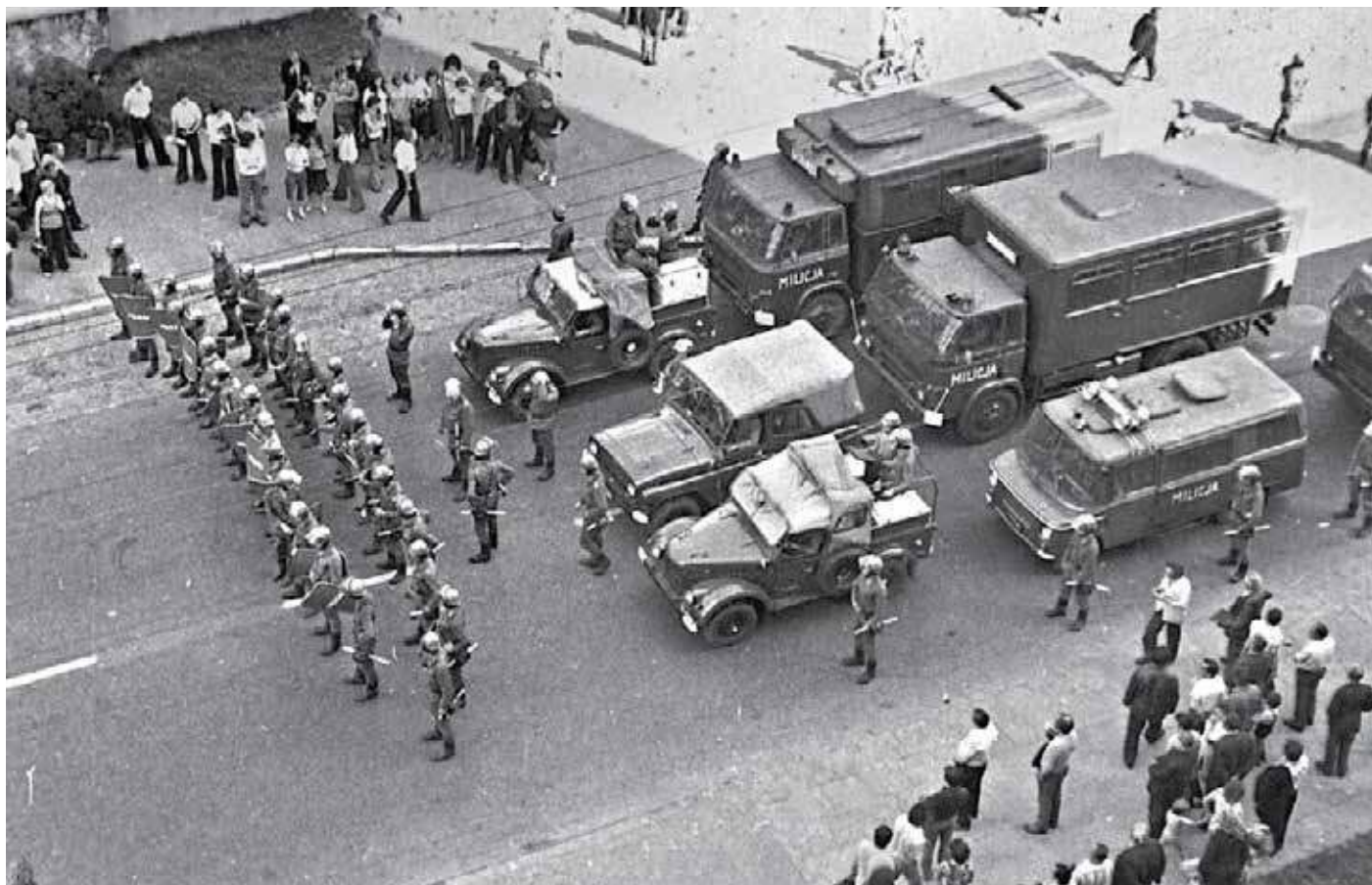
Oddziały ZOMO, czyli Zmotoryzowanych Odwodów Milicji Obywatelskiej, interweniujące na ulicach Radomia w 1976 r.

Postulaty sierpniowe, oprócz postulatu nr 3 („Przestrzegać zagwarantowanej w Konstytucji PRL wolności słowa, druku, publikacji, a tym samym nie represjonować niezależnych wydawnictw oraz udostępnić środki masowego przekazu dla przedstawicieli wszystkich wyznań”) w większości mają charakter socjalny, co stanowiło kolejną wersję naprawiania PRL-u. Być może na postulaty systemowe było za wcześnie, być może wpływ na to mieli w większości lewicowi intelektualiści, ale na pewno bez Czerwca 1976 nie byłoby Sierpnia 1980 r. i późniejszych etapów dochodzenia do suwerenności i wolności Rzeczypospolitej. ■