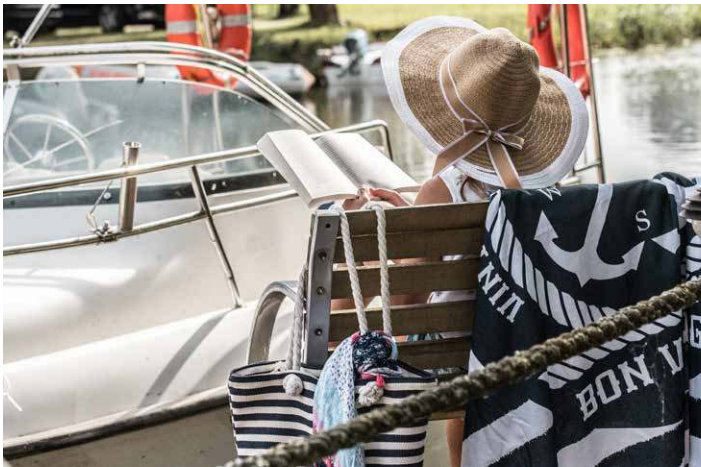
Wakacyjny dziennik może być pomostem między końcem roku szkolnego a wrześniem