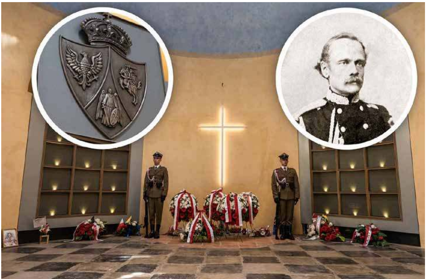
Zygmunt Sierakowski spoczywa od 2019 roku w kaplicy powstańców na Cmentarzu na Rossie w Wilnie

Leżący od 2019 r. na wileńskiej Rossie powstaniec znał się z Giuseppem Garibaldim, miał pozwolenie caratu na wyjazdy za granicę. Postać nietuzinkowa – warto przyjrzeć się jego projektowi „Sprawa polska”, który dotyczył m.in. Litwinów, Białorusinów i Ukraińców.