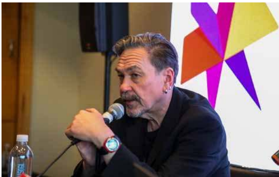
Jurij Andruchowycz, wybitny ukraiński pisarz, będzie gościem nowego Festiwalu Literackiego „Miasto z rzeką”, który odbędzie się w Przemyślu w dniach 23–26 lipca

Na lotnisku Czaplinek-Broczyńno w województwie zachodniopomorskim odbędzie się z kolei Pol'and'Rock Festival. Potrwa trzy dni, od 30 lipca do 1 sierpnia. Uczestnicy jak co roku będą mogli liczyć na solidną dawkę muzyki. Na każdej edycji festiwalu występuje kilkadziesiąt zespołów z Polski i świata. Organizatorzy kwalifikują je na podstawie przesłuchań chętnych, którzy chcą zaprezentować się przed ogromną publicznością. ➤➤