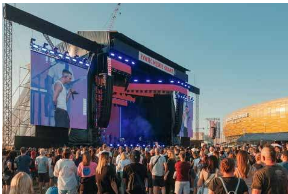
Trasa jednego z najpopularniejszych w Polsce letnich festiwali, Żywiec Męskie Granie, objmie 12 koncertów w sześciu miastach

W tym roku odbędzie się już 31. edycja „Mulatki”. Największymi gwiazdami będą: Kabaret Moralnego Niepokoju, Kabaret Smile, Mumio oraz Kabaret Chyba. ■