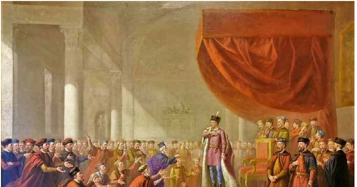
Stefan Batory stawiany jest w szeregu najlepszych władców Rzeczypospolitej Obojga Narodów. Na ilustracji: obraz Wincentego Smokowskiego, Batory ustanawia Uniwersytet Wileński