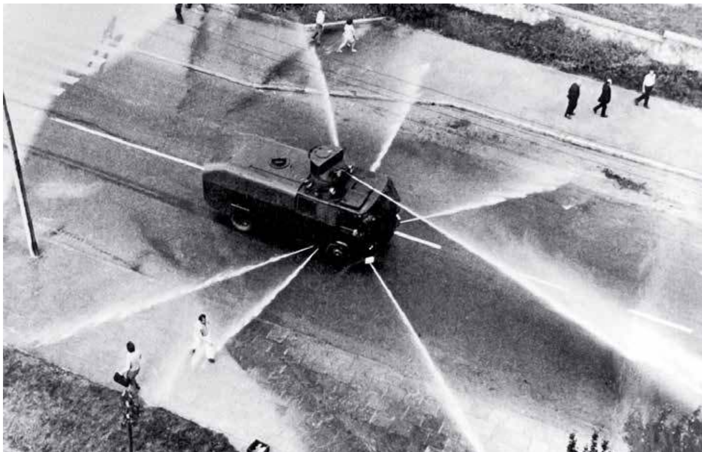
Radomski Czerwiec 1976 r.

Co roku Sejm i Senat RP ogłaszają patronów roku. W ramach tej inicjatywy honorowane są osoby, instytucje i wydarzenia. Senat RP podjął uchwałę, w myśl której rok 2026 będzie rokiem Robotniczych Protestów Czerwca 1976, które objęły Polskę w tamtym czasie.