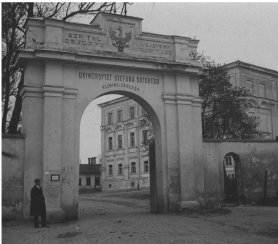
W latach 1919–1939 Uniwersytet Wileński nosił imię Stefana Batorego

Obecnie w Wilnie jest ulica nosząca imię polskiego króla (lit. Stepono Batoro gatvė). W okresie międzywojennym była to ulica o nazwie Trakt Batorego, w czasach sowieckich – Pramonės. Ta miejska arteria przebiega przez dawny „szlak Batorego”, prowadzący z Wilna na wschód w kierunku Połocka i Pskowa, oraz przypomina o wyprawach wojennych króla na Moskwę. ■