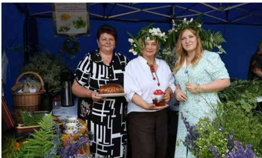
Wokół sceny działały liczne stoiska, które przyciągały zarówno najmłodszych, jak i dorosłych uczestników

Nie mogło zabraknąć jednego z najważniejszych elementów świętojańskiej tradycji – ogniska, którego płomień rozświetlił przestrzeń i nadał wydarzeniu tajemniczego, niemal baśniowego charakteru. W późniejszych godzi-