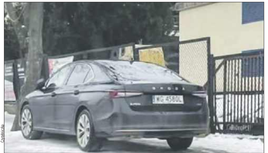
➤ Czytelniczka zgłosiła, że służbowy samochód starostwa zastawił chodnik przed Publiczną Szkołą Podstawową nr 5 w Garwolinie

P arkowanie w pobliżu placówek oświatowych to temat budzący emocje, zwłaszcza gdy dotyczy osób na eksponowanych stanowiskach. We wtorek, 10 lutego, odezwała się do nas Czytelniczka. Zgłosiła, że służbowy samochód starostwa zastawił chodnik przed Publiczną Szkołą Podstawową nr 5 w Garwolinie. Wykonała jego zdjęcie o godzinie 13:40. Autorka zgłoszenia nie kryje irytacji. Pyta, czy starosta jeździ na innych warunkach niż pozostali mieszkańcy? Nadmieniam, że nie wiem, jak długo auto stało w tym miejscu. Dodaje, że to nie pierwszy raz, gdy służbowy samochód starostwa staje w ten sposób.