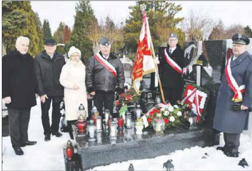
❖ Pamięć wybitnego pilota i komendanta-rektora Szkoły Orłąt uczcili reprezentanci Dęblińskiego Oddziału Stowarzyszenia Seniorów Lotnictwa Wojskowego RP oraz koledzy i podwładni