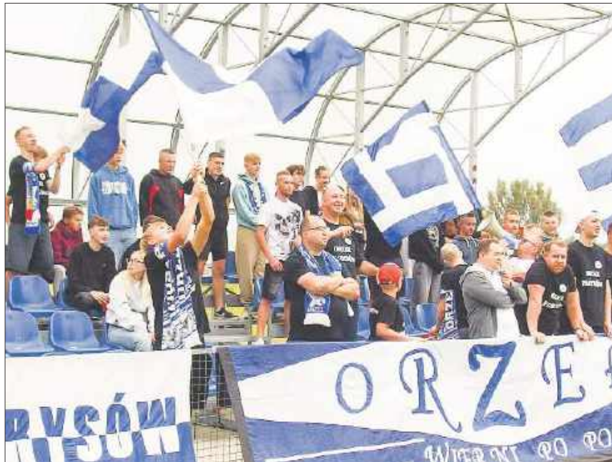
Runda pokazała, że Orzeł zawsze gra w dwunastu. Tym dodatkowym zawodnikiem są ich kibice, których pasja do futbolu i drużyny przyciąga na trybuny