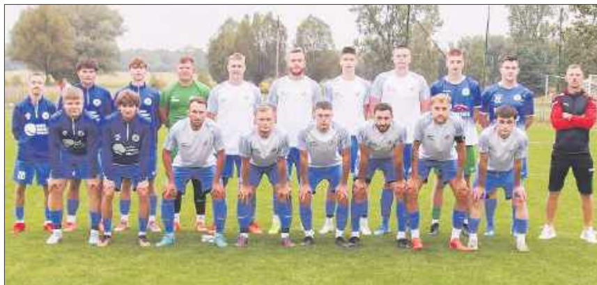
Orzeł Parysów - jesień 2025

i trzy hat-tricki. Ten duet to postrach dla obrońców w całej lidze.