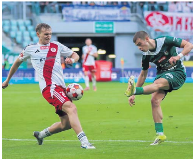
Piłkarze Wieczystej Kraków, Polonii Warszawa, Chrobrego Głogów i ŁKS-u Łódź powalczą w barażach

Ostatniego beniaminka poznamy w najbliższą niedzielę. Starcie finałowe baraży rozpocznie się o godz. 20.45. Transmisje ze wszystkich spotkań barażowych będzie można obejrzeć w TVP Sport i w serwisie tvpsport.pl. ©©