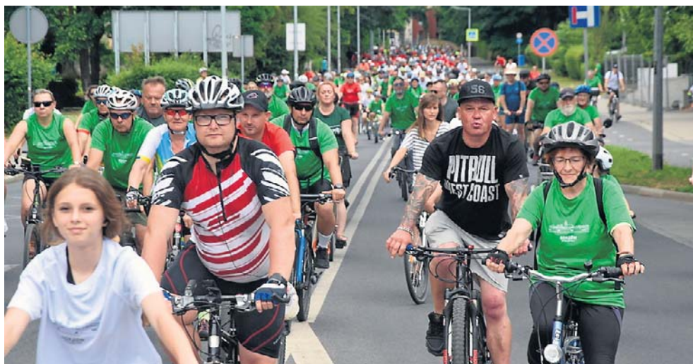
W ubiegłorocznej Urodzinowej Masie Rowerowej wzięło udział około tysiąca rowerzystów

Zasady są bardzo proste. Trzeba zdobyć jak najwięcej punktów, a każdy z nich przyznawany jest za przejechanie tylu kilometrów, ile tysięcy mieszkańców ma dana miejscowość czy gmina. Jeśli żyje w niej 10 tys. osób, to jeden