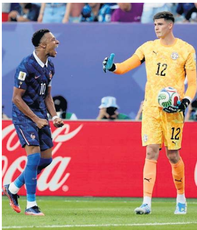
Po grze w kości, w którą „zabawiali się” Paragwajczycy, kapitan Francji zignorował gratulacje od bramkarza Gilla

z PSG wywalczył bowiem jedyną bramkę w meczu, która okazała się decydującą dla losów tego spotkania. Do piłki podszedł Kylian Mbappe i strzałem w lewy róg bramkarza dogonił w klasyfikacji Lionel Messi, zdobywając siódmą bramkę w turnieju i zarazem dziewiętnastą w historii swoich występów na mistrzostwach.