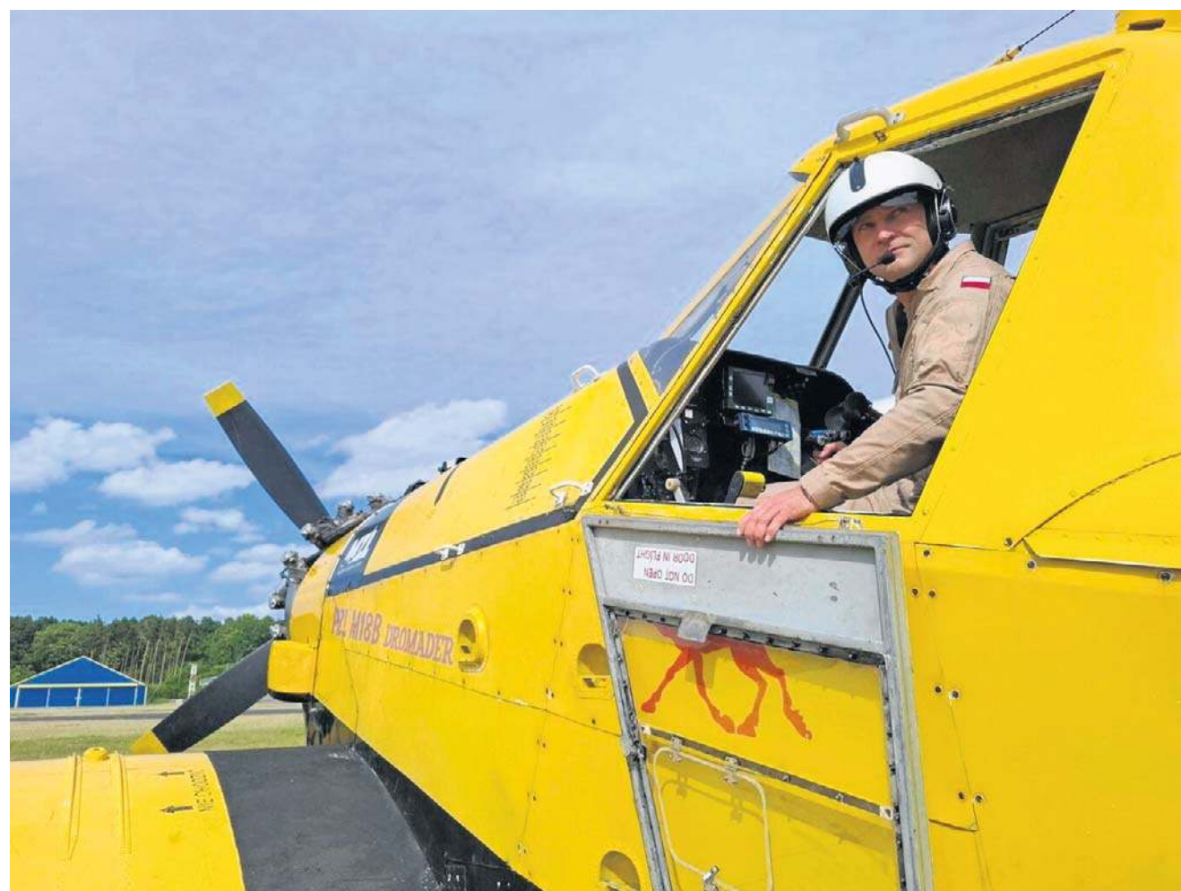
FOT. ADAM WILLIMA

- Jeśli jednak zrzut zatrzyma ogień w zarodku, zanim wejdzie w zwarty kompleks, oszczędzamy nie tylko drzewa, ale i godziny pracy strażaków, dojazdu, sprzęt - podkreśla pilot z mieleckiej firmy. - Ograniczamy ryzyko dla ludzi, straty przyrodnicze i wszystko, co może stać na drodze ognia. ©