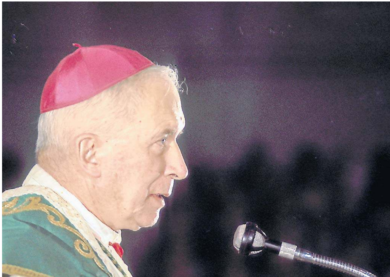
W roku 1988 bez zgody papieża Jana Pawła II Marcel Lefebvre wyświęcił czterech biskupów, za co ściągnął na siebie ekskomunikę latae sententiae