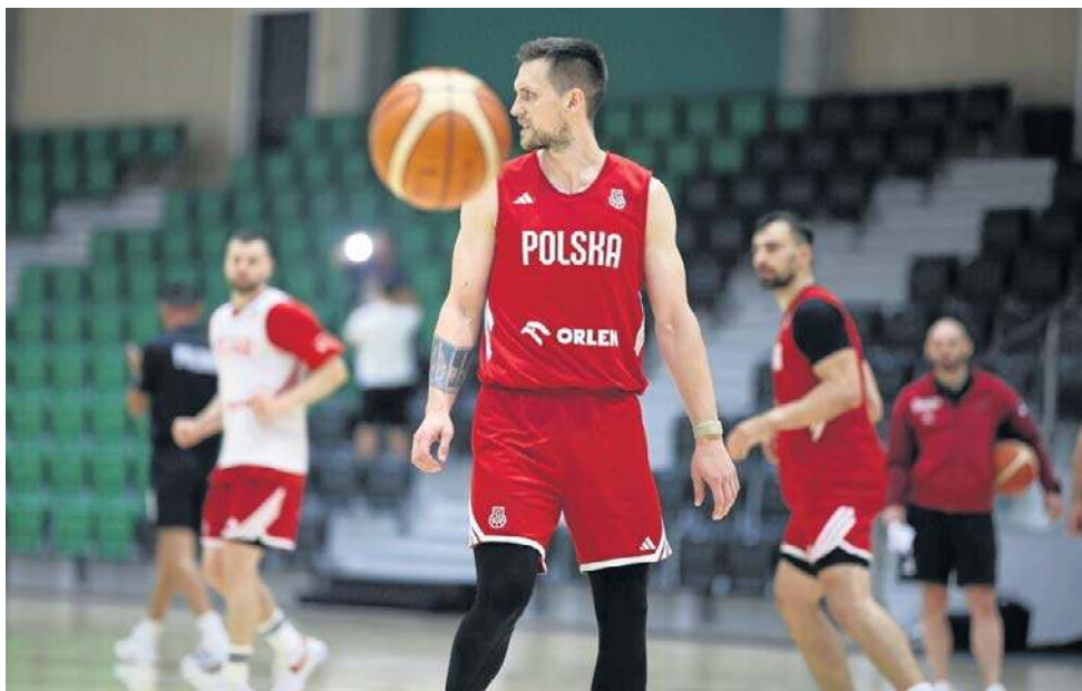
Reprezentacja Polski koszykarzy zagra dziś w Krakowie z Holandią w el. MŚ

Polacy wygrali walkę pod tablicami 38:22, mieli 30 asyst (ry-