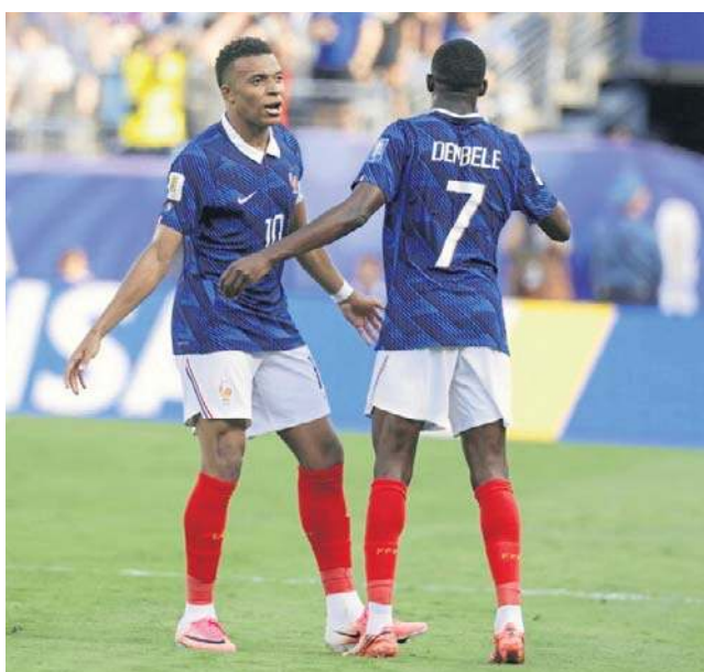
Francja w 1/8 finału pokonała Paragwaj. W ćwierćfinale zmierzy się z czarnym koniem mundialu - Marokiem

To jest niesamowite, że oni wszyscy biorą na siebie ciężar gry, pomimo że większość z nich ma za sobą ponad siedemdziesiąt meczów w zakończonym niedawno sezo-