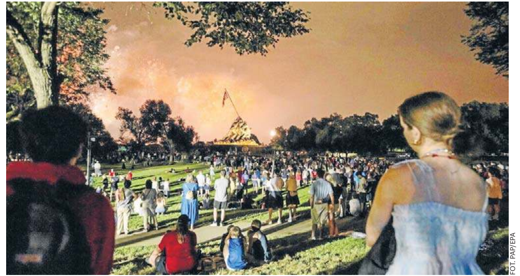
Pokaz fajerwerków w Waszyngtonie zgromadził tysiące widzów

- Ameryka nigdy nie będzie krajem komunistycznym - za-