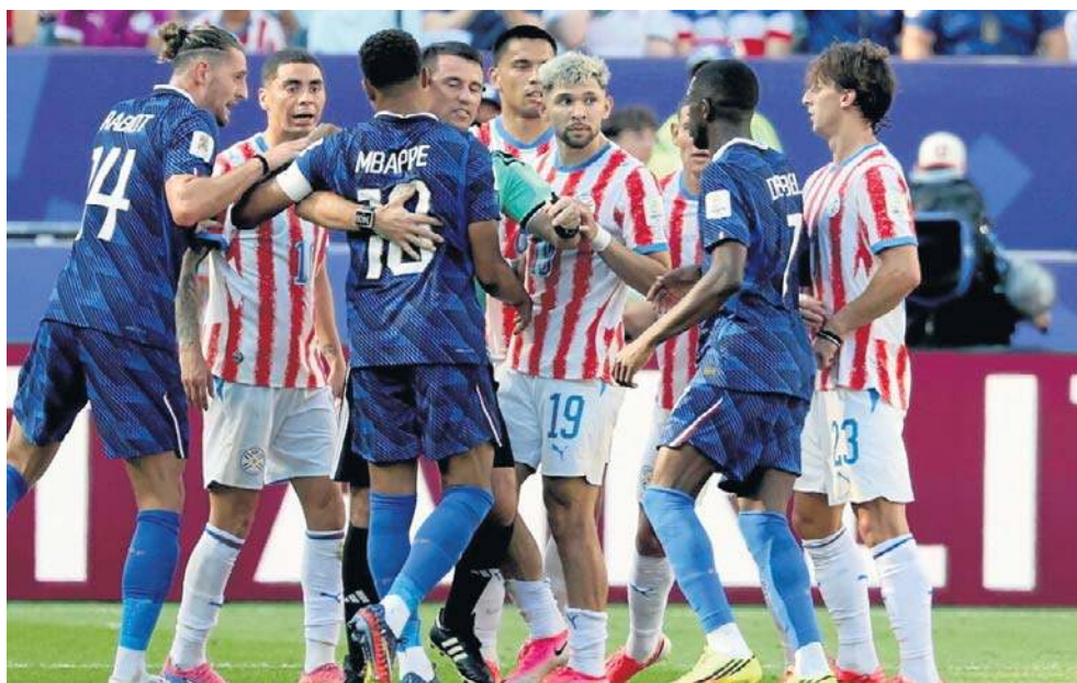
Za nami naprawdę brudny mecz, w którym arbiter często musiał rozdzielać piłkarzy...

Widowisko okazało się więc nieatrakcyjne. Francja długo nie mogła skruszyć paragwajskiego muru. Bogiem a prawdą, w pierwszej połowie nie stworzyła sobie klarownych sytuacji. Didier Deschamps już po godzinie wpuścił na boisko Desire Doue i to był strzał w dziesiątkę. Kilka chwil po wejściu 21-latek