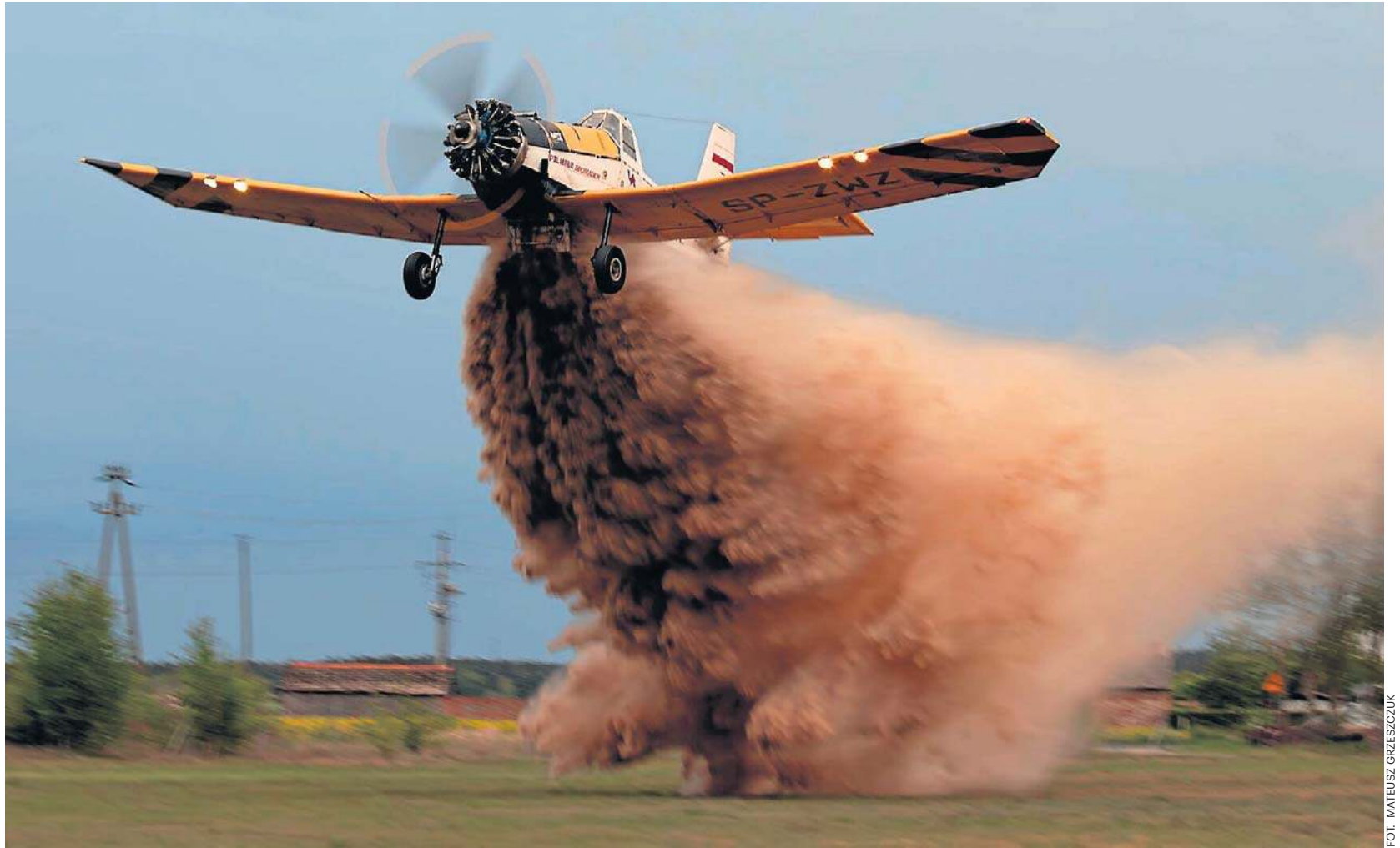
Gdy zrzuca się dwie tony wody, samolot potrafi wyskoczyć kilkadziesiąt metrów w górę

Lasy wchodzące w skład Regionalnej Dyrekcji w Toruniu są bardzo zróżnicowane. Mowa o Borach Tucholskich, Puszczy Bydgoskiej, Lasach Gostynińsko-Włocławskich i mniejsze kompleksach wokół wielu miast regionu. W niektóre miejsca dojazd wozami gaśniczymi jest stosunkowo prosty, ale w innych - mocno