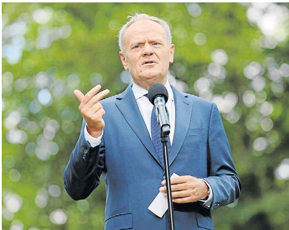
Premier Donald Tusk oświadczył, że konieczne są „systemowe rozwiązania”, które „uporają się z tymi najbardziej oburzającymi praktykami”

Potem Donald Tusk poinformował, że czeka do wtorku na propozycje rozwiązań systemowych i „precyzyjne rekomendacje” w związku z nieprawidłowościami w ochronie zdrowia. Problemy, które wymienił, to wspomniane już wyżej saloniki VIP w szpitalach, omijanie kole-