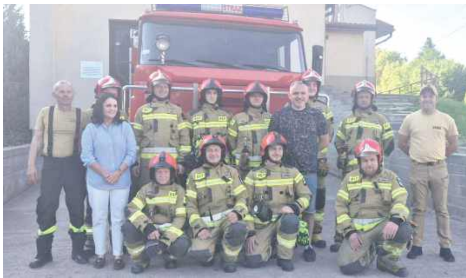
Nowy Star 266 zastąpił wysłużonego „Boberka”, czyli Stara 244, który przez lata wiernie służył jednostce

To legenda polskiego pożarnictwa, samochód, który mimo upływu lat wciąż uchodzi za niezawodny w trudnym terenie. Jak podkreślają drухowie, jego