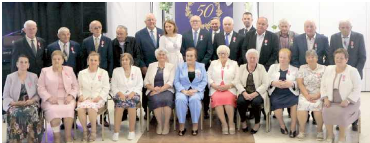
Małżonkowie, którzy od pół wieku wspólnie kroczą przez życie, zostali uhonorowani Medalami za Długoletnie Pożycie Małżeńskie