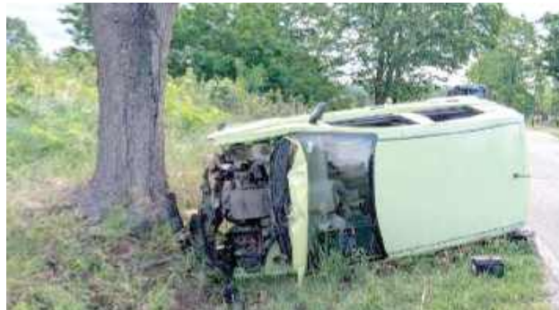
26-latek miał dużo szczęścia, skończyło się na ogólnych potłuczeniach

Jak ustalili funkcjonariusze, 26-letni mieszkaniec gminy Chodel jechał w kierunku Opola Lubelskiego. Na prostym odcinku drogi nie