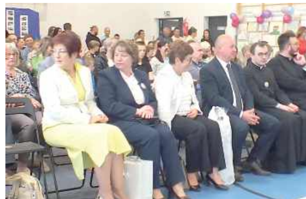
Goście dopisali - na uroczystość przybyli m.in. byli dyrektorzy, nauczyciele, uczniowie, przedstawiciele władz

Dla wielu mieszkańców szkoła była miejscem pierwszych marzeń, przyjaźni i sukcesów. To tutaj zaczynały się historie, które później prowadziły ich przez całe życie - podkreślali organizatorzy.