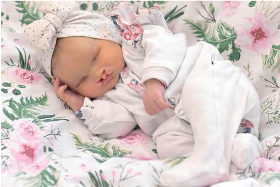
Mała Lilianka od pierwszych dni życia zmagają się z licznymi ciężkimi wadami wrodzonymi. Przed dziewczynką długa droga leczenia, rehabilitacji oraz specjalistycznych operacji, w tym kosztownego leczenia za granicą