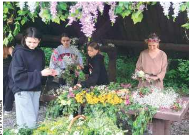
Nie mogło zabraknąć warsztatów wicia tradycyjnych wianków