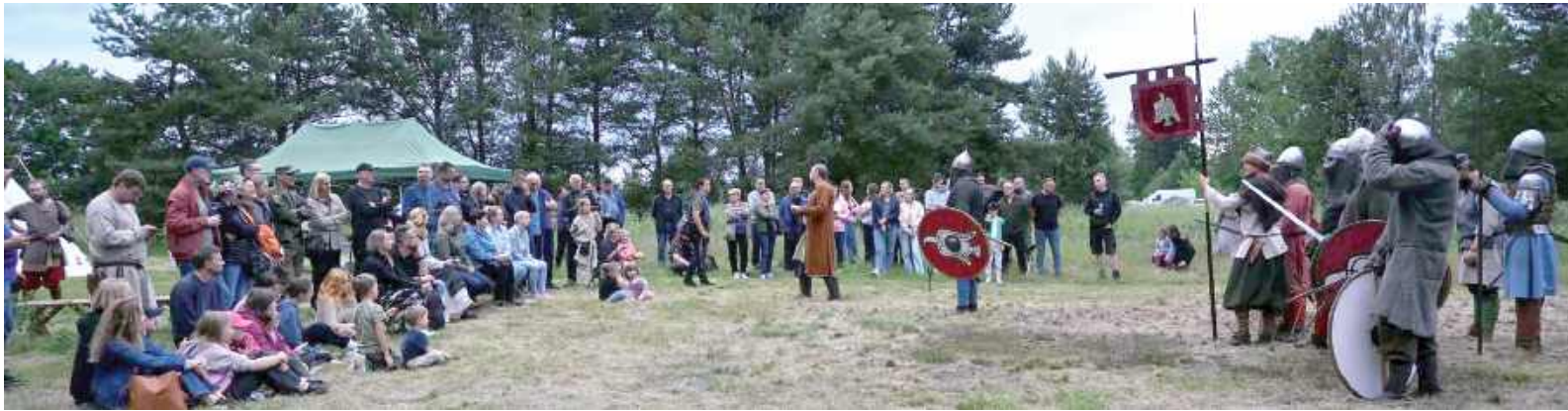
Tegoroczne Europejskie Dni Archeologii i Wianki nad Chodelką przyciągnęły do Chodlika tłumy!