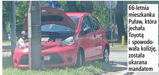
prawidłowo jadącemu Fordowi, którym kierował 60-letni Puławianin. Niestety doszło do zderzenia pojazdów. Na miejscu interwenio-

Do zdarzenia doszło w minioną środę przed godz. 10 na skrzyżowaniu Al. Partyzantów z ul. Wojska Polskiego. Jak wynika z ustaleń policji, kierująca osobową Toyotą 66-letnia mieszkanka Puław nie ustąpiła pierwszeństwa przejazdu