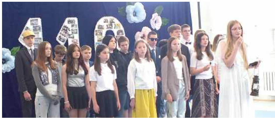
Młodzi artyści zabrali publiczność w niezwykłą podróż przez dzieje szkoły

Wśród zaproszonych gości znaleźli się byli dyrekto-