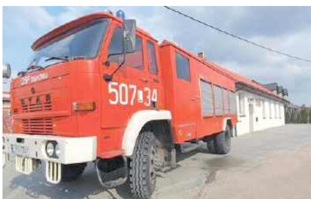
Przedmiotem sprzedaży jest ciężki samochód pożarniczy Star-Jelcz 244 wyprodukowany w 1988 roku

Wyprodukowany w 1988 roku pojazd przez lata był wykorzystywany przez strażaków ochotników, a dziś, mimo swojego wie-