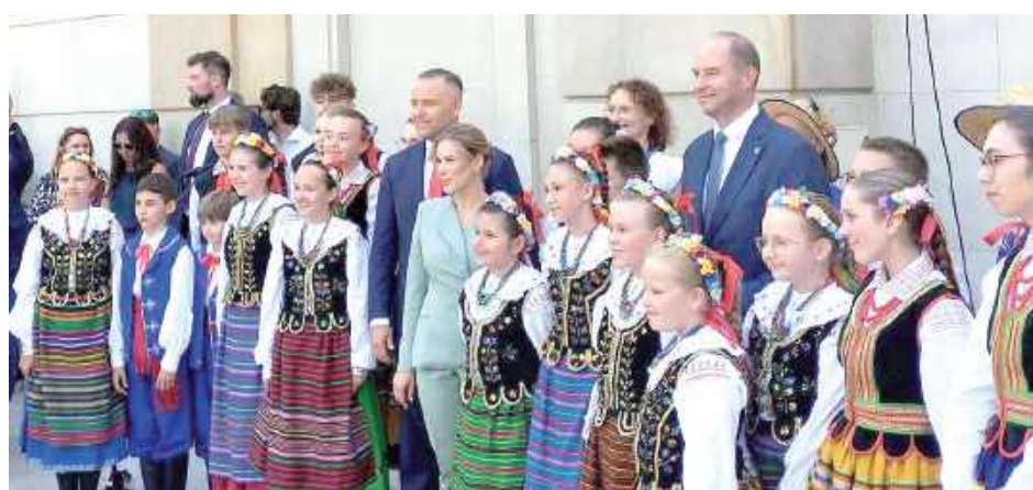
Powiśloki na spotkaniu z Parą Prezydencką

Nasi artyści zaprezentowali specjalnie przygotowa-