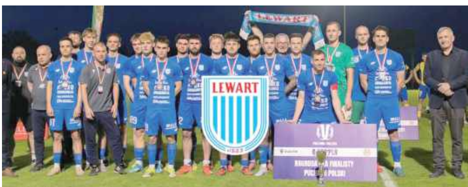
To był dobry sezon. Lewart zajął drugie miejsce w IV lidze. Do tego walczył w finale Pucharu Polski na szczeblu wojewódzkim

Po zakończeniu rozgrywek głos zabrał zarząd klubu, który za pośrednictwem mediów społecznościowych podsumował