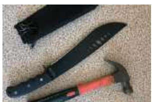
Z ustaleń funkcjonariuszy wynika, że w rejonie ulic Willowej i Altanowej młody mężczyzna miał chodzić z maczetą i młotkiem, a następnie uszkadzać stojące tam samochody

Z ustaleń funkcjonariuszy wynika, że w rejonie ulic Willowej i Altanowej młody mężczyzna miał chodzić z maczetą i młotkiem, a następnie uszkadzać stojące tam samochody.