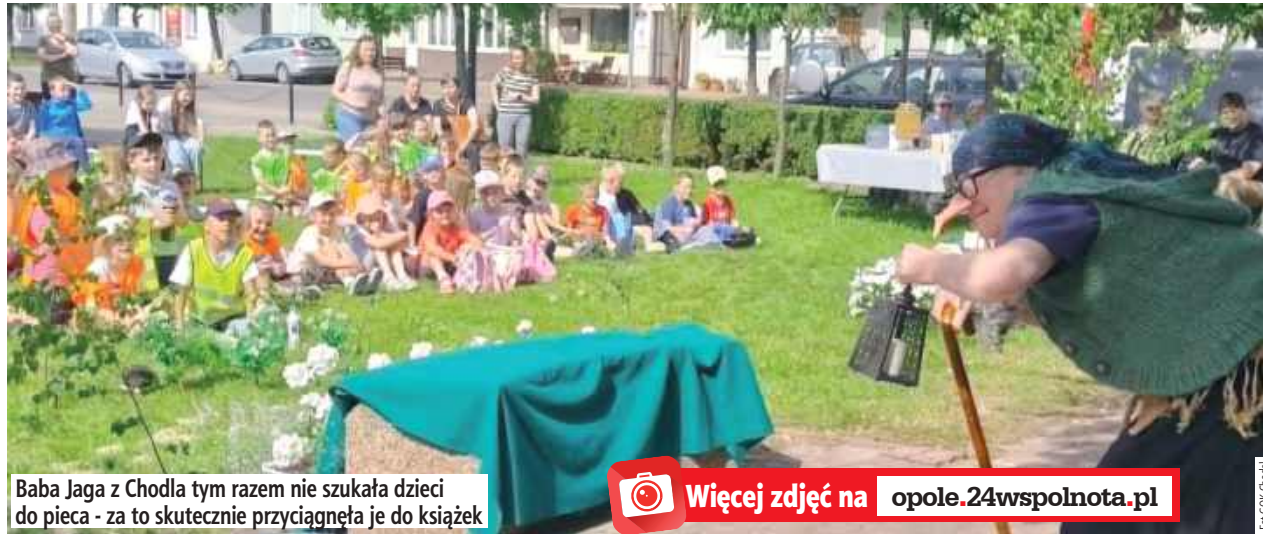
Baba Jaga z Chodla tym razem nie szukała dzieci do pieca - za to skutecznie przyciągnęła je do książek