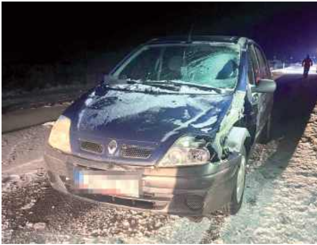
Do tragicznego wypadku doszło 8 stycznia. Zginął 52-letni mężczyzna

Do tragedii doszło 8 stycznia w pobliżu Niedźwiady. - Kierujący samochodem osobowym marki Volkswagen, podczas jazdy źle się poczuł, zatrzymał pojazd i wyszedł na jezdnię. W tym samym momencie został potrącony przez nadjeżdżający z naprzeciwka samochód marki Renault, którym kierował 48-letni mężczyzna - informuje podkomisarz Jagoda Maj z KPP w Lubartowie.