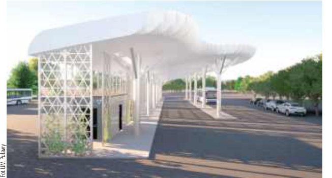
Po przebudowie terenu dworca PKS w centrum przesiadkowe, miejsce to ma być wizytówką Puław

- Oprócz nowej wiaty, powstanie publiczna toaleta. W dużej części obiekt będzie samowystarczalny energetycznie, ponieważ fotowoltaikę