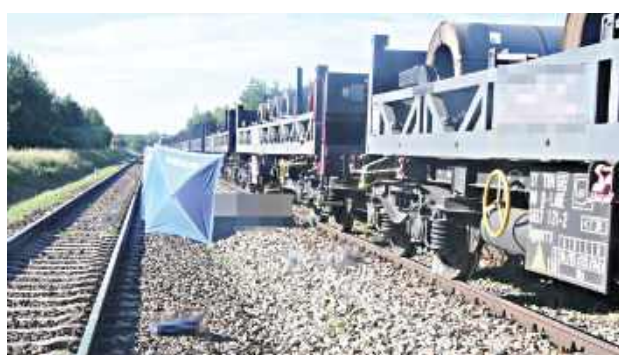
Mężczyzna leżał na międzytorzu prostopadle do torów

- Policjanci wstępnie ustalili, że maszynista pociągu towarowego z podczepionymi wagonami w ilości ponad 40 sztuk jechał od Zamościa do Stalowej Woli. W pewnej chw-