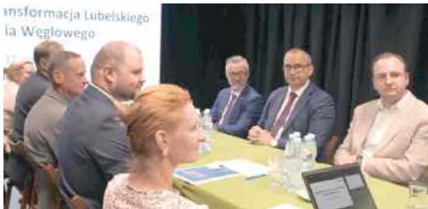
Samorządowcy i eksperci szukają alternatyw dla Bogdanki

Transformacja energetyczna regionów górniczych to jeden z najbardziej skomplikowanych procesów społeczno-gospodarczych, przed jakimi stają współczesne samorządy. Nagłe wygaszanie przemysłu ciężkiego bez wcześnie-