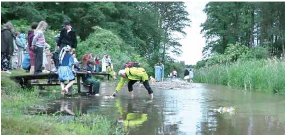
Tego wieczoru nasza Chodelka znów zapętniła się wiankami