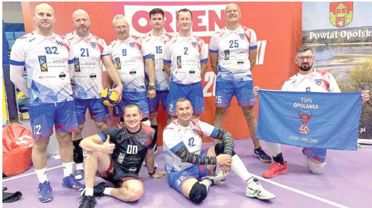
Wielkie brawa dla naszych siatkarzy!

Najwięcej emocji przyniosło spotkanie o brązowy medal. Po zaciętym i wyrównanym pojedynku TSPS Opolanka musiała uznać wyższość drużyny Kurpie Volleyball Drążewo, która osta-