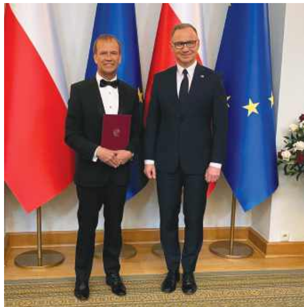
Prezydent RP Andrzej Duda wręczył dyplom nominacyjny na profesora Robertowi Gajdzie

W Szkole Podoficerskiej SONDA odbyły się 30 maja uroczystości Święta Szkoły, których kulminacyjnym momentem było przekazanie repliki radiostacji „Burza 2”. Ten symboliczny gest pamięci był pierwszym w historii przypadkiem, gdy replikę legendarnego urządzenia konspiracyjnego przekazano państwowej instytucji wojskowej