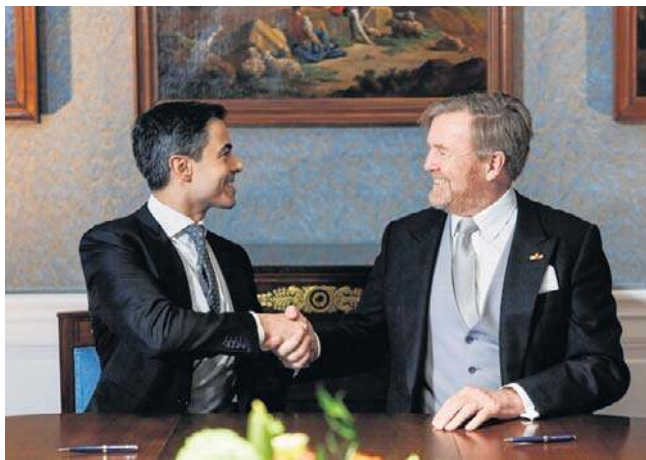
Król Wilhelm-Aleksander zaprzysiężił w pałacu Huis ten Bosch w Hadze mniejszościowy rząd Roba Jettena

Rob Jetten obejmuje urząd w wieku 38 lat. Jest najmłodszym premierem w historii Holandii i pierwszym otwarcie homoseksualnym szefem rządu. PAP