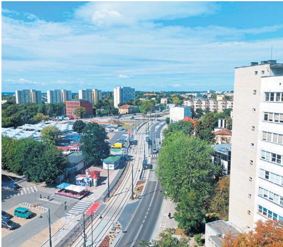
U zbiegu Dekerta i Szosy Chełmińskiej może stanąć 55-piętrowy wieżowiec

W strefie planistycznej oznaczonej symbolem 197SW (strefa wielofunkcyjna z zabudową mieszkaniową wielorodzinną) położonej u zbiegu ul. Sz. Chełmińska i Dekerta, ustalono maksymalną wysokość zabudowy - 55 m, maksymalny udział powierzchni zabudowy na poziomie 80 proc. oraz minimalny udział powierzchni biologicznie czynnej wynoszący 30 proc. Oznacza to, że inwestor realizując zamierzenie inwestycyjne w ramach uzyskanych warunków zabudowy winien zachować ww. wskaźniki. Przepisy prawa budowlanego dopuszczają wliczenie do bilansu terenu biologicznie czynnego połowy powierzchni tzw.