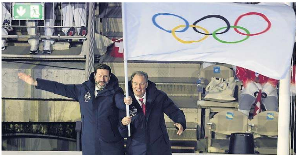
Flaga olimpijska opuściła maszt i została przekazana w ręce przedstawicieli Francji. To właśnie w tym kraju odbędą się XXVI Zimowe Igrzyska Olimpijskie

W igrzyskach Mediolan-Cortina d'Ampezzo startowało łącznie 2871 zawodników z 92 krajów w rekordowej liczbie 116 konkurencji.