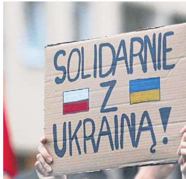
Rok temu pod pomnikiem Mikołaja Kopernika odbyła się demonstracja solidarności z narodem ukraińskim

Pod tą relacją właśnie uaktywnił się D.P. Zaczął zamieszczać wpisy, których treści nawet sąd w wyroku nie mógł przytoczyć w całości - co trzecie słowo jest wykropkowane, bo było wulgaryzmem. Hejter jednak nie tylko sypał epitetami pod adresem Ukraińców, ale też pytał, „gdzie są kibice, żeby rozgonić to ukraińskie...”