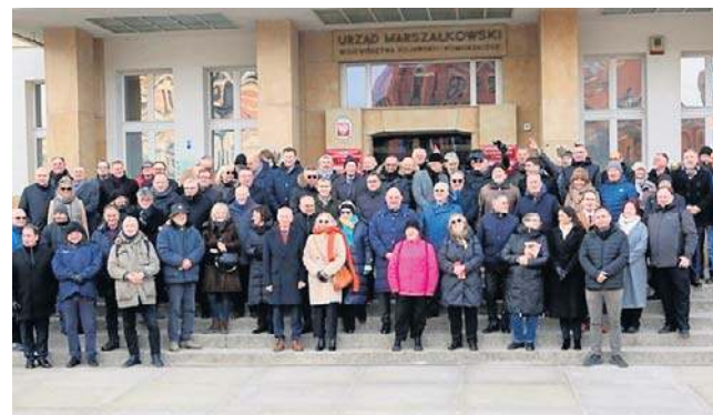
Obchody 45-lecia NZS odbyły się przed gmachem Urzędu Marszałkowskiego i w jego wnętrzu

- Wspominamy wszystkie osoby zaangażowane w podziemną działalność wydawniczą, tysiące anonimowych uczestników walki o autonomię polskiego szkolnictwa wyższego, uczestników strajków studenckich. To między innymi oni odbudowali wolną Polskę - powiedział podczas