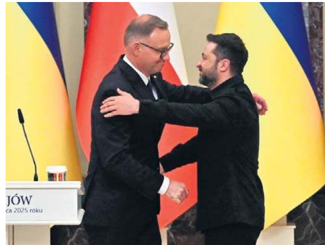
Byli prezydent Polski Andrzej Duda i ukraiński przywódca Wołodymyr Zełenski w czerwcu 2025 roku

Byli premier Mateusz Morawiecki i wicepremier Jarosław Kaczyński, razem z szefami rządów Czech oraz Słowenii byli pierwszymi politykami, którzy