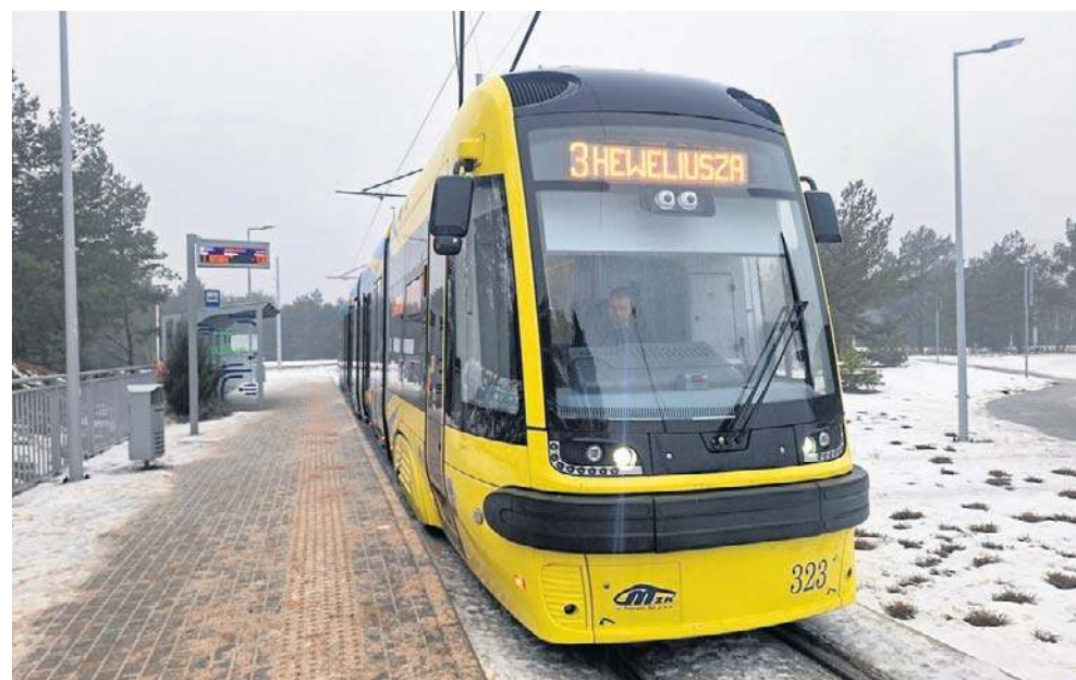
21 lutego tego roku - Swing o numerze bocznym 323 podczas pierwszego dnia regularnych kursów na linii tramwajowej nr 3 w Toruniu

Nowy tramwaj to Swing 122NbT-30. Ma 30 metrów długości, pięcioczołowy, niskopodłogowy. To 24. pojazd typu Swing w taborze MZK Toruń. W porównaniu z tymi starszymi modelami, nowy ma system ograniczający ryzyko kolizji, wydajne i energooszczędne systemy ogrzewania, klimatyzacji, diagnostyczne i informacyjne oraz nowoczesne oświetlenie ze-