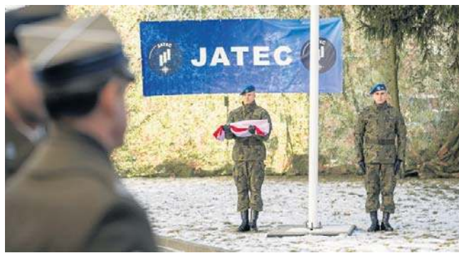
JATEC osiągnęła gotowość operacyjną w lutym 2025

JATEC ma odegrać kluczową rolę w adaptacji i transformacji armii ukraińskiej do standardów NATO, a także w transferze wiedzy i doświadczeń z pola walki na Ukrainie do praktyki Sił Zbrojnych Sojuszu. Warto dodać, że jednostka nie jest klasyczną strukturą wojskową NATO. Około 60 proc. jej personelu stanowią wojskowi, a 40 proc. to cywilni specjaliści, analitycy, naukowcy i eksperci ds. obronności.