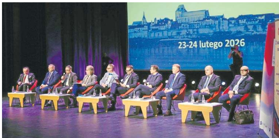
Debata dotyczyła bezpieczeństwa, a wzięli w niej udział m.in. Waldemar Żurek, prokurator generalny, Rafał Trzaskowski, prezydent Warszawy i marszałek Piotr Calfa

- Oczywiście, rząd interesuje się aspektem cyberbezpieczeństwa - odpowiedział Waldemar Żurek, minister sprawiedliwości, prokurator generalny, jeden z gości debaty. - Pamiętajmy o tym, że resort cyfryzacji, NASK, właściwie każdego dnia odbierają setki, a nawet tysiące ataków na urządzenia, które mamy przy sobie i także na naszą infrastrukturę krytyczną. Służby odpierają zagrożenia, jesteśmy bezpieczni. Mamy jednak świadomość także innego rodzaju niebezpieczeństw, które są związane z życiem w internecie, w mediach społeczności-