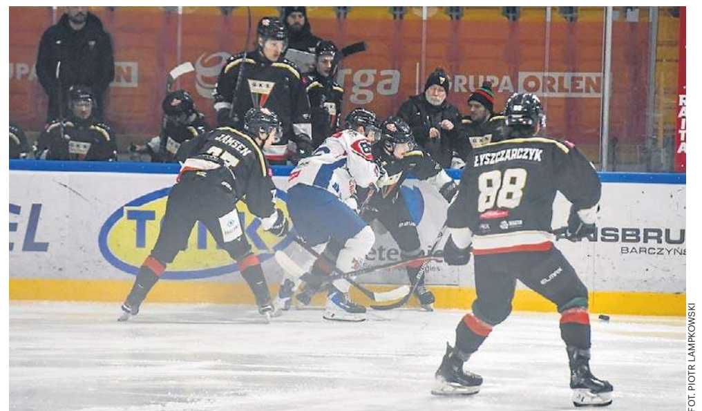
Spotkanie KH Energa - GKS Tychy było bardzo zacięte i emocjonujące

Znamy rywala KH Energa w play off. Wydawało się, że to będzie właśnie GKS, ale Tyszanie zdecydowali się na JKH GKS Jastrzębie, tym samym torunianie wpadają na czwartą po sezonie zasadniczym Unię Oświęcim. Znosi się na ciekawą rywalizację. KH Energa w tym sezonie z pięciu bezpośrednich meczów wygrał cztery, w tym dwa razy na wyjeździe. Pierwsze dwa mecze w weekend na wyjeździe. ©