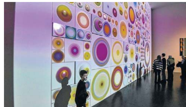
Wernisaż wystawy odbył się w CSW w Toruniu