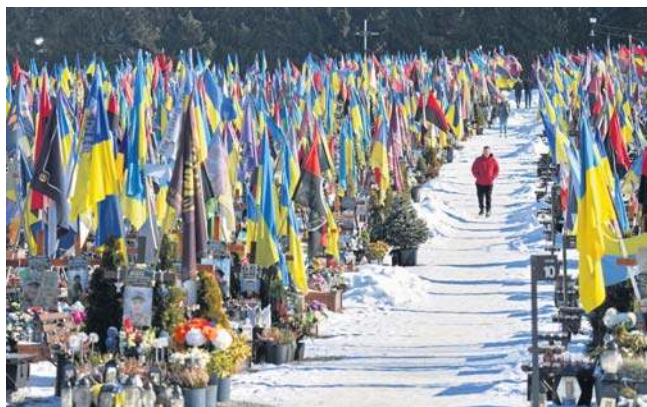
Na cmentarzach Ukrainy kwatery wojskowe są olbrzymie

To nie tylko drenaż mózgow, gdy najlepsi i najzdolniejsi Ukra-