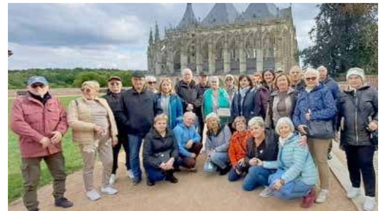
W tle kościół św. Barbary - Kutna Hora w Czechach

Wczesnym rankiem, w piątek, 26 września mieszkańcy Nowogardu, wierni z parafii pw. Wniebowzięcia NMP w Nowogardzie wyruszyli na pielgrzymkę archidiecezjalną na Jasną Górę.