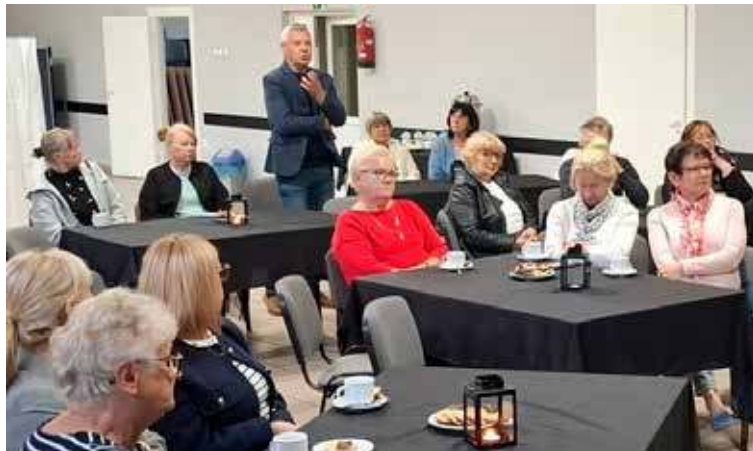
Uczestnicy spotkania zadali autorowi sporo pytań

Po prelekcji przyszedł czas na pytania od uczestników spotkania, dzięki czemu rozwinęła się dyskusja m.in. nad tym, jak przekazywać wiedzę historyczną młodzieży, czy jak patrzeć na obecną sytuację wewnętrzną w