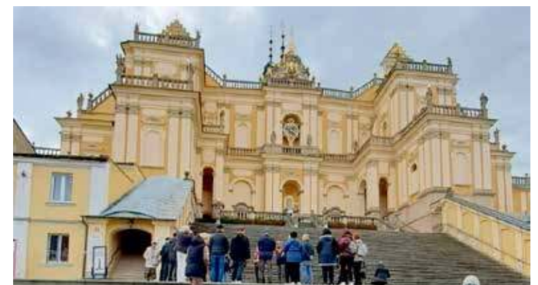
Wambierzyce - Bazylika Nawiedzenia NMP