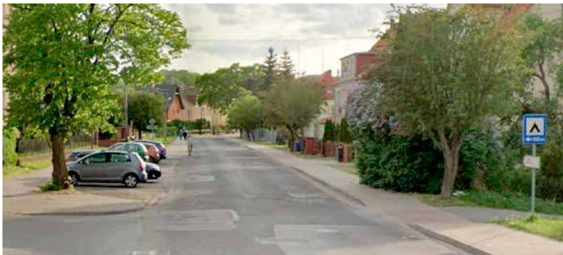
Na ul. Wojska Polskiego wymieniona ma zostać jedynie nawierzchnia jezdni

Jak wynika z dokumentacji umieszczonej na platformie zakupowej Gminy Nowogard zlecenie otrzyma nowogardzka firma PRD, a kwota z przetargu