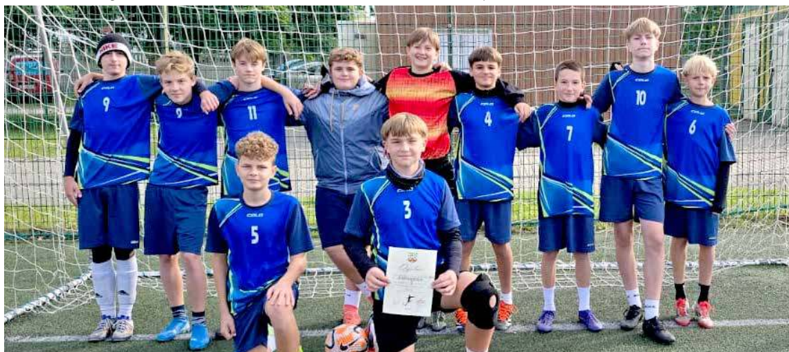
Drużyna w turnieju na Orliku w Nowogardzie zajęła II miejsce i to pozwoliło na awans do finału powiatowego