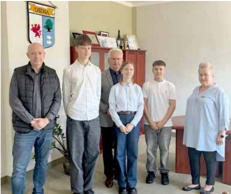
Spotkanie przebiegło w miłej i serdecznej atmosferze. Była to cenna lekcja samorządności