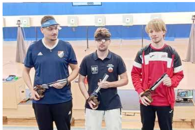
Prezentacja medalistów w konkurencji 10 m pistolet pneumatyczny 60 strzałów