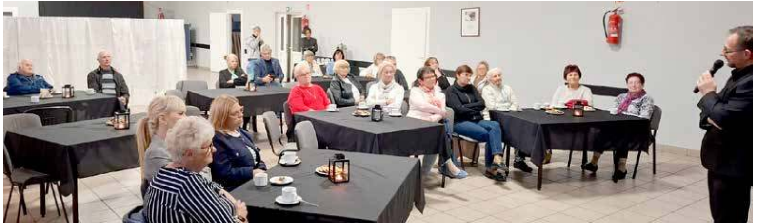
Historia to nie tylko zapis minionych dziejów, ale również lustro, w którym możemy spojrzeć na naszą współczesność - powiedział autor