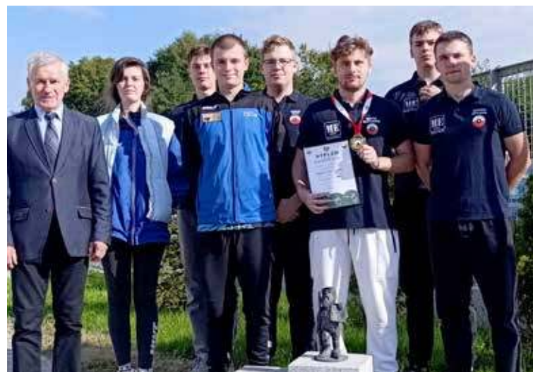
Drużyna LOK Klubu Strzelectwa Sportowego TARCZA Goleniów z trenerem na Młodzieżowych Mistrzostwach Polski i Mistrzostwach Polski Junio