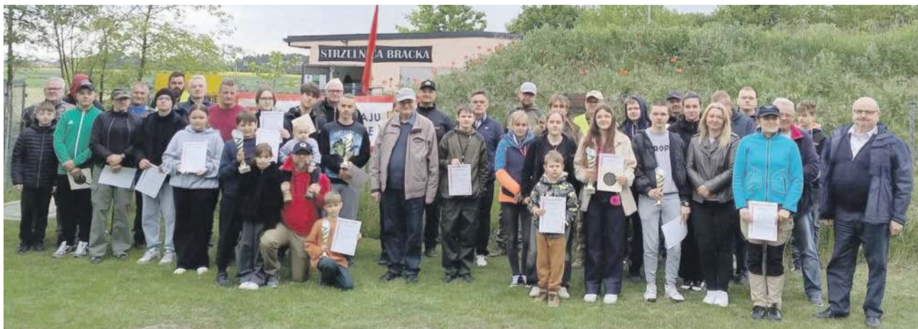
Uczestnicy zawodów wraz z organizatorami