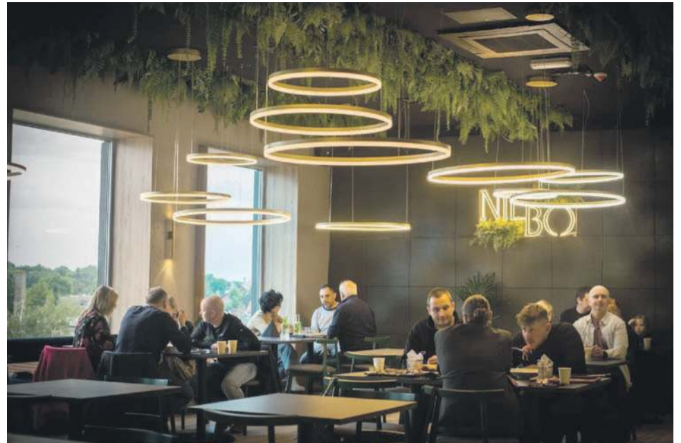
Nowa restauracja „Niebo”