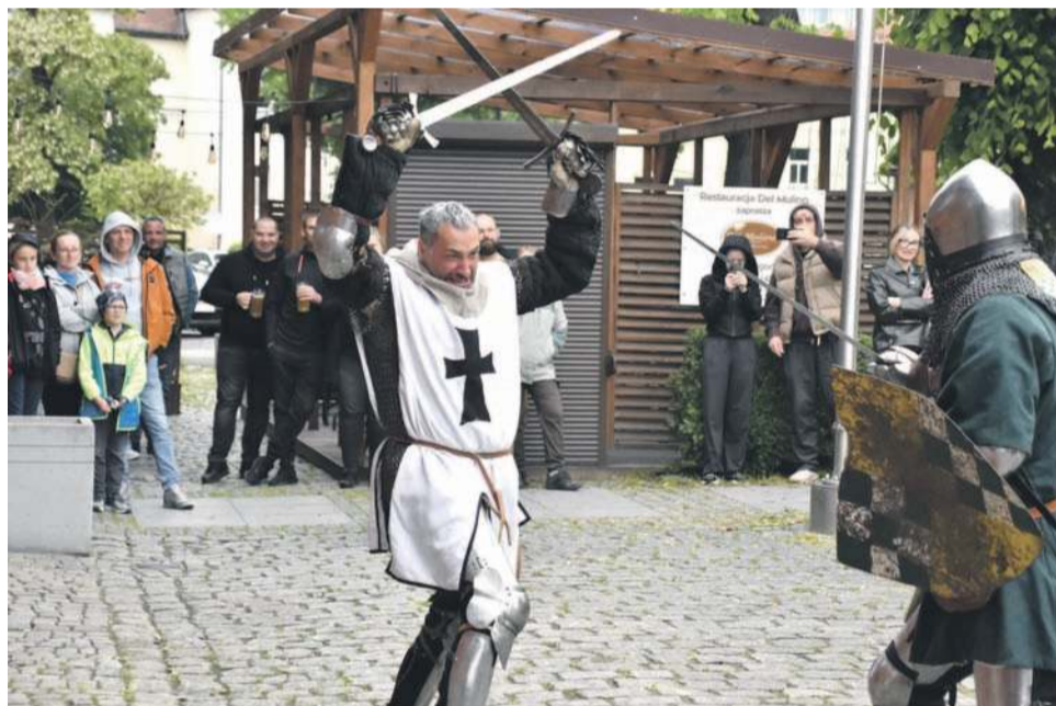
Bractwo Rycerskie Chorągiew Piastów Śląskich dało pokaz walki kilkoma rodzajami broni