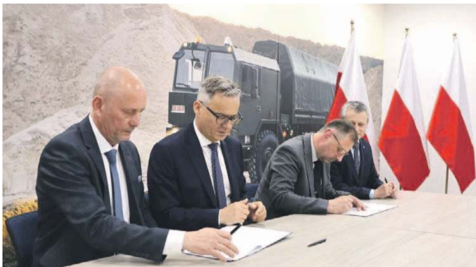
Umowa została podpisana 15 maja