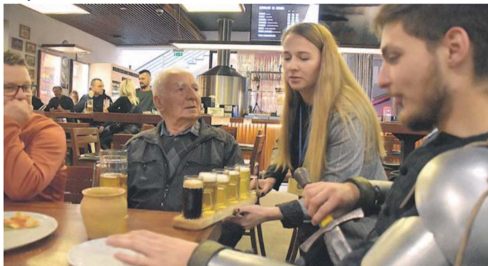
A oto deska lokalnych wyrobów. Wśród nich te klasyczne, które powstają w browarze od początku jego istnienia

latora automatycznego, który w stowarzyszenie otrzymało od WOŚP za udział i zaangażowanie w akcję ratowania Oławy przed powodzią we wrześniu ubiegłego roku.