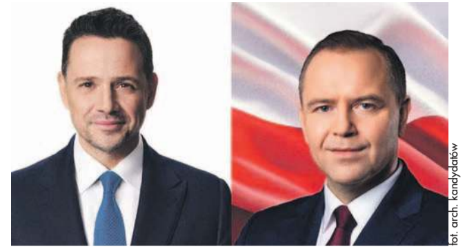
Rafał Trzaskowski i Karol Nawrocki zmierzają się w drugiej turze wyborów prezydenckich