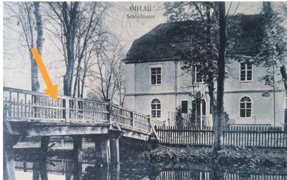
To dawny oryginalny mostek. Według znanych mi informacji 28 czerwca 1924 roku przez Oławę przeszedł potężny orkan, który trwał 15 minut i prawie doszczętnie zniszczył park. Możemy się domyślać, że mostek również uległ zniszczeniu. Miasto jeszcze przez kilka lat porządkowało park i tereny zielone, aby utrzymać stan sprzed wichury