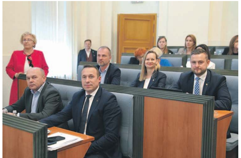
Zarząd Województwa Dolnośląskiego z absolutorium za 2024 rok

Sejmik Województwa Dolnośląskiego udzielił Zarządowi wotum zaufania oraz absolutorium za wykonanie budżetu za 2024 rok. To wyraz uznania dla odpowiedzialnego i przejrzystego zarządzania finansami regionu, którego efektem są rekordowe dochody, zrównoważone wydatki oraz kontynuacja kluczowych inwestycji dla Dolnego Śląska.