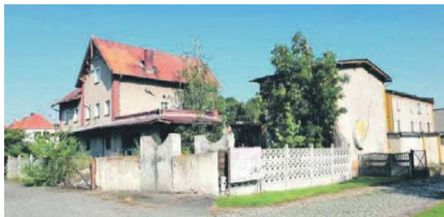
Były wójt w dawnej mleczarni planował mieszkania, powiat przekazał obiekt na budowę PSZOK, obecna wójt nie chce realizować tu żadnego z tych pomysłów

- Zgodnie z treścią zawartego wtedy porozumienia mamy