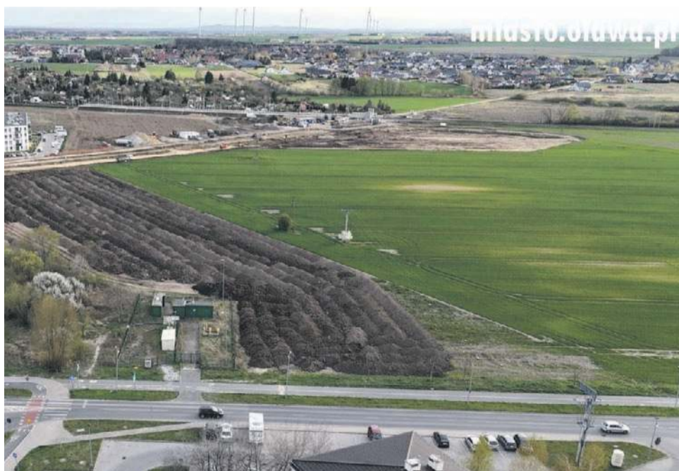
Tu powstaje nowy park

- Moim pomysłem jest, aby wykonać tam kilka alejek, które będą dedykowane naszym spółkom miejskim - poinformował burmistrz. - One jeszcze o tym nie wiedzą. Teraz przekazuję im tę