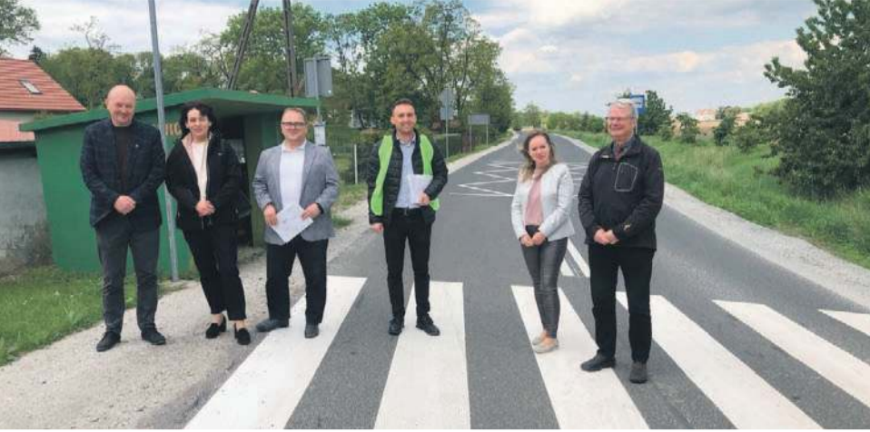
12 maja dokonano odbioru częściowego inwestycji pn. „Kompleksowa modernizacja infrastruktury drogowej na terenie Gminy Domaniów”