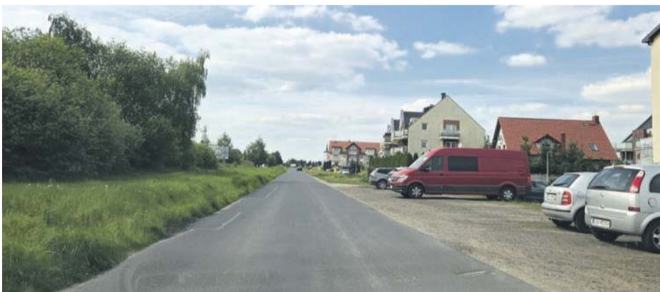
Przy ulicy Południowej konieczny jest chodnik