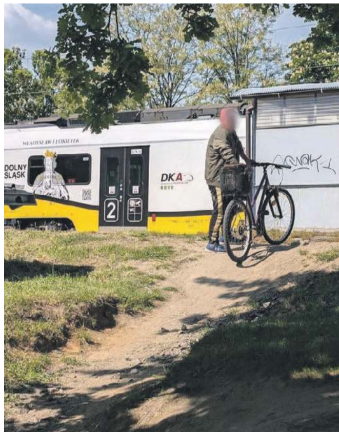
Pan „pod wpływem” z rowerem, który „wylatywał mu z rąk”, uparł się, że przejdzie na peron przez tory, choć obok jest przejście podziemne. Tym razem mu się udało