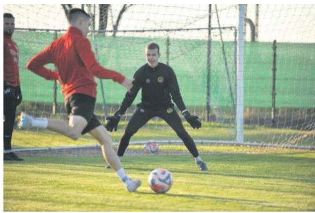
FB LKS Błyskawica Gać, fot. Grzegorz Pawlak

GKS „PROCHOWICZANKA” PROCHOWICE CZARNECKI - BĄCZKOWSKI-GAMON, BARTCZAK, KOTLARSKI, SAVENKO - GALAS (PORĘBA 60), PEDRO RODRIGUES (KUŚNIERZ 49), ZAWICKI -