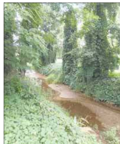
Kozi Bród w Szczakowej

Jak zaznaczyłem na wstępie, koryto rzeki jest tutaj zajęte przez bujną roślinność. Także tutaj na brzegach dominują rdestowce japońskie. W osi koryta są trawy oraz turzycy, a nawet oczerety jeziorne. Wody nie widać. Wystarczy-