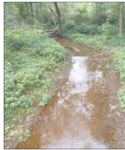
Kozi Bród przy Bukowskiej

Miejsce, gdzie w okolicy Szczakowej rzeka przecina drogę do Bukowna, jest kolejnym łatwo dostępnym punktem. Gdybyśmy jej tutaj nie zastaliśmy, trzeba było by udać się w okolice Sosiny. Jednakże i tutaj rzeka była. Teraz jednak podejrzenie stała. Co świadczyłoby o tym, że gdzieś dalej została przystopowana. Rzeka pły-