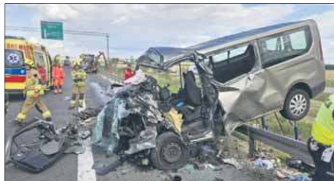
Wypadek na S7

Dramat rozegrał się w poniedziałek, 25 sierpnia. Jak podaje policja pojazd renault, którym mężczyźni jechali do pracy, podczas manewru wyprzedzania uderzyło w ciągnik pracujący na pasie awaryjnym. Następnie rozbił się o bariery energochłonne, a siła uderzenia była tak wielka, że bus został doszczętnie zniszczony. Cztery pasażerowie nie mieli najmniejszych szans na przeżycie.