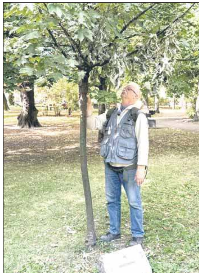
Jawor, symbol miasta Jaworzna, usycha

Przyczyną może być atak grzybów pasożytniczych, które zainfekowały jawor i prowadzą do rozkładu tkanek drzewa. Jednym z objawów jest m.in. opóźniony