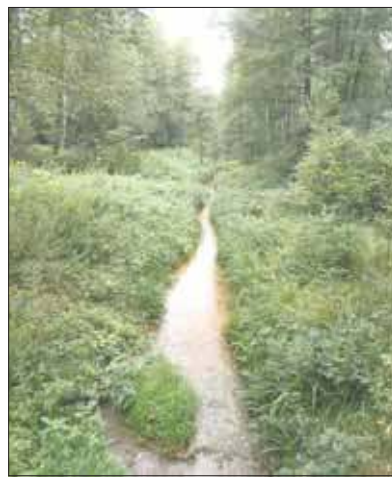
Kozi Bród w Ciężkowicach

Zaczynamy w miejscu, gdzie w drodze do Żabnika trakt przecina Kozi Bród. Gdyby rzeki tam nie było, musielibyśmy udać się w kierunku Sierszy, aby spraw-