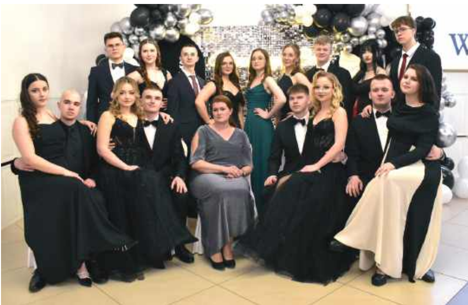
Klasa o profilu biologiczno-chemicznym

Nie ma co się „nagrzewać” Od początku czwartej klasy, od kiedy rozpoczęliśmy organizację, czekałam na ten dzień. Dla nas to wielkie wydarzenie, które będziemy pamiętać do końca życia. Przedemną egzaminy z: polskiego, matematyki oraz rozszerzenia z geografii i angielskiego. Czy jestem gotowy? Podchodzę do tego, by nie „nagrzewać” się na egzaminy zbyt wcześnie. Jest trochę czasu, by dobrze przygotować się do matury