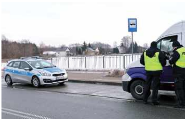
Najpoważniejszym przypadkiem było zatrzymanie prawa jazdy kierowcy busa, który znajdował się pod wpływem alkoholu

Blisko 60 kontroli drogowych, ponad 30 ujawnionych wykroczeń oraz zatrzymane prawo jazdy kierowcy busa będącego pod działaniem alkoholu - to efekt ogólnopolskich działań „Truck & Bus”, które w ub. tygodniu przeprowadzili policjanci ruchu drogowego na terenie powiatu ryckiego.