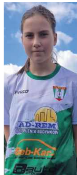
Piłkarka z Ryk otrzymała powołanie na konsultację szkoleniową reprezentacji Lubelskiego Związku Piłki Nożnej w kategorii U-15