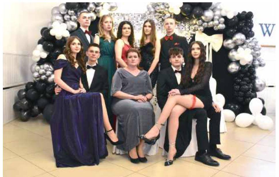
Klasa o profilu matematyczno-informatycznym