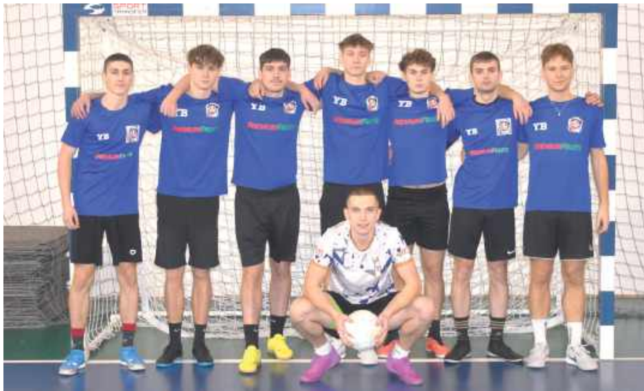
Young Boys powalczą o finał z Deltą Sokół. Czy młodzi piłkarze zameldują się w najważniejszym meczu sezonu?