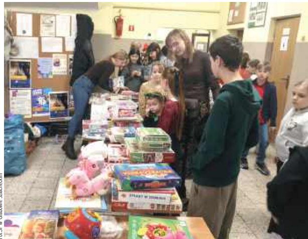
Zabawie towarzyszyły kiermasze i loteria fantowa