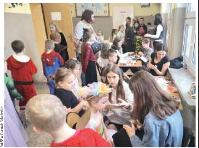
Karnawałowe szaleństwo nie mogło się obyć bez malowanych twarzy