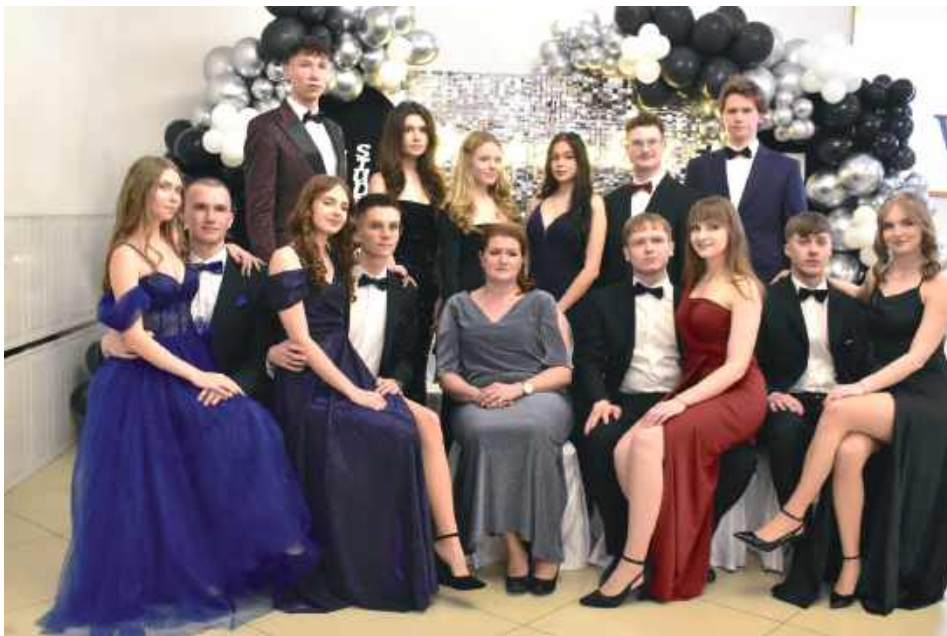
Klasa o profilu matematyczno-geograficznym