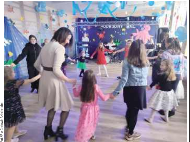
Uczniowie spędzili niezapomniane chwile na szkolnej zabawie