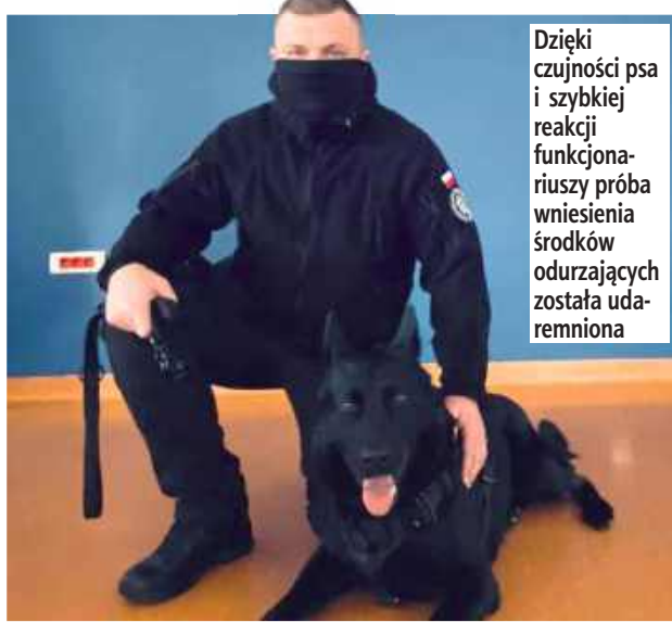
Dzięki czujności psa i szybkiej reakcji funkcjonariuszy próba wniesienia środków odurzających została udaremniowana

Po sygnale od zwierzęcia funkcjonariusze przeprowadzili