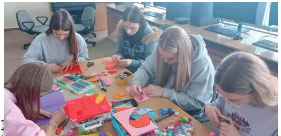
Wolontariusze podkreślili, że taki gest staje się znakiem pamięci, który rozjaśnia trudną codzienność, niesie kilka słów wsparcia i dodaje otuchy oraz uśmiechu

Walentynki w ZSZ nr 1 miały wyjątkowy wymiar, wolontariusze szkoły postanowili okazać serce i wsparcie osobom potrzebującym, pokazując, że dobro i pamięć o innych mają ogromne znaczenie.