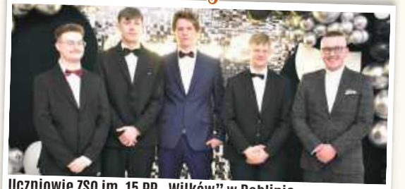
Uczniowie ZSO im. 15 PP „Wilków” w Dęblinie