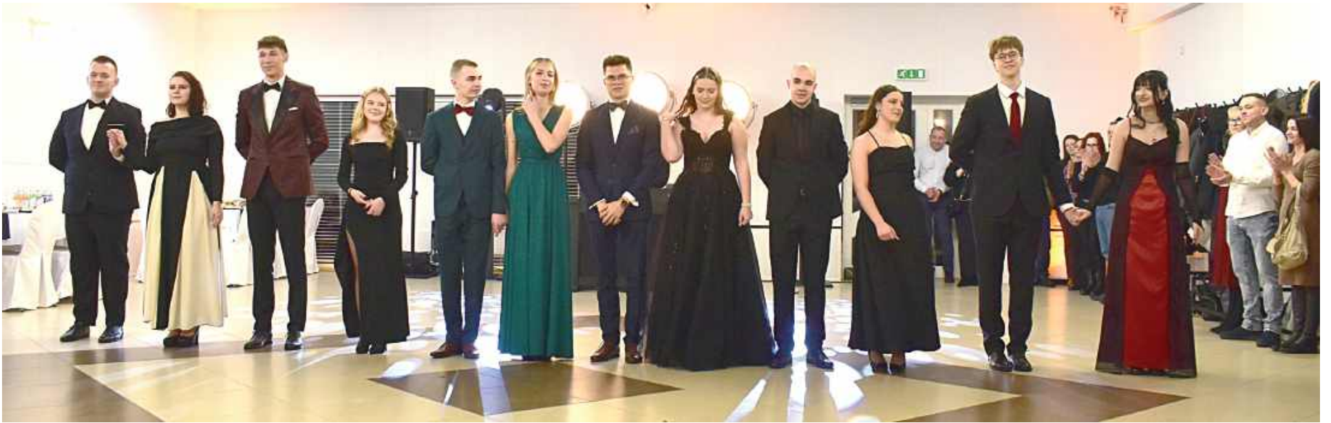
Licealiści zaprezentowali piękny układ choreograficzny podczas walca

Uczniowie Zespołu Szkół Ogólnokształcących im. 15 PP „Wilków” w Dęblinie mają za sobą jedyny, niepowtarzalny moment w swoim życiu.