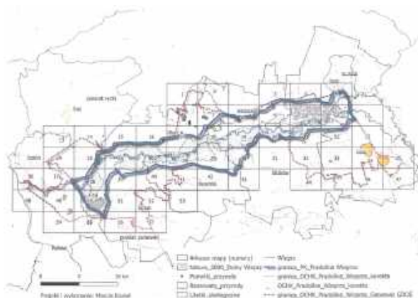
Plany utworzenia Parku Krajobrazowego „Pradolina Wieprza” w województwie lubelskim wywołują spore emocje w lokalnych społecznościach

Zespół Lubelskich Parków Krajobrazowych podkreśla, że głównym celem nowego parku jest ochrona przyrody, rozwój turystyki oraz podniesienie prestiżu regionu. Park Krajobrazowy „Pradolina Wieprza” miałby objąć obszar około 16