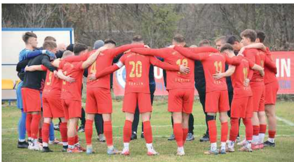
Piłkarze Czarnych Dęblin w meczu kontrolnym rozegranym przeciwko Zrywowi Sobolew zdobyli aż 11 goli

Mimo tych okoliczności podopieczni trenera Daniela Cienkowskiego nie mieli problemów z narzuceniem własnych warunków gry. Od pierwszych minut dominowali na boisku, imponując skutecznością i swobodą w konstruowaniu akcji ofensywnych. - Założenia, jakie sobie postawiliśmy, częściowo spełniliśmy. Fajnie wyglądaliśmy w konstruowaniu akcji ofensywnych i w pressingu w momentach, kiedy miał być zakładany na rywala. Zawsze powtarzam, że wynik nie jest najważniejszy. Zawodnicy zaliczyli dobrą jednostkę treningową - podkreśla