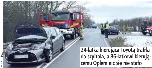
24-latka kierująca Toyotą trafiła do szpitala, a 86-latkowi kierującemu Oplem nic się nie stało

Nieustąpienie pierwszeństwa przejazdu było przyczyną kolizji, do jakiej doszło dziś rano na drodze wojewódzkiej 801 między Puławami a Dęblinem. Do szpitala trafiła młoda kobieta.