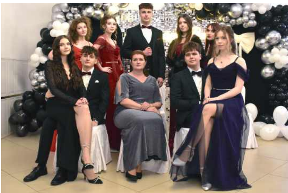
Klasa o profilu humanistycznym