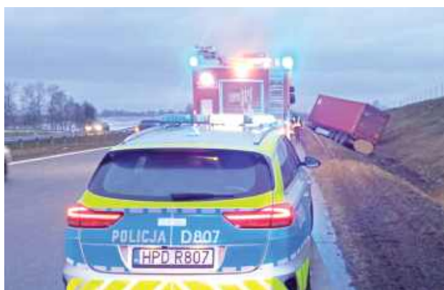
Ciągnik siodłowy z naczepą wjechał do rowu w pobliżu ul. Janiszewskiej w Rykach. Na czas wyciągania auta ruch na drodze był wstrzymany

- Strażacy zabezpieczyli miejsce zdarzenia i obserwowali kierowcę do czasu przybycia ZRM.