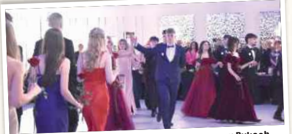
Studniówka 2026 Liceum Ogólnokształcącego w Rykach