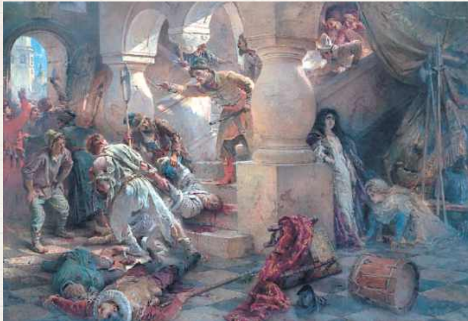
Śmierć Łędymitra. Obraz Konstantina Makovskyego

bystrzejszy z nich, Jerzy Mniszech zdiagnozował sytuację, było już za późno. Opozycja nie próżnowała. Na jej czele stał Wasyl Szujski, jeden z najsprawniejszych polityków kraju. Początkowo wspierał Samozwańca, potem popadł z nim w konflikt i został skazany na karę śmierci. Wyrok zamieniono na wygnanie, a nawet po chwili i to odwołano. Szujski wrócił do Moskwy i natychmiast stworzył, umiejętnie grając na kilku - politycznej, społecznej, religijnej - bałajkach spisek. 27 maja nad ranem bunt eksplodował. Dobrze przygotowane grupy wdarły się do carskich komnat. Na temat okoliczności zabójstwa Dymitra mamy kilka relacji, nie ulega wątpliwości, że od początku jego los był przesadzony. Marynie udaje się wymknąć: niewysoka, bez szat, biżuterii, makijażu, wyzbyta carskiego majestatu, wymknęła się nierozpoznana między damami dworu, ponoć ukrywając się pod suknią najtejszej z nich. Potem zaboboni-