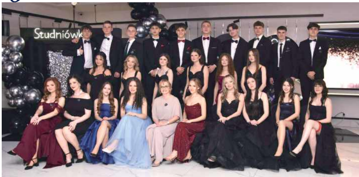
Studniówka 2026 Liceum Ogólnokształcącego w Rykach

W Morenowym Dworze w Przykowie w sobotni wieczór odbyła się studniówka uczniów Liceum Ogólnokształcącego w Rykach – jedno z kluczowych wydarzeń w kalendarzu tegorocznych maturzystów.