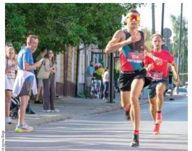
Łęczna Biega od lat podejmuje działania aktywizujące lokalną społeczność. Pierwsza Kasztelańska Piątka odbyła się w 2019 roku. Od tamtej pory tysiące osób, zarówno dorosłych, jak i dzieci, wzięło udział w przedsięwzięciach firmowanych przez drużynę z Łęcznej

Zaplanowano, że w biegu weźmie udział 200 uczestników. Na pokonanie dystansu mają oni 45 minut. Aby wziąć udział w biegu, należy zarejestrować się na portalu e-gepard.eu. Dzięki grantowi udział w biegu również będzie nieodpłatny. Wszystkie informacje nt. projektu publikowane są na profilu fb Łęczna