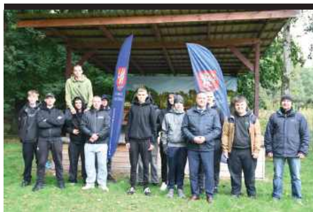
Humory dopisywały. Zarówno uczestnicy, jak i organizatorzy byli zadowoleni z przebiegu turnieju