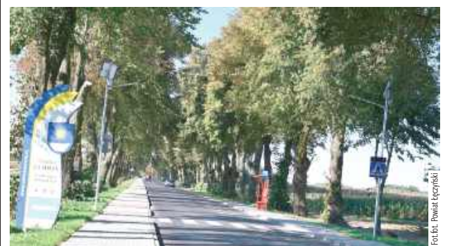
Prace objęły m.in. wykonanie nowej nawierzchni, także na moście na rzece Wieprz w Kijanach

Dobiegły końca prace przy przebudowie i rozbudowie drogi powiatowej na odcinku między Kijanami a Zezulinem. Modernizacja objęła prawie 5,5 km trasy, a całkowita wartość inwestycji przekroczyła 12,5 mln zł.