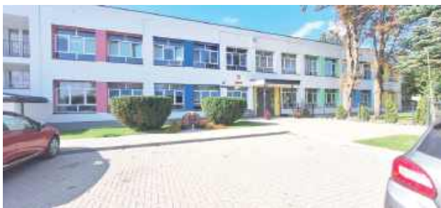
Od kolejnego roku szkolnego uczniowie kl. 4-8 mieliby uczyć się w Zespole Szkolno-Przedszkolnym w Wąwolnicy, zamiast tu w Karmanowicach

- Poza tym o wysokim poziomie szkoły świadczą świetne wyniki egzaminu ósmoklasisty. Nauczyciele są przyjaźnie nastawieni i do uczniów i do rodziców. Żal mi tego wszystkiego, tych nauczycieli i budynku - dodaje.