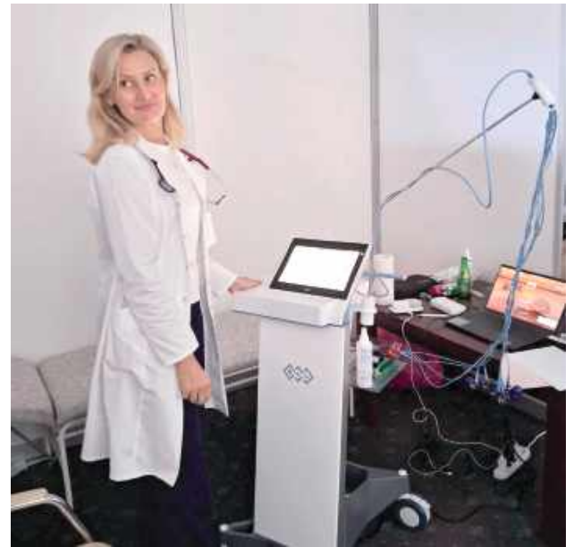
W kardiologii kluczowym czynnikiem jest czas. Im szybciej wykryjemy u pacjenta problem kardiologiczny, tym lepiej jesteś w stanie go leczyć

Jego głównym celem jest podkreślenie, że choroby serca są jedną z głównych przyczyn zgonów, a aż 80 proc. z nich można zapobiec. Inicjatorami akcji były wicemarszałek Sejmu RP Dorota Niedziela oraz senator Agnieszka Gorgoń-Komor, przewodnicząca zespołu parlamentarnego ds. kardiologii. Wydarzenie zostało objęte patronatem Polskiego Towarzystwa Kardiologicznego.