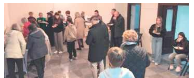
Dni Kultury Żydowskiej

nie odbyła się część plastyczna, w której uczestnicy tworzyli prace artystyczne inspirowane nowo zdobytą wiedzą.