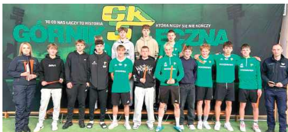
Podczas wydarzenia młodzież otrzymała elementy odblaskowe i wzięła udział w rozmowach z funkcjonariuszami na temat bezpiecznego poruszania się po drogach

Podczas wydarzenia młodzież otrzymała elementy odblaskowe i wzięła udział w rozmowach z funkcjonariuszami na temat bezpiecznego poruszania się po drogach. Policjanci przypomi-