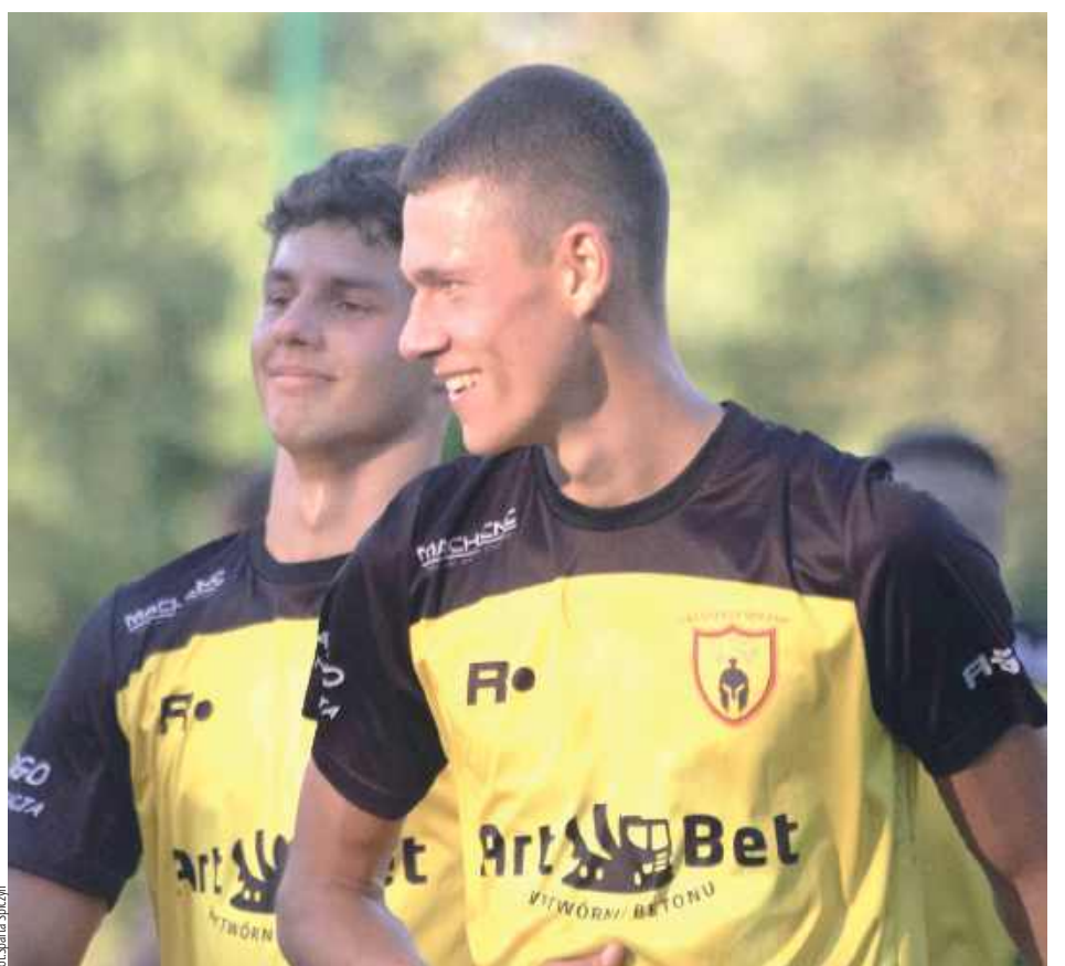
Uśmiechy nie powinny schodzić zawodnikom Sparty z twarzy. Po sześciu kolejkach mają aż 15 punktów!