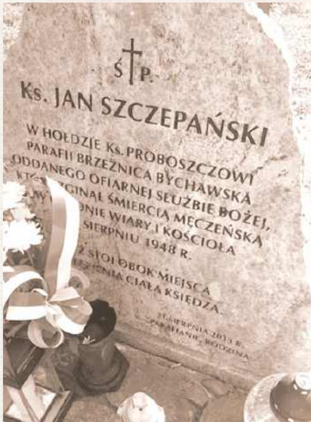
Na miejscu odnalezienia ciała księdza postawiono pamiątkowy krzyż i kamień

O miejscu pochówku zadecydowała matka kapłana. Najpierw