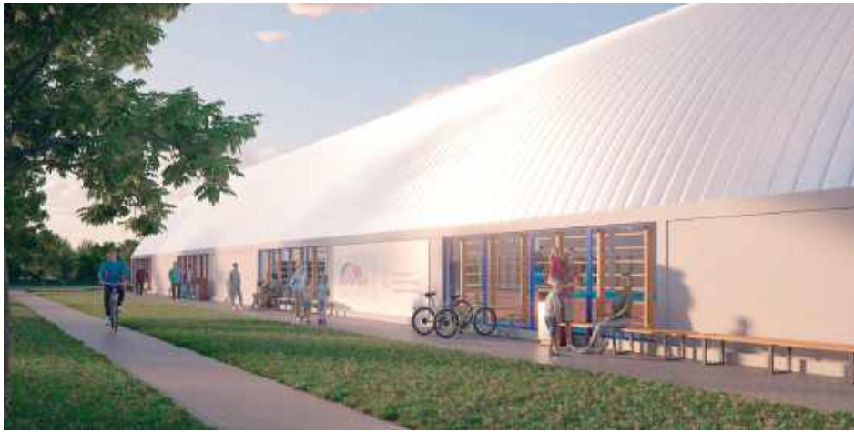
Prace projektowe i wykonawcze mają ruszyć wkrótce, a po ich zakończeniu uczniowie i mieszkańcy Łęcznej zyskają nowoczesny obiekt do sportu i rekreacji

Łęczna zyska nowoczesne boisko wielofunkcyjne z zadaniem - inwestycja warta 7,289 mln zł, w której znaczący udział ma państwowe dofinansowanie w ramach Programu Olimpia. Zakres robót obejmuje halę, zaplecze, trybuny, instalacje oraz zagospodarowanie terenu.