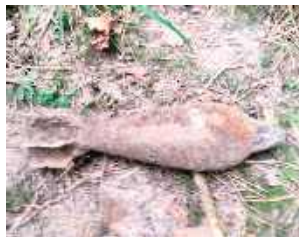
Okazało się, że znaleziskiem jest mocno skorodowany pocisk moździerzowy pochodzący z czasów II wojny światowej

POWIAT OPOLSKI: Dość nietypowo zakończyła się niedzielną (28 września) wyprawa na grzyby w miejscowości Dębniak (gm. Józefów nad Wisłą). Jeden z mieszkańców, zamiast koszyka pełnego grzybów, znalazł w lesie... pocisk moździerzowy z czasów II wojny światowej.