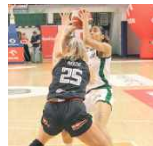
Koszykarki odniosły zwycięstwo

Inauguracja nowego sezonu Orlen Basket Ligi Kobiet w wykonaniu AZS UMCS Lublin trzymała w napięciu praktycznie do końcowej syreny. Kibice zgromadzeni na spotkaniu z Zagłębiem Sosnowiec nie mogli narzekać na nudę.