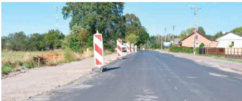
Roboty prowadzone są zgodnie z harmonogramem. Modernizacja drogi ma nie tylko poprawić komfort jazdy, lecz także zwiększyć bezpieczeństwo pieszych i rowerzystów, a jednocześnie wzmocnić potencjał turystyczny gminy Ludwin i całego powiatu

W Piasecznie rozpoczęły się prace przy modernizacji drogi powiatowej. Inwestycja, której wartość przekracza 6,7 mln zł, ma zakończyć się w marcu 2026 roku. Dzięki niej poprawi się bezpieczeństwo i dostępność komunikacyjna terenów wokół jeziora.