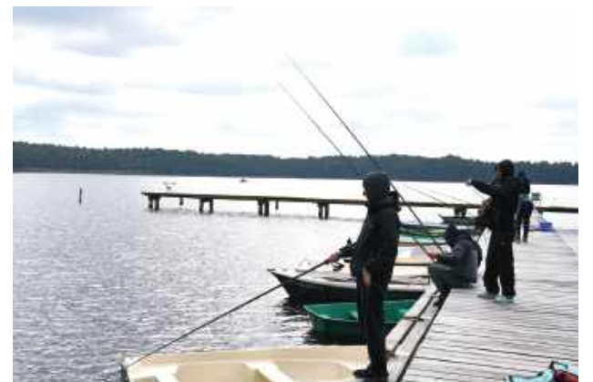
Mimo niesprzyjającej pogody udało się osiągnąć dobre wyniki!