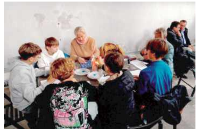
Dni Kultury Żydowskiej

Spotkanie rozpoczęło się prezentacją multimedialną, podczas której uczestnicy zapoznali się z symboliką i znaczeniami w kulturze żydowskiej. Nastę-