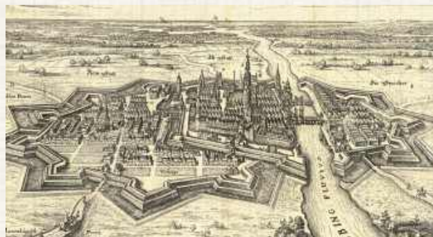
Elbląg na XVII-wiecznej grafice. W czasach Stefana Batorego miasto i port mogły realnie myśleć o nawiązaniu rywalizacji z Gdańskiem, jednak realizowany przez Piotra z Kłoczewa plan skrócenia bezpośredniego szlaku morskiego na Bałtyk został zarzucony

Przy tej okazji rozsypał się jeszcze inny pomysł i plan, z którym nosił się pan Piotr. Otóż zamierzał on zająć się dokonaniem szczegółowych pomiarów zarówno samego Zale-