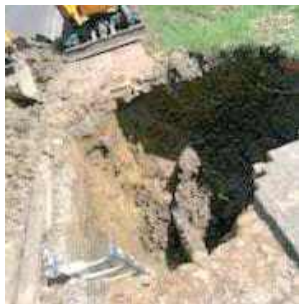
W tym wykopie na konserwatora zawaliła się ziemia

- Na miejscu był tylko operator koparki, który odsonił rurę w miejscu awarii. Kiedy już byłem na dole i naprawiłem wodociąg, nagle ziemia osunęła się na 2 m w głąb dołu. Na mnie runął prawie metrowej wielkości nasyz z ziemią. Akurat przykucałem. Na moment straciłem przytomność. Dobrze, że szybko się ocknąłem i siedząc w ku-