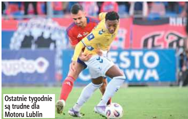
Ostatnie tygodnie są trudne dla Motoru Lublin