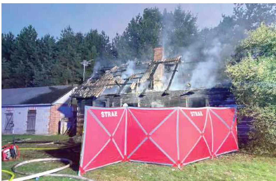
Po zakończonej akcji ratowniczo-gaśniczej, w budynku strażacy odnaleźli ciało starszuszka

W środę (1 października) dyżurny parczewskiej jednostki otrzymał zgłoszenie z Wojewódzkiego Centrum Powiadamiania Ratunkowego o pożarze domu parterowego na terenie gminy Siemień w miejscowości Sewerynówka. Z rozmowy ze zgłaszającym wynikało, że wewnątrz objętego pożarem domu znajduje się jedna osoba.