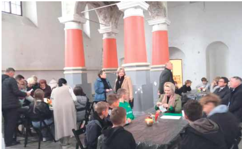
Dni Kultury Żydowskiej

30 września w Dużej Synagodze w Łęcznej odbyły się warsztaty „Chleby obecności”, zorganizowane w ramach Europejskich Dni Kultury Żydowskiej.