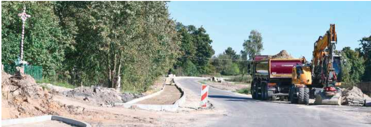
Prace są na finiszu, a w najbliższym czasie odnowiona droga zostanie oficjalnie oddana do użytku