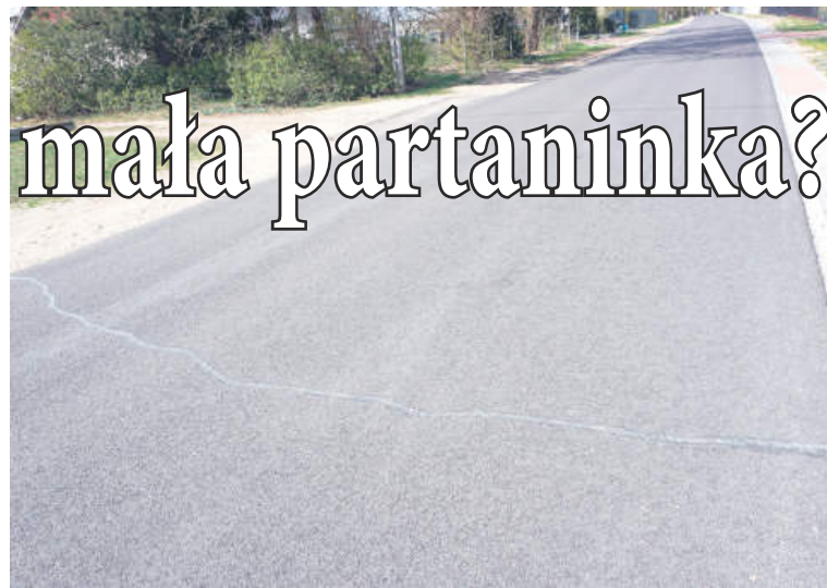
Takie pęknięcia pojawiły się na nowej nawierzchni drogi w Jasiorówce.

- Ja tą drogą często jeżdżę i tych dziur i szpar jakoś nie widzę. Ale może