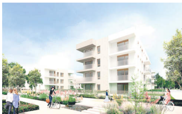
Wizualizacja: Społeczna Inicjatywa SIM