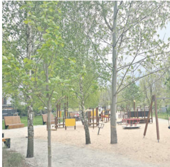
Park kieszonkowy przy ul. Traugutta i przy ul. Młynarskiej. Jest różnica?

Część internautów broni parku przy ul. Młynarskiej i zwraca uwagę, że nie każda przestrzeń zielona powinna wyglądać jak klasyczny, regularnie przystrzyżony trawnik. „Nie wszystko musi być wykoszone od linijki” – komentuje jedna z osób. Inni również podkreślają, że naturalna roślinność i łąki kwietne są potrzebne w miastach i sprzyjają bioróżnorodności.