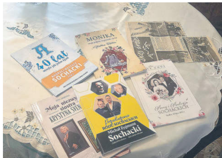
Każdemu ze swoich dzieci napisała i dedykowała książkę.

- Nawet nie brałam pod uwagę, że mogę się nudzić! Miałam mnóstwo pomysłów. Mam 3 dzieci - z ich małżonkami to 6 - i 7 wnucząt. Od razu weszłam w wir „zbiorowego żywienia”. Zawsze lubiłam gotować i piec ciasta, a na emeryturze robię to z wielką różnorodnością. Lubię też dopieszczać kulinarnie przyjaciół. Poza tym mam swój prywatny IPN!