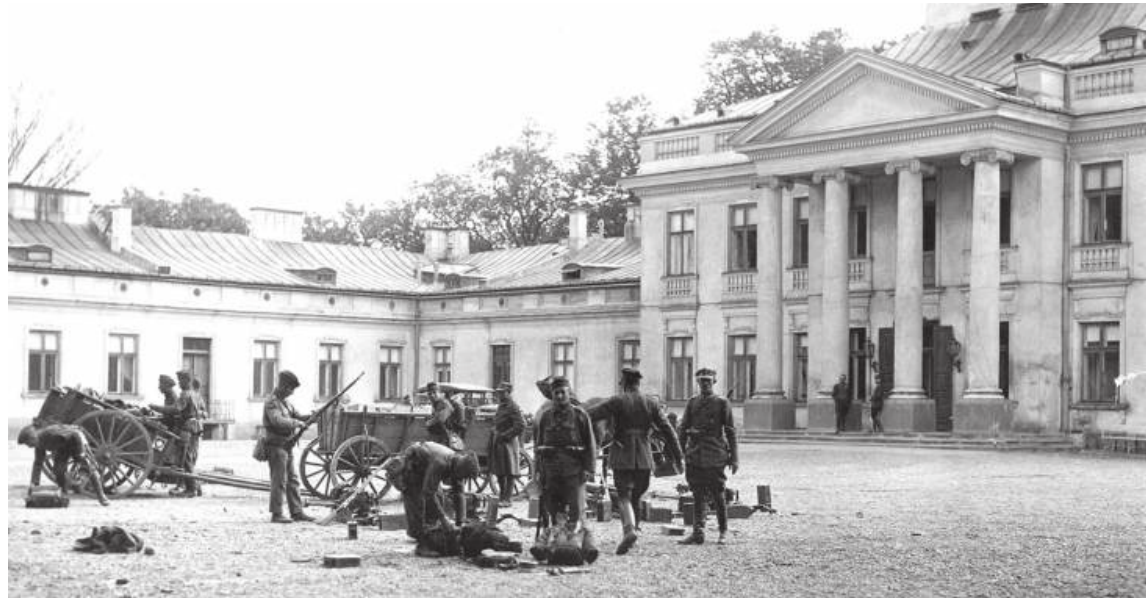
Grupa żołnierzy marszałka Józefa Piłsudskiego na placu przed Belwederem, maj 1926

Do Warszawy wyruszyły dwa bataliony pułku – batalion I oraz III, w sumie pociągiem jechało 24 oficerów i 503 szeregowych. Rozkazy nakazujące powrót do koszar zignorowano. Pociąg dojechał na miejsce wczesnym popołudniem. Jednak nie do stacji Warszawa Wileńska, jak początkowo planowano, lecz do Rembertowa. Siedlczanie wyładowali się wraz z końmi, kuch-