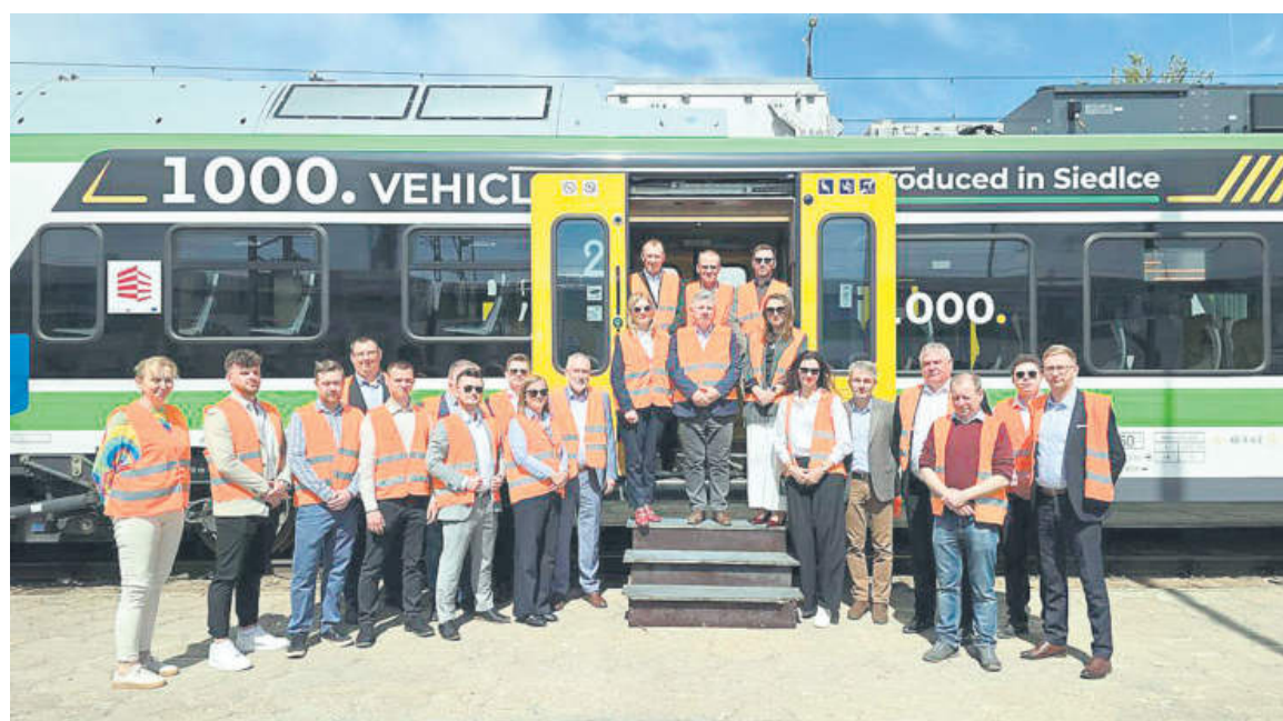
fol. Koleje Mazowieckie