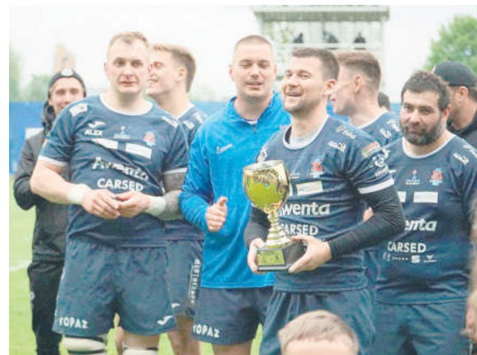
Puchar Janusza „Kiera” Jaroszewicza w rękach rugbyistów Pogoni