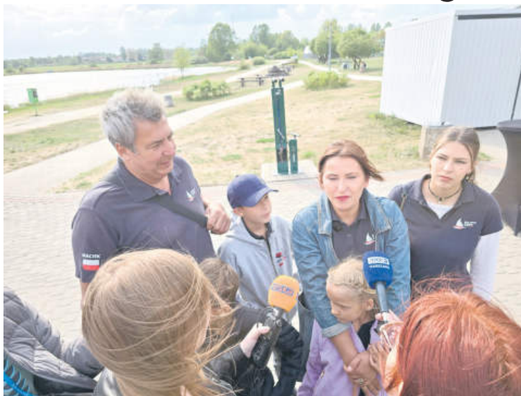
Rodzina wskazuje na inicjatora żeglarskiej przygody.