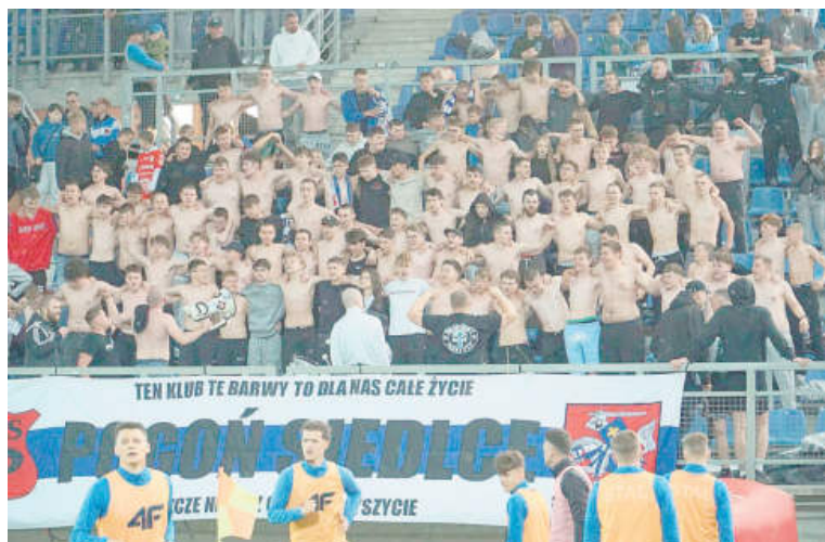
W meczu ze Stalą nie zawiedli kibice Pogoni, dopingujący swoją drużynę przez pełne 90 minut.