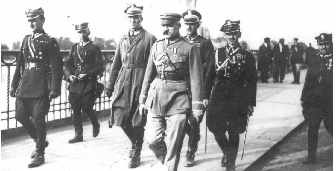
Józef Piłsudski podczas zamachu majowego na moście Poniatowskiego

Zaciekle walki toczyły się o gmach Ministerstwa Spraw Wojskowych, znajdujący się w pobliżu Placu Zbawiciela. Na ul. Koszykowej zginął ppłk Frank-Wiszniewski. Dowódcą III batalionu został płk Kmicic-Skrzyński. Poległ również kpt Nadrowski , zastrzelony na Placu Zbawiciela pojedynczym strzałem oddanym z okna gmachu ministerstwa.