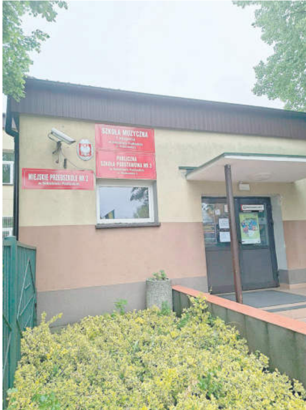
To ostatnie dni SP nr 3