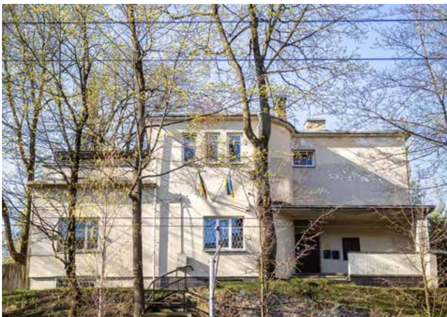
Willa przy ulicy Portowej 22 została zbudowana w 1938 r. według projektu Jana Borowskiego i Izaaka Smorgońskiego

Powojenny okres charakteryzował się nie tylko zmianami językowymi, lecz także napięciami ideologicznymi, wynikającymi z umacniania się systemu sowieckiego na Litwie. Nie ominęły one również rodziny Venclovów. Harmonię rodzinną zaczęły zakłócać różnice poglądów między ojcem a synem.