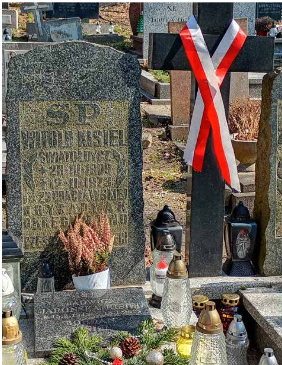
Decyzją prezesa IPN dr. Karola Nawrockiego 17 września 2024 r. nagrobek został wpisany do ewidencji grobów weteranów za wolność i niepodległość Polski

AK w proces walki o niepodległość ojczyzny. Tego typu działalność określana była jako „podważanie wysiłku zbrojnego Armii Czerwonej i partyzanckiego ruchu lewicowego”. Działania ewidencyjno-obsługowe były prowadzone do 1968 r.