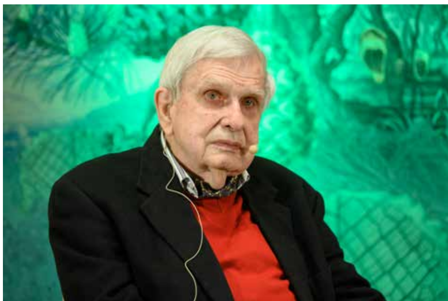
Tomas Venclova (ur. 1937 r.) – poeta, współzałożyciel Litewskiej Grupy Helsińskiej, profesor literatur słowiańskich na Uniwersytecie Yale. Jest blisko związany z polską kulturą i literaturą, tłumaczył polską poezję na litewski