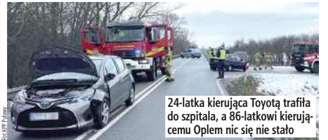
24-latka kierująca Toyotą trafiła do szpitala, a 86-latkowi kierującemu Oplem nic się nie stało

Nieustąpienie pierwszeństwa przejazdu było przyczyną kolizji, do jakiej doszło dziś rano na drodze wojewódzkiej 801 między Puławami a Dęblinem. Do szpitala trafiła młoda kobieta.