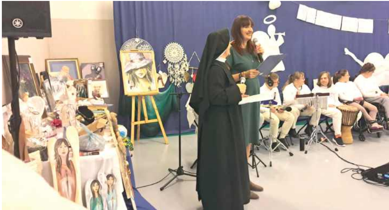
Wydarzenie było okazją nie tylko do wzięcia udziału w licytacjach, ale również do podziwiania talentów podopiecznych placówki prowadzonej przez siostry Benedyktyнки

Ponad 25 tys. zł udało się zebrać podczas charytatywnego koncertu „Aniołowie Dzieciom”, zorganizowanego przez Fundację Benedyktyński Zakątek, działającą przy Specjalnym Ośrodku Szkolno - Wychowawczym im. S. Klary Staszak w Puławach, w sobotę 7 lutego. Środki te pozwolą na zakup wyposażenia sali doświadczania świata oraz sensorycznych instrumentów muzycznych, z których skorzystają podopieczni placówki.