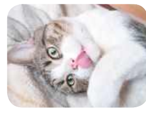
Brajanek, Krystyna Korszeń, Biała Podlaska