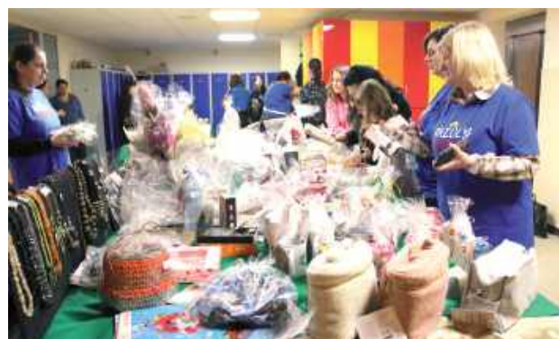
Na kiermaszu można było wylicytować i zakupić wiele ciekawych przedmiotów. Wiele z nich to dzieła podopiecznych ośrodka lub ich bliskich

- Na stołach znajdziemy właściwie wszystko. Smačky, ciasta przygotowywali rodzice, nasze dzieci, nauczyciele, czyli jak to się mówi do wyboru do koloru. Przygotowania trwały od około miesiąca, zbieraliśmy też cały czas fanty, praktycznie cały czas nam ktoś coś przynosił. Na loterii i kiermaszu jest ceramika, obrazy malowane przez dzieci, anioły z gipsu, poduszki,