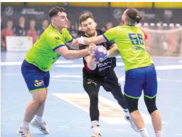
Puławianie przegrali w Piotrkowie Trybunalskim. W tym momencie sytuacja w tabeli naszych jest bardzo kiepska

Piłkarze ręczni Piotrkowianina Piotrków Trybunalski wygrali bardzo ważne spotkanie dla układu w dolnej części tabeli. We własnej hali pokonali LOTTO-Puławy 34:31 (18:17) i powiększyli przewagę nad strefą spadkową. Piotrkowscy szczypiornicy mają pięć punktów przewagi nad zespołem z Puław i sześć nad Zagłębiem Lubin.