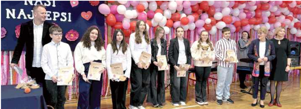
W ubiegłym tygodniu zorganizowano trzy kolejne wydarzenia podsumowujące pierwszy semestr w szkołach na terenie Puław. Na zdjęciu gala w SP nr 1 im. Tadeusza Kościuszki