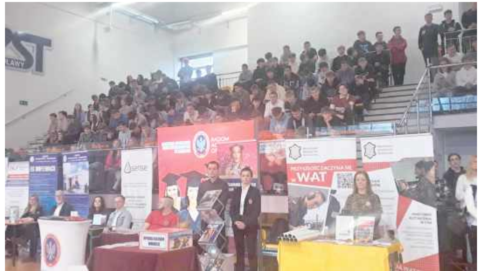
Podczas Dnia Kariery Zawodowej swoją ofertę przedstawiły m.in. szkoły i wojsko

Oferty pracy, oferty szkół wyższych, zasady prowadzenia działalności gospodarczej. To wszystko można było znaleźć na Dniach Kariery, które odbywały się w piątek 13 lutego w Zespole Szkół Technicznych im. Marii Skłodowskiej-Curie w Puławach przy ul. Wojska Polskiego.