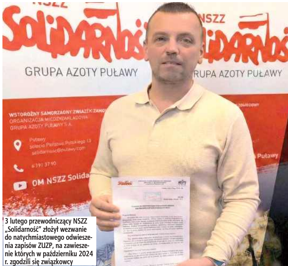
3 lutego przewodniczący NSZZ „Solidarność” złożył wezwanie do natychmiastowego odwieszenia zapisów ZUZP, na zawieszenie których w październiku 2024 r. zgodzili się związkowcy

W związku z trudną sytuacją finansową, czerwcem 2024 r. ówczesne nowe władze Grupy Azoty Puławy podjęły się wdrożenia programu naprawczego. Oprócz ograniczenia zbędnych wydatków jednym z elementów planu miało być czasowe zawieszenie niektórych kosztownych zapisów Zakładowego Układu Zbiorowego Pracy. Podjęto rozmowy z przedstawicielami działającymi w Puławach związkowców zawodowych, jednak w przeciwieństwie do innych spółek, tu nie przyniosły one konsensusu. Związkowcy nie dali zgody na zawieszenie nagród motywacyjno-kwartalnych, rocznych czy innych dodatków. Nie zgodzili się także na zmniejszenie Funduszu Socjalnego do poziomu