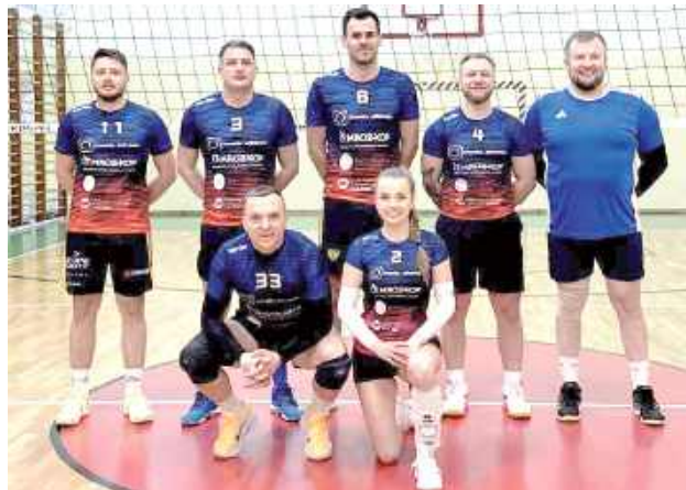
Na zdjęciu lider rozgrywek Volley Piątek