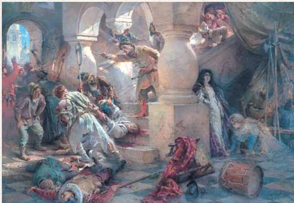
Śmierć Łędymitra. Obraz Konstantina Makovskiego

bystrzejszy z nich, Jerzy Mniszech zdiagnozował sytuację, było już za późno. Opozycja nie próżnowała. Na jej czele stał Wasyl Szujski, jeden z najsprawniejszych polityków kraju. Początkowo wspierał Samozwańca, potem popadł z nim w konflikt i został skazany na karę śmierci. Wyrok zamieniono na wygnanie, a nawet po chwili i to odwołano. Szujski wrócił do Moskwy i natychmiast stworzył, umiejętnie grając na kilku - politycznej, społecznej, religijnej - bałajkach spisek. 27 maja nad ranem bunt eksplodował. Dobrze przygotowane grupy wdarły się do carskich komnat. Na temat okoliczności zabójstwa Dymitra mamy kilka relacji, nie ulega wątpliwości, że od początku jego los był przesadzony. Marynie udaje się wymknąć: niewysoka, bez szat, biżuterii, makijażu, wyzbyta carskiego majestatu, wymknęła się nierozpoznana między damami dworu, ponoć ukrywając się pod suknią najtejszej z nich. Potem zaboboni