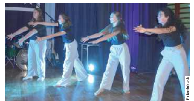
Gala „Nasi Najlepsi” to także okazja, by zaprezentować przeróżne talenty uczniów. Krótki występ artystyczny zaprezentowały m.in. uczennice SP nr 4 im. M. Kopernika

To oni byli najlepsi w pierwszym semestrze. W Szkole Podstawowej nr 1 im. Tadeusza Kościuszki, nr 4 im. Mikołaja Kopernika oraz nr 6 im. Polskich Lotników w Puławach zorganizowano kolejne gale „Nasi Najlepsi”. Uroczystość była okazją do wyróżnienia uczniów z najlepszymi wynikami w nauce w pierwszym semestrze.