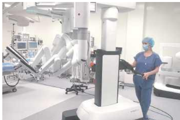
Robot chirurgiczny da Vinci 5 najnowszej generacji w Wojewódzkim Szpitalu Specjalistycznym im. Stefana Kardynała Wyszyńskiego w Lublinie

- Niektórzy piszą, że ten szpital jest najbardziej zadłużony. To prawda. Tylko że restrukturyzacja, którą prowadzi pan dyrektor, doprowadziła w 2025 roku do tego, że gdyby nie odsetki z poprzednich lat zaciągniętych