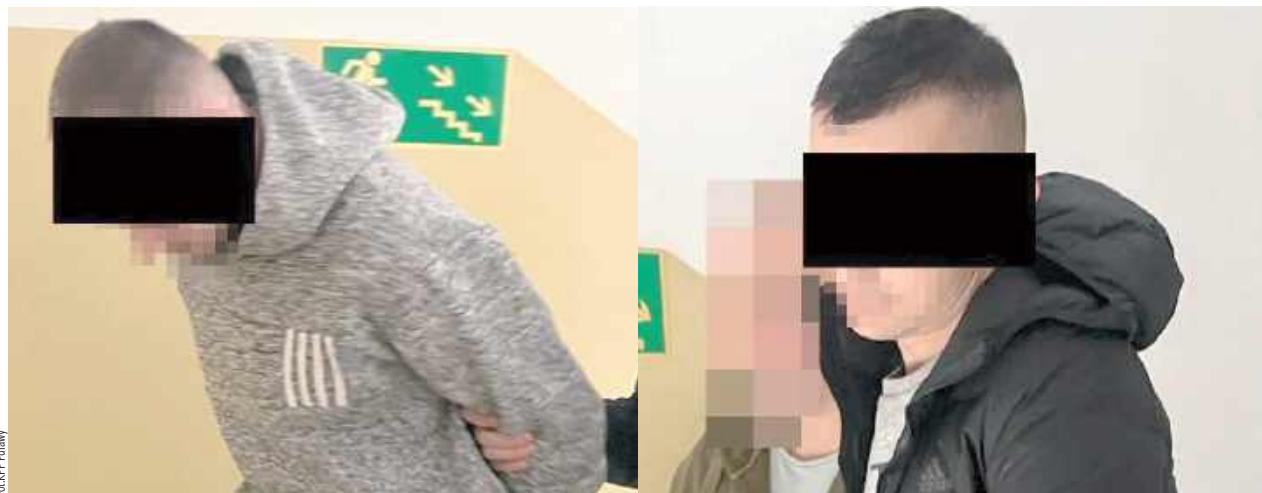
Obaj mężczyźni zostali zatrzymani. Wobec jednego sąd zastosował trzymiesięczny areszt, wobec drugiego - dozór policyjny

Krewka ekspedientka, oburzona zachowaniem „klientów” podeszła do jednego z nich, złapała za kurtkę i stanowczo poprosiła o zwrot towaru. Młodzieniec zaskoczony jej reakcją zaczął się szarpać, wskutek czego z kieszeni wypadł mu telefon. Kobieta natychmiast go