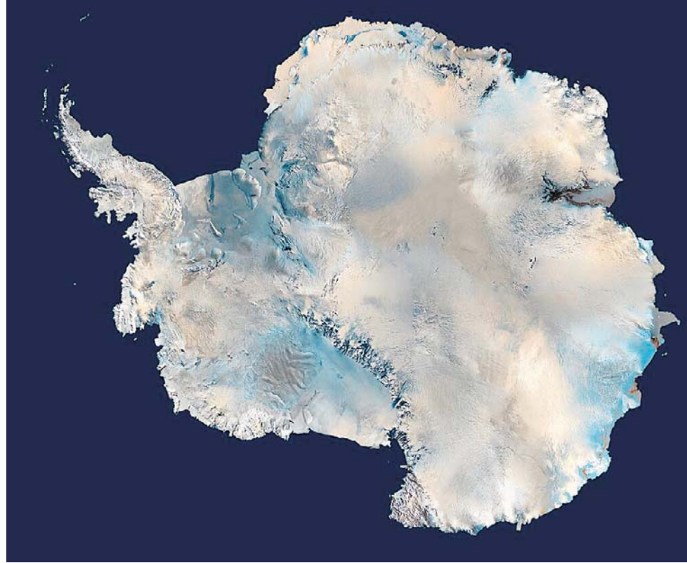
Satelitarne zdjęcie Antarktydy. Ten kontynent od dawna budzi wiele emocji ze względu na swoje geopolityczną lokalizację, a także z powodu znajdujących się na nim surowców krytycznych

Zabrania on wszelkich działań o charakterze militarnym, lecz nie wyklucza przebywania na terytorium antarktycznym pracowników wojskowych w celach badawczych. Nie rozstrzyga kwestii związanych z roszczeniami terytorialnymi, ale badania naukowe „mają być wy-