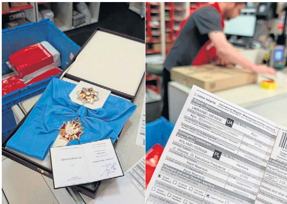
Order Orła Białego Wołodymyr Zełenski odesłał Karolowi Nawrockiemu pocztą, co też jest pewnym symbolem

o ukraińską i polską niezależność od Rosji.