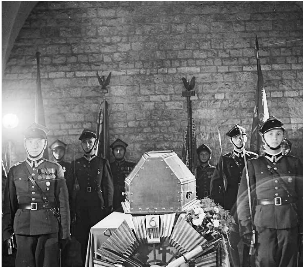
Warta u trumny marszałka Józefa Piłsudskiego w krypcie pod Wieżą Srebrnych Dzwonów na Wawelu