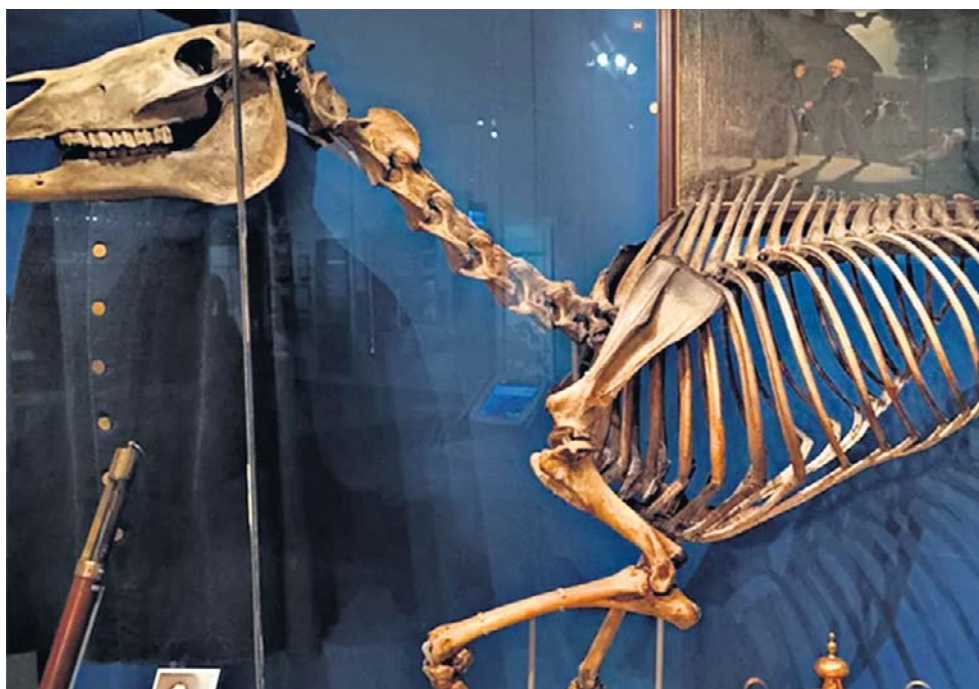
Gdy cesarz został zesłany na Świętą Helenę, jego wierzchowiec Marengo, siwy ogier arabski, trafił do Anglii jako budzące uciechę trofeum wojenne. Tam też zdechł w 1831 r.

Doczesne szczątki ukochanego konia Napoleona to jeden z cenniejszych eksponatów w National Army Museum w Londynie. Anglicy pałają dziwną fascynacją do resztek wierzchowca, który towarzyszył Cesarzowi podczas wielu bitew - to właśnie na nim Napoleon przekracza Alpy w scenie znanej z obrazu Davida. Marengo skończył swój wojenny żywot pod Waterloo, a potem dożywał w Anglii. Co ciekawe, dziś roszcza sobie doń pretensje także radni z irlandzkiej miejscowości Cork.