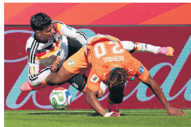
Piłkarze Niemiec zapewnili sobie zwycięstwo nad Wybrzeżem Kości Słoniowej 2:1, a trener Julian Nagelsmann powiedział, że to była zasłużona wygrana. Z kolei selekcjoner Słoni Emerse Fae stwierdził, że jest sfrustrowany porażką, której przyczyną był - według niego - brak doświadczenia. Jak jednak dodał, jest dumny z walki, jaką pokazali jego zawodnicy