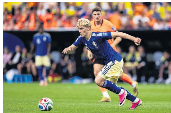
Z HOUSTON

W MUNDIALOWYM OBIEKTYWIE GRZEGORZA WAJDY. Pomarańczowi rządili w Houston - Holendrzy całkowicie zdeklasowali Szwedów, czyli pogromców naszej reprezentacji w barażach o mundial, wbijając Kristofferowi Nordfeldtowi aż pięć bramek. Do siatki trafiali po dwa razy Brian Brobbey i Cody Gakpo oraz Crysencio Summerville