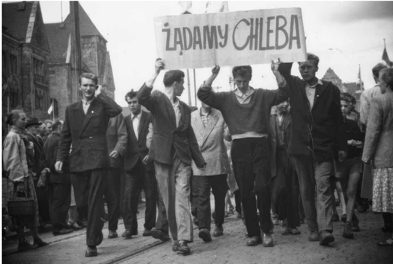
Archiwalne zdjęcie marszu robotników z transparentem „Żądamy chleba”. Ten napis stał się jednym z najbardziej rozpoznawalnych symboli Poznańskiego Czerwca 1956 roku

Dyrektor muzeum dodaje, że jeśli ktokolwiek może mieć prawa do tego hasła, to robotnicy Czerwca '56. Przypomina też, że Jacek Polewski, jeden z organi-