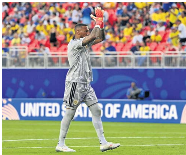
Bez wątpliwości bramkarz reprezentacji Curaçao - Eloy Room może liczyć na nowe propozycje zatrudnienia

Wróćmy jednak do wyczynów bramkarza piłkarskiej reprezentacji Curaçao - Eloya Rooma. Otóż w zremisowanym 0:0 meczu z Ekwadorem obronił aż 15