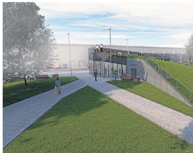
Tak ma wyglądać nowy dworzec autobusowy w Wodzisławiu Śląskim

W zakres inwestycji wchodzi m.in.: sporządzenie kompletnej dokumentacji techn-