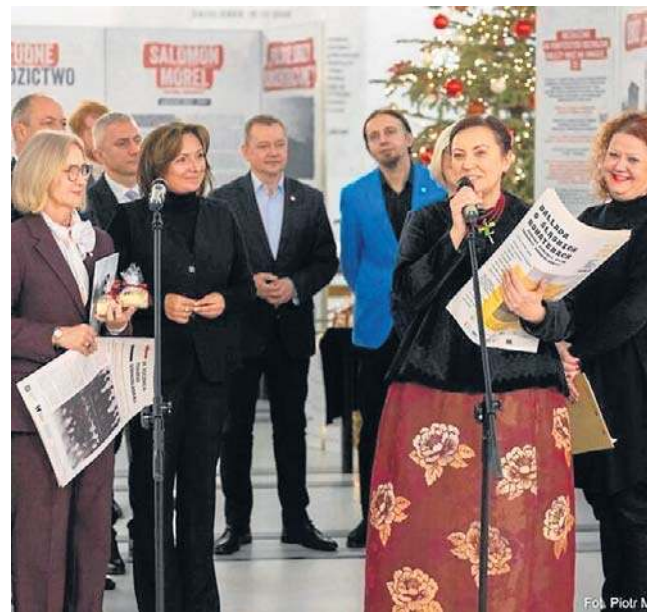
Ekspozycja w Sejmie symbolicznie kończy obchody 80. rocznicy Tragedii Górnos Śląskiej 1945 roku

Autorami wystawy są: dr Michał Spurgiasz (konceptcja, tekst, materiały źródłowe), Jacek Zygmunt (konceptcja wizualna) oraz dr Dariusz Węgrzyn (redakcja naukowa).