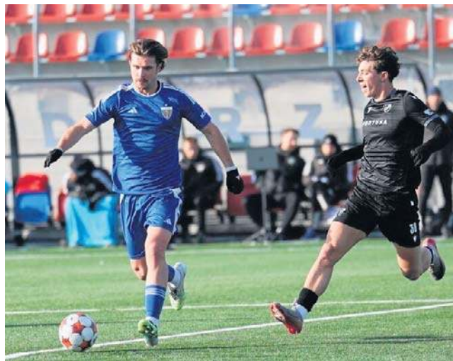
Polonia Bytom z Banikiem grała na stadionie na Piłkarskiej

(II połowa) Loska - Sacek, Olkowski, Pingot, Lukaszek - Abdullahi, Donio, Rakoczy, Zahović, Skiba - Barbosa.