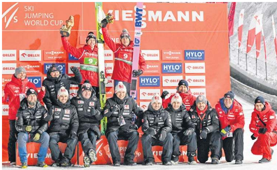
Polska ekipa skoczków narciarskich doczekała się sukcesu w Pucharze Świata

Drugi skok Kubackiego był nawet lepszy niż pierwszy i jeszcze bardziej można było mieć nadzieję na podium. Zwłaszcza że rozkręcał się Tomasiak. Po całej drugiej serii Polska była 3., z realną szansą na powalczenie z 2. Słowenią (Austria była poza zasięgiem, ostatecznie efektownie