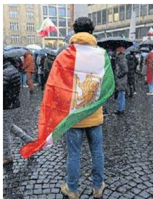
Również w Niemczech odbywają się demonstracje

Liczba ofiar trwających od 15 dni antyrządowych protestów w Iranie jest trudna do ustalenia ze względu na odcięcie przez władze dostępu do internetu. W nocy z soboty na niedzielę Agencja Informacyjna Aktywistów Praw Człowieka (HRANA), organizacja pozarządowa z siedzibą w USA, mówiła o 116 zabitych, zastrzegając jednak, że bilans ten obejmuje tylko potwierdzone zgony osób, których personalia są znane.