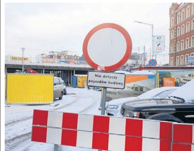
Tak wygląda przebudowywany wiadukt przy ulicy Mikołowskiej. Od 23 stycznia złączą tędy jeździć auta

W czasie posługi w Piekarach Śląskich nadzorował szeroko zakrojone prace remontowe bazyliki i jej otoczenia, w tym elewacji, wież oraz infrastruktury Kalwarii Piekarskiej. Z jego inicjatywy stanął tam również pierwszy w archidiecezji katowickiej pomnik św. Jana Pawła II. Pełnił funkcję dziekana dekanatu Piekary Śląskie, był kapelanem Jego Świątobliwości oraz członkiem kilku gremiów doradczych Archidiecezji Katowickiej. W 2018 roku przeszedł na emeryturę, pozostając postacią dobrze znaną i cenioną przez wiernych.