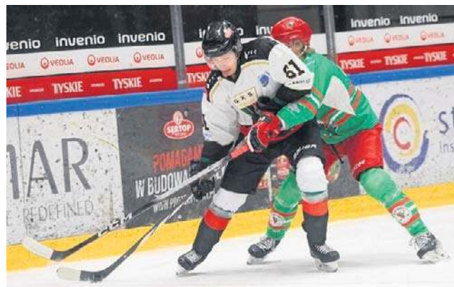
Hokeiści GKS Tychy w końcu się przełamali w meczu z ECB Zagłębie i pierwszy raz w tym sezonie ograli sosnowiczank