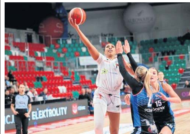
Koszykarki MB Zagłębia Sosnowiec w turnieju finałowym pokonały MUKS Poznań ale potem uległy gorzowiankom

*LKS Słęża Wrocław - AZS UMCS Lublin 75:74 (18:22, 20:19, 17:15, 20:18).