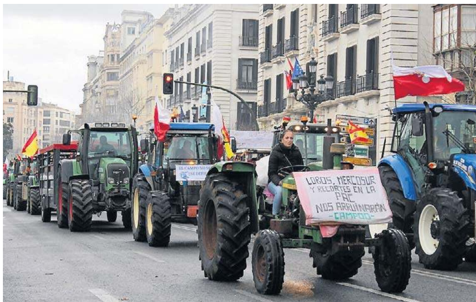
W kilku krajach europejskich, w tym w Polsce, Hiszpanii, Francji i Włoszech, miały miejsce protesty rolników przeciwko zatwierdzonej w piątek umowie

Porozumienie z Argentyną, Brazylią, Paragwajem i Urugwajem, które tworzą Mercosur, wprowadzi preferencje celne dla niektórych produktów rolnych, w tym produktów wrażliwych: wołowiny, drobiu, nabiału, cukru i etanolu. W zamian rynki tych państw otworzą się na towary przemysłowe UE, takie jak samochody, maszyny i leki.