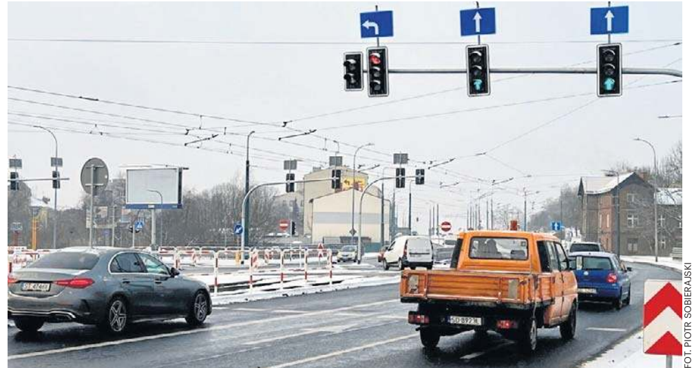
Tak dziś wygląda DW910 i nerka w Będzinie po przebudowie, kierowcy mają wiele uwag

- Najgorsze okazało się, co pokazują gigantyczne korki, w których stoją też autobusy komunikacji miejskiej, zwężenie wjazdów na nerkę od strony targowiska i Łagiszy oraz od strony stadionu. To kompletnie niezrozumiałe, że tak można to zaprojektować. Równie kuriozalny jest brak pasa wyjazdowego z ul. Piastowskiej, z Osiedla Zamkowego, w stronę nerki. Wszystko się korkuje, a ta wysepka na środku Czeladzkiej, blokująca wyjazd, to już wisienka