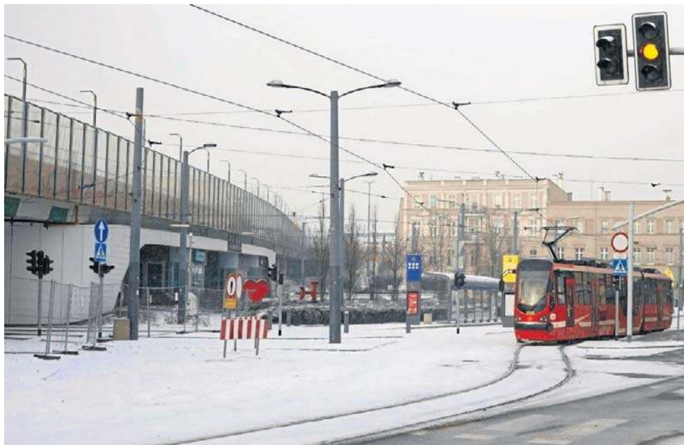
Po siedmiu miesiącach od zamknięcia estakady samorządowa spółka zaczęła szukać własnych rozwiązań. Pojawiła się koncepcja budowy tymczasowego mostu w Chorzowie

- Analizujemy różne scenariusze, w tym te dotyczące wybudowania tymczasowego obiektu, oczywiście po uzgodnieniach z koleją i miastem. To być może będzie takie rozwią-