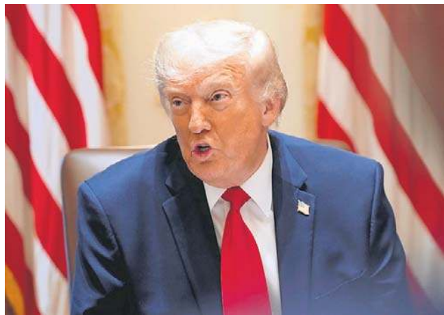
Prezydent Trump wzywa do obniżki cen paliw w USA do około 2,50 dolara za galon

Przed rozpoczęciem przez USA i Izrael wojny z Iranem, pod koniec lutego br., za benzynę płacono w Stanach Zjednoczonych średnio mniej niż 3 dolary za jeden galon. PAP