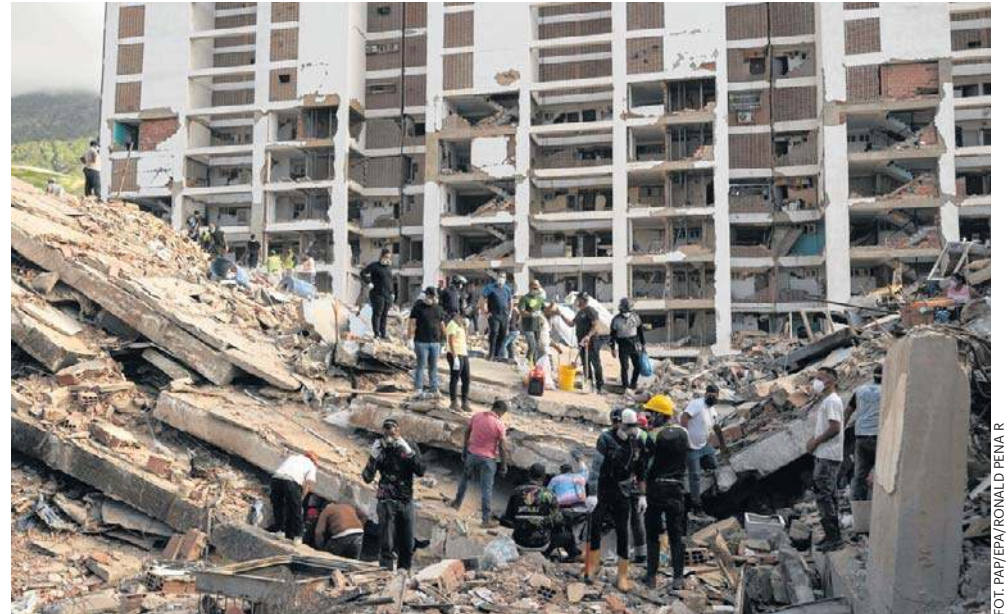
Krajowe i międzynarodowe zespoły ratownicze kontynuują swoje działania wśród ruin budynków w nadmorskim stanie La Guaira, na północ od Caracas

Prezydent Salwadoru Nayib Bukele ogłosił w nocy z poniedziałku na wtorek, że ratownicy z jego kraju zlokalizowali uwięzionego w zawalonym budynku 44-latka, nawiązali z nim kontakt i podali mu wodę. Dodał, że ratownicy starają się wy dostać go na powierzchnię.