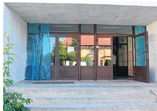
Remont budynku szkoły pochłonie 8,3 mln zł, natomiast dotacja wynosi 7 mln.

- On jest ważny w kontekście kosztów funkcjonowania