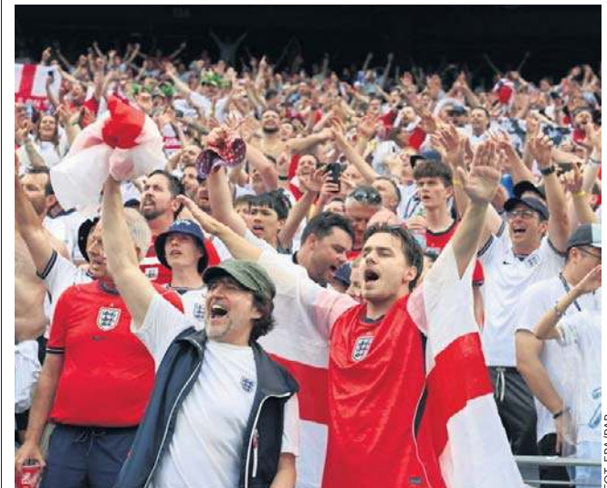
Kibice „Trzech Lwów” wierzą, że reprezentacja Anglii w końcu powtórzy wielki sukces sprzed 60 lat

USA - Bośnia i Hercegowina (San Francisco, godzina 2.00, TVP 2, TVP Sport).