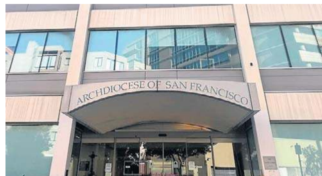
Archidiecezja San Francisco ogłosiła ugodę

Ugoda, zawarta trzy lata po ogłoszeniu przez archidiecezję San Francisco upadłości, obejmie 530 osób, które w dzieciństwie zostały wykorzystane seksualnie przez duchownych. To najnowsze porozumienie zawarte w sprawie roszczeń wysuwanych przez ofiary wobec Kościoła katolickiego - przekazał we wtorek dziennik „Guardian”. W 2024 roku archidiecezja Los Angeles zgodziła się na rekordową ugodę w wysokości 880 mln dolarów.