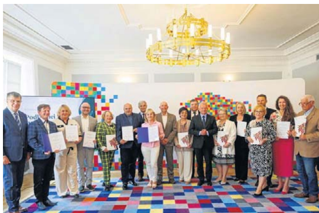
Uroczystość wręczenia aktów powołania członkom rady

- Ta rada, do której w specjalnej procedurze wybrano 15 przedstawicieli z całego regionu, ma dużą rolę do spełnienia. Między innymi opiniuje wszelkiego