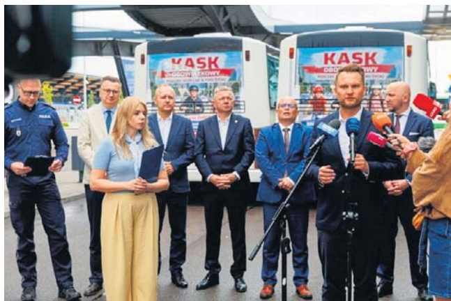
Wczorajsza konferencja na temat wchodzących od dziś w życie przepisów odbyła się na dworcu PKS Białystok

Skalę zagrożenia, jakie niesie jazda bez kasku, pokazał wypadek z 9 kwietnia br. w Suwałkach. 35-letni mężczyzna poruszał się hulajnogą elektryczną ciągiem pieszo-rowerowym przy ulicy Wojska Polskiego, w rejonie strefy ekonomicznej. Z nieustalonych przyczyn stracił panowanie nad pojazdem, przewrócił się i doznał poważnych obrażeń ciała. Mimo ponad godzinnej reanimacji prowadzonej przez służby ratunkowe mężczyźni nie udało się uratować. W miniony piątek doszło z kolei do zdarzenia z udziałem hulajnogę elektrycznej w Łomży - 16-letni chłopiec przewrócił się podczas jazdy i został zabrany na badania.