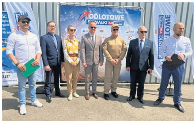
Organizatorzy zaprezentowali program Odlotowych Suwałk

Odlotowe Suwałki z roku na rok cieszą się większym zainteresowaniem. W zeszłym roku sprzedaliśmy 20 tys. biletów. Patronat honorowy nad imprezą objął wicepremier i minister obrony narodowej