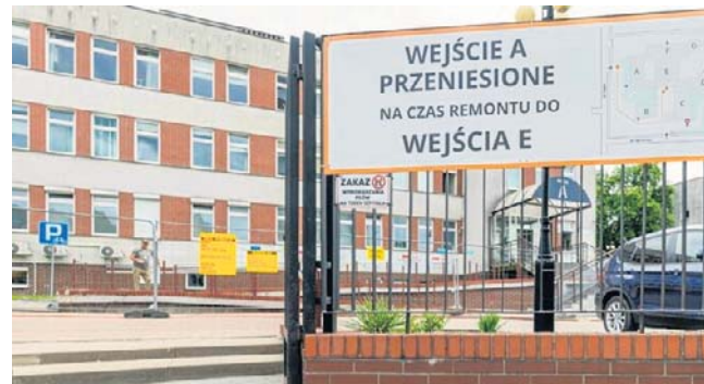
Rozpoczęła się modernizacja szpitala MSWiA

Projekt potrwa do 3 września 2027 r. Już zamknięte zostało wejście „A” od strony ulicy Ciepłej w związku z pracami przy przebudowie wejścia głównego i modernizacji holu budynku „A”. Do Działu Obsługi Pacjenta, po-