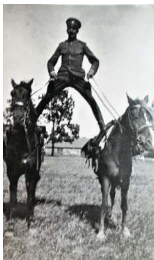
Na koniach wierzchowych rosyjski oficer. Susk Stary, przed 1914 r.