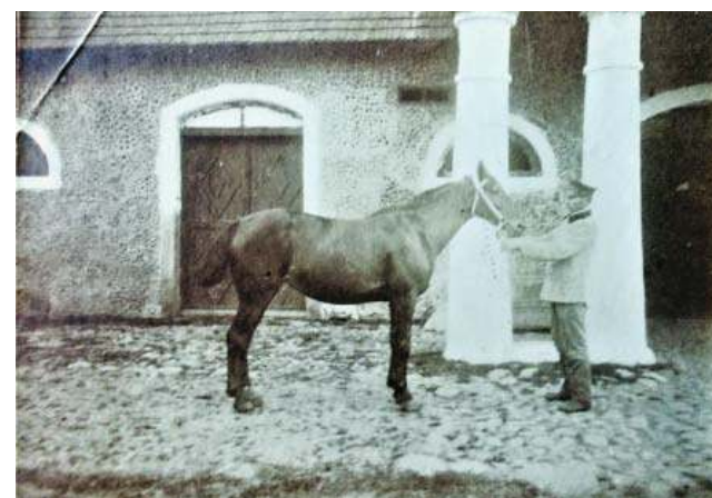
Stajnia dworska w Susku Starym, 1898 r.