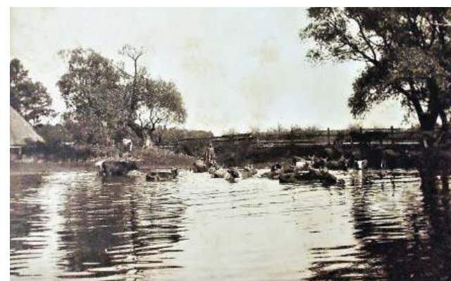
Kąpiel po powrocie krów z pastwiska. Susk Stary, 1910 r.

Latem 1914 r. 21-letnia absolwentka studiów agronomii na Uniwersytecie Jagiellońskim wraz z braćmi pomaga ojcu w zarządzaniu majątkiem i tam zastaje ich