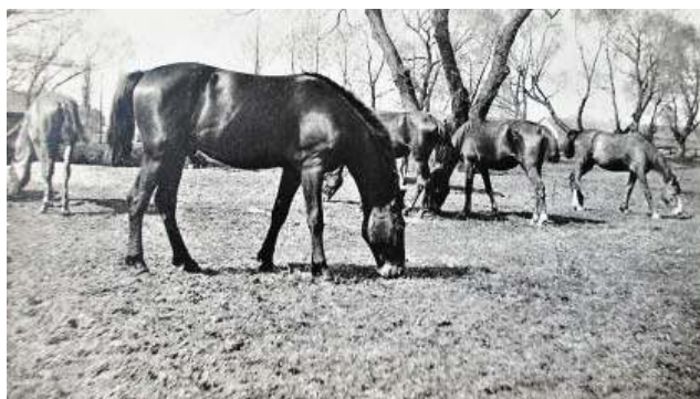
Konie dla armii na pastwisku w Susku Starym, 1903 r.