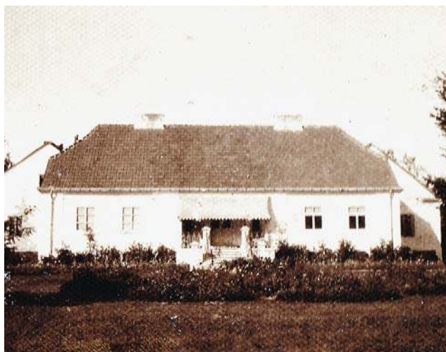
Dwór w Susku Starym, 1909 r.