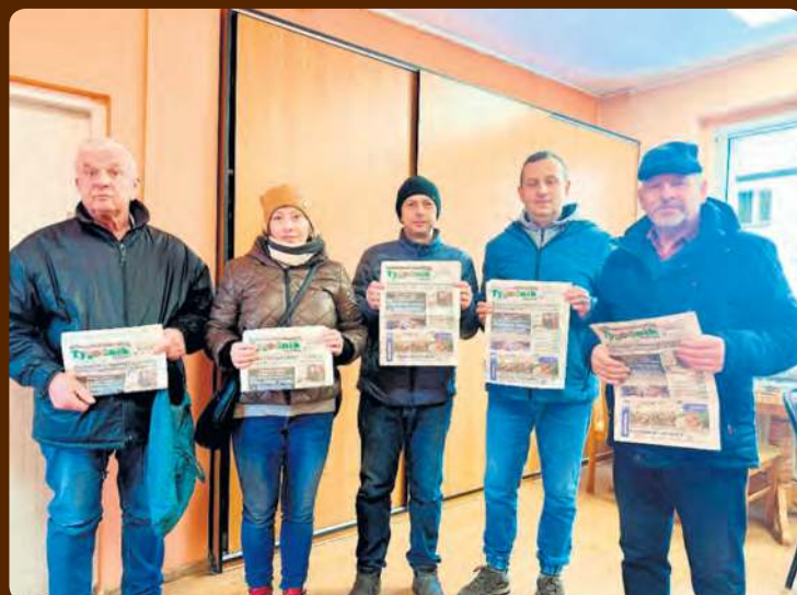
W czwartek przed godz. 9:00 ustawiła się z gazetami kolejka naszych czytelników.