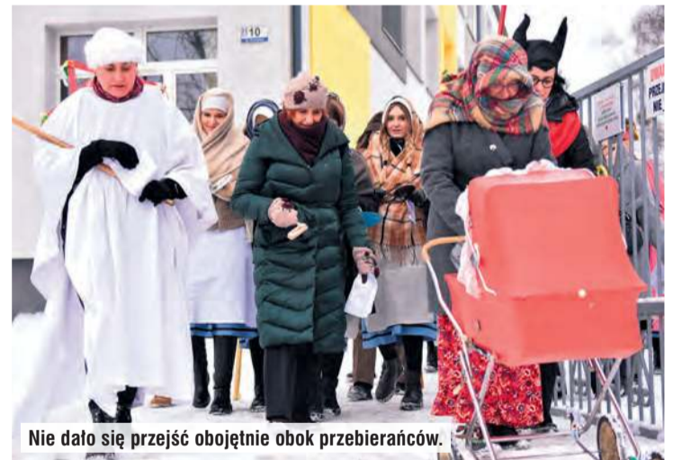
Nie dało się przejść obojętnie obok przebierańców.