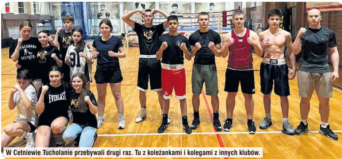
W Cetniewie Tucholanie przebywali drugi raz. Tu z koleżankami i kolegami z innych klubów.