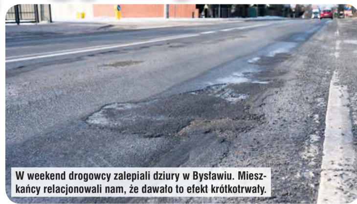
W weekend drogowcy zalepiali dziury w Bysławiu. Mieszkańcy relacjonowali nam, że dawało to efekt krótkotrwały.