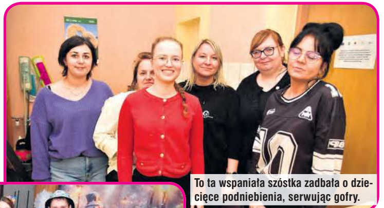
To ta wspaniała szóstka zadbała o dziecięce podniebienia, serwując gofry.