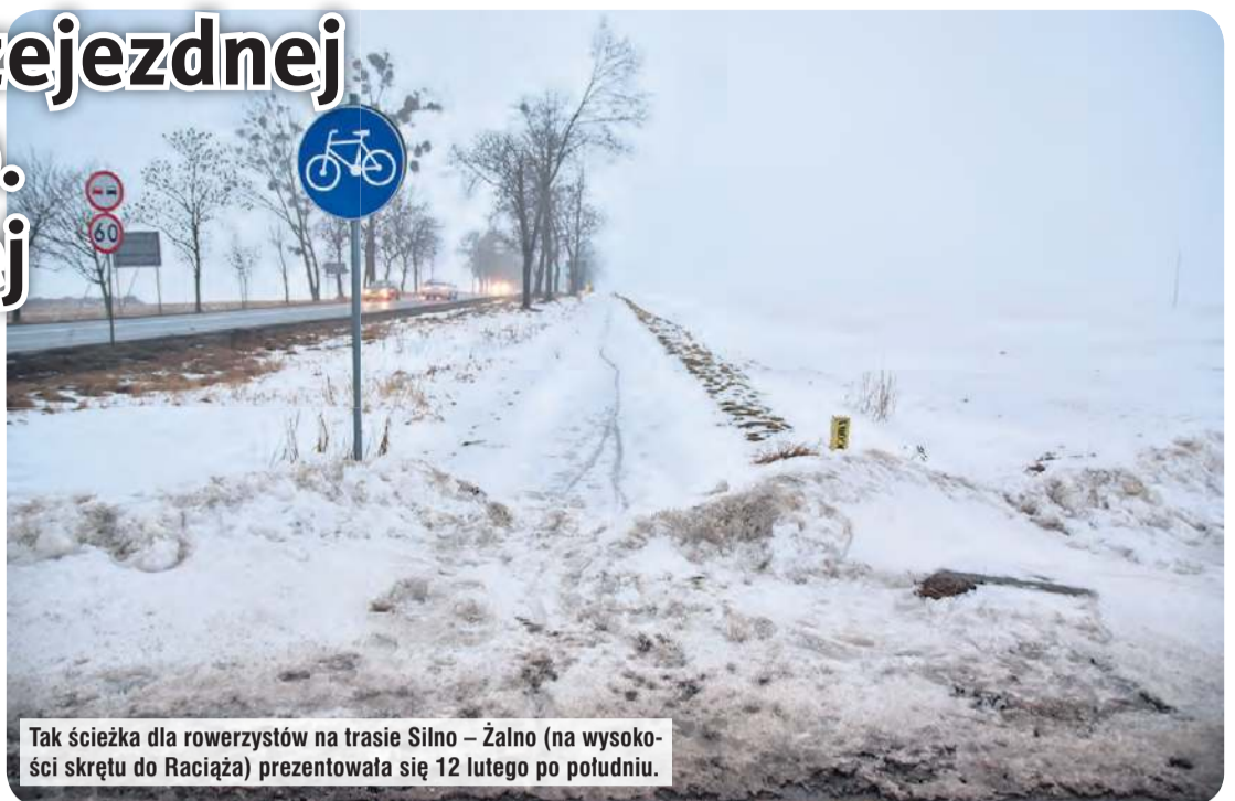
Tak ścieżka dla rowerzystów na trasie Silno – Żalno (na wysokości skrzyżowania do Raciąża) prezentowała się 12 lutego po południu.

– W ostatnim kwartale ubiegłego roku, jeszcze przed pierwszymi opadami śniegu, Zarząd Dróg Wojewódzkich w Bydgoszczy otrzymał od nas dokumenty związane z przekazaniem tej ścieżki w związku z zakończeniem trwałości projektu. Przez ostatnich pięć lat zajmowaliśmy się jej utrzymaniem. W odpowiedzi ZDW zasłonił się warunkami pogodowymi, czego nie rozumiem. Jak warunki atmosferyczne mogą przeszkadzać w odbiorze własnego składnika majątko-