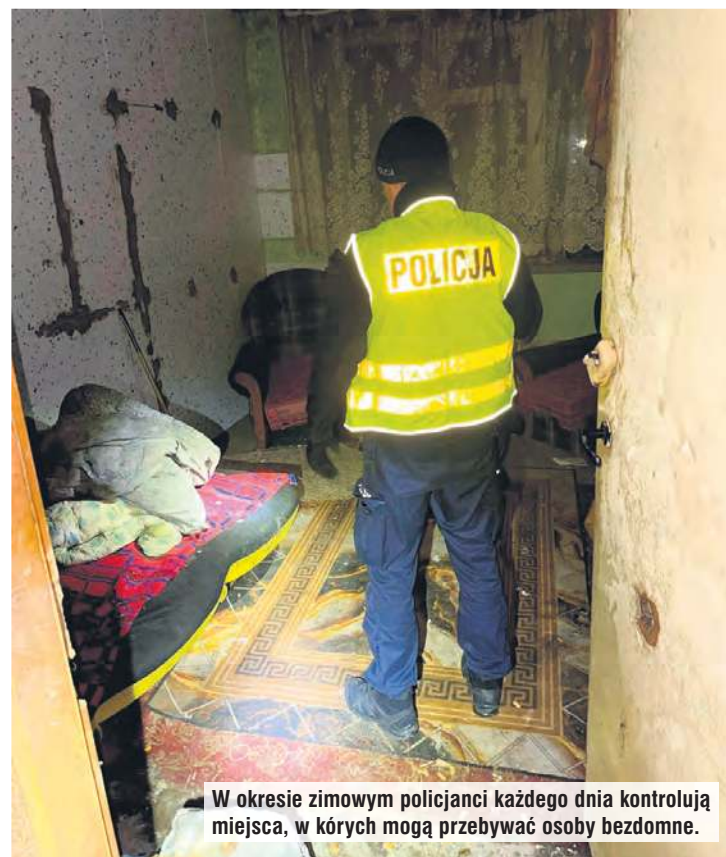
W okresie zimowym policjanci każdego dnia kontrolują miejsca, w których mogą przebywać osoby bezdomne.

– Przybyli na miejsce ratownicy stwierdzili, że temperatura ciała 36-latek wynosi około 34 stopni Celsjusza, co oznacza stan wychłodzenia organizmu i konieczność hospitalizacji – do-