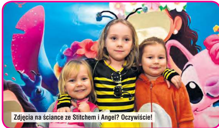
Zdjęcia na ścianie ze Stitchem i Angel? Oczywiście!