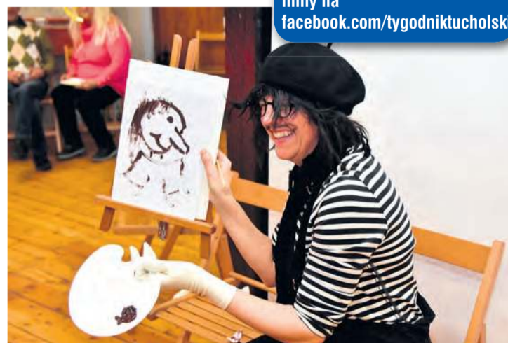
Francuska sztuka uliczna.

Jak na bal przystało, w jego trakcie można było skosztować