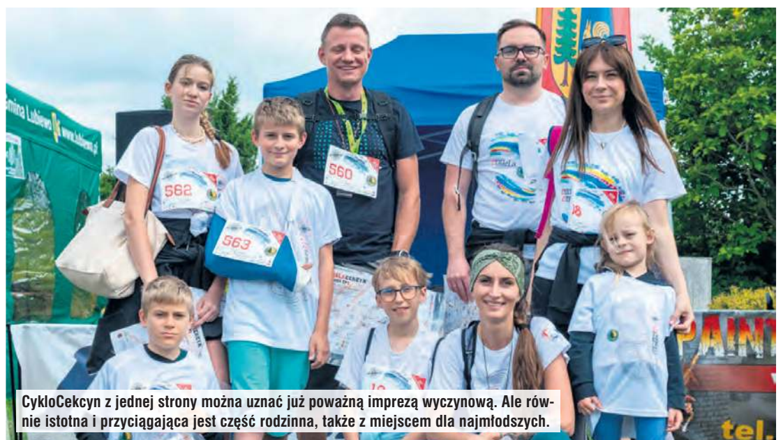
CykloCekcyn z jednej strony można uznać już poważną imprezą wyczynową. Ale równie istotna i przyciągająca jest część rodzinna, także z miejscem dla najmłodszych.