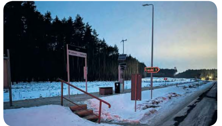
Powodem braku oświetlenia jest... mróz.

zainteresowanie problemem wynika również z tego, że stacja w Laskach Tucholskich została zmodernizowana, dlatego zdziwił się brakiem świecących lamp.