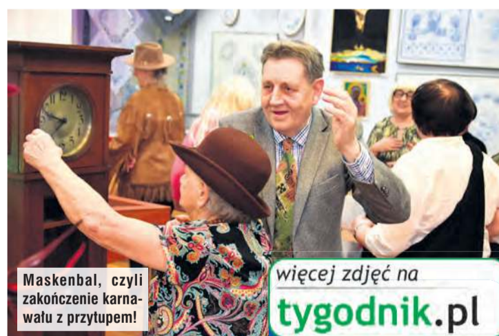
Maskenbal, czyli zakończenie karnawału z przytupem!