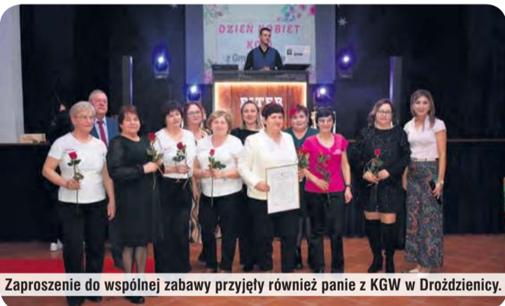
Zaproszenie do wspólnej zabawy przyjęły również panie z KGW w Drożdzienicy.