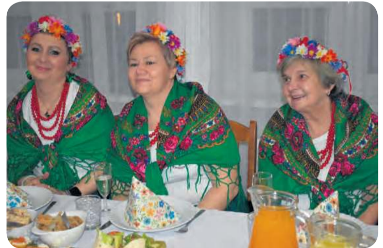
Reprezentacja KGW w Wieszczytach w swoich pięknych strojach.

W trakcie sobotniej imprezy na ręce pań trafiły symboliczne