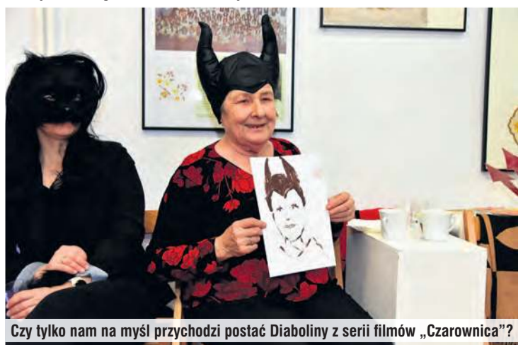
Czy tylko nam na myśl przychodzi postać Diaboliny z serii filmów „Czarownica”?