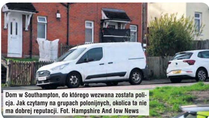
Dom w Southampton, do którego wezwana została policja. Jak czytamy na grupach polonijnych, okolica ta nie ma dobrej reputacji.

Informacja oparta na reprezentatywnym przykładzie: całkowita kwota kredytu 25 000,00 zł, okres kredytowania 36 miesięcy, raty równe kapitałowo-odsetkowe w wysokości 769,17 zł, roczne zmienne oprocentowanie nominalne 6,99% (stanowi sumę wartości WIBOR 6M, który obecnie stanowi 3,81% i marży Banku w wysokości 3,18 p.p.) kwota odsetek za cały okres kredytowania 2 689,95 zł, prowizja za udzielenie kredytu 0,00% całkowitej kwoty kredytu. Przy przyjęciu wyżej wymienionych parametrów RRSO wynosi 7,21%, całkowita kwota do zapłaty, stanowiąca sumę całkowitej kwoty kredytu oraz całkowitego kosztu kredytu wynosi 27 689,95 zł. Ostateczne warunki kredytowania uzależnione są od wyniku oceny wiarygodności i zdolności kredytowej Klienta, daty wypłaty kredytu oraz terminu regulowania zobowiązania kredytowego. Przykład sporządzony na datę 2.02.2026 r.