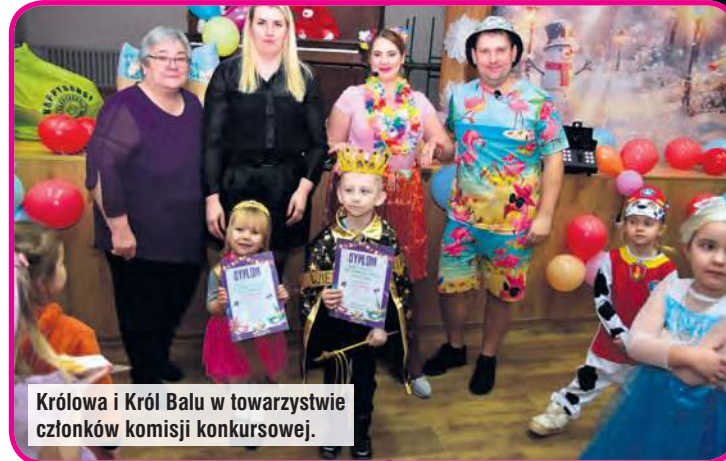
Królowa i Król Balu w towarzystwie członków komisji konkursowej.