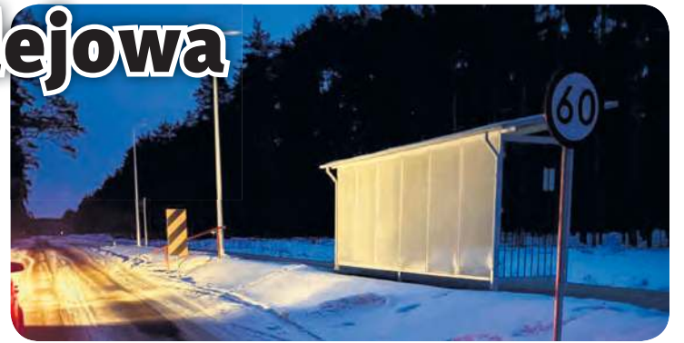
Przystanek Laski Tucholskie został wyremontowany we wrześniu 2024 r. W grudniu tego samego roku zbudowano oświetlenie peronu. Fot. nadesłane