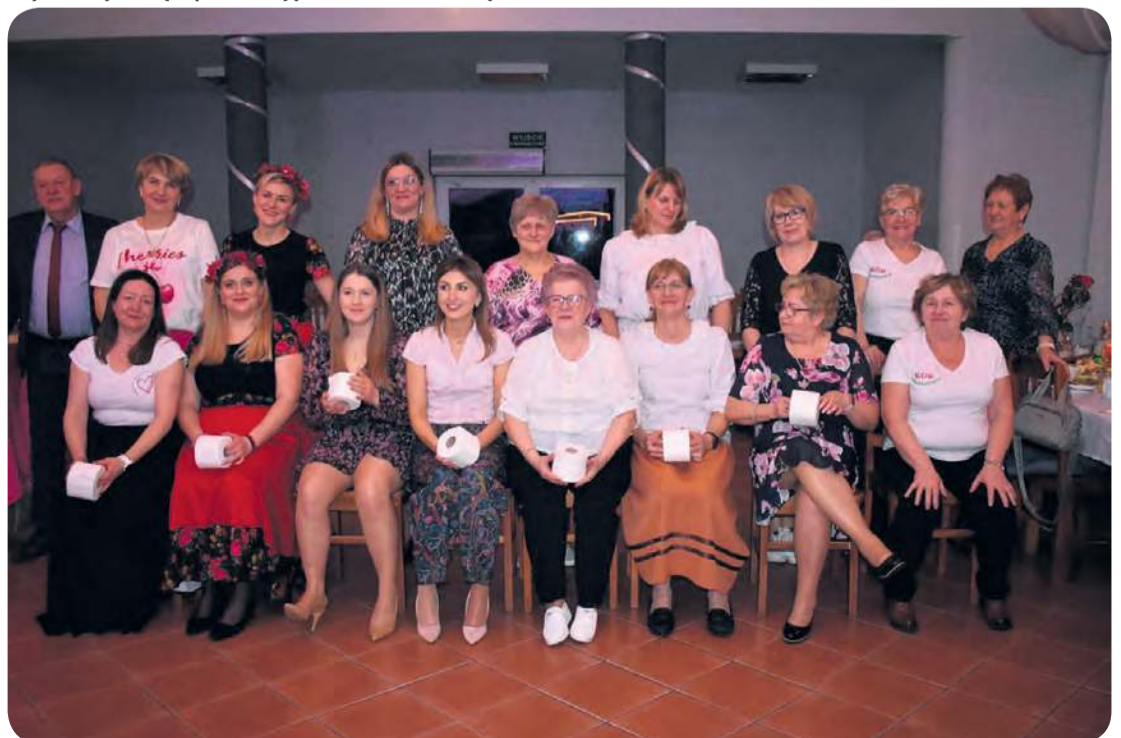
W ramach sobotniego wydarzenia przeprowadzono bardzo różnorodny konkursy i zabawy, które służyły integracji.