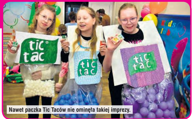
Nawet paczka Tic Taców nie ominęła takiej imprezy.

Organizatorzy wydarzenia zapewnili słodki poczęstu-