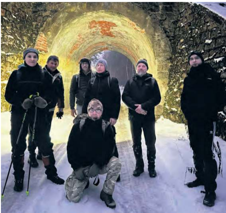
Najbliższa lekcja o historii i naturze z serca Borów Tucholskich odbędzie się już 21 lutego (sobota).