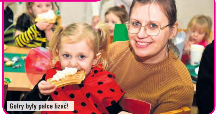
Gofry były palce lizać!