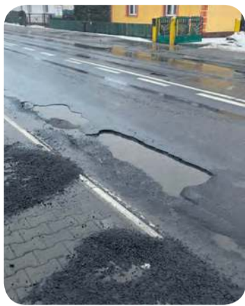
Niebezpieczne dziury na drodze wojewódzkiej w Bysławiu w piątek 13 lutego. Doszło tu do serii uszkodzeń opon i kół.

– W sobotę (14 lutego) wykonywane były tymczasowe naprawy masą na zimno. Możemy stosować tę mieszankę przy minusowych temperaturach przy głębszych ubytkach. Zaplanowany jest też solidny remont cząstkowy wczesną wiosną z użyciem standardowej