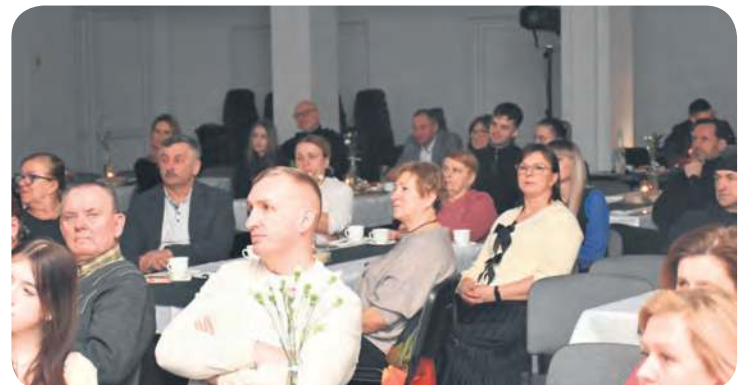
Niedzielny koncert zgromadził niemałą widownię.