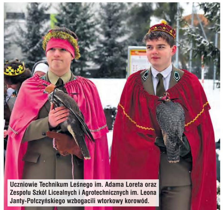
Uczniowie Technikum Leśnego im. Adama Loreta oraz Zespołu Szkół Licealnych i Agrotechnicznych im. Leona Janty-Polczyńskiego wzbogacili wtorkowy korowód.

więcej zdjęć na tygodnik.pl filmy na facebook.com/tygodniktucholski