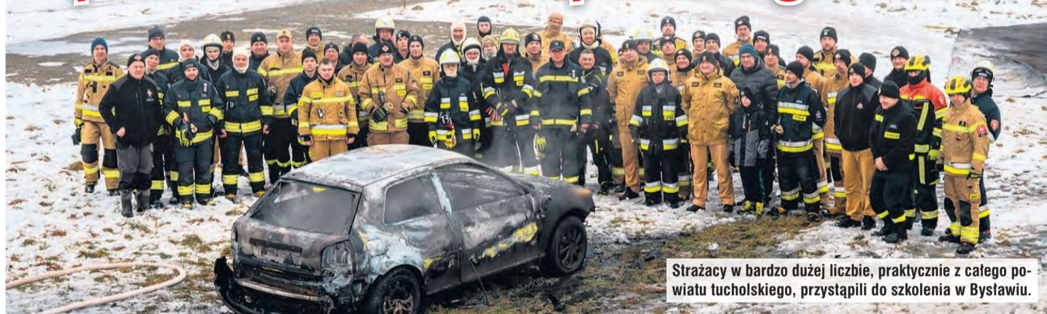
Strażacy w bardzo dużej liczbie, praktycznie z całego powiatu tucholskiego, przystąpili do szkolenia w Bysławiu.

Do gaszenia pożarów samochodów, także elektrycznych, co jest zadaniem wyjątkowo wymagającym. Do akcji przy pożarach wszelkich urządzeń z akumulatorami i bateriami. Niepozornie wyglądająca, ale za to mająca określone właściwości płachta gaśnicza to sprzęt warty uwagi. Z jej korzystania szkolili się strażacy z powiatu tucholskiego.