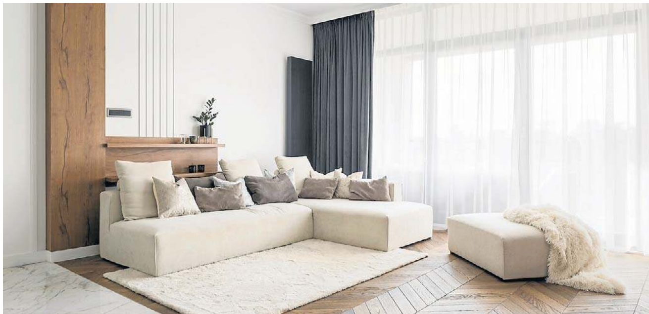
Odcienie bieli są nie tylko modne, ale także ponadczasowe.

Jedną z największych zalet bieli jest jej zdolność do optycznego powiększania przestrzeni. W niewielkich mieszkaniach lub pomieszczeniach z ograniczonym dostępem do światła