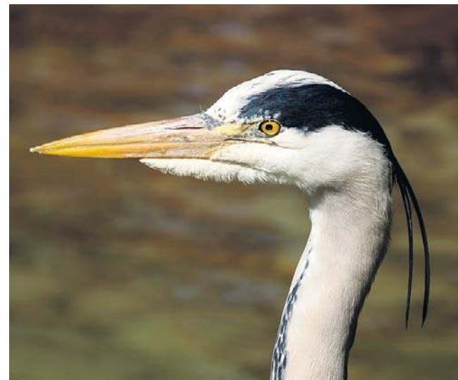
Czaple to rodzina ptaków z rzędu pelikanowych. Najpopularniejsze z nich to czaple siwe ( Ardea cinerea )