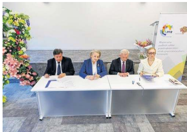
W środę w Białostockim Centrum Onkologii podpisano umowę dotyczącą udzielenia 17,6 mln zł pożyczki

Oferowane przez PFR wsparcie ma preferencyjne warunki.