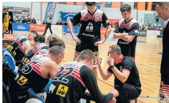
Drużyna Tura Basket Bielsk Podlaski jest wiceliderem drugiej ligi

Walczący o utrzymanie koszykarze Młodych Żubrów Białystok przegrali u siebie z Księżakiem Łowicz 58:89.