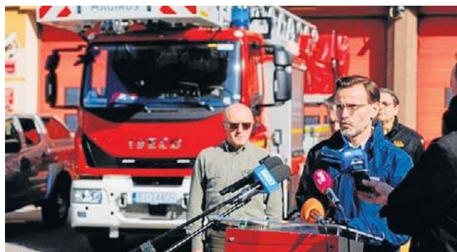
Z apelem zwrócili się wczoraj przedstawiciele władz i służb

- Przekonujemy i apelujemy, żebyśmy po prostu byli mądrzy przed, a nie po szkodzie i odpowiedzialni przede wszystkim za przyrodę, ale także za życie i zdrowie ludzi; odpowiedzialni za zwierzęta, ale także nasze mienie i nasz dobytek, który czę-