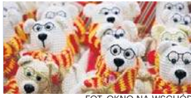
FOT. OKNO NA WSCHOD

Akcja Białostok – tu czytamy. Wolontariusze wydziergali misie, które trafią do Białostoczan str. 2