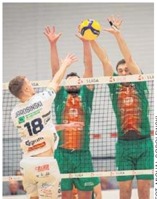
Siatkarze Necka Augustów przegrali z BBTS Bielsko-Biała 1:3

Aby myśleć o utrzymaniu potrzebna jest wygrana za trzy punkty. Spotkanie będzie transmitowane na żywo na kanale Polsat Sport Fight, ale doping potrzebny jest w hali. Na komplect kibiców mocno liczą sami