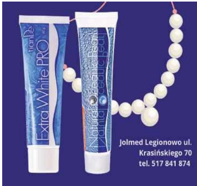
Jolmed Legionowo ul. Krasińskiego 70 tel. 517 841 874

Pierwszaznich - diwodorofosforan wapnia (Dicalcium Phosphate Dihydrate) - podobny do szkliwa zębów składnik o silnych właściwościach czyszczących i plastycznej strukturze cząsteczek, które delikatnie czyszczą szkliwo. Jest źródłem wapnia i fosforu, będących podstawowymi składnikami szkliwa zębów. Dzięki diwodorofosforanowi wapnia przebiega proces remineralizacji - uzupełnienia brakujących minerałów w szkliwie