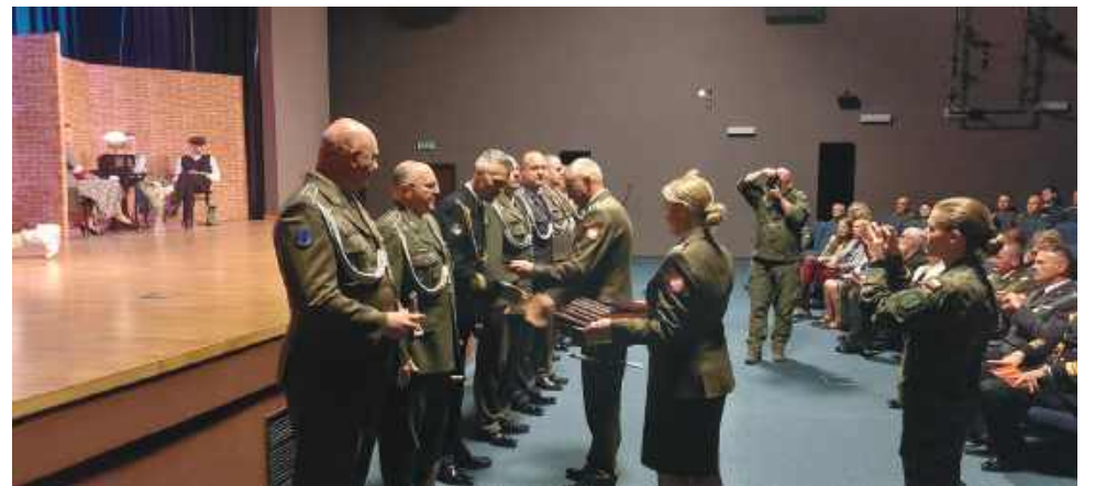
Odnaczenia, awanse i wyróżnienia