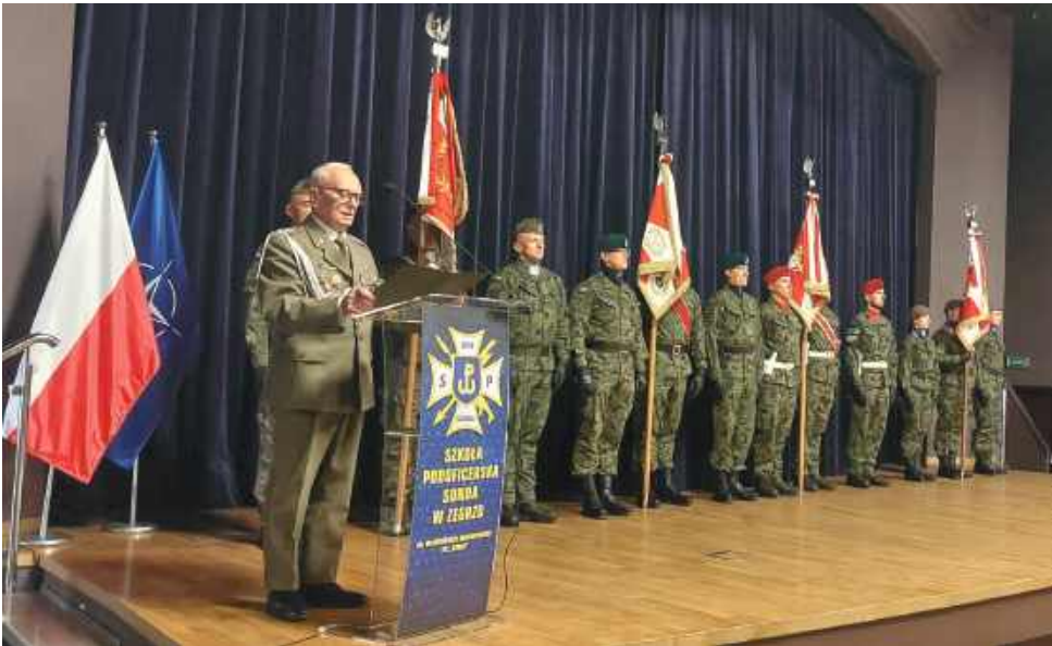
Przemawia przedstawiciel Związku Oficerów Rezerwy RP