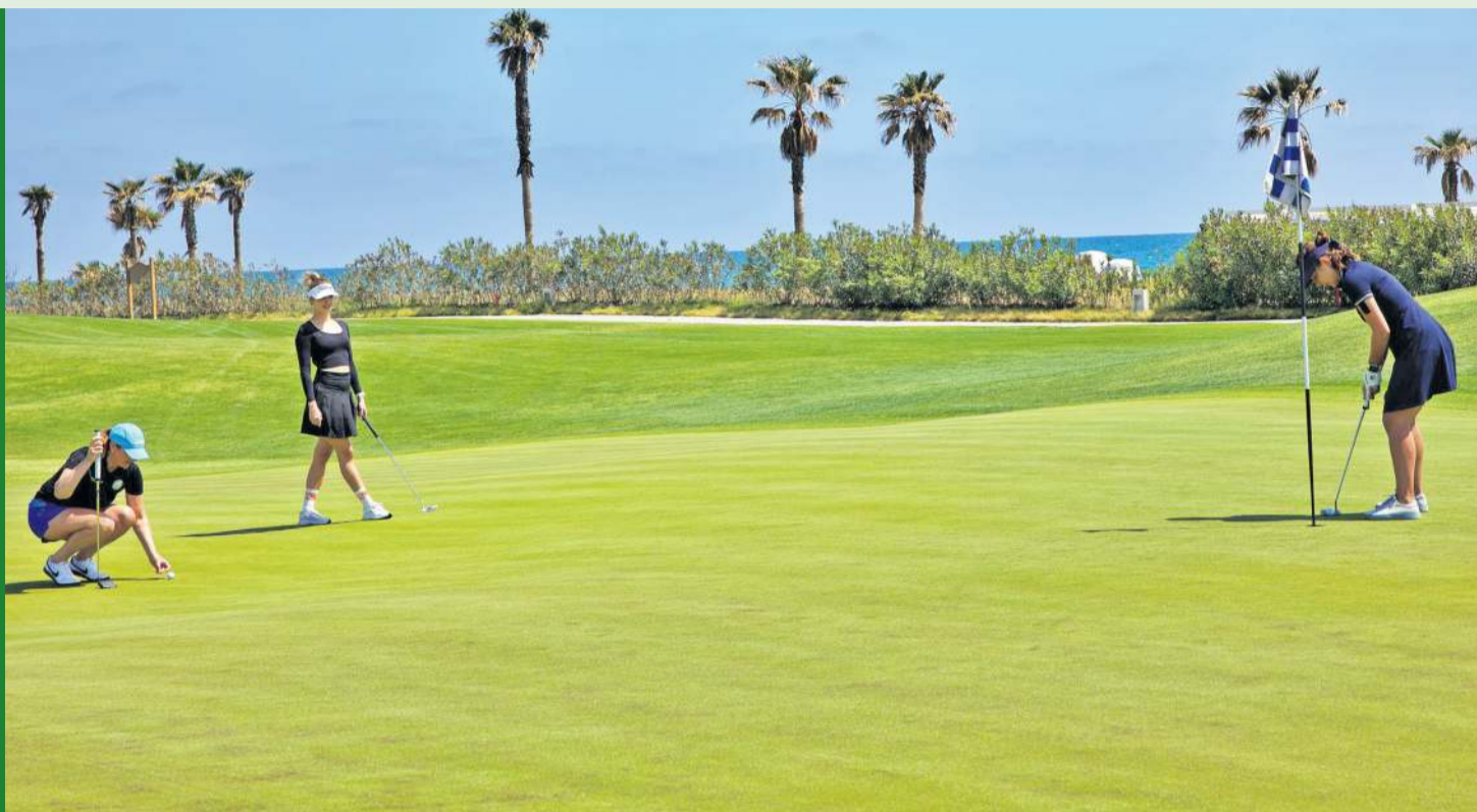
Rywalizacja w tureckim Belek w Cullinan Links Golf Club.

Formuła cyklu jest prosta. W trakcie sezonu rozgrywane są turnieje eliminacyjne na polach golfowych od Śląska po Pomorze. Każdy amator posiadający aktualny handicap może wziąć udział w zmaganiach i powalczyć o awans do finału. Zwycięzcy finału, który w tym roku odbędzie się 21 sierpnia w Sierra Golf Resort, reprezentować będą Polskę w międzynarodowym finale The Amateur