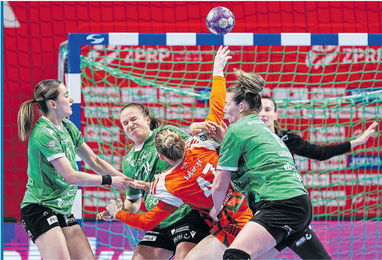
Takich, a nawet ostrzejszych starć w piątkowy wieczór w Lubinie na pewno nie zabraknie.