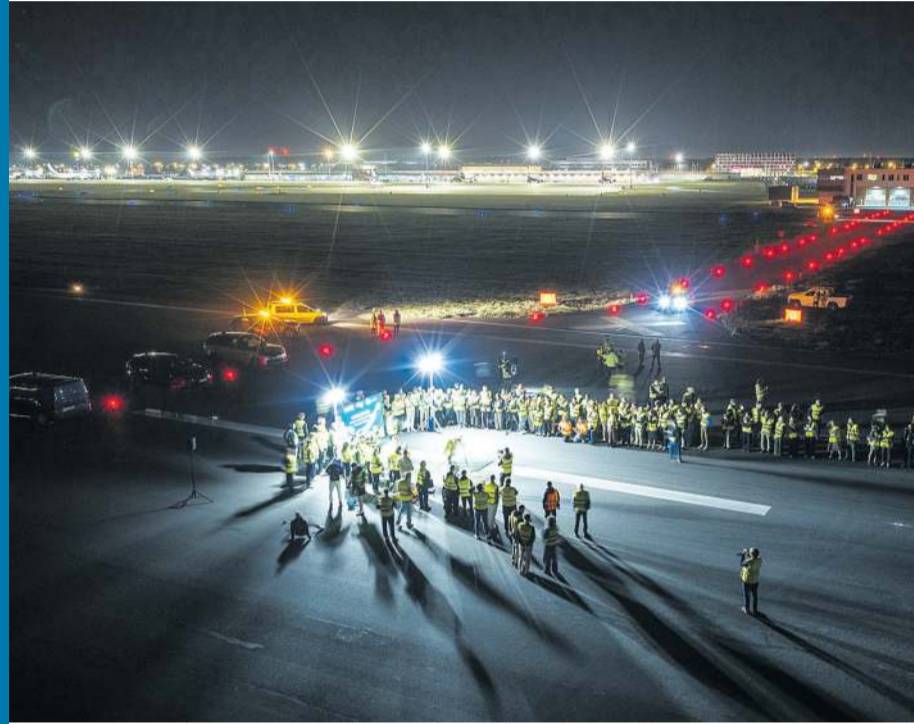
Pas startowy w Poznaniu był świadkiem niecodziennych wydarzeń.

Organizacja wydarzenia w strefie zastrzeżonej