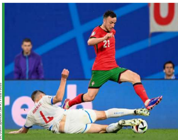
Diogo Jota rozegrał dla Portugalczyków 49 spotkań.