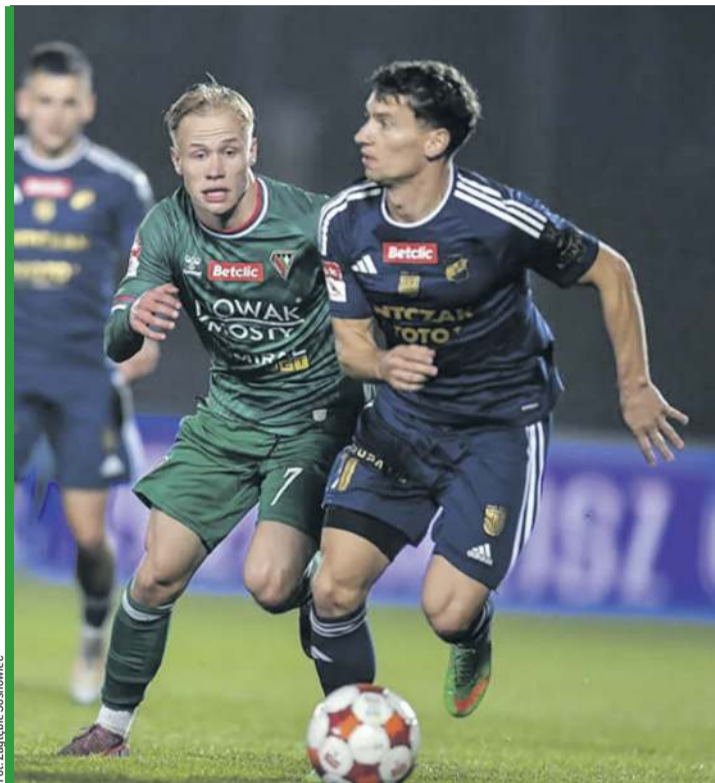
Jesienią w Kaliszu oba zespoły pogodził remis, który dziś nikogo nie urządzi.