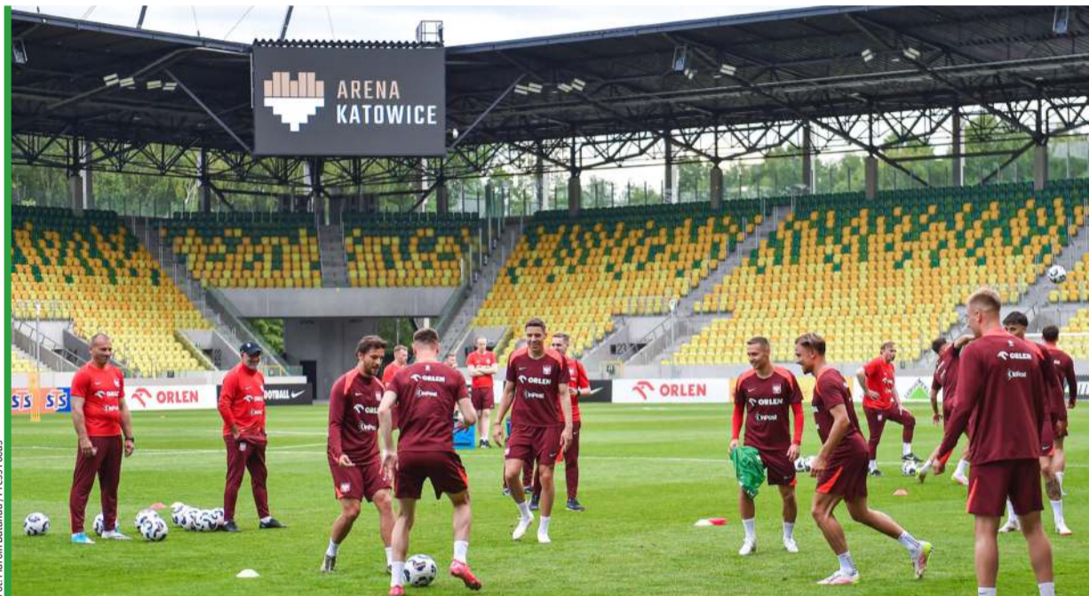
Arena Katowice gościła już trenujących tu reprezentantów Polski. Czy doczeka się teraz meczów Ligi Konferencji z udziałem swych katowickich gospodarzy?

Do owej fazy ligowej droga na razie daleka i kręta, a termin jej inauguracji – pozornie odległy. Katowiczanie – o ile oczywiście w sobotę utrzymają piąte miejsce w tabeli – wygrać musieliby trzy dwumecze (23 i 30 lipca, 6 i 13 sierpnia, 20 i 27 sierpnia), by zameldować się na tym wymarzonym etapie rozgrywek. Jego rozpoczęcie UEFA zaplanowała na 15 października (kolejne terminy to 22 października, 5 i 26 listopada oraz 10 i 17 grudnia). I tu już poprzeczka idzie (ciut) w górę, jeśli