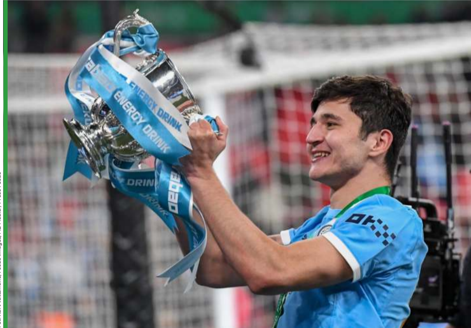
W tym sezonie Chusanow wywalczył z Manchesterem City Puchar Ligi (na zdjęciu) i Puchar Anglii, ale przegrał wyścig o mistrzostwo.

Zmarginalizowany w akademii Bunyodkoru Taszkent przeszedł próbę charakteru i morderczych treningów w Energietyku Mińsk i ruszył na podbój Zachodniej Europy. W 2023 roku Lens kupiło go za „śmieszne” 100 tys. euro, a półtora roku później skasowało za niego 40 mln w tej samej walucie od Manchesteru City. - Nawet w najtrudniejszych czasach nigdy nie myślałem o rezygnacji z futbolu. Prawdziwych trudności