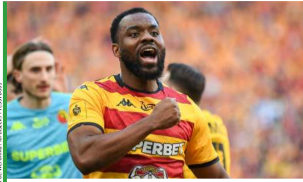
Afrykański napastnik napisał na Podlasiu piękną kartę. Co czeka go dalej?

Nie wiadomo, jaką podwyżkę proponowali mu białostoccy działacze. Pewnym natomiast jest, że jak na swoją pozycję, jak na pozycję Jagiellonii w lidze i jak na lukratywne kontrakty najlepszych piłkarzy ekstraklasy – do tej pory rewelacyjnych pieniędzy nie zarabiał. Różne źródła podają, że mogło to być od 70 do około 100