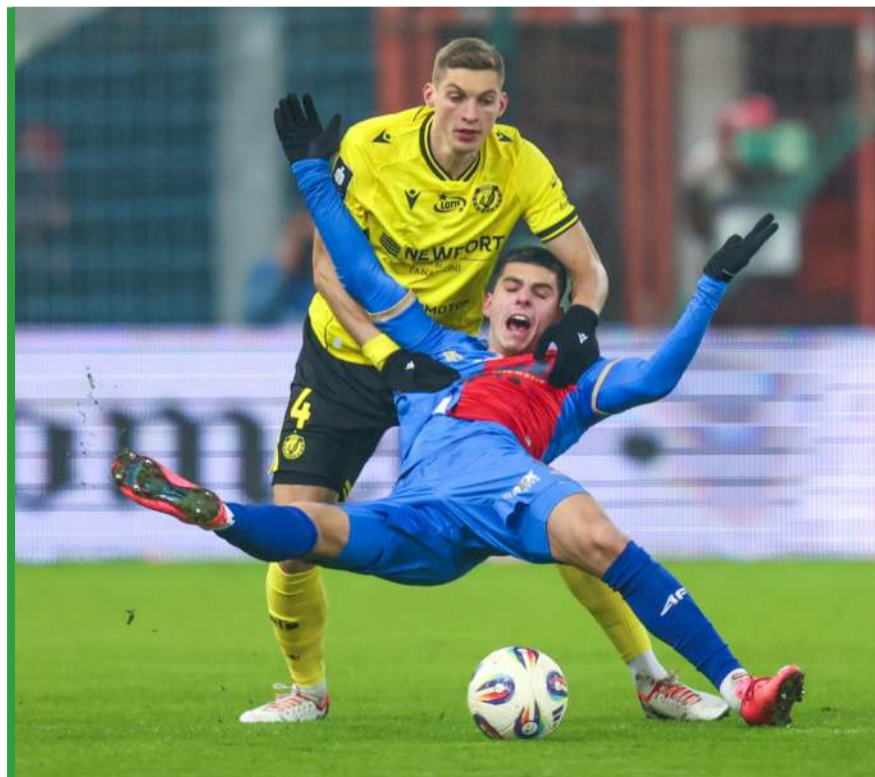
Ostatni mecz Piasta z Widzewem zakończył się zwycięstwem Łodzian 2:0. Walki nie brakowało i w sobotę zapewne też tak będzie.